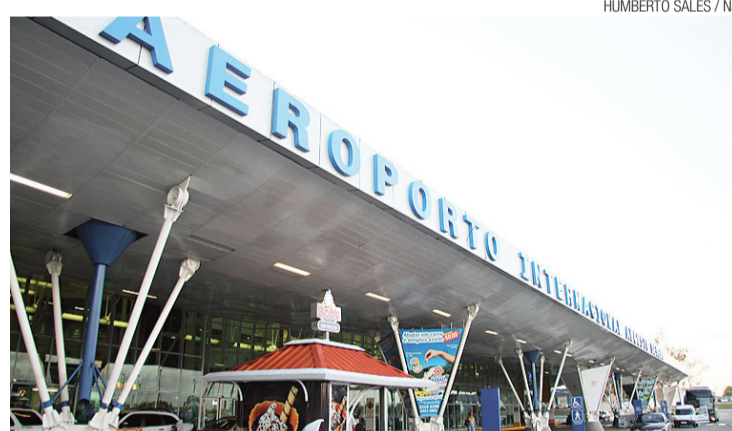
► Augusto Severo teve recorde de embarques e desembarques no ano passado

"A chegada de mais passageiros é fruto de uma ação planejada: