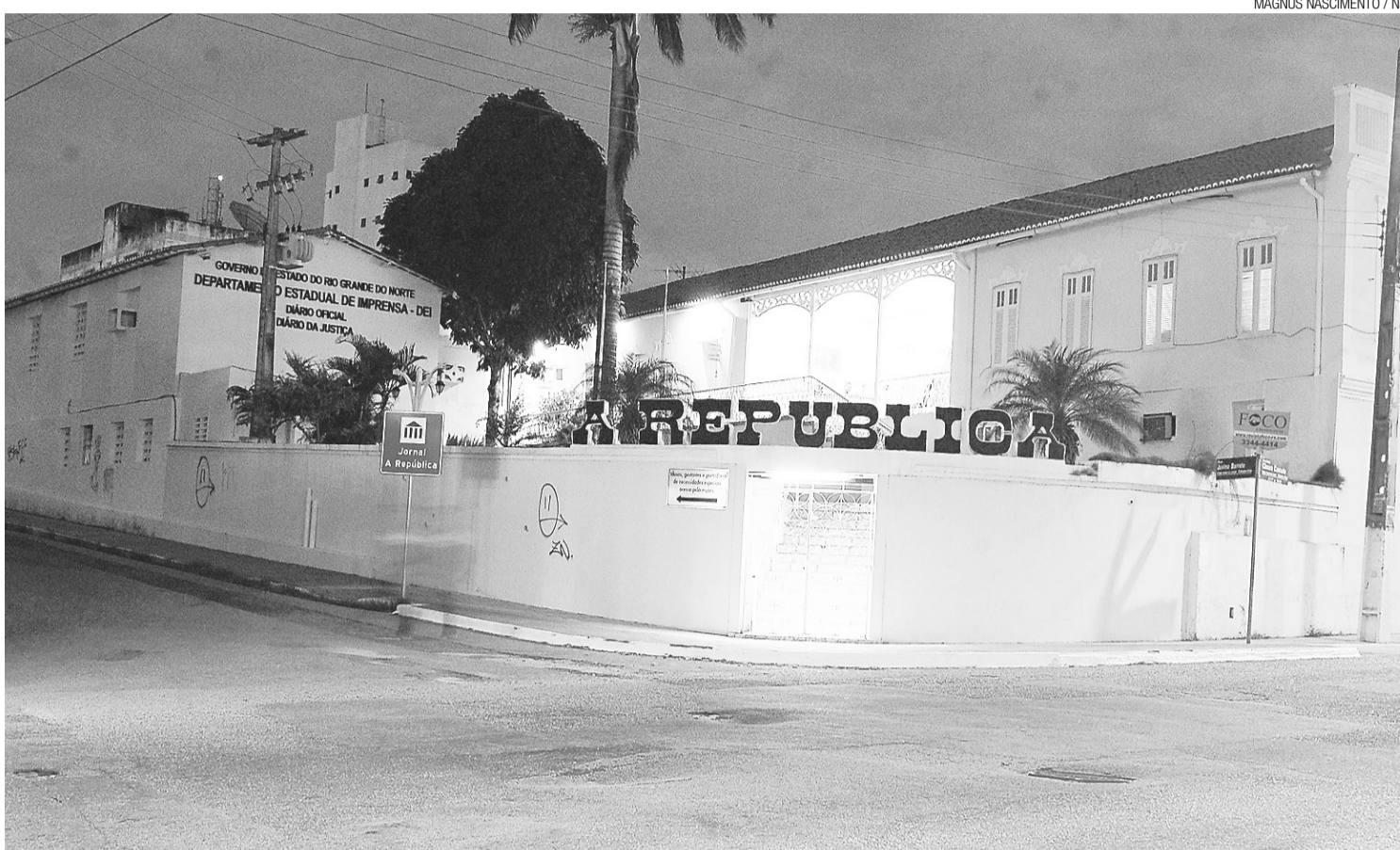
▶ DEI funciona no prédio do antigo jornal A República