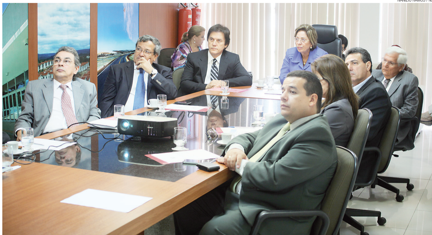
► Governadora Rosalba Ciarlini e secretários ouviram explicações sobre obras e instituiu comitê gestor no qual quer a presença de representantes do município

O Comitê vai identificar os projetos que devem ser elaborados, o que está sendo executado, para dimensionar as necessidades correr atrás de recursos para as obras.