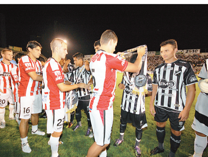
► Jogadores do River entregam as faixas aos campeões da Série C 2010

/ AMISTOSO / ABC ENCAROU O RIVER PLATE DO URUGUAI EM NOITE DE FESTA E DE MUITA CHUVA NO FRASQUEIRÃO; DERROTA POR 3 A 1 FOI CONSIDERADA NORMAL POR LEANDRO CAMPOS