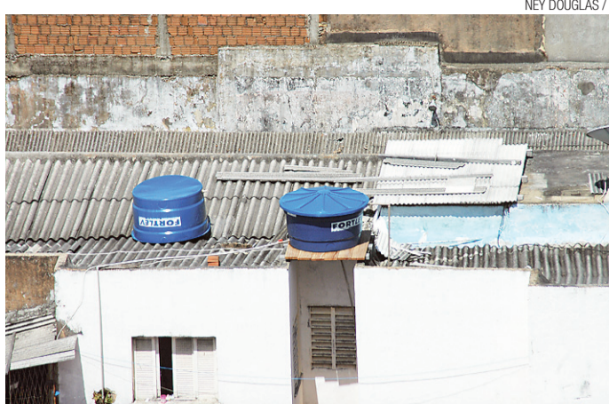
► Caixas para controle da dengue: uma das políticas de prevenção

Shaolin estava em turnê por todo o Nordeste com o espetáculo 'Lula de Férias'. Hoje ele viajaria para o estado de Alagoas, onde faria shows em Maceió e outras duas cidades vizinhas. O show de Natal, que seria realizado no Teatro Riachuelo, no dia 12 de fevereiro, foi cancelado.