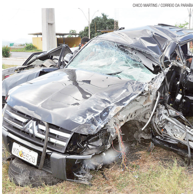
► O carro do humorista ficou completamente destruído

O caminhoneiro fugiu do local sem prestar socorro e continua foragido.