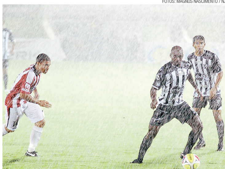
► Chuva prejudicou espetáculo: gols só no 2º tempo