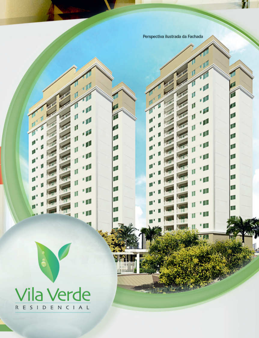
Perspectiva ilustrada da Fachada