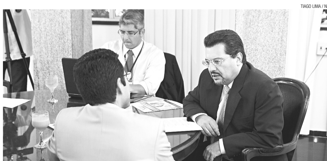
► Representantes do CNJ divulgam resultado parcial da vistoria realizada nos órgãos da Justiça potiguar