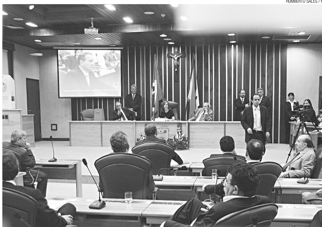
Maioria dos deputados se diz favorável ao projeto do governo, mas oposição espera esclarecimentos na audiência

Na sessão plenária de ontem, quando apenas oito deputados estavam presentes, o projeto foi lido para os poucos presentes. O valor do estádio, inclusive, impressionou alguns deputados. "Eu não sabia desse valor. O Governo terá de explicar a sua situação financeira e