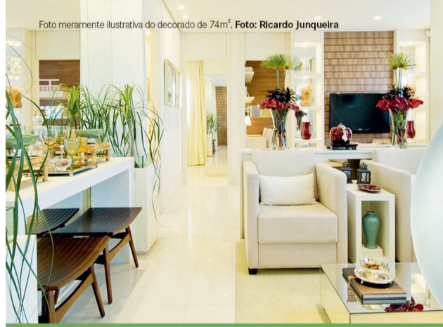
Foto meramente ilustrativa do decorado de 74m².