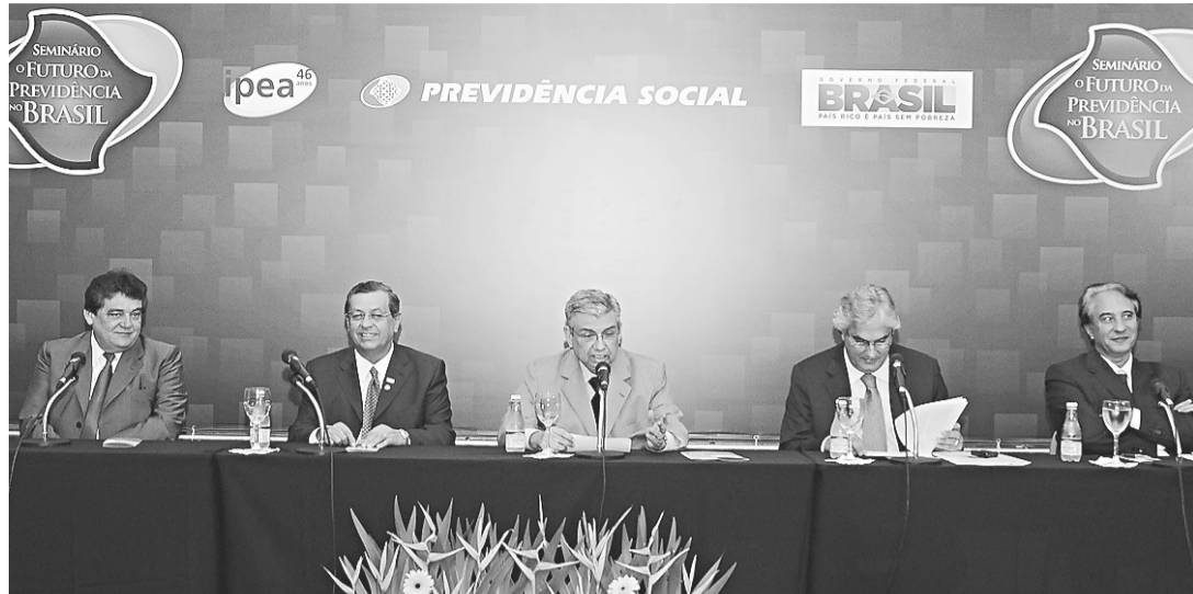
► Seminário apontou desigualdade entre o regime geral e o que garante aposentadoria integral para servidores

A fragmentação abre mais margem a interpretações diferentes", justificou. Ele afir-