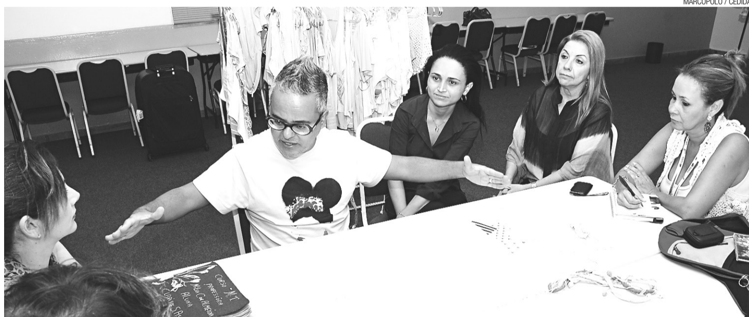
▶ Ronaldo Fraga volta a cidade para fazer palestra dentro do projeto Natal Fazendo Moda, mantido pelo Sebrae