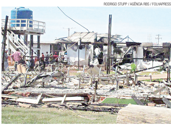
► O canteiro de obras da hidrelétrica de Jirau: trabalhadores insatisfeitos

"Qualquer ação estrangeira contra a Líbia vai expor todo o tráfego aéreo e naval no mar Mediterrâneo ao perigo e [instalações] civis e militares serão alvo de contra-ataques da Líbia", disse a nota.