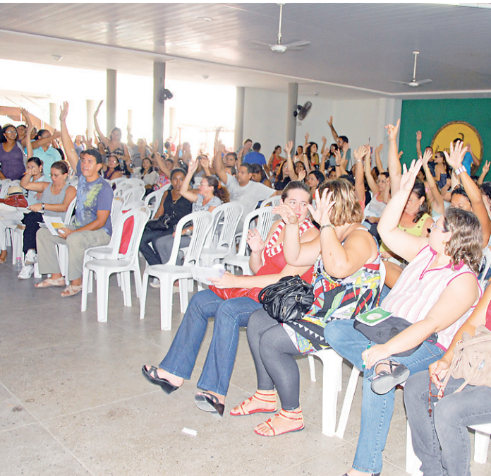
▶ Assembleia dos professores delibera pela continuação da greve