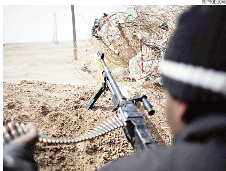
► Soldado rebelde tenta manter posição no leste da Líbia

A aprovação da resolução ganhou força depois que os EUA indicaram seu apoio. Antes da votação, a embaixadora dos EUA na ONU, Susan Rice, disse que o CS estava preparado para analisar medidas que incluíam a zona de exclusão aérea, mas que "tal-