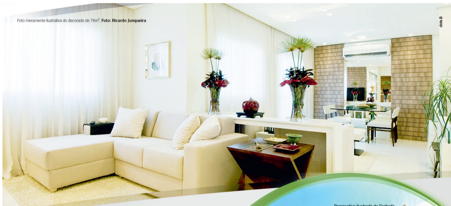
Foto meramente ilustrativa do decorado de 74m².