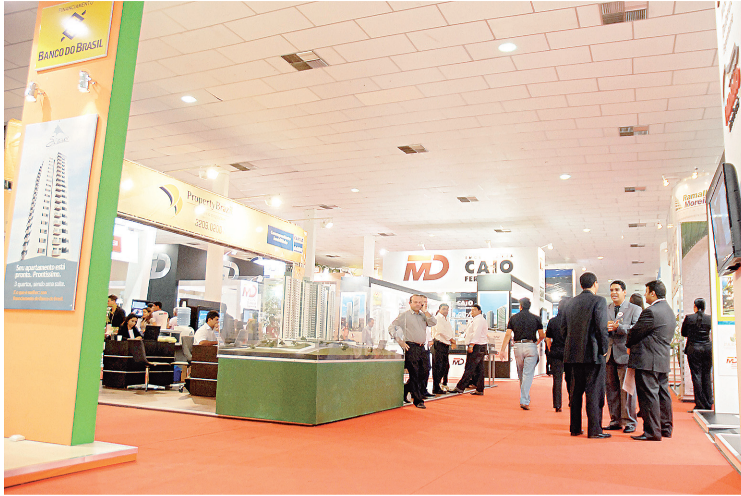
▶ Salão Imobiliário do RN

As maiores construtoras do Brasil e algumas regionais conseguem negociar com os bancos e oferecer aos clientes a possibilidade de financiamento durante a fase de construção.