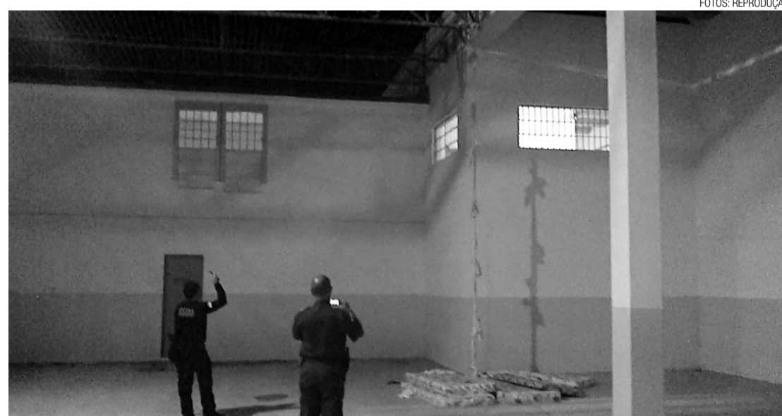
► Rota da fuga, que pode ter sido facilitada pelos agentes penitenciários: escalarom o telhado com o auxílio de lençóis emendados.