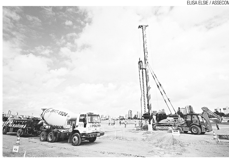
Obras serão monitoradas pela Fifa

todo um atraso do governo anterior nas medidas para garantir a Copa. Quem garantiu a Copa foi o nosso governo", disse. E completou: "Ano passado, tivemos um grande trabalho pagando o projeto do estádio e a consultoria; e fazendo ainda uma licitação que realmente valeu", criticou, fazendo referência à licitação deserta, ocorrida em novembro de 2010,