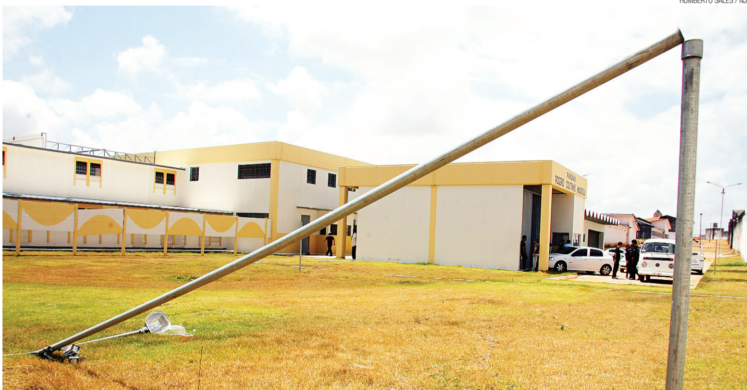
▶ Novo pavilhão Rogério Coutinho Madruga, projetado para abrigar 402 detentos em 52 celas, custou R$ 11 milhões ao Governo do Estado

Os agentes penitenciários é que controlam pelo lado de fora o fechamento de portas, iluminação e até a água do chuveiro, uma vez que dentro das celas não existem tomadas ou fiação elétrica. A fiscalização dos agentes deve ser feita por uma passarela em cima das celas.