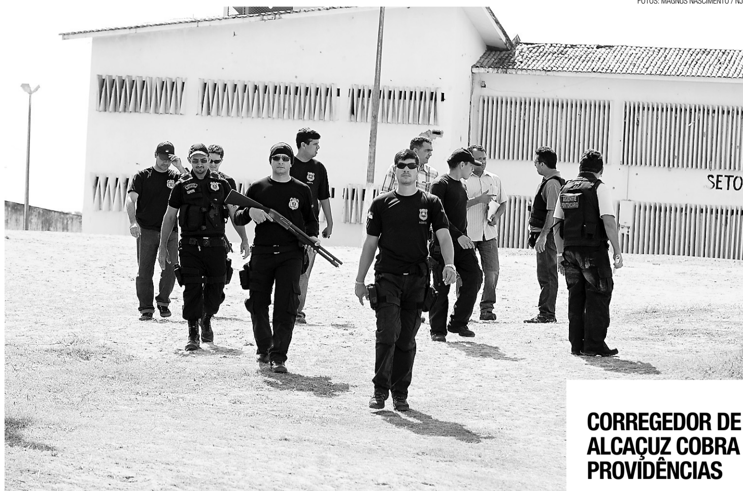
► Governo determinou reforço imediato na guarda de Alcaçuz

— Vou sim. Não sei se volto. Até o dia 30, então!