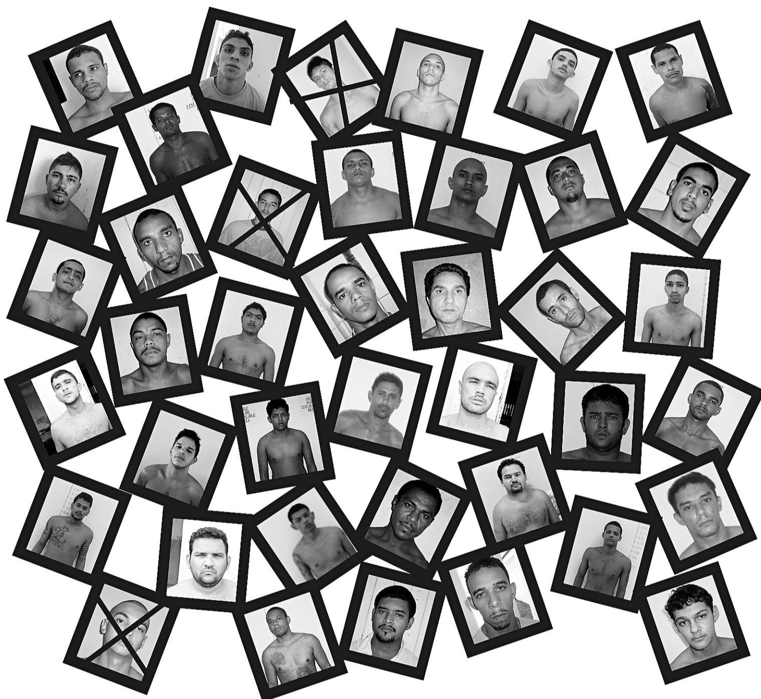
► Entre os fugitivos há assassinos, assaltantes e traficantes, que estavam encarcerados no pavilhão Rogério Coutinho Madruga, inaugurado há três meses

/ALCAÇUZ/ QUARENTA E UM PRESOS ESCAPAM DE MADRUGADA, NUMA AÇÃO SUPOSTAMENTE FACILITADA POR AGENTES E POLICIAIS; SECRETÁRIO DEMITE DIREÇÃO DA PENITENCIÁRIA E O COORDENADOR DO SISTEMA PRISIONAL