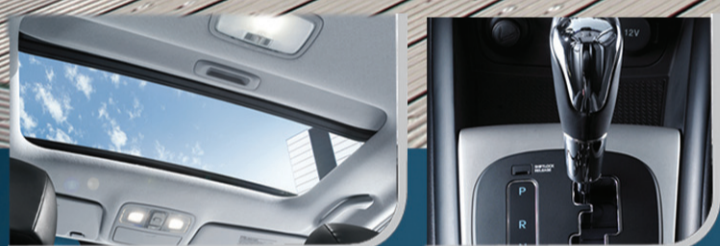
TETO SOLAR E CÂMBIO AUTOMÁTICO