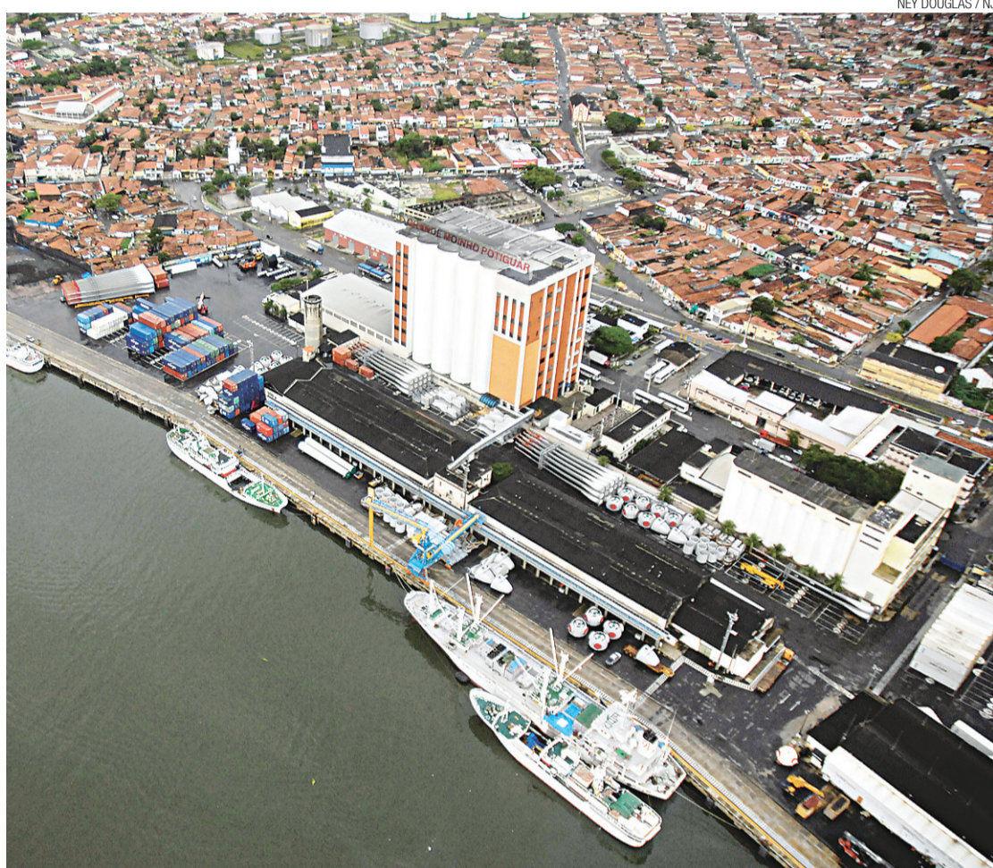
► Ampliação do porto é um dos desafios do novo presidente da Codern

R$108 milhões necessários para sua efetivação foram incluídos no PAC 2. Atualmente o projeto está em fase de licenciamento ambiental.