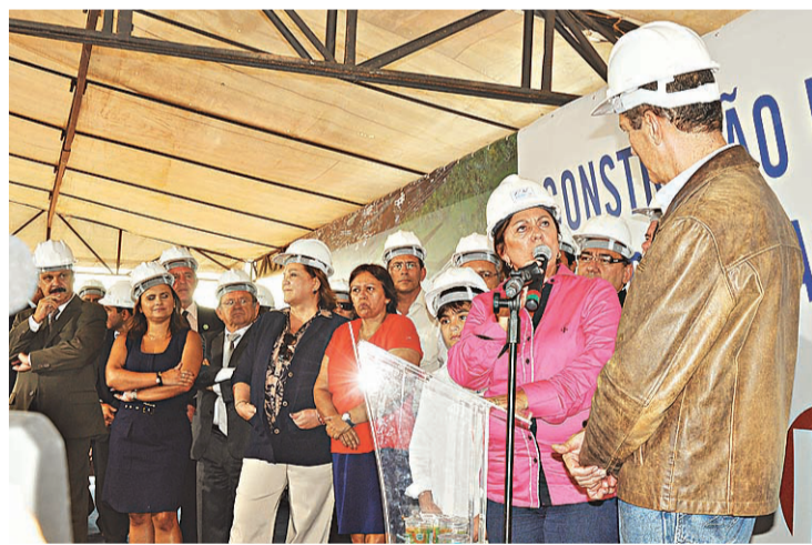
► ...e falam sobre o cronograma de obras