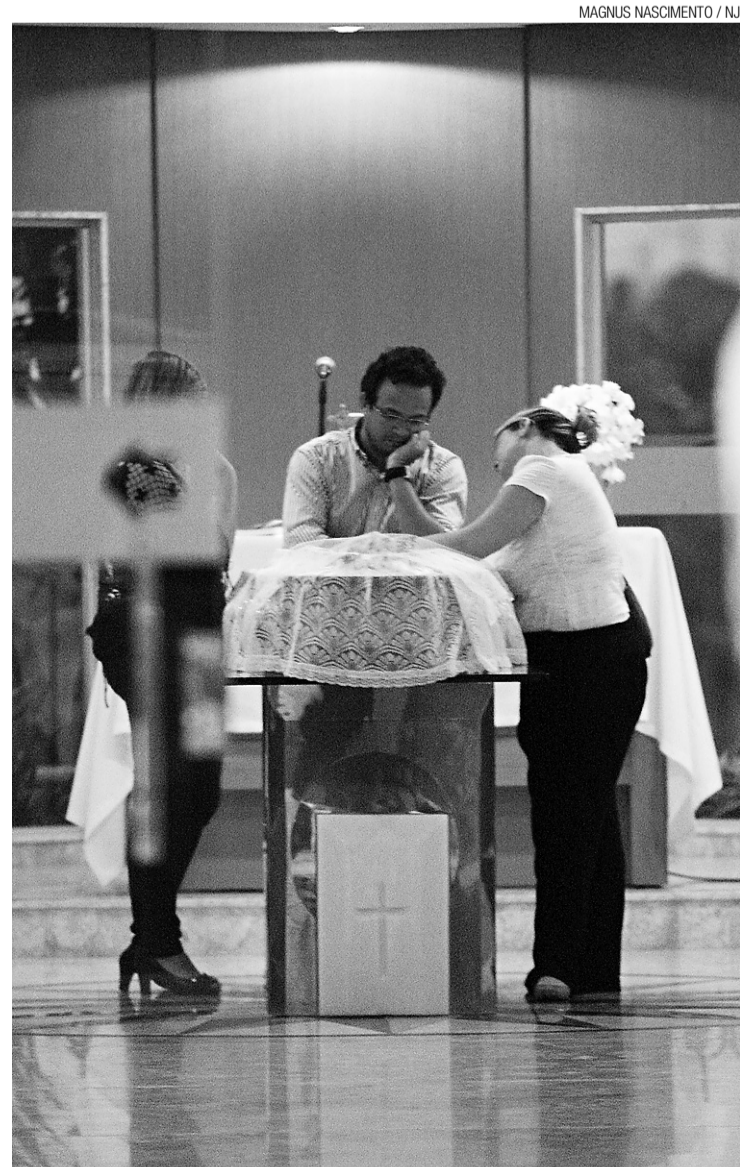
► Velório e sepultamento no Parque Morada da Paz, em Emaús