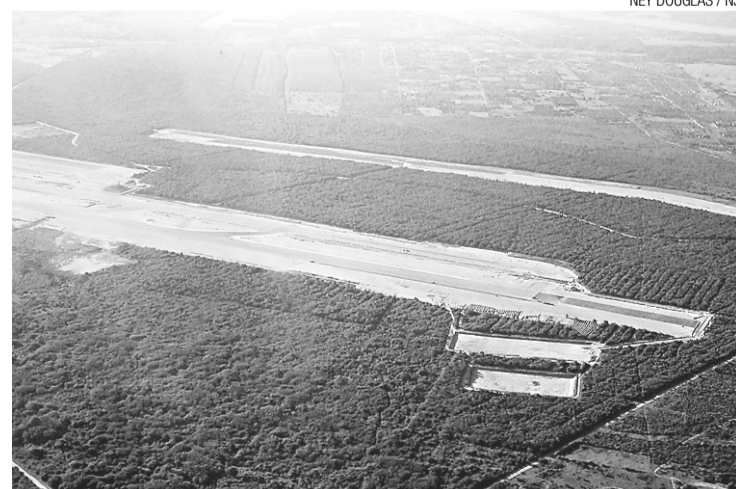
NEY DOUGLAS / NJ