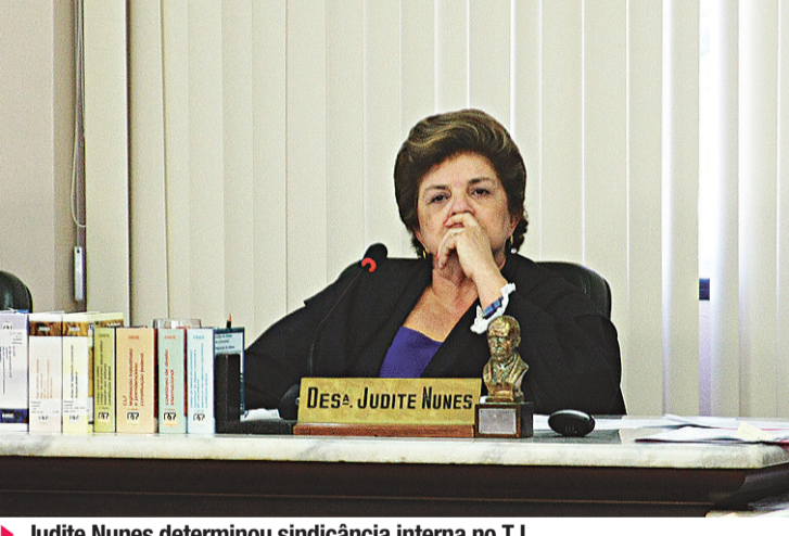
► Judite Nunes determinou sindicância interna no TJ

A partir de agora, os processos vão receber uma análise individualizada, com a confecção de listagem de precatórios, e observância da ordem cronológica. O setor será obrigado a disponibilizar a listagem final de pagamento e possibilitar também o acompanhamento dos processos. Além disso, também serão feitas semanas de conciliação de precatórios.