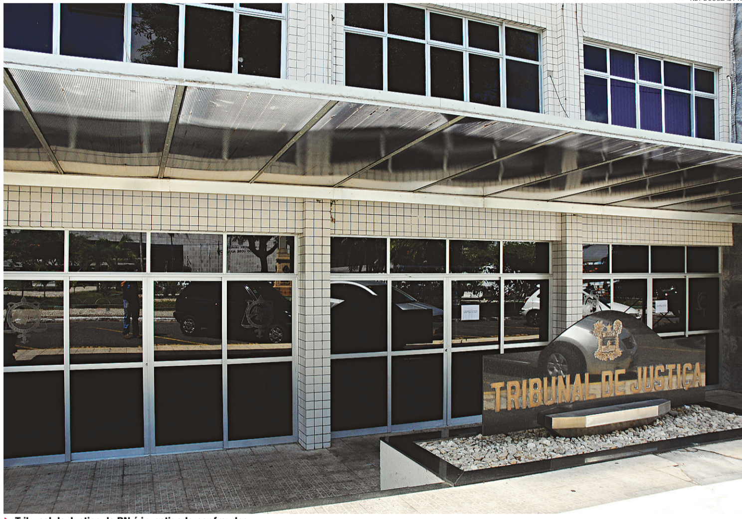
► Tribunal de Justiça do RN é investigado por fraudes