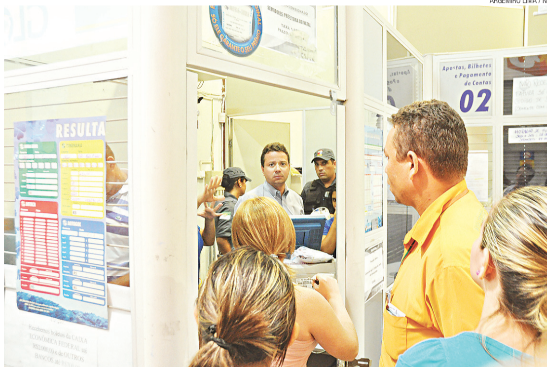
► Bandidos já chegaram lançando malote por cima dos guichê da lotérica e anunciando assalto

"Eu comecei a me afastar lentamente do caixa e vi outro assaltante levar alguns pertences de quem estava na fila", disse a jovem, que estava realizando um pagamento para a empresa onde