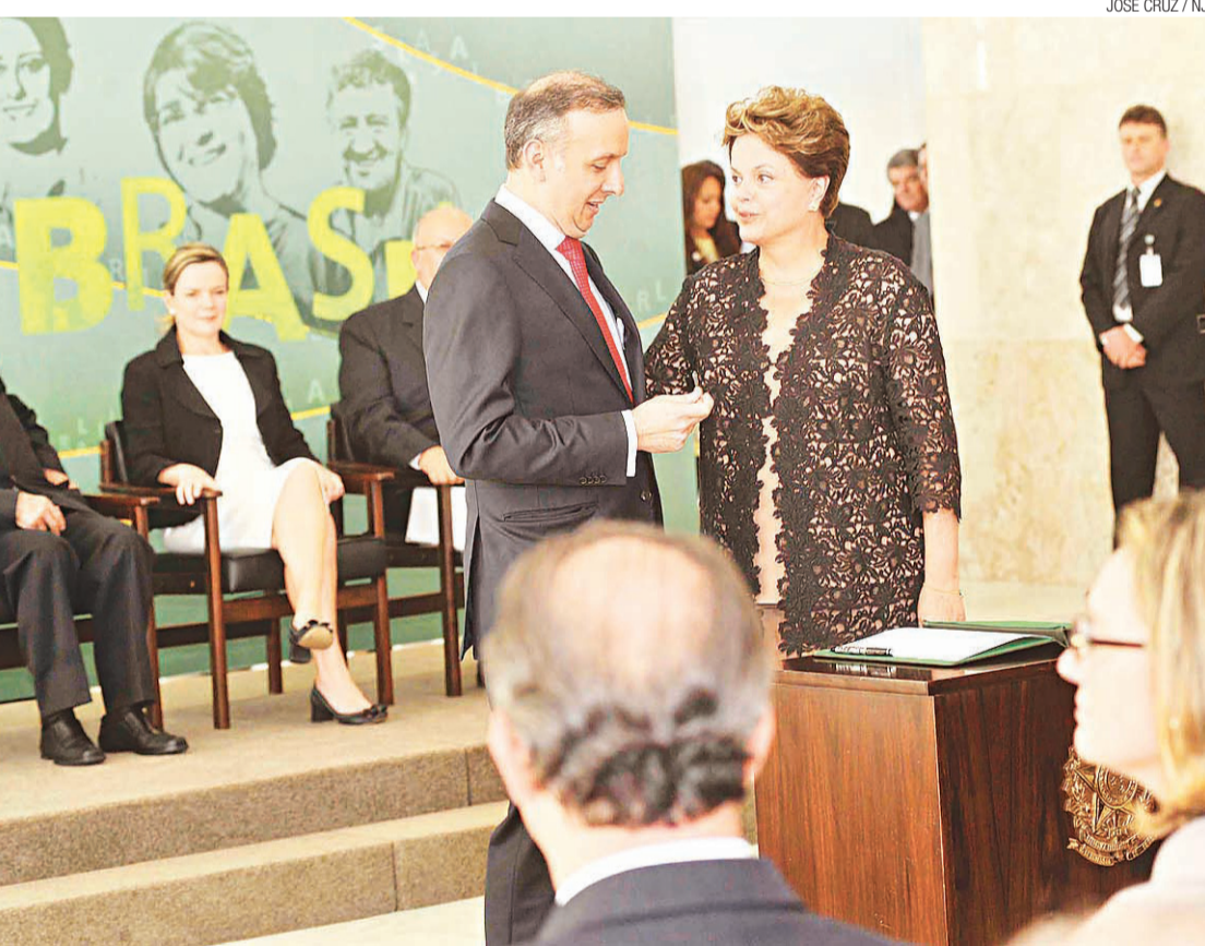
▶ Presidente dá posse a Aginaldo Ribeiro após demissão de Negromonte