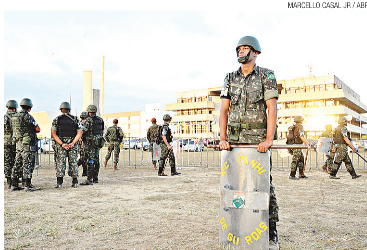
► Exército cerca Assembleia Legislativa da Bahia

Houve quatro confrontos entre o Exército quando manifestantes que estão do fora do prédio tentaram entrar. Entre rasantes de helicópteros, bombas de efei-