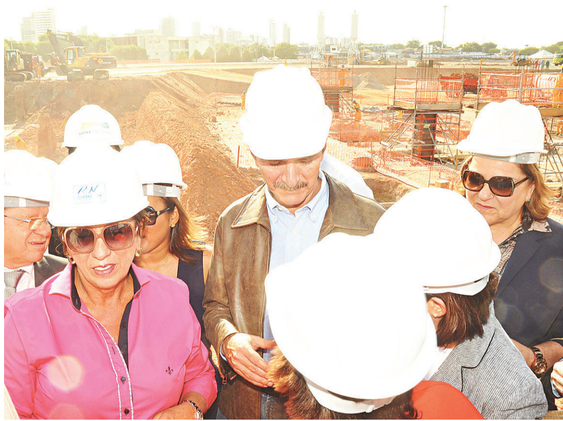
► Comitiva percorreu o canteiro de obras da Arena

Durante a coletiva de imprensa realizada ao final da visita ao canteiro de obras, Aldo Rebelo foi questionado pelo NOVO JORNAL sobre as declarações da Fifa, dando conta de que Natal teria um monitoramento especial e que a Copa poderia ter seu número de sedes reduzido, e rebateu: "Como ministro do país que vai receber a Copa eu garanto que não vai haver redução nenhuma no número de cidades". Depois, Aldo disse que o próprio Jérôme Valcke deve vir a Natal em sua próxima visita ao Brasil, marcada para março, e, em um tom não tão ameno em relação ao apresentado no início da entrevista, fez questão de ratificar ao repórter o risco zero de Natal ficar fora do Mundial. "Posso garantir ao senhor que a Copa do Mundo vai ser realizada em 12 sedes", salientou.