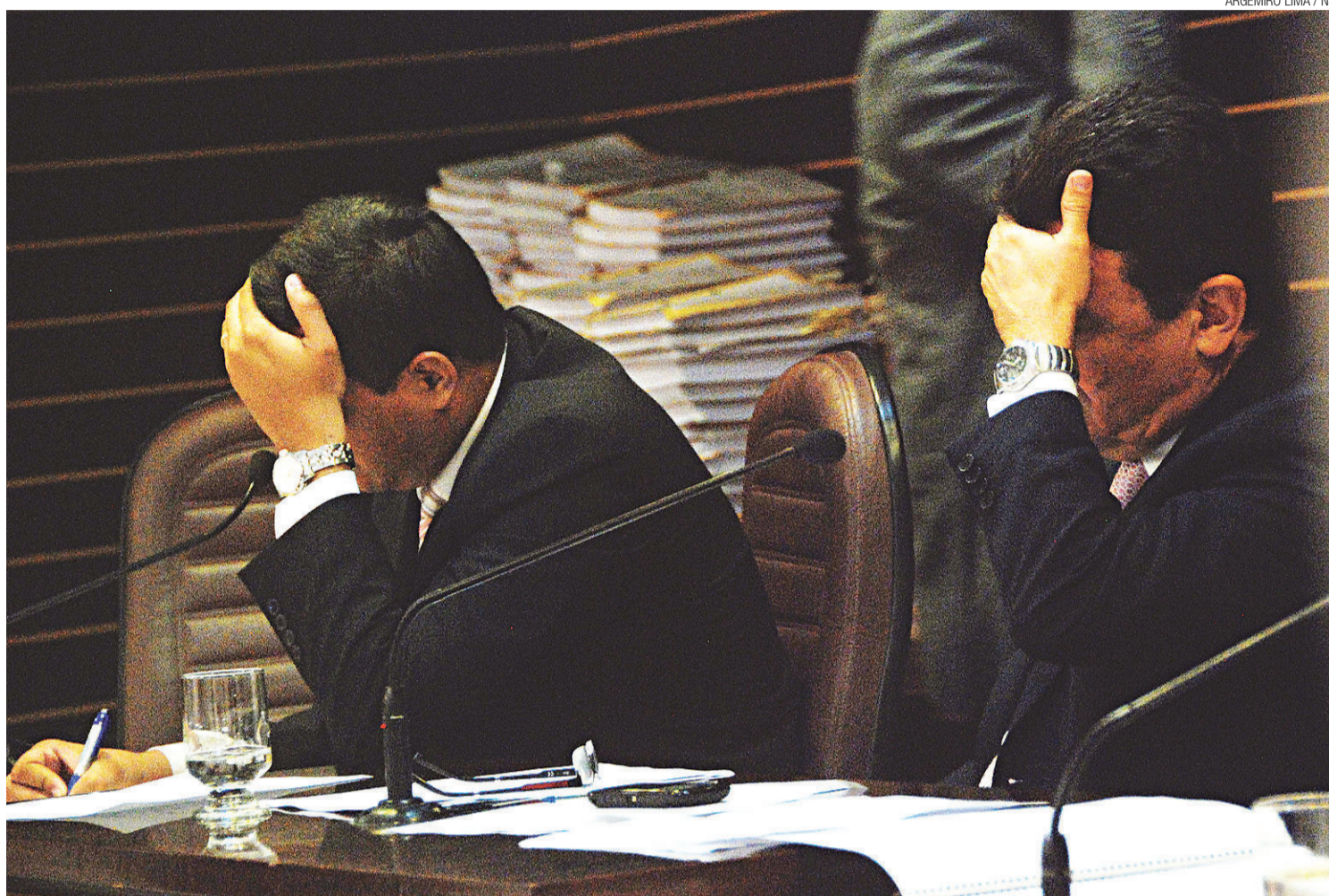
► Vereadores aprovaram relatório, governistas saíram do plenário quando foram lidos anexos e voltaram correndo para votar, e depois homenagearam o Rotary