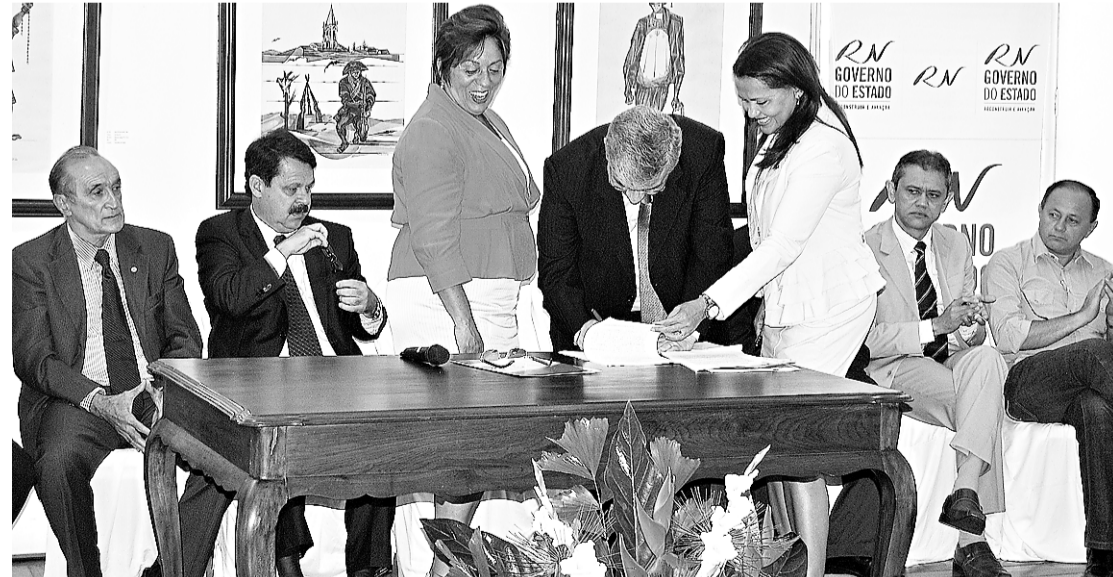
▶ Solenidade de assinatura de convênios com a Funasa e Ministério do Meio Ambiente

"Cada município atua como um sócio desse consórcio e a contribuição de cada um vai depender do volume de lixo que gerarem", reforçou. O secretário também explicou que os R$ 3 milhões destinados ao plano intermunicipal de resíduos vai ajudar no estu-