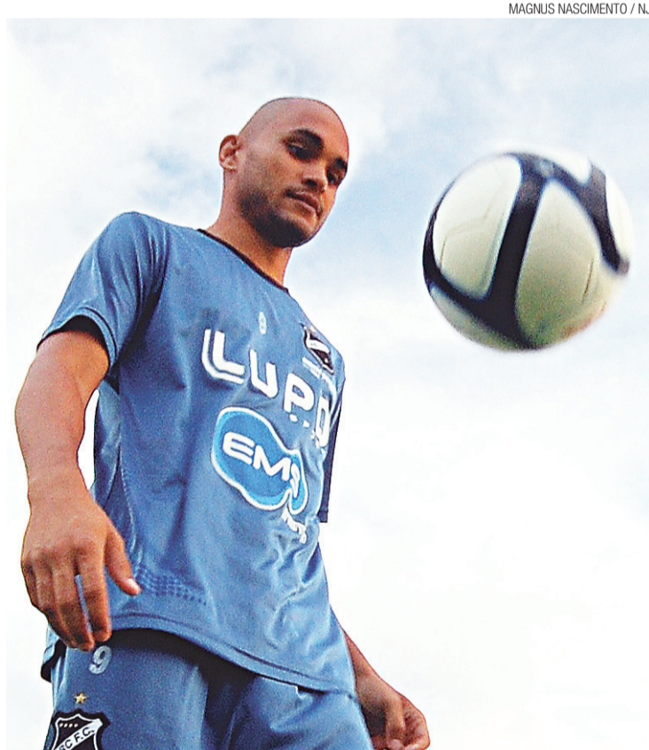
► Washington está confiante que dá para eliminar o jogo de volta

Mas a incógnita Locomotiva que espera o elenco Alvinegro