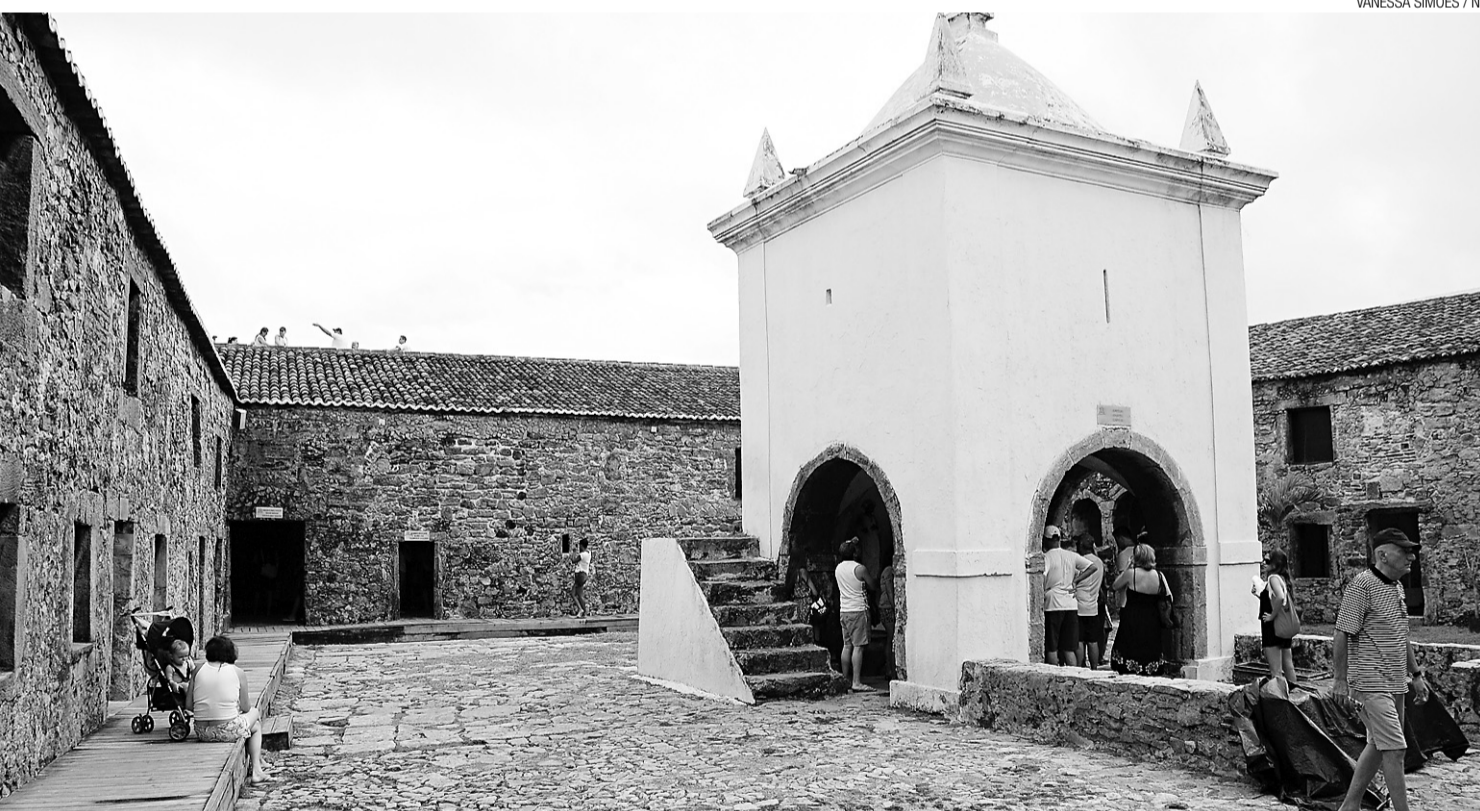
► Forte dos Reis Magos, com problemas estruturais, vai passar por uma reforma, conforme garante a Fundação José Augusto