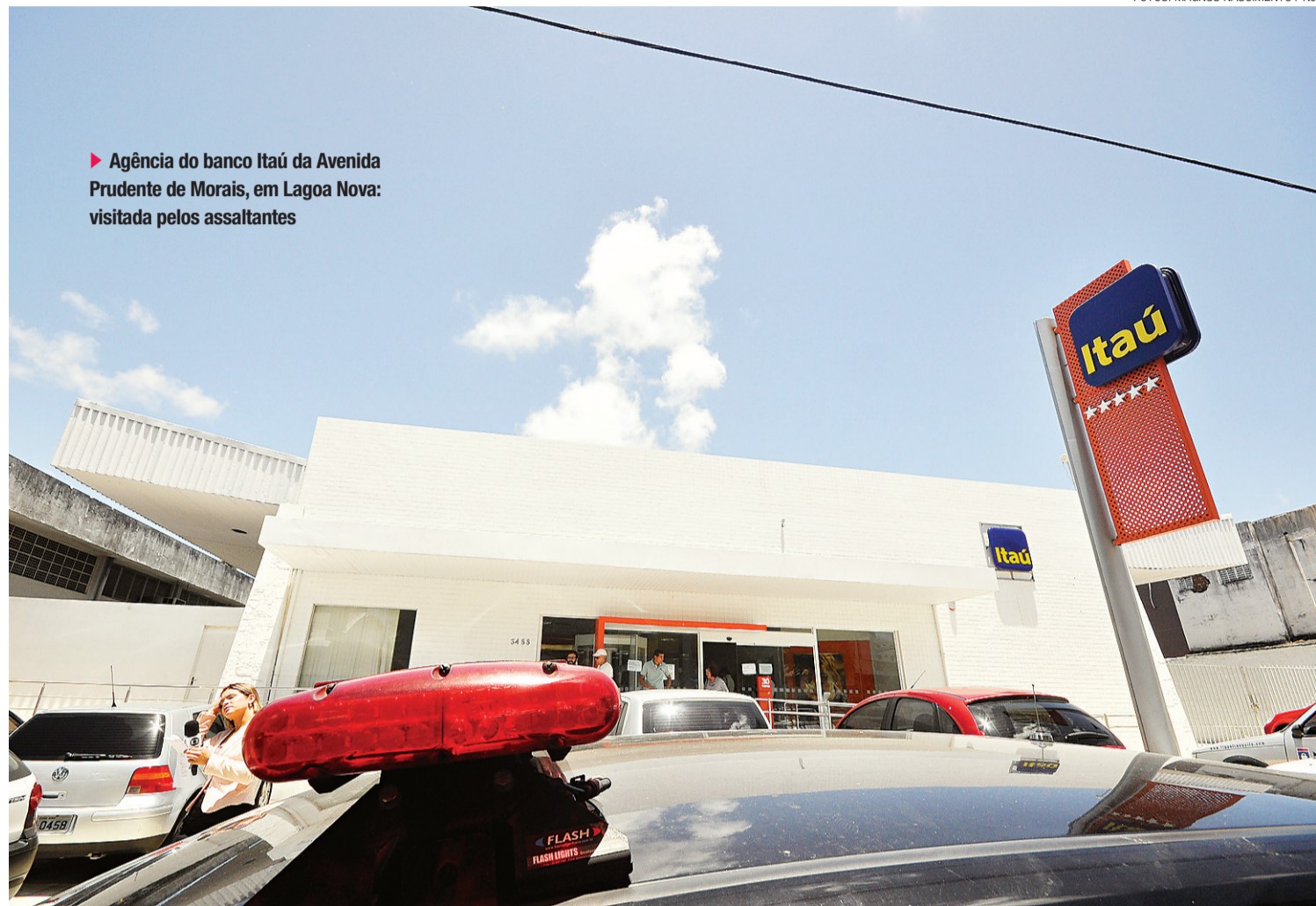
► Agência do banco Itaú da Avenida Prudente de Moraes, em Lagoa Nova: visitada pelos assaltantes

Atendendo normas da direção, aliás, nenhum funcionário foi autorizado a falar com a imprensa.