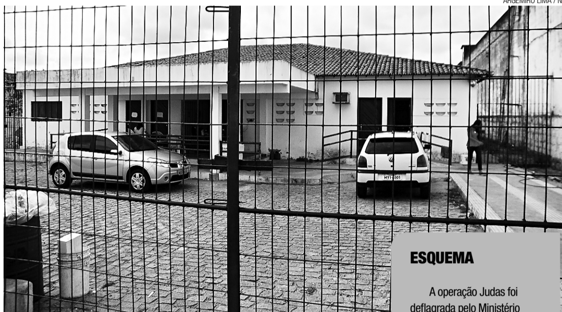
► Complexo Penal João Chaves, Zona Norte