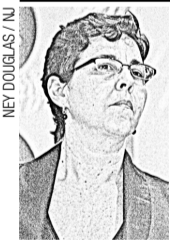
DA MINISTRA DO DESENVOLVIMENTO SOCIAL E COMBATE À FOME, TEREZA CAMPELO, AO LANÇAR O PROGRAMA EM NATAL

Assim, de uma hora para outra, as filas foram reduzidas ao tolerável, sem que tal mudança signifique que o problema das macas nos corredores tenha sido solucionado. - Nada disso. Continuam faltando leitos (especialmente de UTI) para atender a demanda normal de um estado das nossas carências. E o alívio registrado não pode servir de argumento para que não haja a preocupação com a ampliação e melhoria da urgência, além da necessidade do aumento de leitos para a terapia intensiva. Mas está claro que, para se cobrar da sociedade - e do Governo - mais atenção para a saúde pública (especialmente na urgência), não se faz necessário a exposição de seres humanos a um deplorável quadro de degradação.