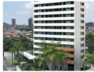
CORAIS CAPIM MACIO Torre única – Janeiro (44 unid.) 100% vendido