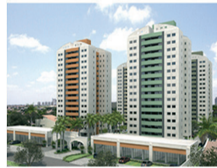
SUN HAPPY Torre B – Fevereiro (60 unid.) 95% vendido