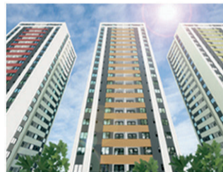
SUN RIVER Torre A 85% vendido