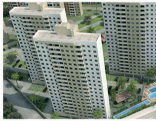
SUN RISE Torre 3 – Junho (57 unid.) 90% vendido