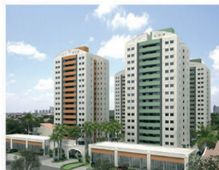
SUN HAPPY Torre C 93% vendido