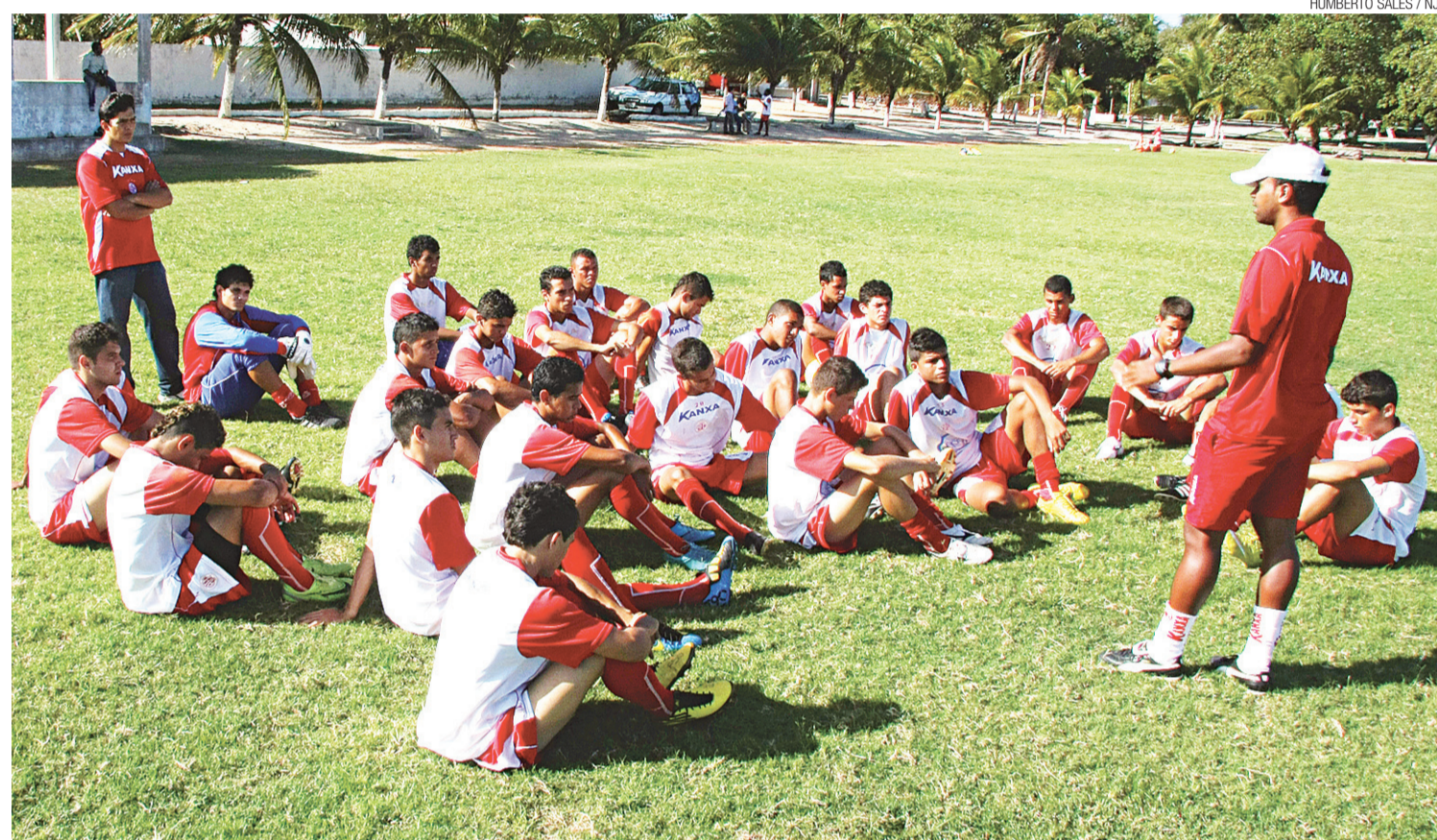
► O empresário descobre futuros craques, investe e projeta o atleta para o futebol e geralmente é remunerado por isso recebendo uma porcentagem na venda do jogador