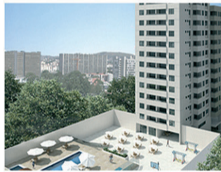
VERANO LAGOA NOVA Torre única – Junho (94 unid.) 100% vendido