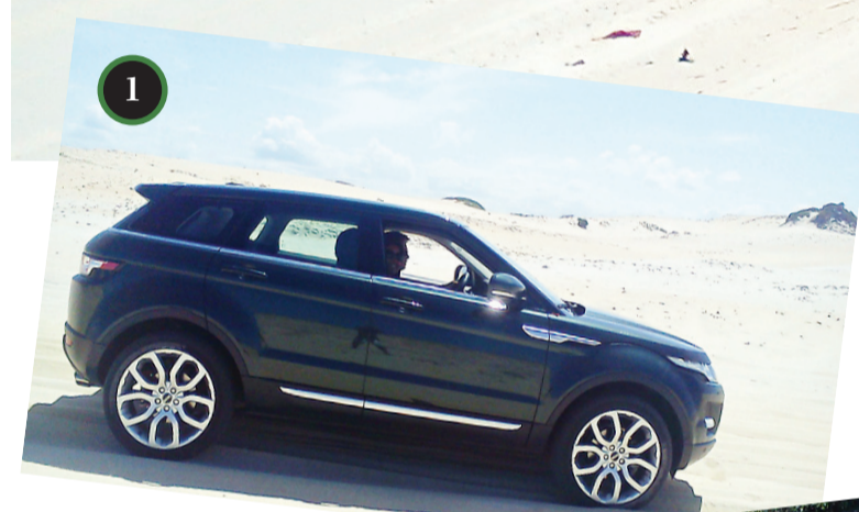
1. Nas dunas de Malembá. 2. Embarcando na balsa, em Tibau do Sul. 3. No Chapadão, em Pipa. 4. Em Pirangi. 5. Na Pousada Coco Fresco, Pipa.