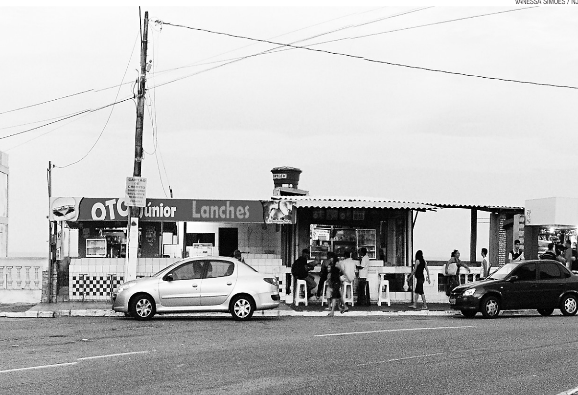
► Depois de duas décadas instaladas irregularmente nas encostas de Petrópolis, cigarreiras foram fechadas pela Semsur