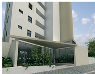
CORAIS TERRA DO SOL Torre única – Maio (30 unid.) 100% vendido