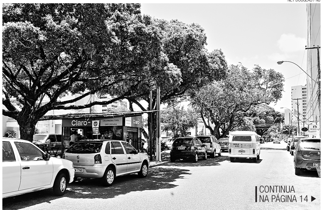
► Dados da Semsur indicam que há 500 cigarreiras licenciadas e outras 500 operando na clandestinidade