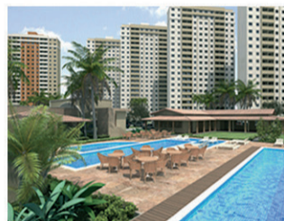
SUN SET Torre 2 90% vendido