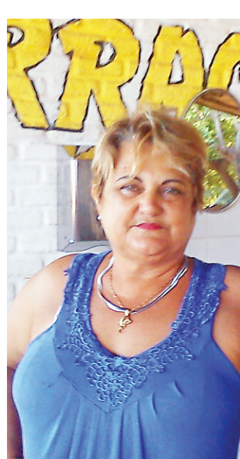
▶ Régia; "É um avião".