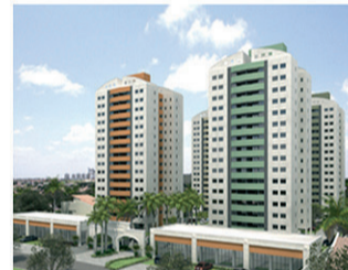
SUN HAPPY Torre A – Fevereiro (60 unid.) 95% vendido