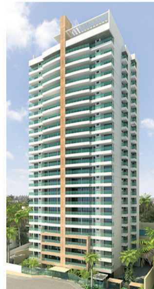
MIRANTE DOS VENTOS Torre única 95% vendido