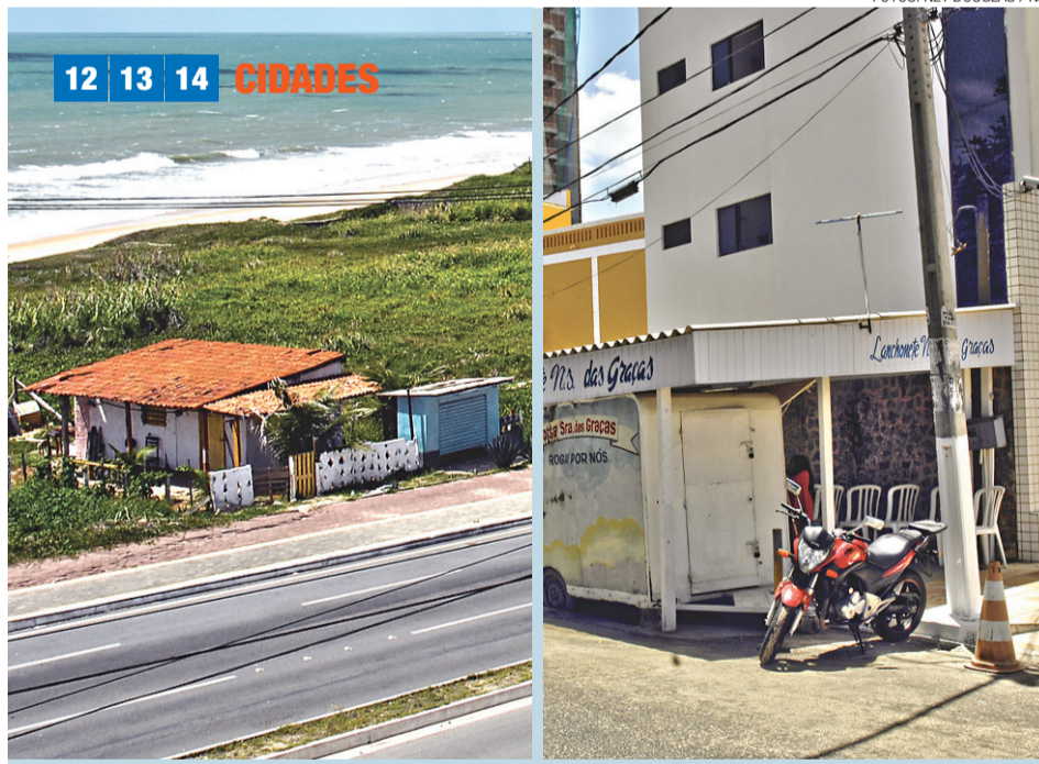
► Casa na Via Costeira: agora com cigarreira