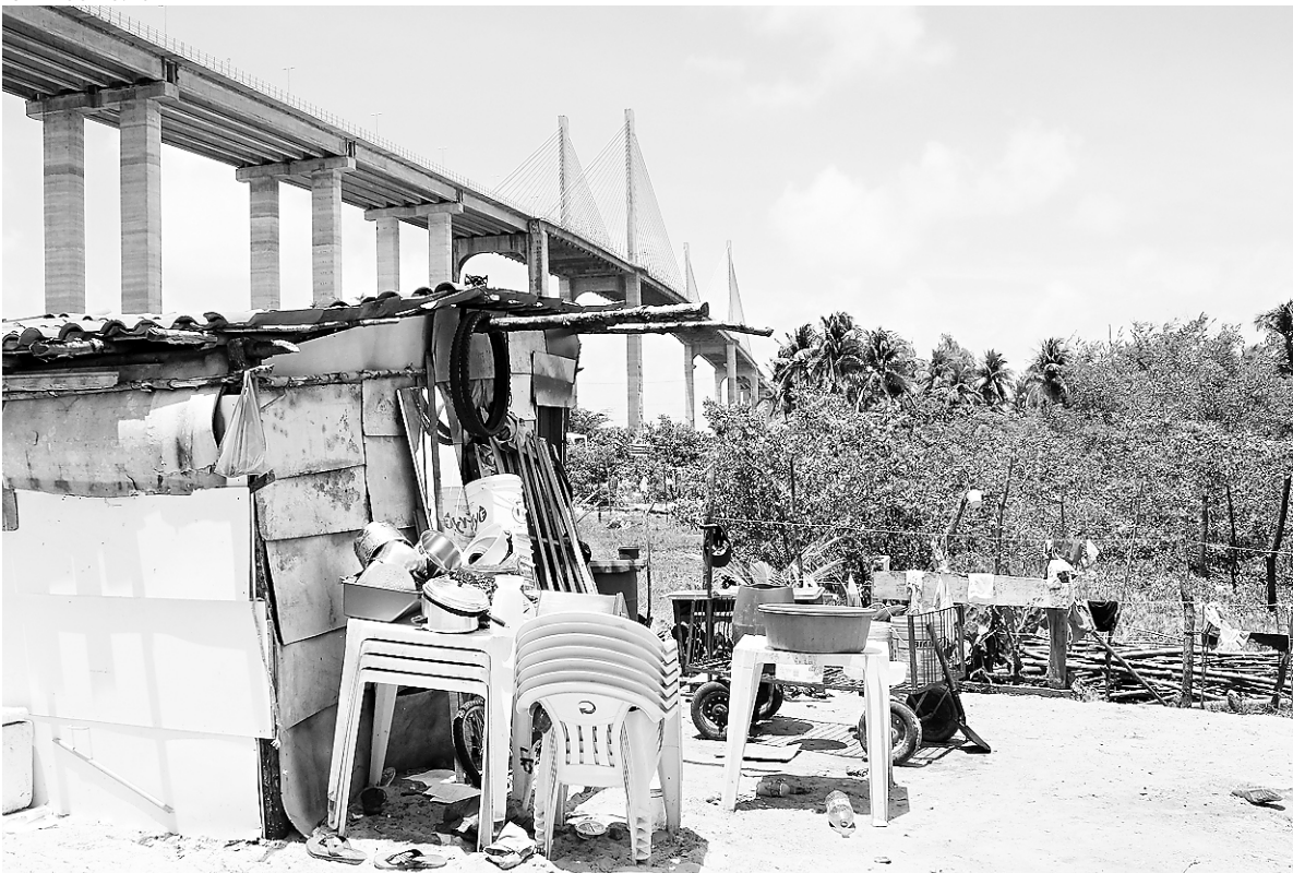
▶ Favela vai se estruturando em área de mangue, inserida Zona de Proteção Ambiental, na Redinha