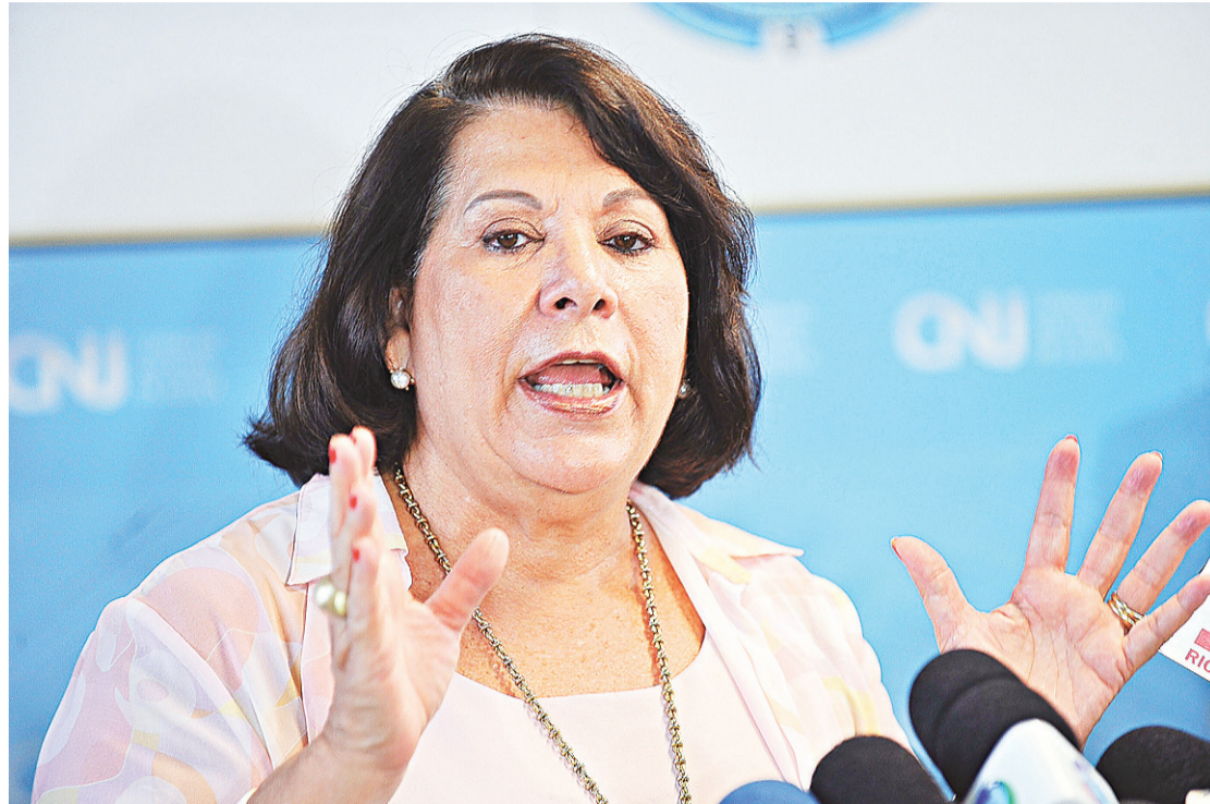
▶ Eliana Calmom, do CNJ e do STJ, é conhecida por fiscalização do Judiciário brasileiro

Ao mesmo tempo que o procedimento administrativo no CNJ é tocado, a Procuradoria