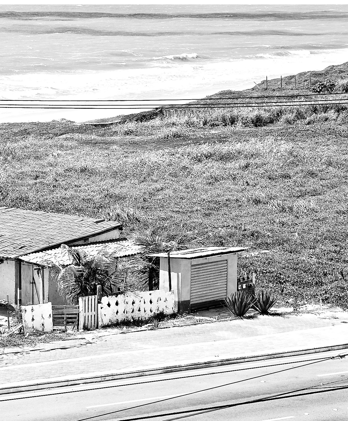
NEY DOUGLAS / NU