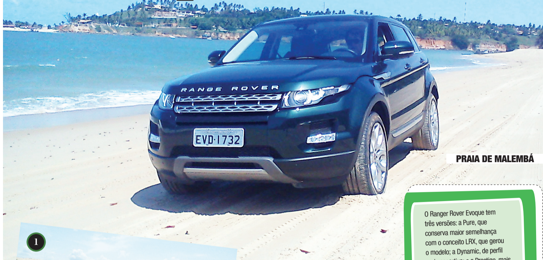
PRAIA DE MALEMBÁ

/ TEST DRIVE / RANGE ROVER EVOQUE MOSTRA HABILIDADE NA CIDADE, CONFORTO NA ESTRADA E FORÇA NO OFF-ROAD