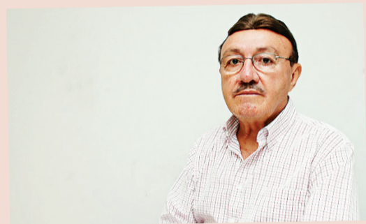
JOÃO BATISTA MACHADO ESPECIAL PARA O NOVO JORNAL

O cardápio da tradicional culinária nordestina atrai políticos, empresários, ministros de Estado, artistas e cantores famosos que visitavam Natal nas décadas de 60 e 70. O robusto naco de carne-de-sol compacto, acompanhado de farofa de bolão, feijão verde, macaxeira e arroz branco, ganhou notoriedade nacional. Quem vinha à cidade tinha quase a obrigação de conhecer o famoso prato típico regional que fazia enorme sucesso servido num modesto restaurante da rua Pereira Simões, no bairro das Rocas.