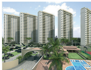
SUN GOLDEN Torre 01 – Maio (76 unid.) 90% vendido