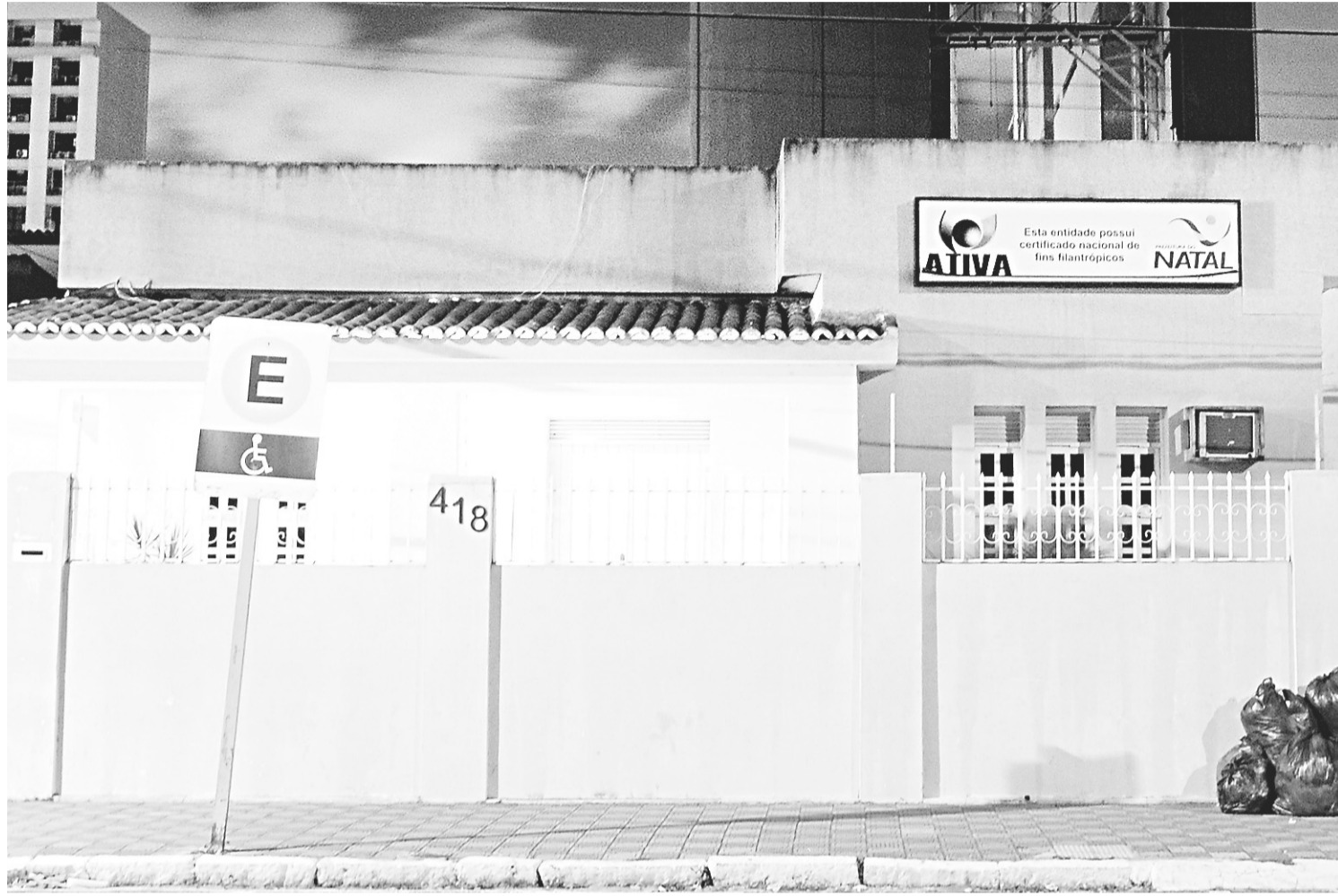
► Ativa recebe R$ 1,150 milhão por mês da Prefeitura para pagar 959 funcionários que prestam serviço nas secretarias de Ação Social e na Capitania das Artes

eto é a contratação de pessoal pela Ativa para fornecer mão de obra para tocar os projetos da Semtas. São psicólogos, pedagogos e nutricionistas, para atuar dentro dos projetos da secretaria, como nas Casas de Passagem, em abrigos de idosos, no Centro de Referência de Assistência Social (Cras), conselhos tutelares e centros públicos. Já com para a Funcarte são contratados professores de arte, dança, teatro, monitores de museus e músicos, entre outros. A maior parte destes, dentro do programa Circule.