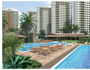
SUN SET Torre 1 – Julho (76 unid.) 98% vendido