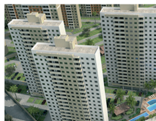
SUN RISE Torre 2 75% vendido