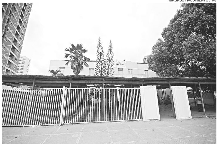
► Meios praticamente fechou as portas com o fim do convênio do Estado

Segundo ele, o fim abrupto do convênio com o Estado foi o que gerou toda essa crise. Pessoas contratadas há 20 ou até 30 anos foram demitidas sem nenhuma garantia trabalhista. Além disso, todos os projetos sociais que eram desempenhados pelo Meios tiveram que acabar de uma hora para outra. E não eram poucos. Segundo o interventor, 40 mil pessoas eram beneficiadas mensalmente em 24 municípios do Rio Grande do Norte. "Tinha padaria, seralheria, fábrica de picolé, além de ter um grande trabalho de segurança alimentar em quatro mi-