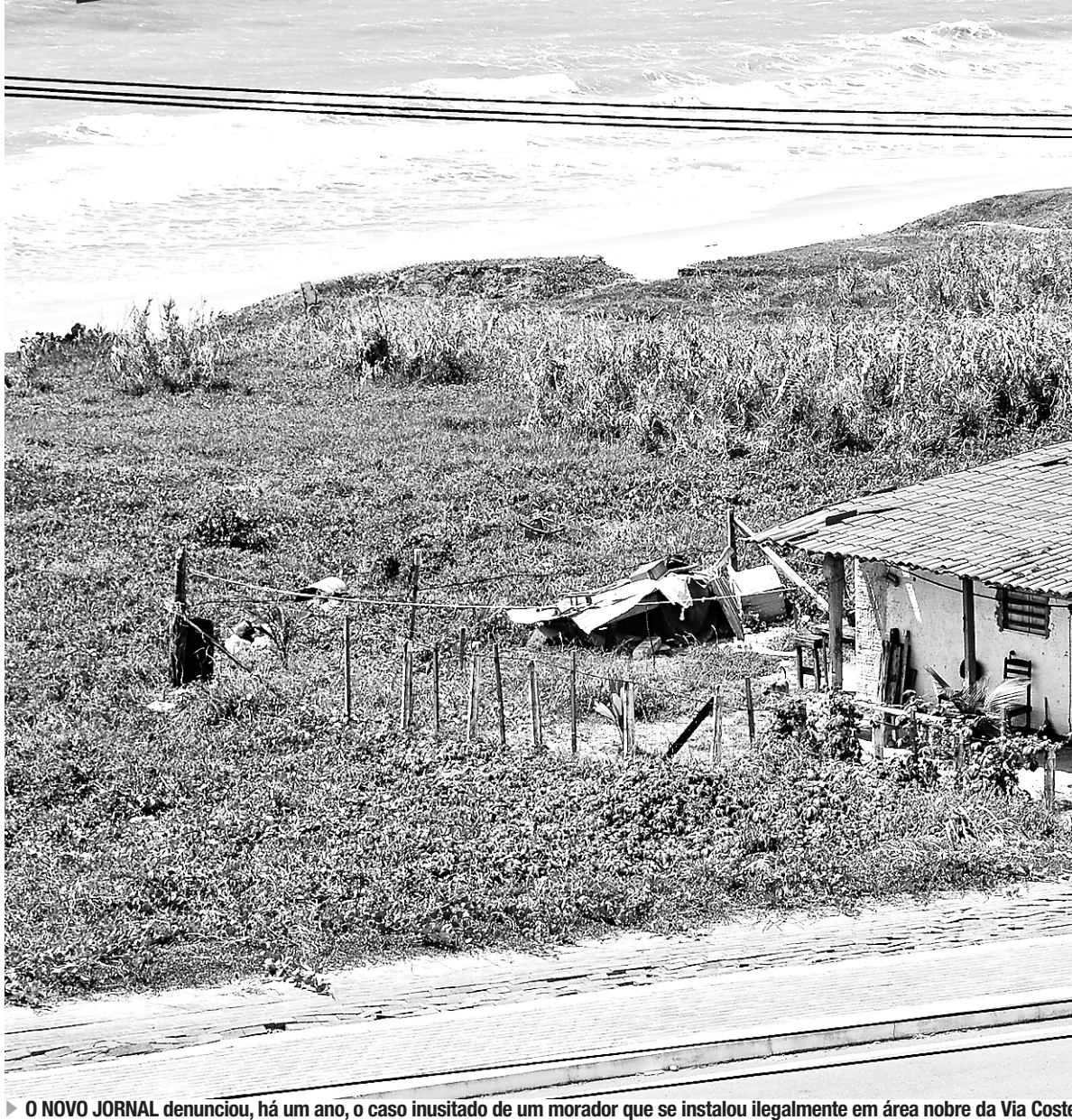
▶ O NOVO JORNAL denunciou, há um ano, o caso inusitado de um morador que se instalou ilegalmente em área nobre da Via Costeira