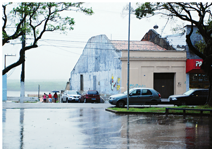
► Central Geral dos Trabalhadores do Brasil, na Cidade Alta, e Associação dos Alfabetizadores Programa Brasil Alfabetizado, Alecrim: endereços não confirmados

A CGTB, por exemplo, informou que oferecia a alfabetização de jovens e adultos em uma sala comercial localizada na Praça An-