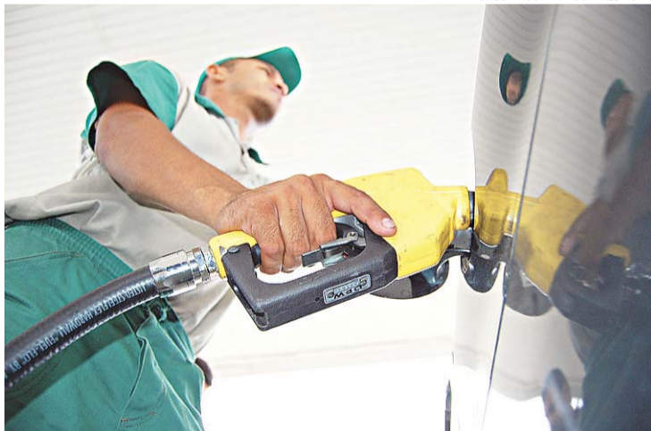
No caso do diesel, Governo não conseguiu evitar repasse ao consumidor

Mais cedo, estudo do CBIE (Centro Brasileiro de Infraestrutura) mostrou que a defasagem de preço do diesel vendido pela Petrobras em relação às refinarias dos EUA chegava a 23%, mesmo após o reajuste anuncia-