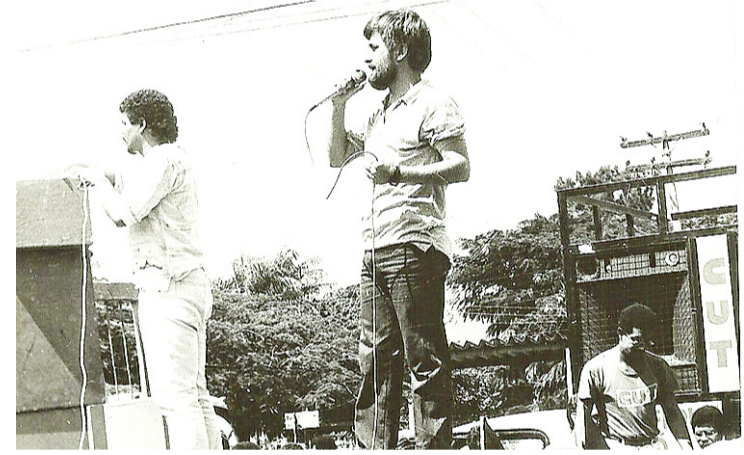
► Nos tempos do sindicalismo

Em seguida, foi detido e levado para o Departamento de Ordem Política e Social (Dops), principal braço da repressão contra o regime dos milicos. "Quando acordei, já estava dentro do carro da polícia", fala ele. Ficou dois dias preso, quando foi questionado sobre o paradeiro de alguns "subversivos". Ele era integrante da Convergência Socialista, uma das correntes da esquerda na época, considerada importante na luta contra a di-