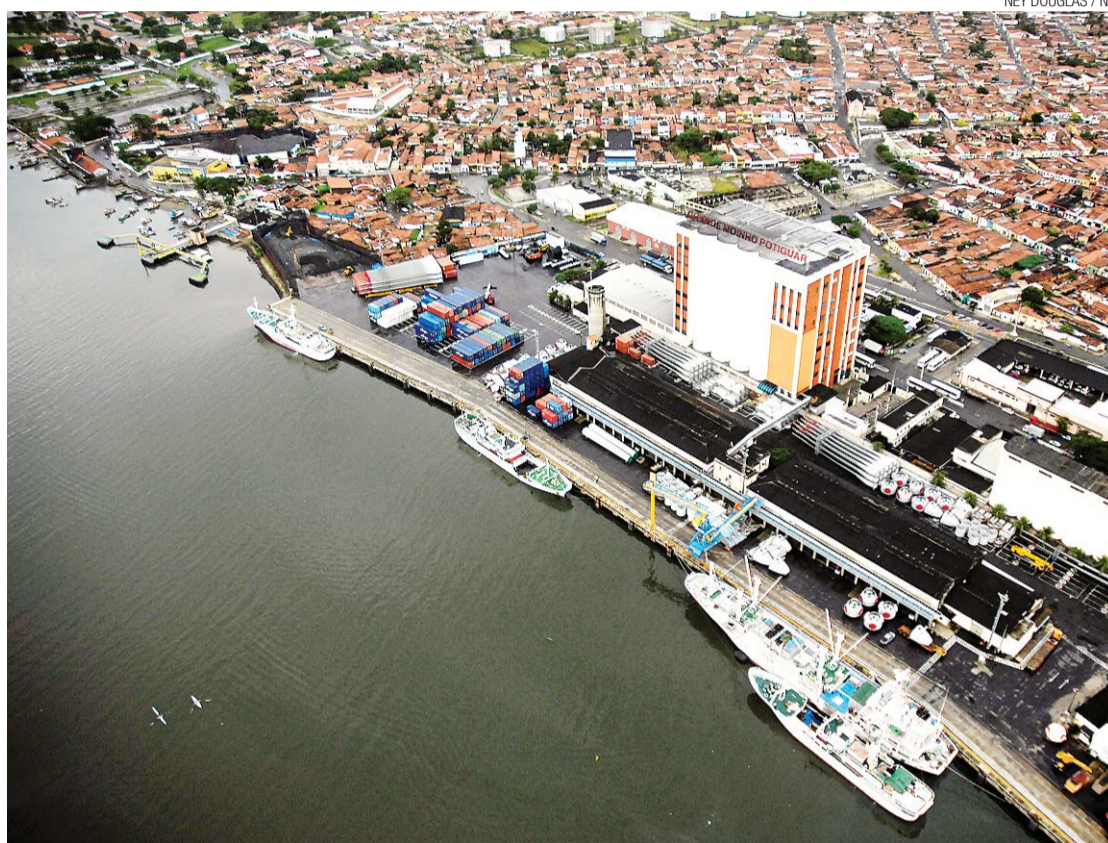
► Nova obra ampliará área de atracação em 220 metros, o que dotará o porto de Natal de um supercais

O maior obstáculo para que se iniciasse o processo licitatório era a falta de entendimento com os pescadores do Canto do Mangue, que teriam de ser relocados. Passados mais de 60 dias de negociação, ficou decidido que será incluído no edital a construção de uma