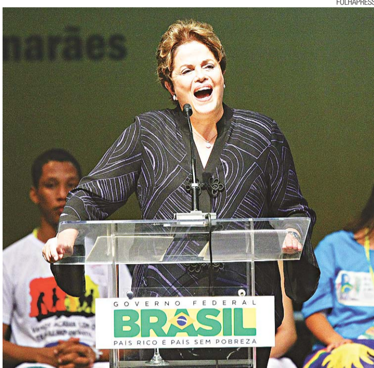
Para Dilma, agora, país deve ser medidos pelo que faz por suas crianças

Divulgado ontem, indicador de atividade econômica do Banco Central considerado como uma prévia do PIB apontou uma queda de 0,02% em maio em relação a abril. Apesar de o recuo ter sido menor que o esperado pelo mercado, ele sinaliza que a recupera-