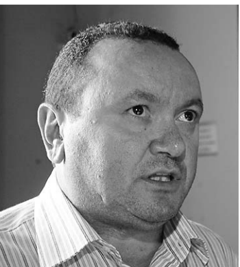
► Carlos Paiva, secretário de Segurança Pública e Defesa Social: atitude equivocada do sindicato

SERVIDORES MUNICIPAIS PROTESTARAM ontem em frente da Prefeitura de Natal contra o decreto lançado em maio que reduz o adicional noturno e a gratificação de encargos especiais (GEE) em 80%. Cerca de 50 manifestantes do Sindicato dos Serviços Públicos Municipais de Natal (Sinsinat) invadiram o Palácio Felipe Camarão. Três guardas municipais presentes não foram suficientes para deter a entrada dos manifestantes.