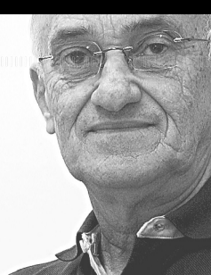
Albimar Furtado escreve nesta coluna às sextas-feiras