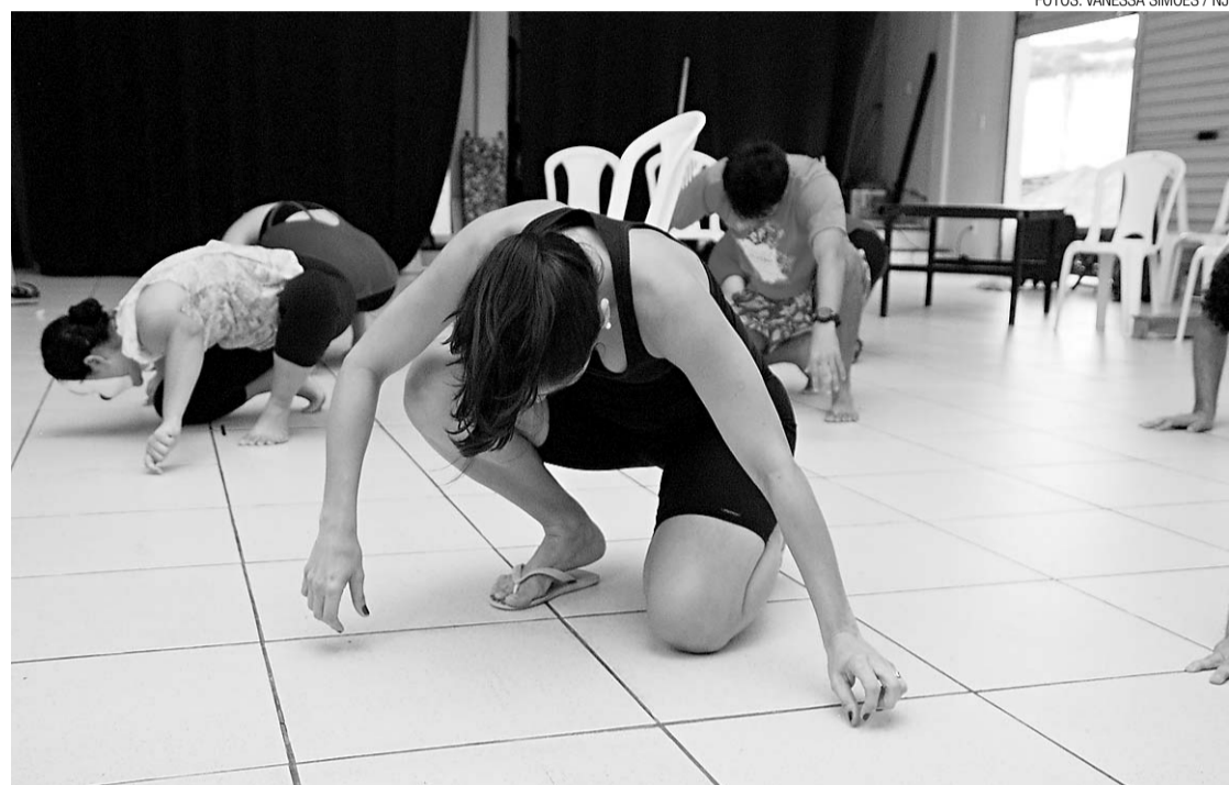
▶ A peça "Sua Incelelência, Ricardo III" está circulando ininterruptamente pelo país desde dezembro de 2010

Hamlet é uma tragédia de William Shakespeare, escrita entre 1599 e 1601. A peça, situada na Dinamarca, reconta a história de como o Príncipe Hamlet tenta vingar a morte de seu pai Hamlet, o rei, executando seu tio Cláudio, que o envenenou e em seguida tomou o trono, casando-se com a mãe de Hamlet.