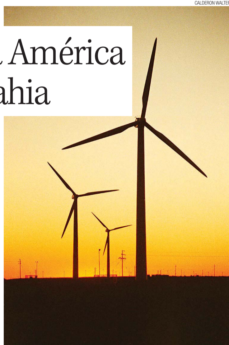
► Em 2020 a energia eólica deverá representar 7% da matriz energética

Segundo a assessoria de imprensa da Renova, desde sua abertura de capital até janeiro deste ano, as ações tiveram uma valorização de cerca de 74,3%.