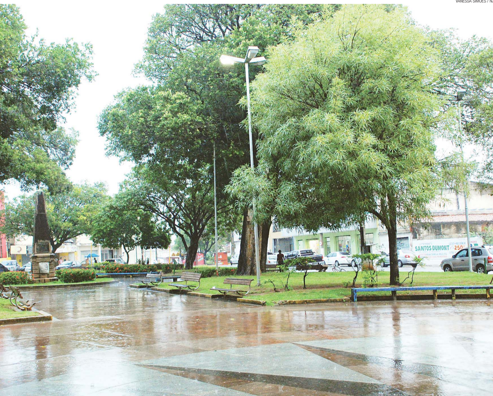
► Fiscalização da Secretaria de Mobilidade identificou endereço de escola na praça considerada marco zero da cidade