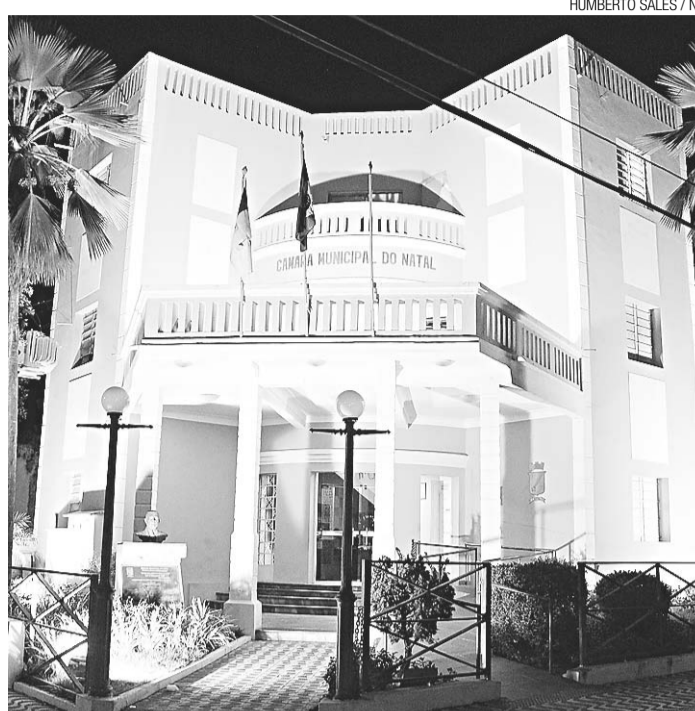
► Câmara Municipal: mais candidatos

Nenhum vereador da atual legislatura disputará o pleito pela coligação "Natal Merece Respeito II", que agrega os 64 pretensos candidatos do PMN, PSDC, PRTB e PSC. Por outro lado, a bancada do PP estará na "Natal Merece Respeito III", que apresentou 58 registros de