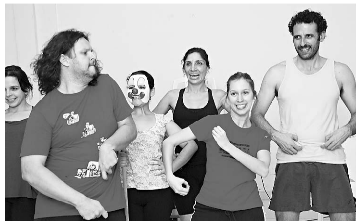
▶ Os últimos ensaios do grupo em Natal antes de partir para São Paulo