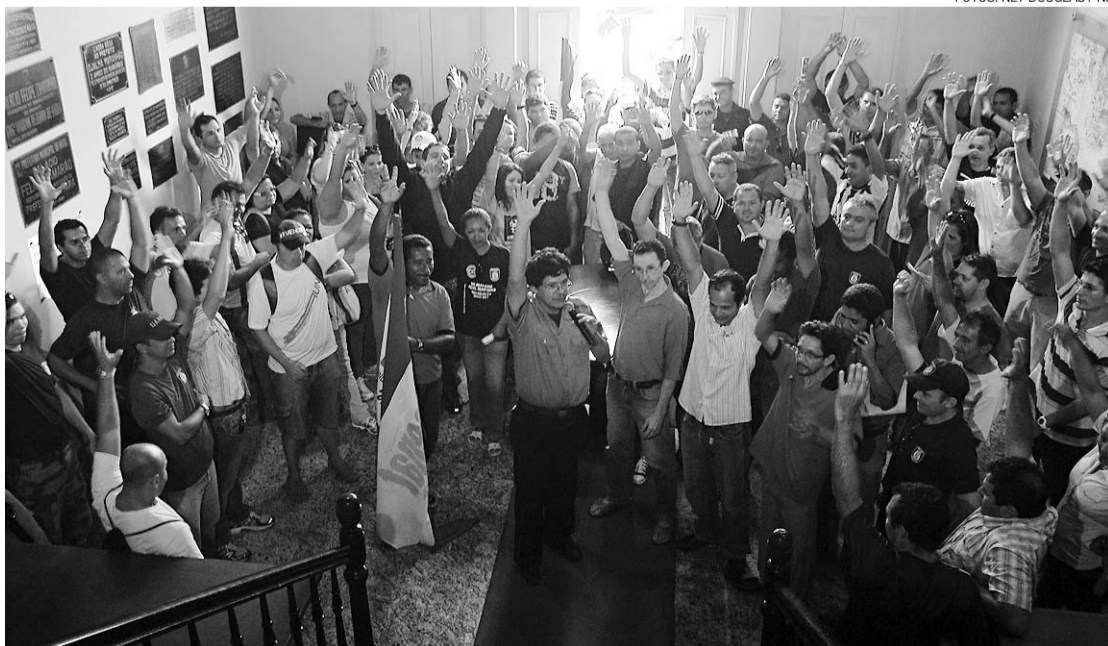
► Protesto dos servidores dentro da Prefeitura de Natal