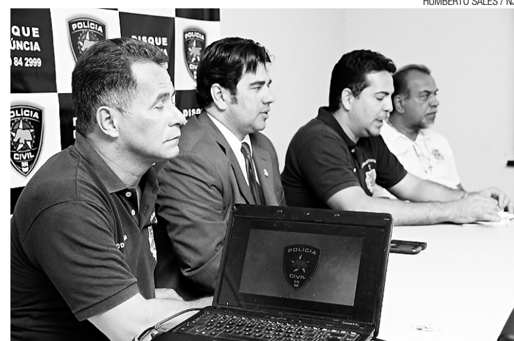
► Investigação uniu as polícias da Bahia, Pernambuco e Rio Grande do Norte