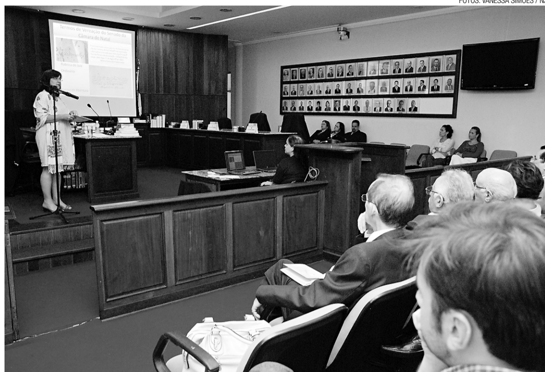
► Solenidade ontem abriu o ciclo de comemorações pelos 80 anos da justiça eleitoral