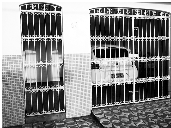
▶ Residência da família Almeida no bairro de Neópolis

No salão, a polícia identificou que foi realizada uma compra com um cartão de uma pessoa falecida no valor de R$ 25 mil. Segundo as investigações, quando precisava de dinheiro vivo, a quadrilha passava os cartões na distribuidora de bebidas e no salão de beleza. A polícia diz que eles abriam empresas fantasmas, realizavam compras a grandes fornecedores e, após não pagarem os produtos, fechavam o comércio para não serem localizados.