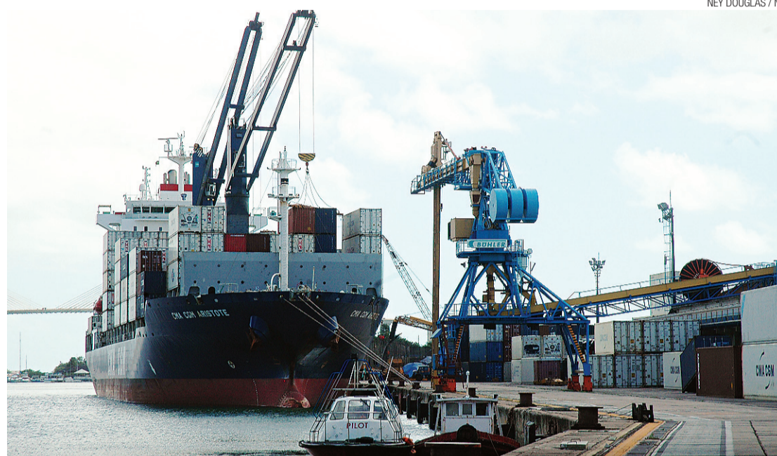
▶ Enquanto novo calado não é validado, navios de 60 mil toneladas continuam impedidos de entrar pelo Potengi

Orçado em R$ 34 milhões, o projeto das defensas já foi encaminhado à Secretaria Especial de Portos pela Codern, mas a companhia foi informada pelo ministro Cristino, que o projeto não é de