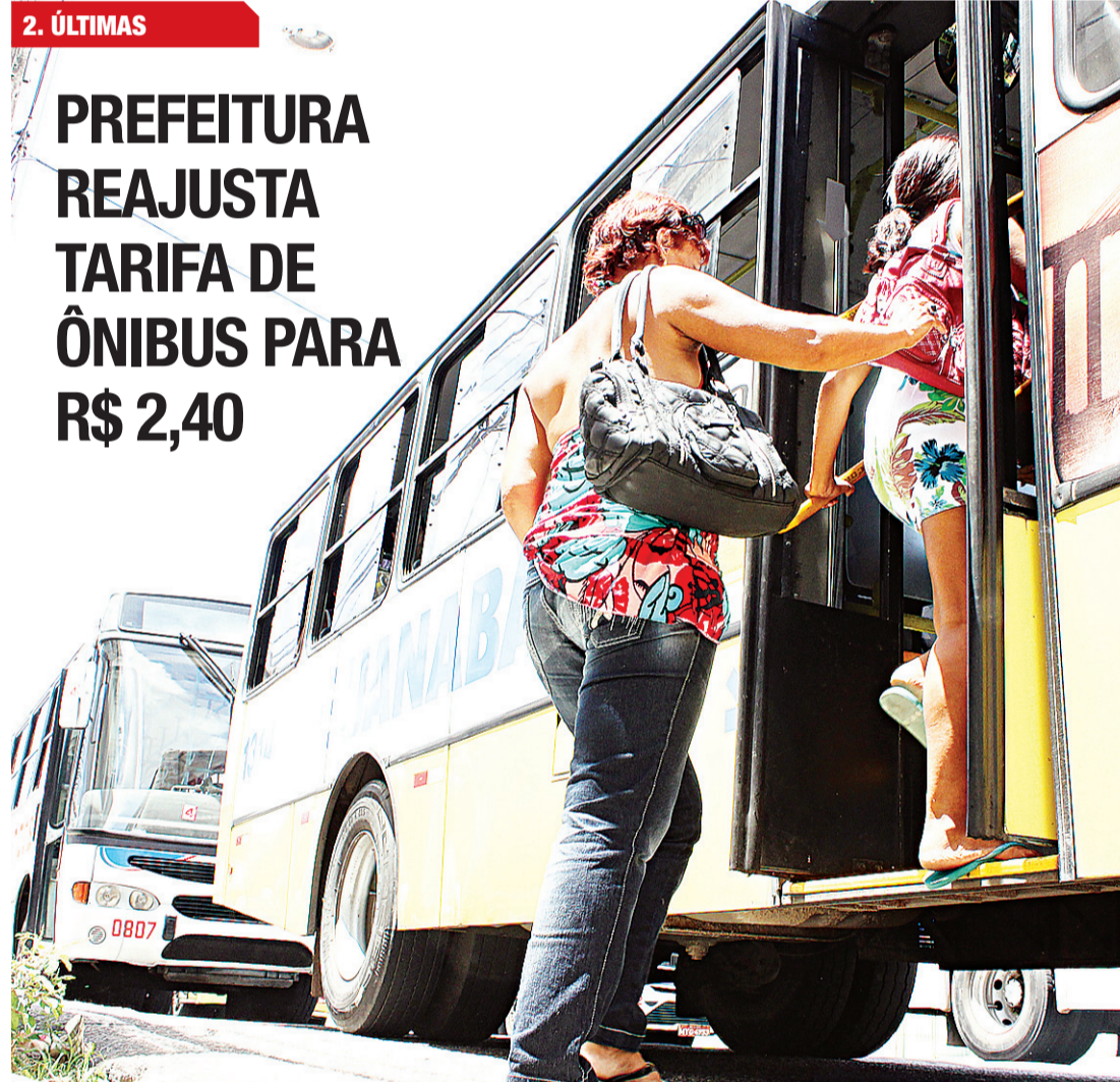
Medida que passa a vigorar hoje foi a forma encontrada para evitar "desequilíbrio econômico" do sistema