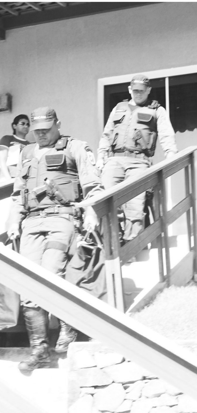
▶ Policiais carregam material apreendido na Secretaria de Saúde

Passados mais de três meses da deflagração da Operação Assespsia, o Ministério Público Estadual informou ontem que a denúncia mais abrangente sobre as investigações relativas a supostas fraudes na saúde municipal ainda não ocorreu e não tem prazo para que aconteça. Os promotores da Defesa do Patrimônio Público permanecem analisando documentos para embasarem novas denúncias à Justiça.