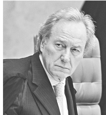
► Lewandowski, o relator

partes envolvidas apresentem defesa, antes de decidir sobre o pedido do Ministério Público. E é bastante provável que isso aconteça também no STF”, disse o advogado.