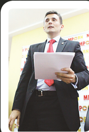
Procurador-geral de Justiça Manoel Onofre pediu afastamento da prefeita, mas desembargador requereu mais informação aos promotores