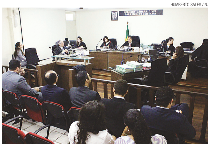
▶ Julgamento mais uma vez jogado para frente