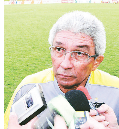
Meta do novo técnico é evitar o rebaixamento