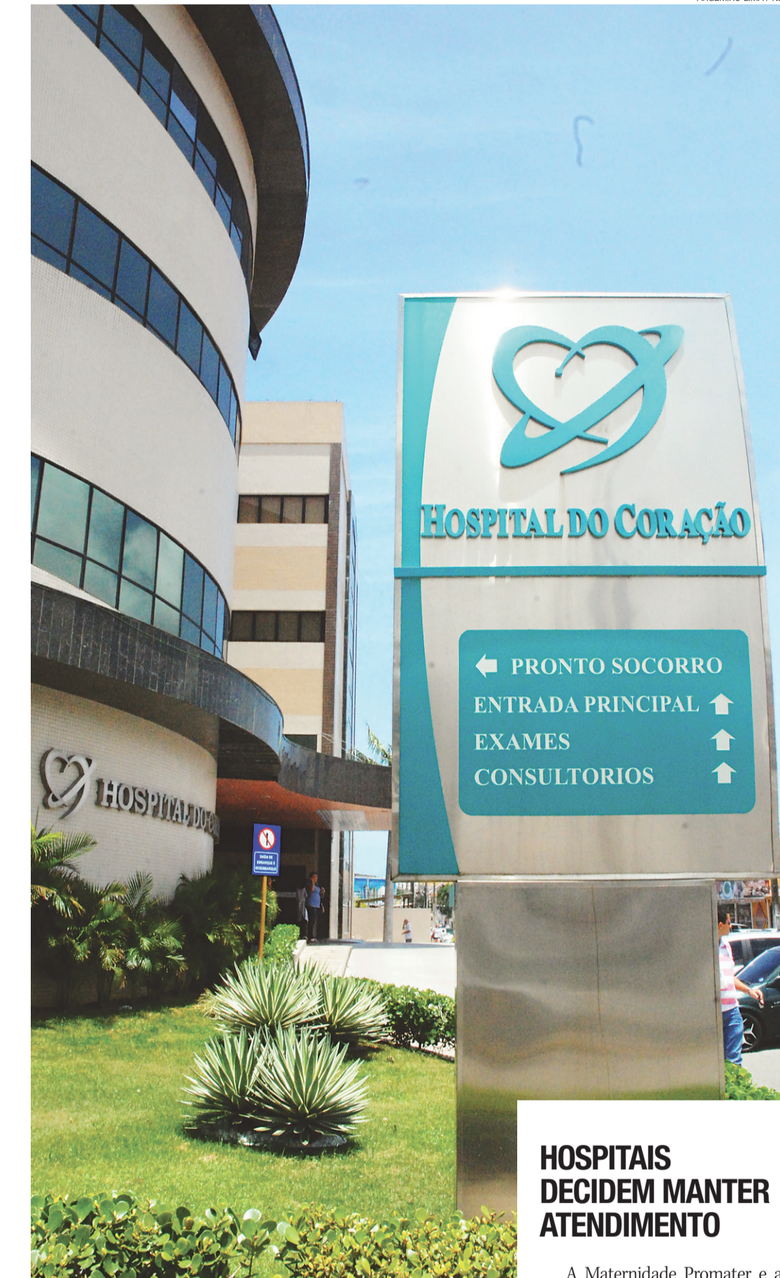
▶ Hospital do Coração atendia cerca de dois mil pacientes segurados pela Unimed por mês e fornecia 25 leitos para o convênio

O juiz também comentou sobre a liminar expedida na última terça-feira, que impede a paralisação do atendimento aos segurados Unimed por