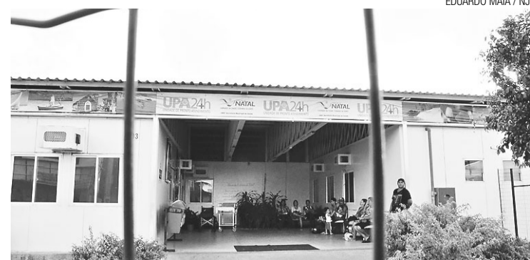
▶ UPA do Pajuçara tem contrato de terceirização até 7 de dezembro

O Ministério Público que, além das suspeitas de fraude nas contratações também tenham havido superfaturamento na prestação do serviço e consequente prejuízo para o erário público. Os indícios colhidos pelo Ministério Público através de quebras de sigilos dos investigados são considerados fortes e ratificados pela Justiça como "abundantes e incisivos".