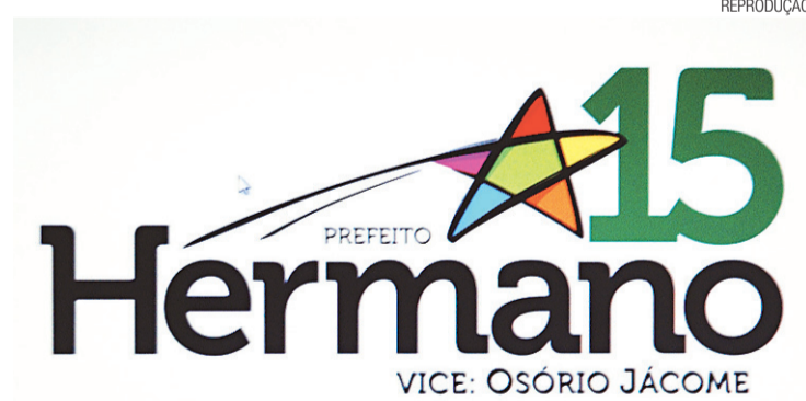
▶ Hermano está liberado para usar estrela na marca

A estrela de cinco pontas cuja simbologia atravessou séculos e nutre o imaginário esotérico dos seres humanos e da mesma forma tem sido usada como distintivo por comandantes militares e generais, também pode ser usada como marca da campanha eleitoral de Hermano Moraes (PMDB) neste segundo turno. Pelo menos foi assim que determinou o juiz do Segundo Cartório Eleitoral de Natal, José Dantas.