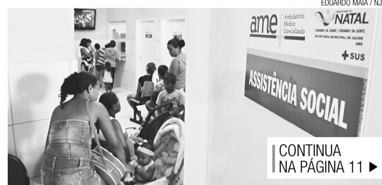
▶ AMEs também continuam sob intervenção judicial

É estimado que ocorram cerca de trezentos atendimentos diários e nove mil emergenciais mensais somente na UPA, sem contar com os serviços prestado pelas AMEs, cujos números não constam na decisão judicial. A providência prática adotada pela administração municipal foi notada no sábado, 29 de setembro passado. Nessa data, o Diário Oficial trouxe a publicação de abertura de processo público para escolha de um Organização Social para gerir a UPA de Pajuçara. As informações do documento esclarecem que o valor anual máximo a ser disponibilizado pelo Município para a prestação dos serviços será de R$ 11,8 milhões.