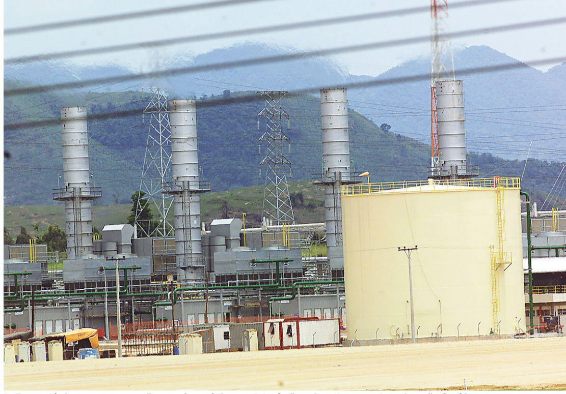
► Termoeletricas, como a que fica em Seropédica, no RJ, só são acionadas quando a situação é crítica

Como aumentou o risco de déficit no sistema, o operador determinou o acionamento das térmicas a óleo combustível. O ONS disse que o sistema de reservatórios de hidrelétricas no Sudeste e Centro-Oeste está 11,5% acima da