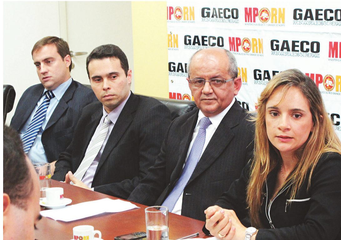
▶ Integrantes do Ministério Público durante entrevista à imprensa para explicar a Operação Drible