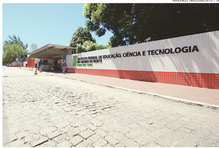
IFRN de Natal é uma das públicas entre as dez melhores no Estado

O resultado foi calculado de acordo com a soma das médias alcançadas em cada uma das