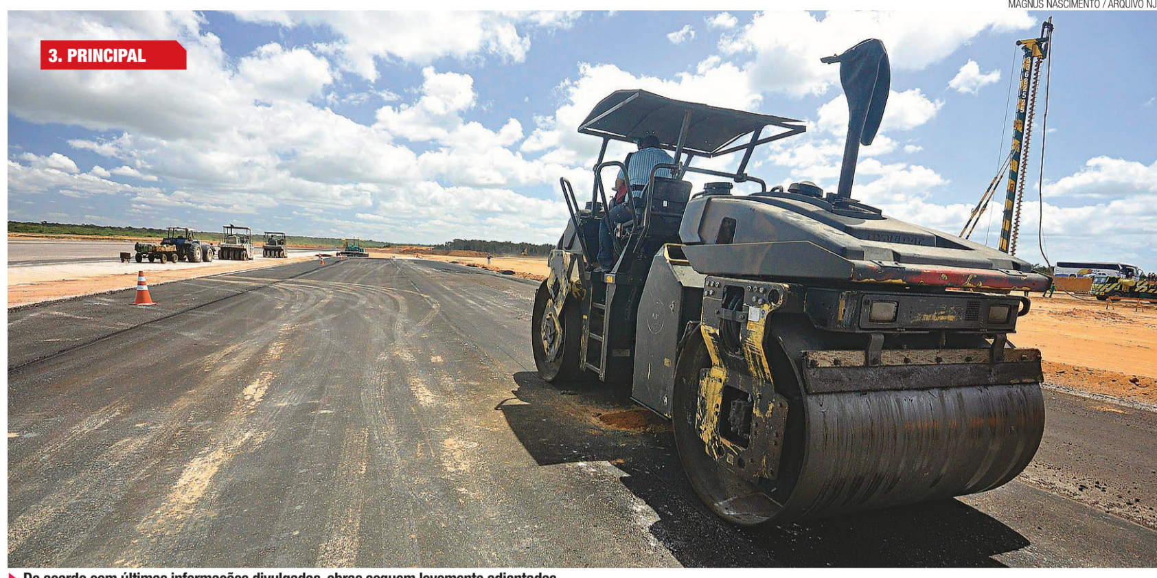
MAGNUS NASCIMENTO / ARQUIVO NU