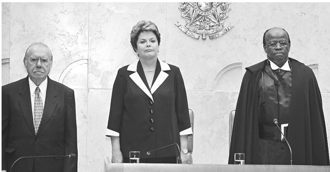
► José Sarney e Dilma Rousseff participaram da cerimônia na mesa de Joaquim Barbosa

/ STF / POSSE DE JOAQUIM BARBOSA TEM HOMENAGENS, DISCURSOS E CRÍTICAS À DESIGUALDADE