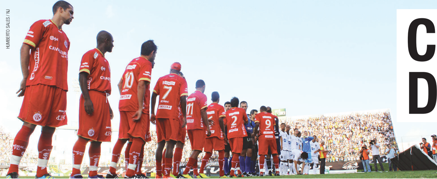
► No último clássico no Frasqueirão, deu América