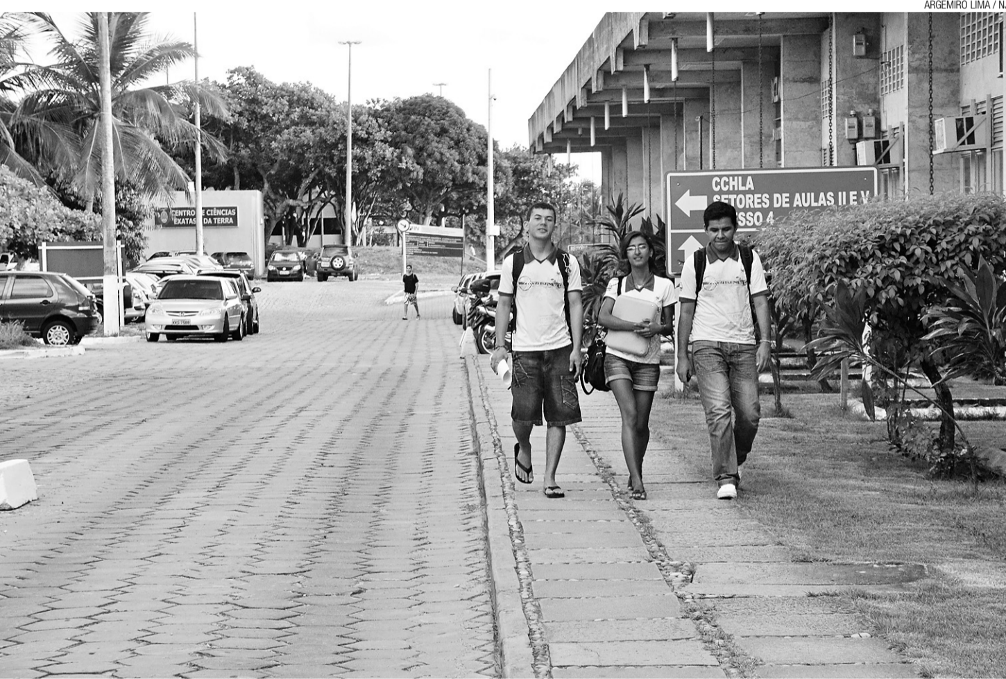
► Sistema de Seleção Unificada garante ingresso ao ensino superior

O resultado desta primeira chamada será divulgado no dia 14 e o da segunda chamada, no dia 28 de janeiro, no site do Sisu e das instituições. Os aprovados na primeira chamada farão o cadastramento no período de 18, 21 e 22 de janeiro de 2013; na segunda chamada, no período de 1º, 4 e 5 de fevereiro de 2013.