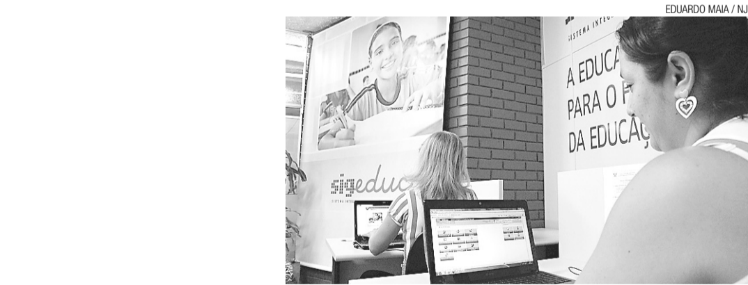
► Matrículas pelo Sistema Integrado de Gestão da Educação