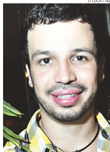
D'LUCA / UJ

Caldas também acrescentou que esse mandado de segurança foi julgado à unanimidade pelo Pleno do TJRN, e não pelo desembargador Rafael Godeiro, “conforme fez parecer a reportagem”. No texto publicado na edição de ontem, o afirmado era que Godeiro