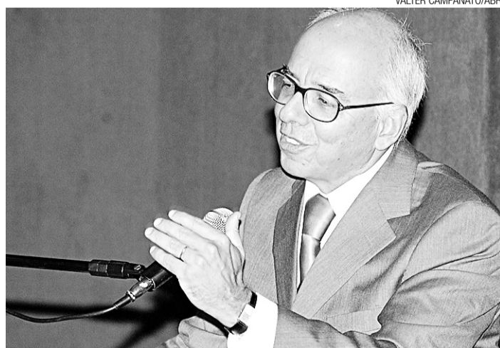
▶ Cláudio Fonteles afirma ter provas do crime contra Rubens Paiva

Ele pedia a prisão imediata, independentemente da publicação do acórdão e julgamento dos recursos, mas o presidente do Supremo argumentou que tal atitude não poderia ser tomada por contrariar a jurisprudência da corte.