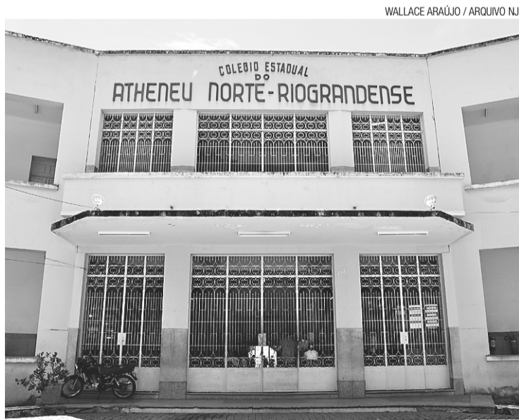
► Atheneu Norte-Riograndense: prédio será recuperado

Ainda segundo ela, já é sabido que os principais problemas de infraestrutura do prédio residem nas partes hidráulica e elétrica, além da necessidade de troca de parte das janelas