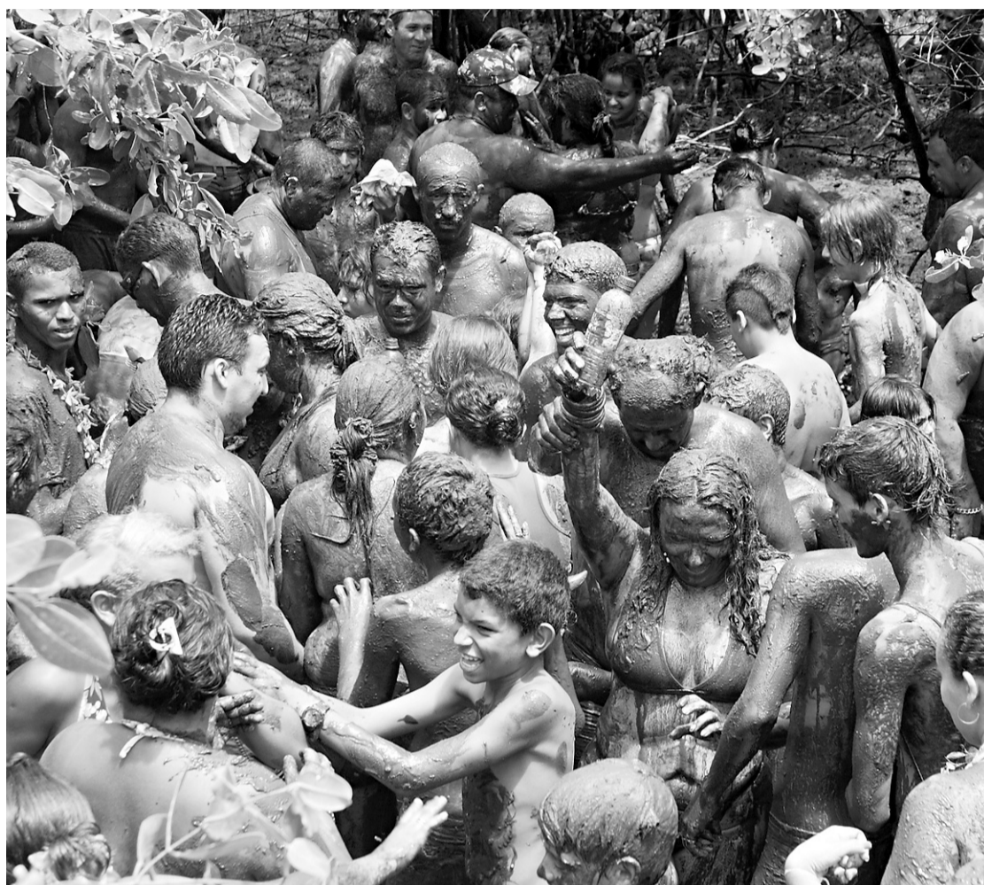
▶ Grupos como Os Cão, da Redinha, tradicionalmente recebem recursos da prefeitura, através da Fundação Capitania das Artes, para agitar na folia de rua da cidade

O edital para escolha do Rei Momo e da Rainha do Carnaval deve ser publicado hoje. “Com certeza o orçamento será menor. Seria até uma afronta manter o mesmo nível de gastos dos anos anteriores, frente ao estado de calamidade em que se encontra Natal”, fala ele.