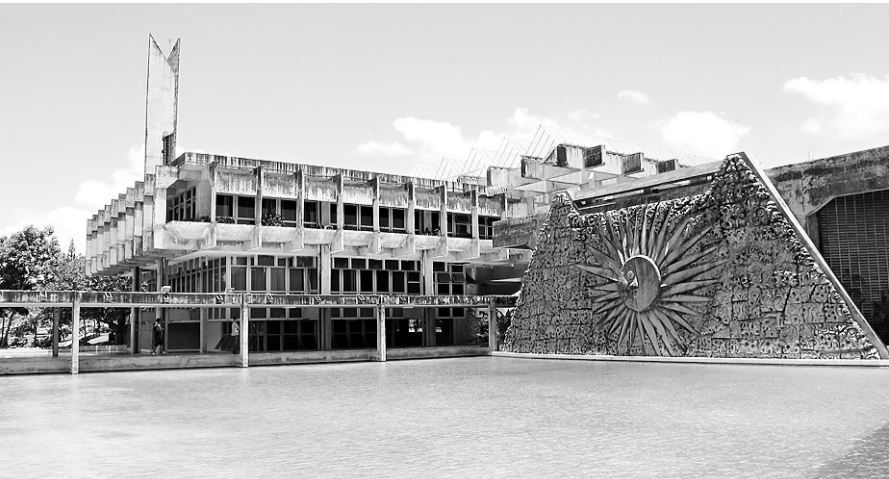
► Acesso à UFRN agora será pelas notas do Enem