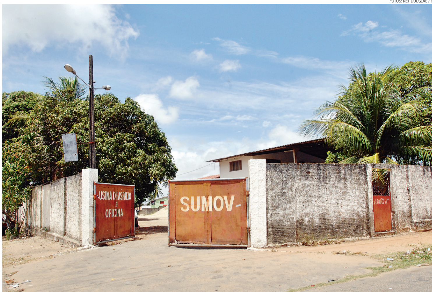
► Construída há 30 anos, sede da Usina Municipal de Asfalto fica localizada na Rua Poeta Camões, em Bom Pastor

Hoje, Natal possui cinco usinas privadas de asfalto. Para o presidente do Sinduscon, as empresas estão "com um pé atrás" para aceitar contratos com a Prefeitura de Natal. Nos últimos quatro anos, foram constantes os atrasos de pagamento e o descumprimento de contratos. "Nós sabemos como inicia, mas não sabemos como terminar um contrato. Para a prefeitura alcançar um preço mais competitivo, e diminuir ainda mais os custos de manutenção, é preciso de uma coisa bem simples: pagar em dias os serviços contratados", finalizou.