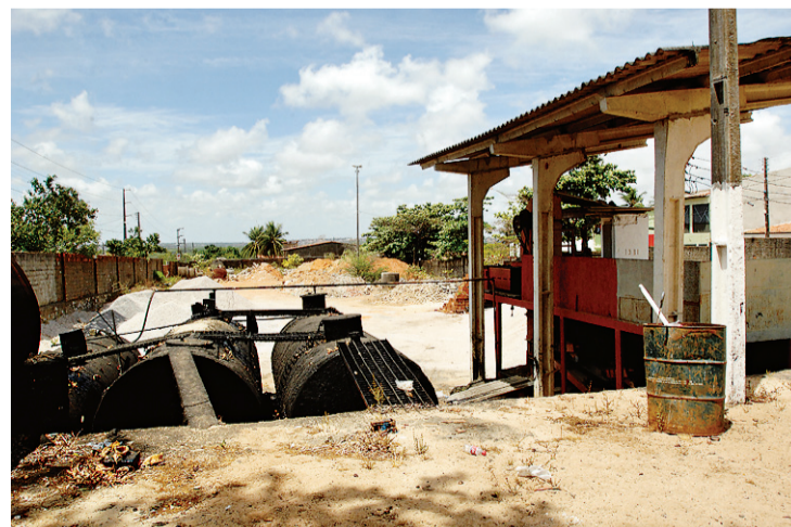
► Usina asfáltica chegou a produzir 60 toneladas de asfalto por mês