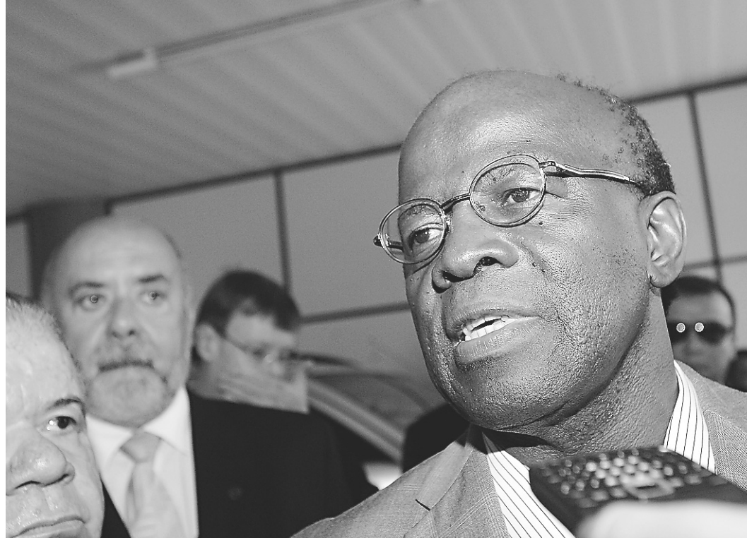
▶ Joaquim Barbosa disse que gostaria de encerrar o processo do Mensalão ainda no primeiro semestre de 2013

“Os preparativos para a publicação foram tomados nesta madrugada e creio que tudo será ultimado até a tarde de hoje [ontem] e será publicado na segunda-feira”, disse, realçando que fica mantido o prazo de 10 dias para a defesa dos réus condenados interpor embargos à decisão. O documento conclusivo terá