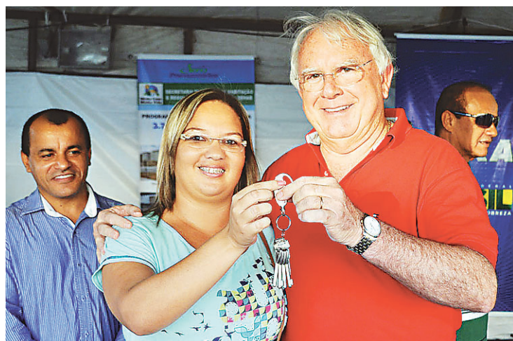
► Prefeito Maurício Marques entrega a chave de um dos apartamentos

beneficiando a estas famílias, não por conveniência eleitoral, porque este programa independente de política, mas depende de planejamento, organização e visão de trazer dignidade à popu-