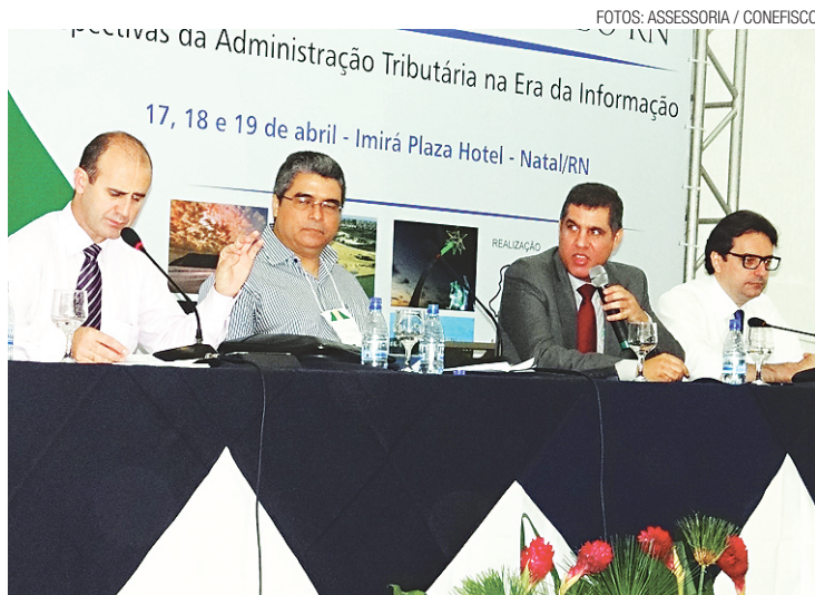
► Mesa do IX Conefisco: pequenos podem perder com queda de alíquotas

De acordo com ele, a modernização do sistema está causando um impacto positivo na estru-