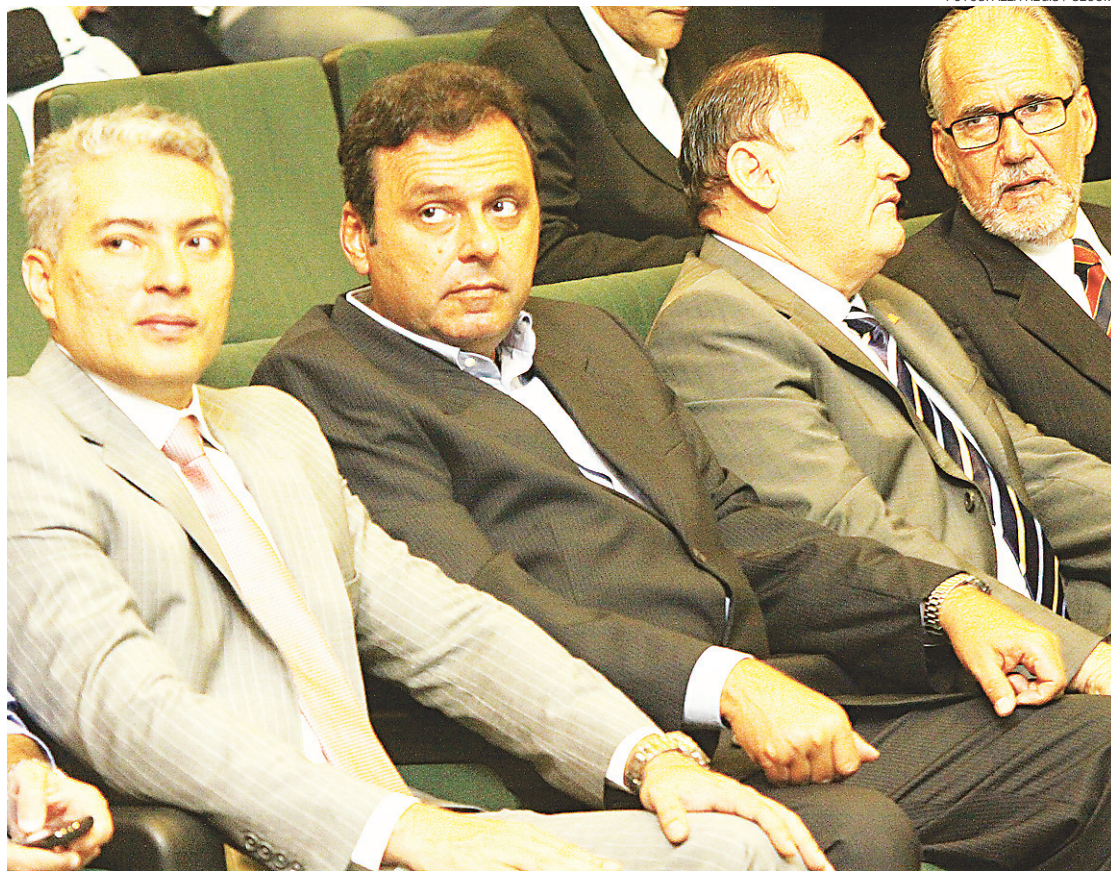
▶ Meta da prefeitura é auditar a folha de pagamento e recuperar capacidade de investimento do município

grande que primeiro vai se atacar os pontos mais inflamados que são a reforma administrativa e, sobretudo, a auditoria na folha de pagamento, um trabalho que envolve receita e despesa.