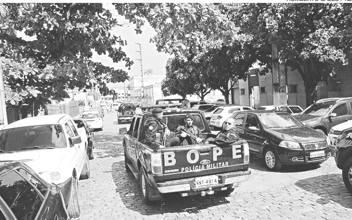
► Força-tarefa integra tropas de elite das polícias Civil e Militar