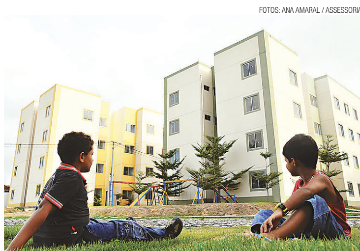
► Crianças brincam na área de lazer do condomínio

Ele avisou ainda que a escritura pública está sendo doada pelo município e que, durante dez anos nenhum dos moradores pagará o Imposto sobre a Propriedade Predial e Territorial Urbana (IPTU). "Estamos