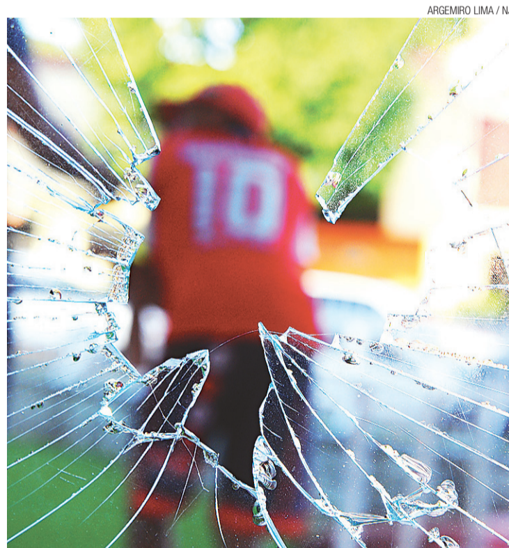
▶ Sede do América foi avariada por integrantes da organizada do próprio clube