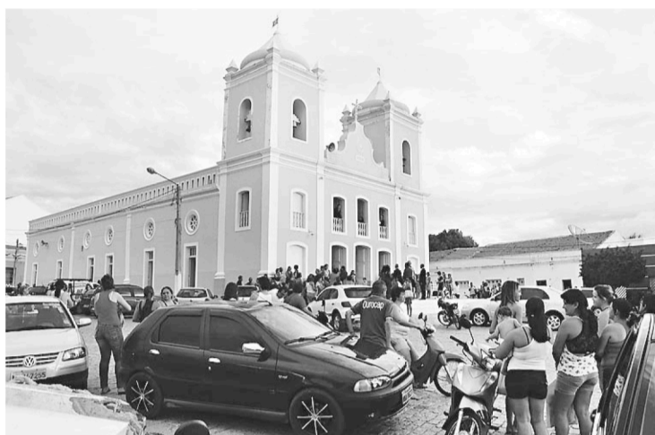
▶ Após a tradicional chuva de arroz, casal e convidados seguiram para a festa na quadra de esportes de um colégio da cidade; evento mobilizou a população