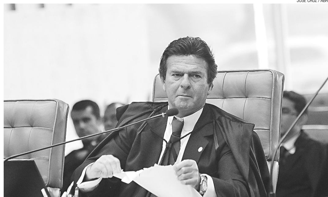
► Ministro do STF, Luiz Fux, condenou o ex-chefe da Casa Civil, José Dirceu, mas tem idoneidade contestada

Nos últimos meses, Fux também tem sido alvo de críticas de petistas por ter admitido em entrevista ter procurado Dirceu em busca de apoio para sua indicação ao STF. No julgamento, Fux foi um dos