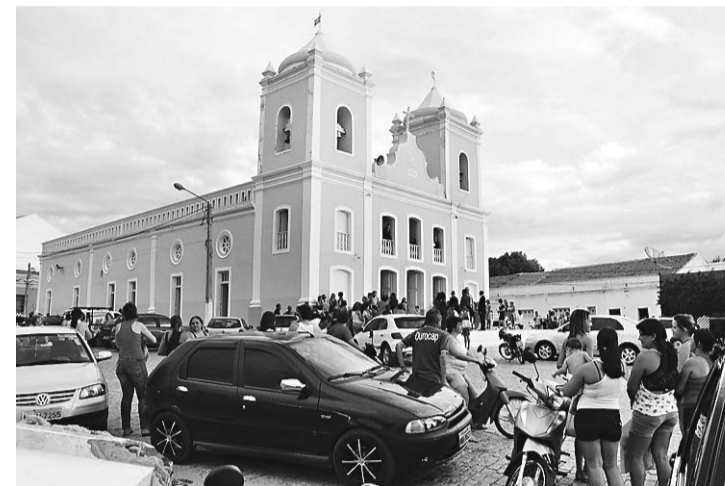
▶ Após a tradicional chuva de arroz, casal e convidados seguiram para a festa na quadra de esportes de um colégio da cidade; evento mobilizou a população