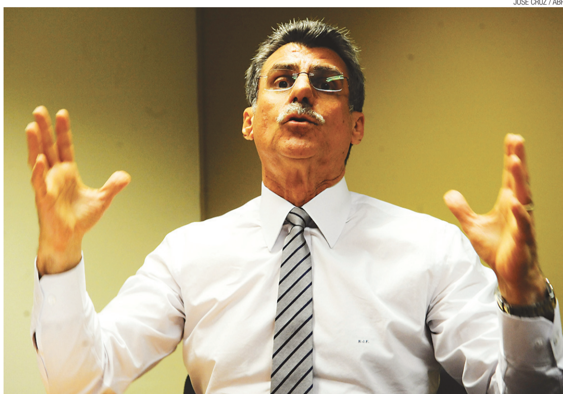
► Romero Jucá diz que patrão não é empresário e quer diminuir multa do FGTS para 10%

"Muitas vezes, o trabalhador vai ter que trabalhar mais que as 10 horas diárias. É o caso de uma babá que cuida de uma criança doente, por exemplo, que terá que acordar à noite para atendê-la. A proposta permite fazer a compensação ou pagar a hora extra no final do mês", disse.