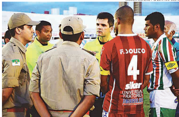
▶ Clássico Potiba começou com mais de duas horas de atraso

O atraso para o início de jogo no clássico de Mossoró ocorreu porque o árbitro da partida, Ítalo Medeiros de Azevedo, foi avisado pelo representante do Cor-