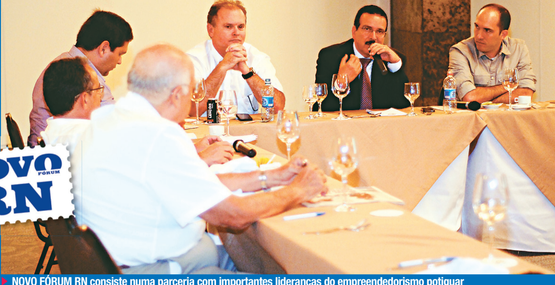
NOVO FÓRUM RN consiste numa parceria com importantes lideranças do empreendedorismo potiguar