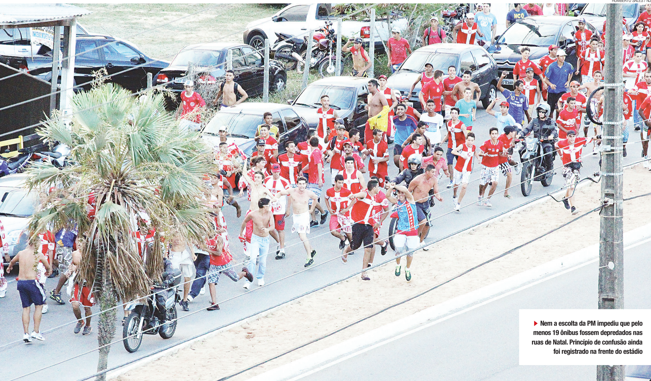
▶ Nem a escolta da PM impediu que pelo menos 19 ônibus fossem depredados nas ruas de Natal. Princípio de confusão ainda foi registrado na frente do estádio