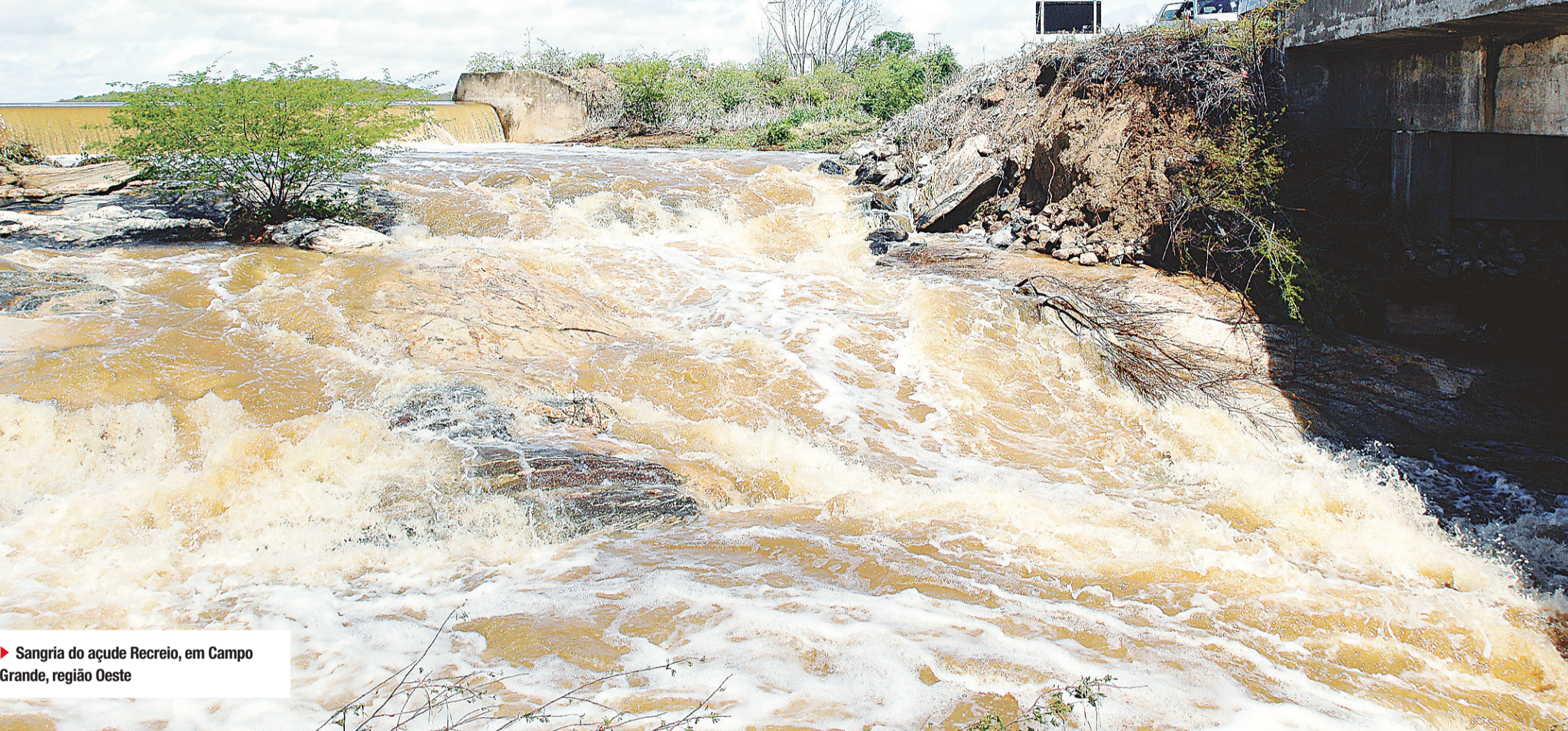
► Sangria do açude Recreio, em Campo Grande, região Oeste

/ TEMPO / FIM DE SEMANA CHUVOSO TRAZ ESPERANÇA PARA OS AGRICULTORES CASTIGADOS PELA SECA