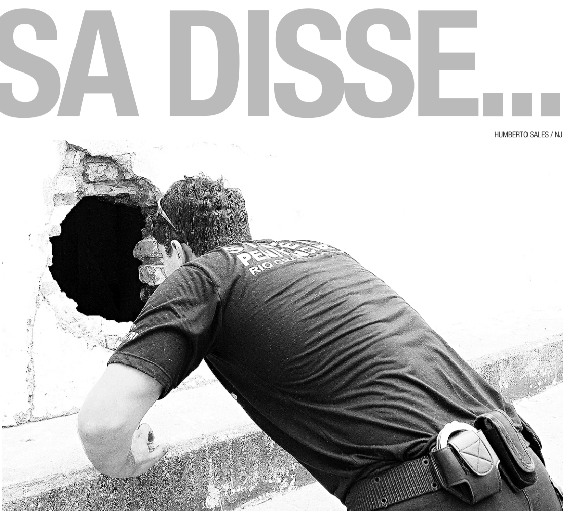
► Durante rebelião no CDP da Ribeira, detentos abriram um buraco com diâmetro suficiente para um homem passar

/ CAOS / MENOS DE DOIS DIAS DEPOIS QUE O PRESIDENTE DO STF ALERTOU PARA A PRECÁRIA SITUAÇÃO DO SISTEMA CARCERÁRIO POTIGUAR, DETENTOS PROMOVEM REBELIÃO E FOGEM