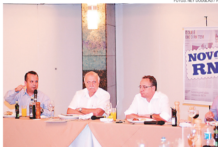
► Lançamento do Fórum no hotel Ocean Palace

A grande diferença do formato dessa reunião de líderes é que, ao invés de o assunto ser do comando, atender ao toque da varinha de condão do conferencista ou convidado, o ator principal será o líder de determinado segmento. "De determinado setor que vem aqui para discutir o Estado. O Novo Fórum RN é o Rio Grande do Norte discutido por quem faz o Rio Grande do Norte", define Câmara.