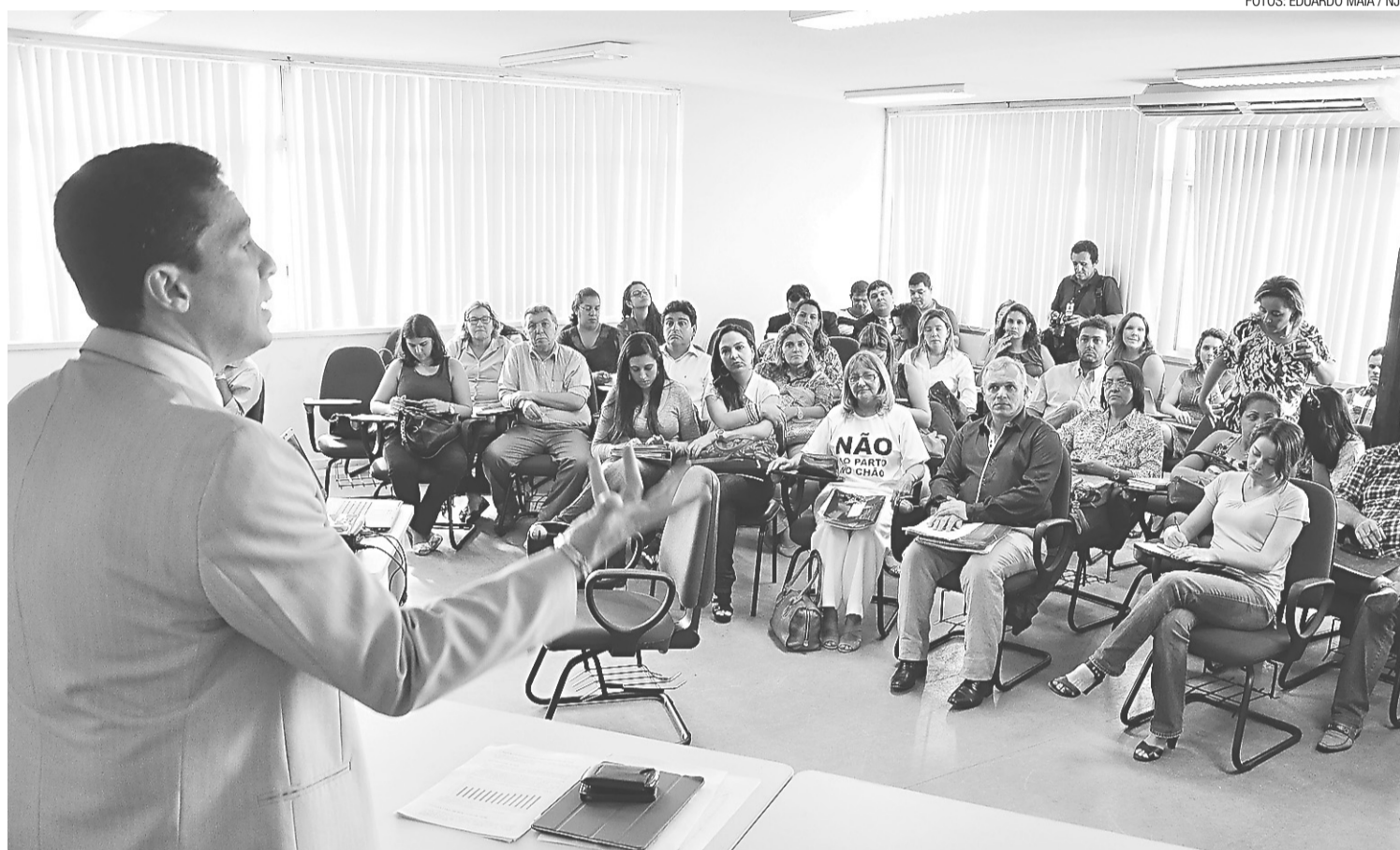
► Reunião na secretaria estadual de Saúde contou com titular da pasta e representantes da maioria dos municípios parceiros no planejamento