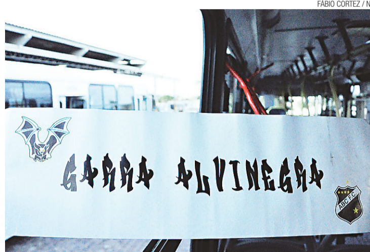
▶ Torcidas voltaram a dar prejuízo às empresas de transporte coletivo