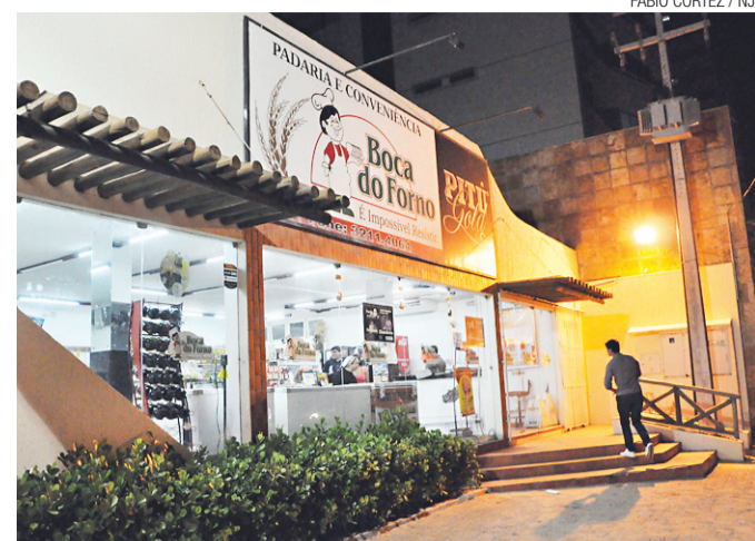
► Padaria Boca do Forno, no Tirol: assalto em horário de pico