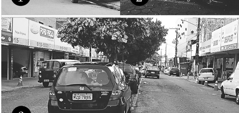
2. Na rua Jundiá, a faixa de pedestres não é respeitada, conforme flagra de Argemiro Lima (NJ)