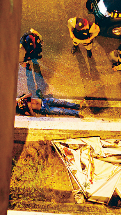
Estudante foi socorrido no local, pela PRF