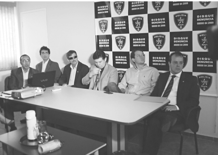
► Cúpula da Segurança Pública durante coletiva à imprensa