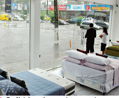
Em Natal, os alagamentos se repetem

Ministro da Agricultura, Antônio Andrade, confirma que Estado é zona livre da febre aftosa, mas adia oficialização desse status alegando atraso na sorologia da Paraíba.