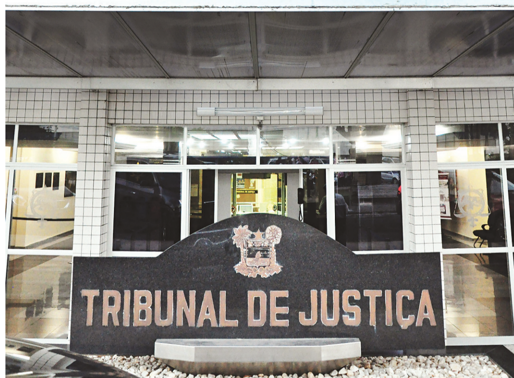
► Tribunal de Justiça tem 1.350 processos pendentes