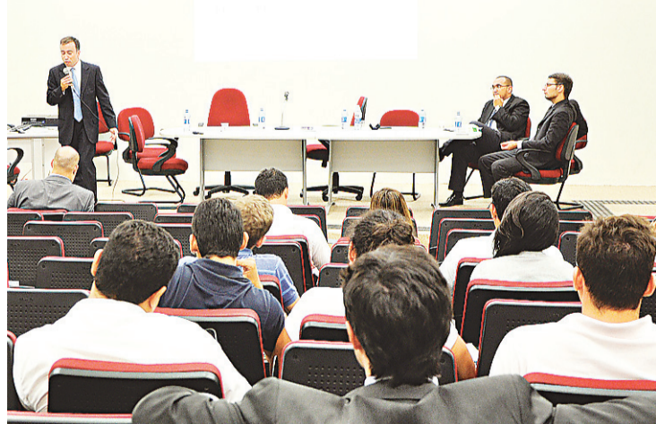
► Jurista fala no auditório de pós-graduação de Direito: tema atual

O licenciamento é emitido pelo Instituto de Desenvolvimento Sustentável e Meio Ambiente (Idema) e depois cassado pelo