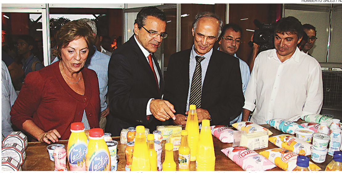
► Governadora Rosalba Ciarlini, presidente da Câmara, Henrique Alves, e ministro Antônio Andrade visitam feirinha

Com o atraso da Paraíba, em relação aos outros sete estados nordestinos que ainda estão no patamar de risco médio, e a decisão do Ministério da Agricultura por um evento único, os produtores potiguaros precisarão espe-