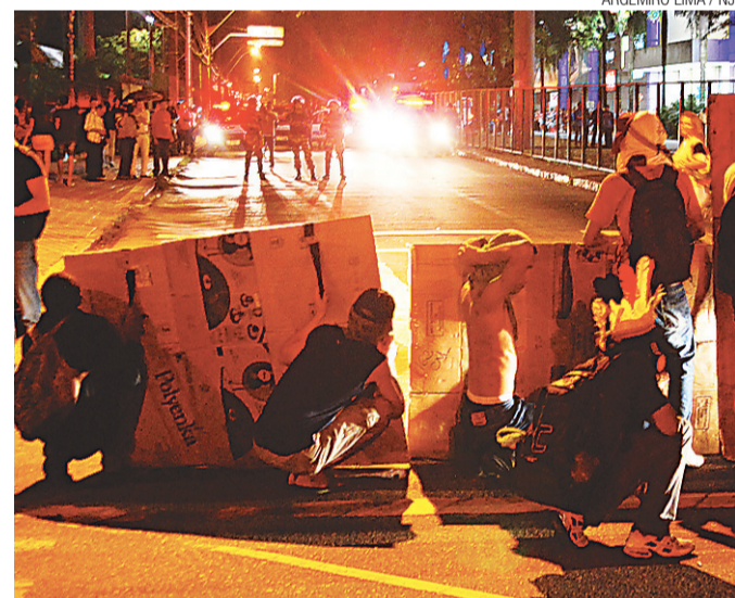
▶ Estudantes montam barricada diante dos policiais

O Tribunal concluiu explicando que, aplicados os devidos descontos, o valor líquido recebido pelo desembargador no mês de abril, de R$ 29.322,39, decorre da soma de sua remuneração e da parcela de natureza indenizatória.