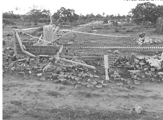
► Terreno que teria motivado crime fica em São Gonçalo