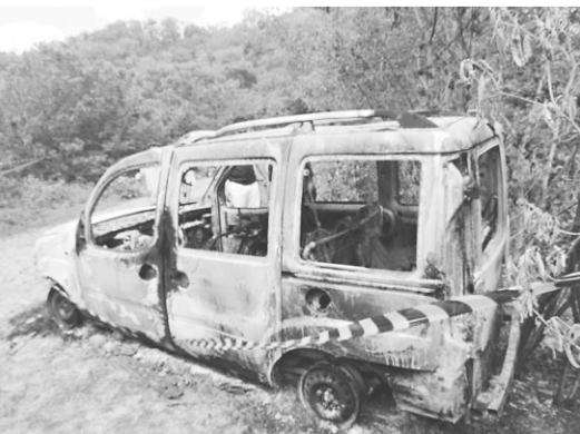
► O carro usado no crime foi incendiado no Ceará

No terreno, ele disse que pretendia construir uma “granjinha e um mercadinho”. “Tão botando culpa em mim porque eles pegaram o meu carro e fizeram o crime. Eu não criminoso. Não sou ladrão. Não sou bandido. Será o que Deus quiser. Sou evangélico. Se eu merecer, Deus sabe”.