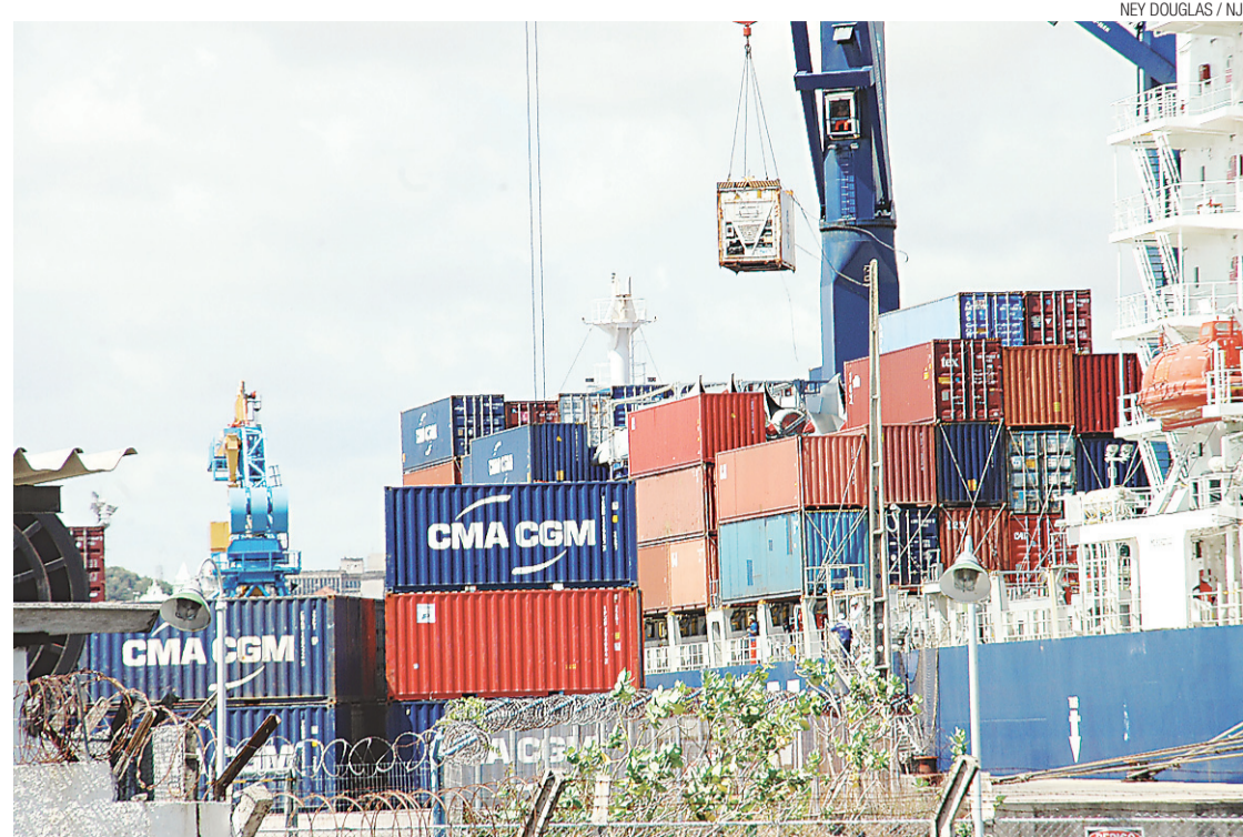
▶ Porto de Natal é considerado gargalo pelo setor produtivo potiguar, que ganharia com novo terminal