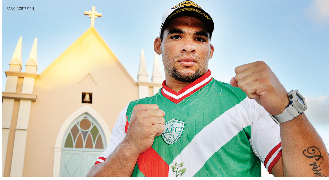
EXEMPLAR DE ASSINANTE

Somente esta semana já choveu 40% de tudo que estava previsto para chover no mês junho e as precipitações devem continuar.