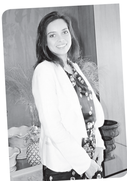
► Ysnara Almeida da artefacto | home.D

A Colônia Assuense em Natal promove amanhã, a partir das 8h, missa seguida de café da manhã na igreja de Nossa Senhora do Líbano, na rua Dr. José Borges, 1841, em Lagoa Nova. Em seguida, ao meio dia, haverá confraternização dançante na AABB, Hermes da Fonseca, com as bandas Carcará e Artenisa Show.