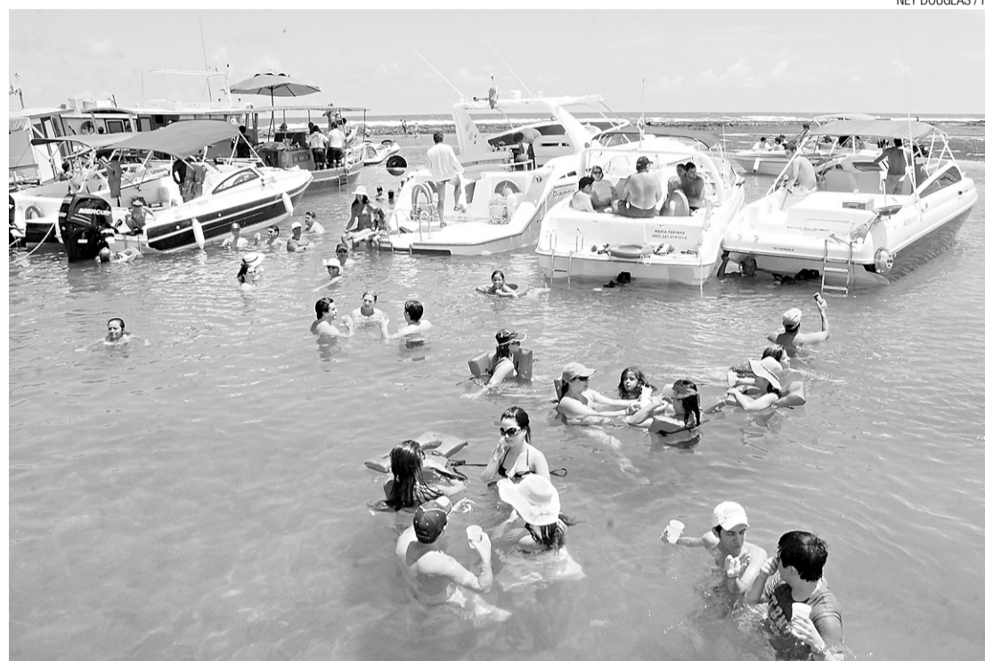
► Parrachos de Pirangi, atração turística do litoral sul do Rio Grande do Norte

O referido compromisso também prevê outras normas