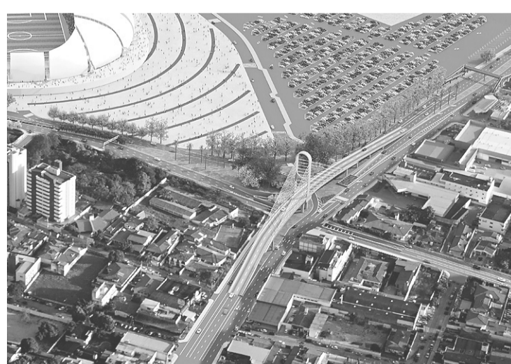
▶ Áreas próximas ao estádio, como Prudente de Moraes, sofrerão intervenções

Pelo projeto apresentado pela Prefeitura, o primeiro grande empecilho é a construção do viaduto estaiado da Avenida Prudente de Moraes. Esta intervenção é considerada uma das partes mais complexas e demoradas da obra e interdirá uma faixa inteira da via. Mas ela não é a única que atenta