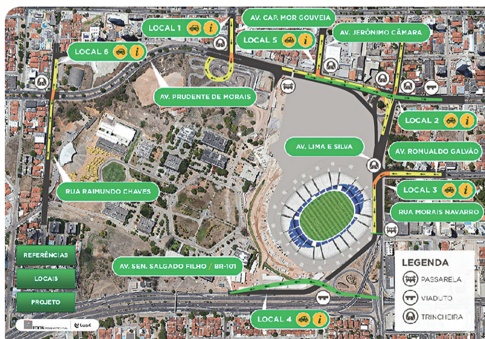
► Mapa disponibilizado pela Prefeitura mostra que intervenções se sobrepõem a espaço da festa