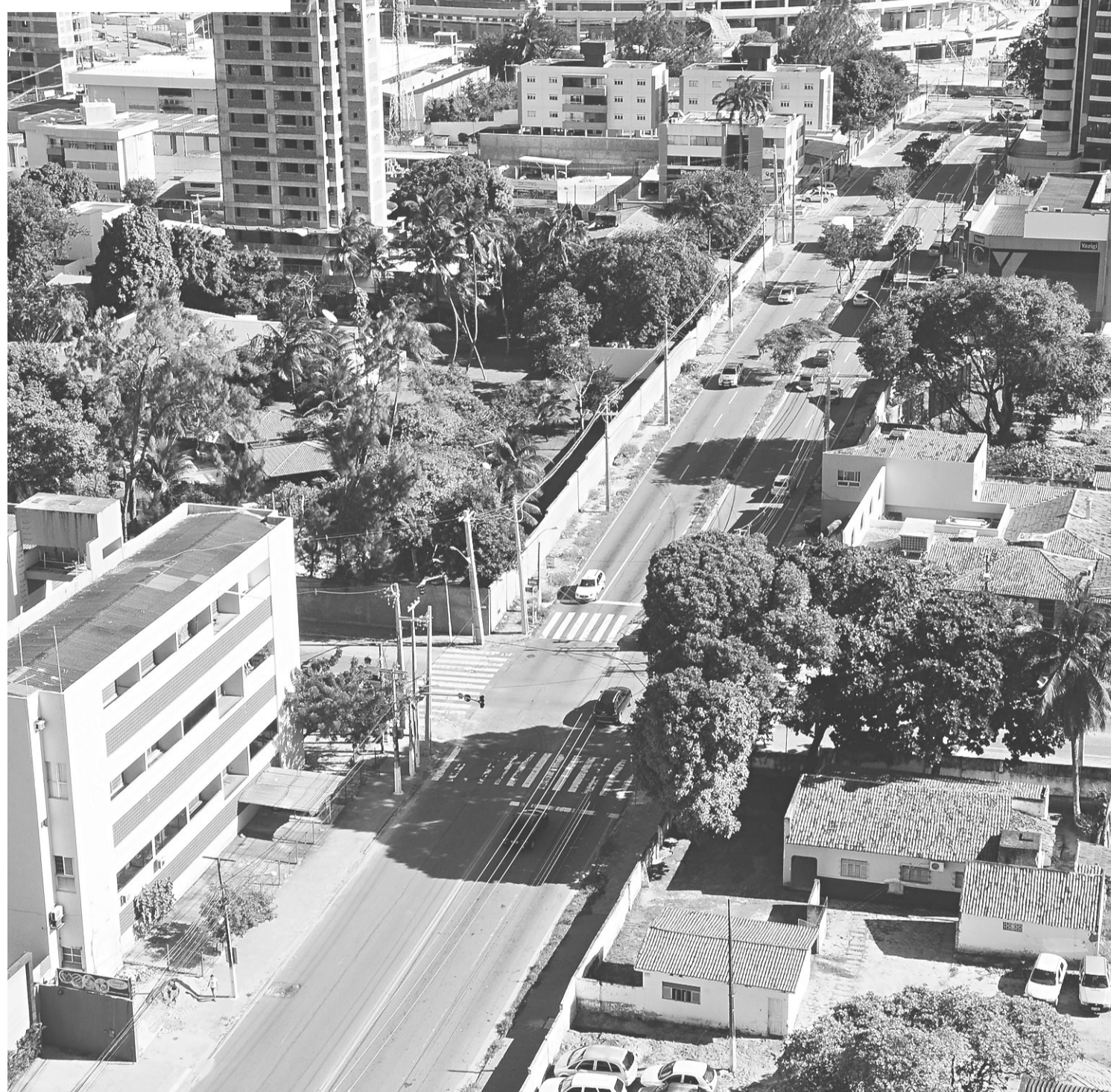
▶ Acesso à Avenida Romualdo Galvão, por onde tradicionalmente blocos e trios elétricos desfilam, estará comprometido com a construção de um túnel