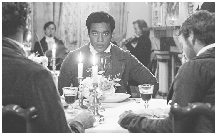
► Filme de Steve McQueen, "12 Years a Slave" recebe elogios da crítica

No filme, Meryl Streep faz a personagem Violet, a matriarca da família Weston, que é reunida à força quando seu marido, Beverly, vivido pelo ator Sam Shepard, desaparece.