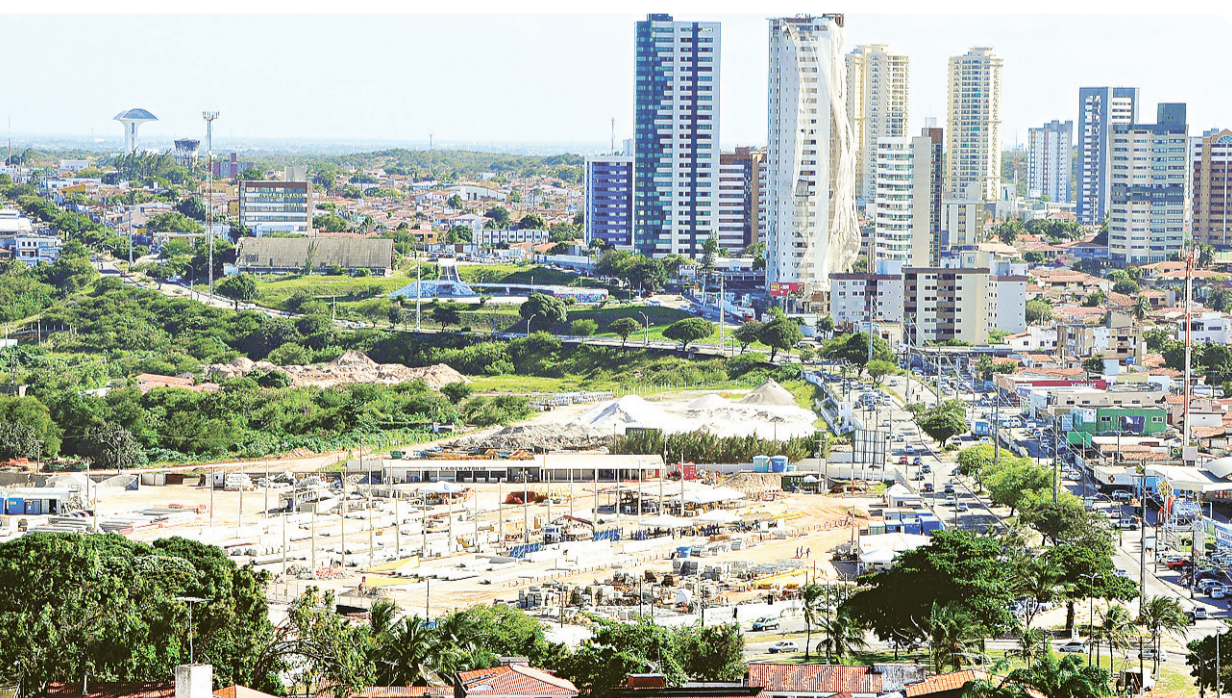
► Pelo anunciado, ao lado do Arena das Dunas, será instalado um outro canteiro de obras, na Prudente, onde seria o corredor da folia