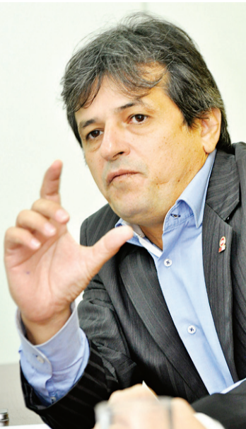
▶ Rinaldo Reis, procurador geral de Justiça: recomendação ao governo