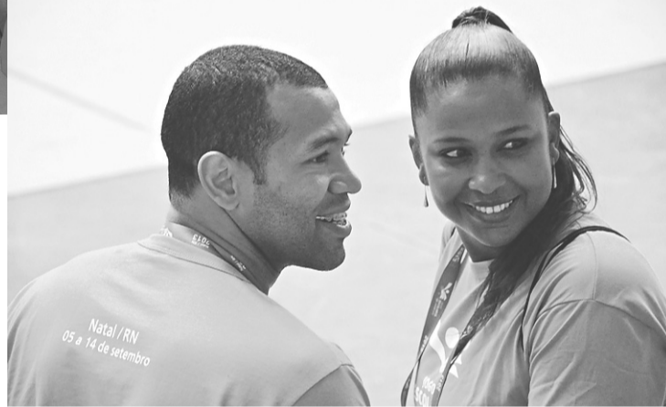
► ...acompanharam jogo do feminino: motivação para os jovens atletas

"Eles vêm até a gente, pedem fotos. É importante sempre nós termos essa oportunidade de conversar com eles, dar força, não deixá-los desistir", ressalta Maik.