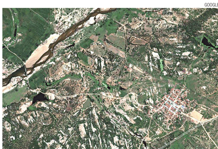
► O Rio Piranhas e a vila de Barra de Santana (à direita), que deve ser inundada

O cronograma financeiro da obra tem assegurado R$ 8 milhões para desapropriações e R$ 11,5 milhões para reassentamento.