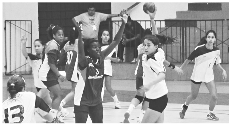
► Confronto entre Rio de Janeiro e Mato Grosso do Sul no ginásio da UFRN