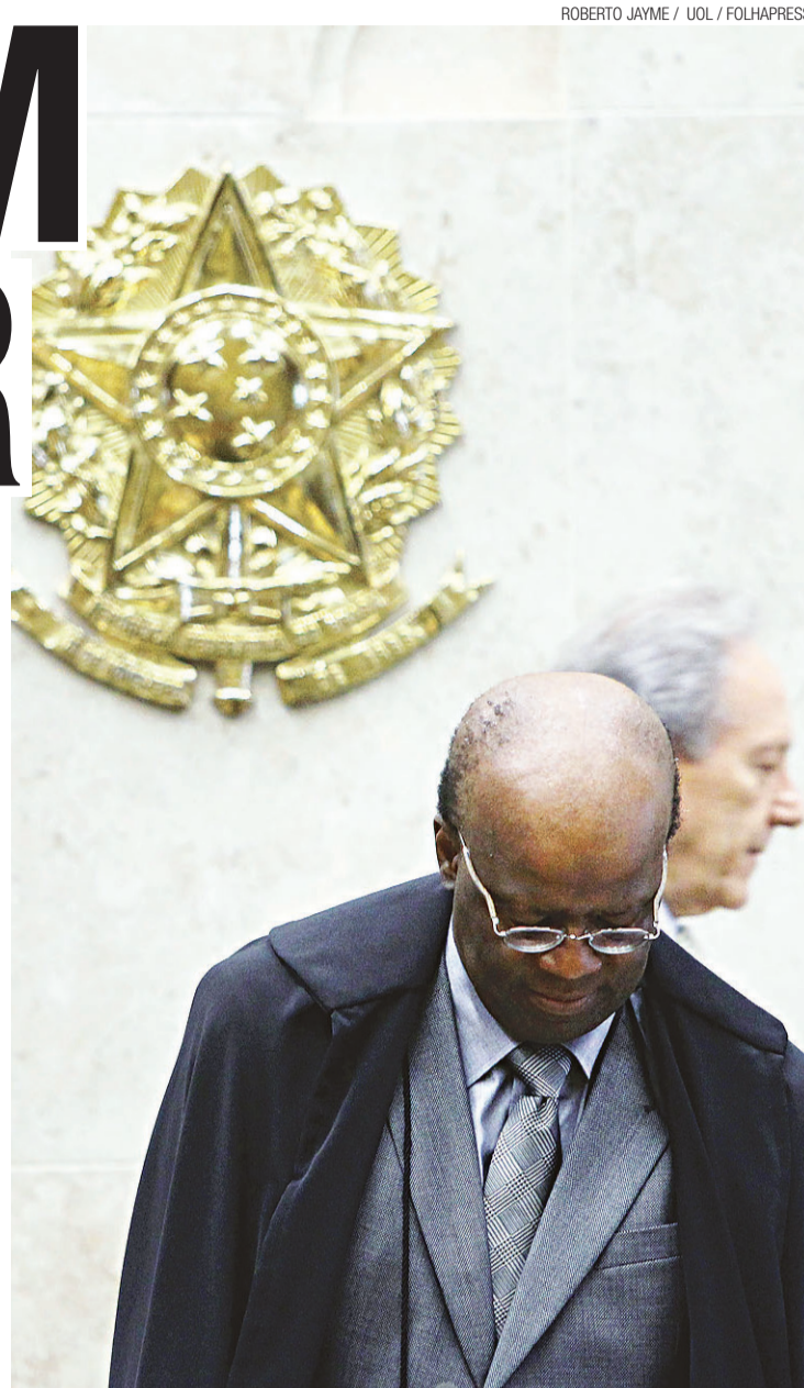
Barbosa e Lewandowski, considerado voto certo a favor: falta um

previstos pelo regimento interno do STF, mas uma lei de 1990 não mencionou essa possibilidade ao definir regras para o andamento dos processos no STF e no STJ (Superior Tribunal de Justiça).