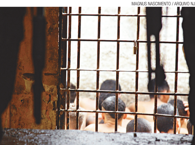
Presos em CDP de Natal: CNJ quer o cumprimento de direitos básicos