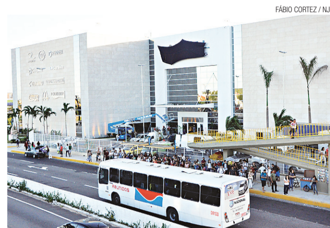
► A fachada principal do Natal Shopping com o logotipo encoberto