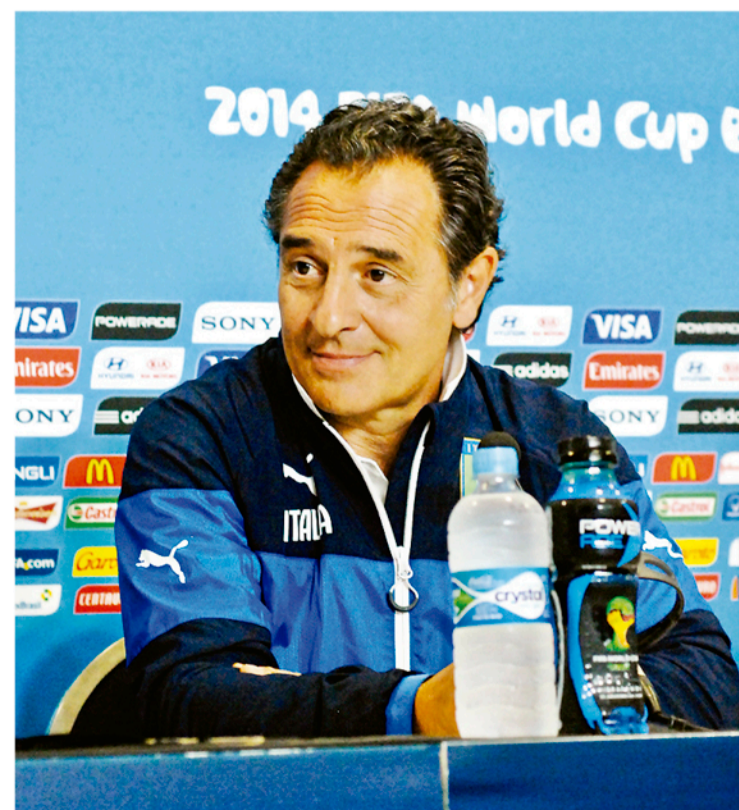
▶ Cesare Prandelli: jogo mais importante da vida

BNDES O banco nacional do desenvolvimento