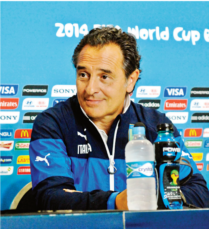
▶ Cesare Prandelli: jogo mais importante da vida