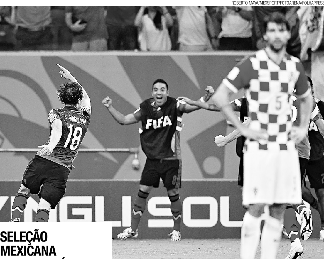
► Méxicanos comemoram a vitória por 3 a 1

Cartões amarelos: Blind (H) e Francisco Silva (C)