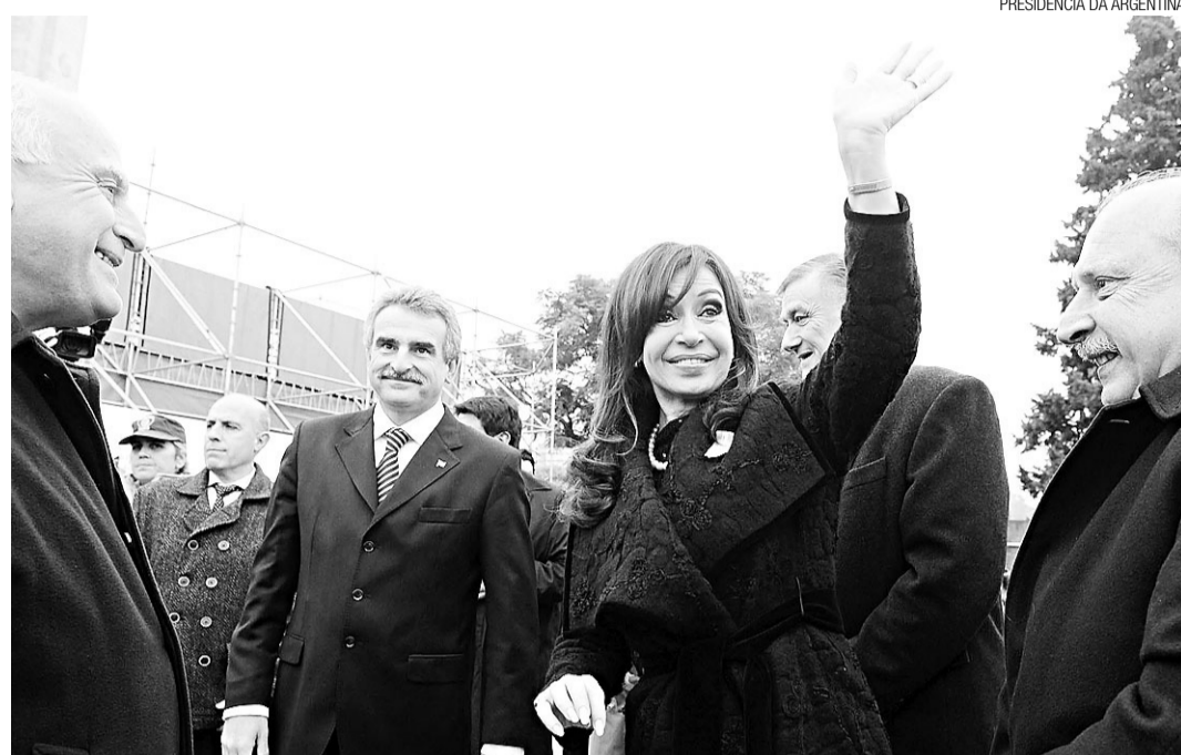
► Disposição da presidente Cristina Kirchner em negociar com credores fez a Bolsa argentina fechar em alta

Na primeira vez que o pedido foi feito, o presidente do STF, Joaquim Barbosa, decidiu, no último dia 12, que os recursos bloqueados não poderiam ser usa-