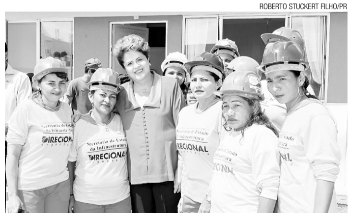
► Em Macapá, Dilma Rousseff também entregou casas