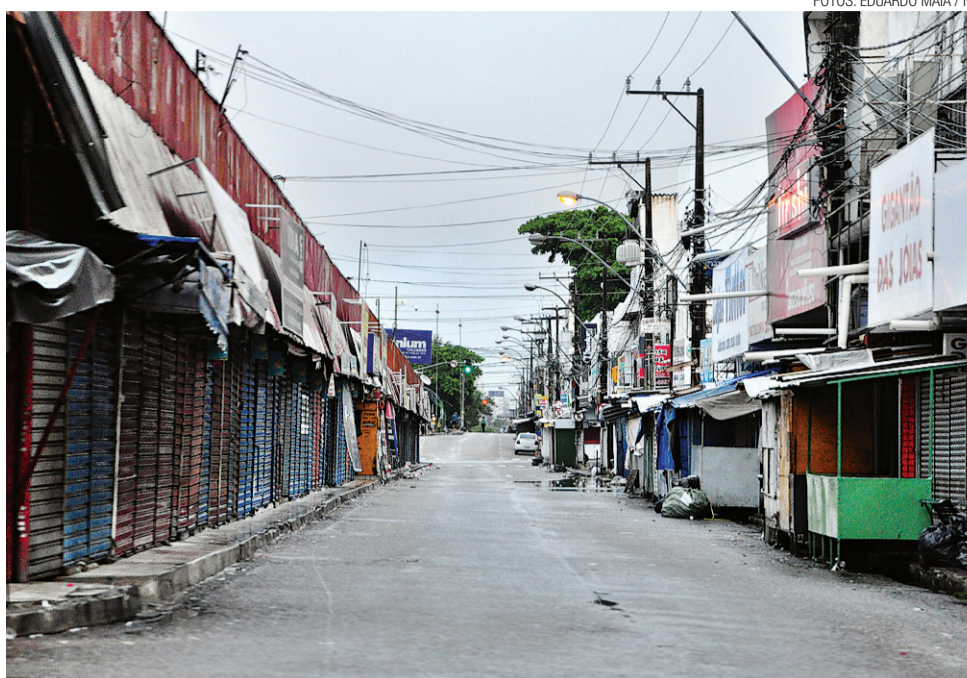
▶ No Alecrim, um verdadeiro deserto enquanto a seleção jogava contra Camarões