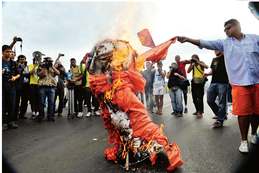
▶ Em Brasília, manifestantes queimaram réplica do troféu da Copa do Mundo

Moradores de Acari, Manguinhos, Pavuna e outras