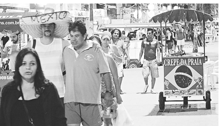
Movimentação na Avenida Erivan França com a presença de estrangeiros: ainda há mexicanos na cidade, mas os uruguaios são mais visíveis