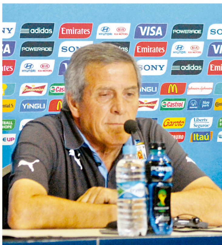
▶ Óscar Tabaré: jogadores têm ‘encanto’ pela Celeste

to o time de vocês continuar com essa pompa e essa cobrança de superfavorito, as decepções continuarão vindo”, pontuou Oscar.