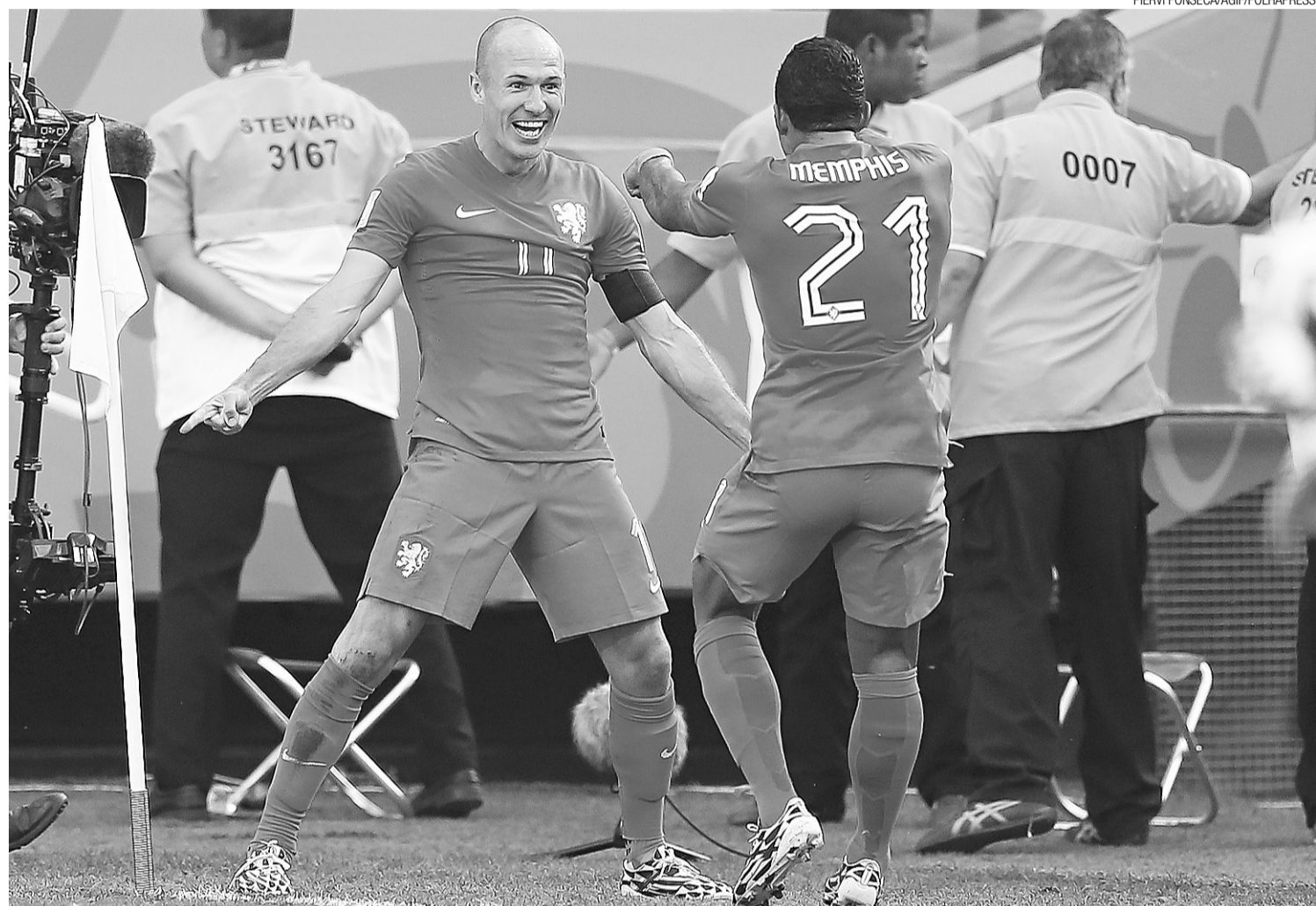
► Construído com dois gols de reservas, o resultado de 2 a 0 assegurou à seleção de Louis van Gaal o primeiro lugar de sua chave

O esquema mais defensivo entregou o controle de jogo para os chilenos. No primeiro tempo, a equipe teve 68% de posse de bola e completou quase quatro vezes mais passes que o adversário. Só que os holandeses finalizaram mais do que o dobro de vezes (7 a 3). Dessas finalizações, a de jogada mais bonita envolveu uma das tradicionais arrancadas de Robben, que saiu do campo holandês, deixou Jara para