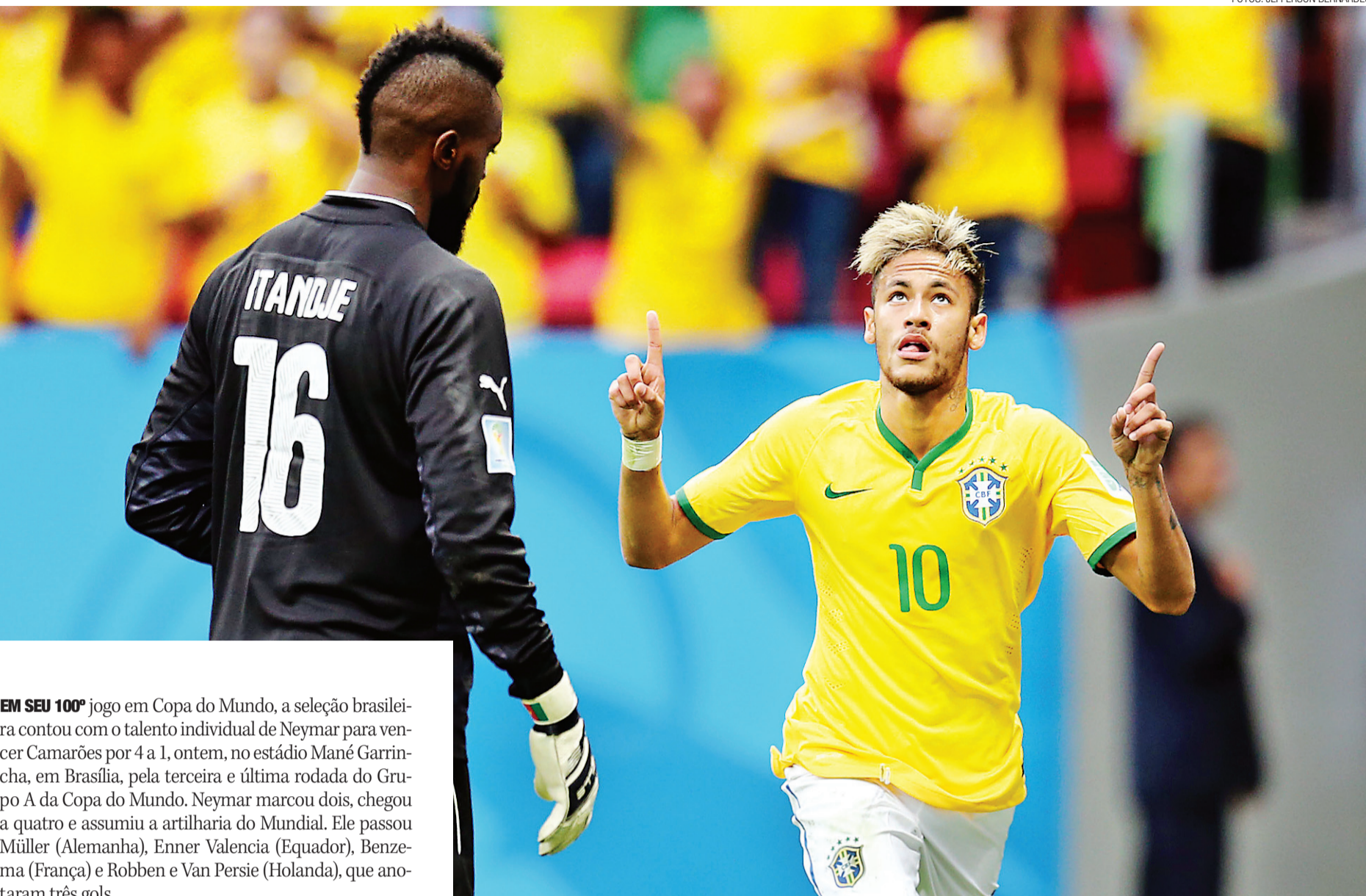
▶ Com os dois contra Camarões, Neymar alcança os 35 gols e se torna o 6º artilheiro da história da seleção

EM SEU 100º jogo em Copa do Mundo, a seleção brasileira contou com o talento individual de Neymar para vencer Camarões por 4 a 1, ontem, no estádio Mané Garrincha, em Brasília, pela terceira e última rodada do Grupo A da Copa do Mundo. Neymar marcou dois, chegou a quatro e assumiu a artilharia do Mundial. Ele passou Müller (Alemanha), Enner Valencia (Equador), Benzema (França) e Robben e Van Persie (Holanda), que anotaram três gols.