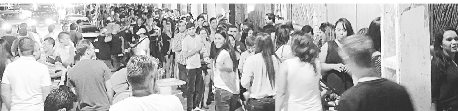
Bares e restaurantes faturam com a noite em Ponta Negra

Para fazer o meio de campo no salão, a casa contratou um garçom que, na verdade, faz o trabalho de uma espécie de relações públicas. Fluente em inglês, o funcionário engata conversas que vão além do futebol e da gastronomia. “Foi uma estratégia para envolver mais o cliente. Damos dicas sobre pontos turísticos e falamos um pouco sobre a história da cidade, música, etc.”, completou Farias.