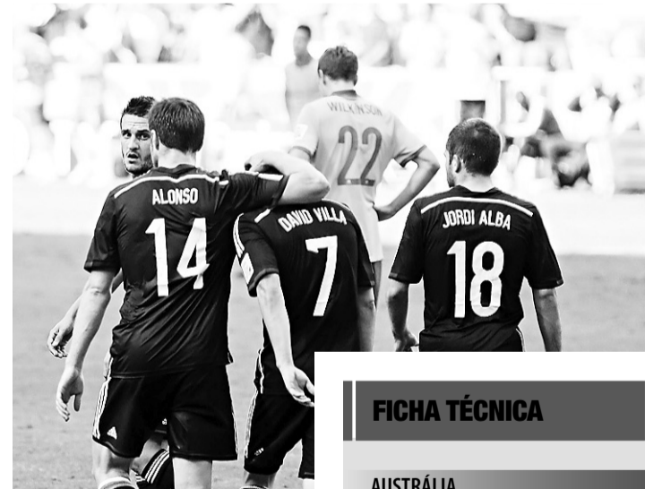
► Espanha: vitória sem alegria

Com o resultado, a Espanha encerra termina na terceira posição do Grupo B, com três pontos. Os australianos, por sua vez, terminam no último lugar, sem pontuar. Quem avançou na chave foram os holandeses, líderes com nove pontos, e os chilenos, segundo com seis.