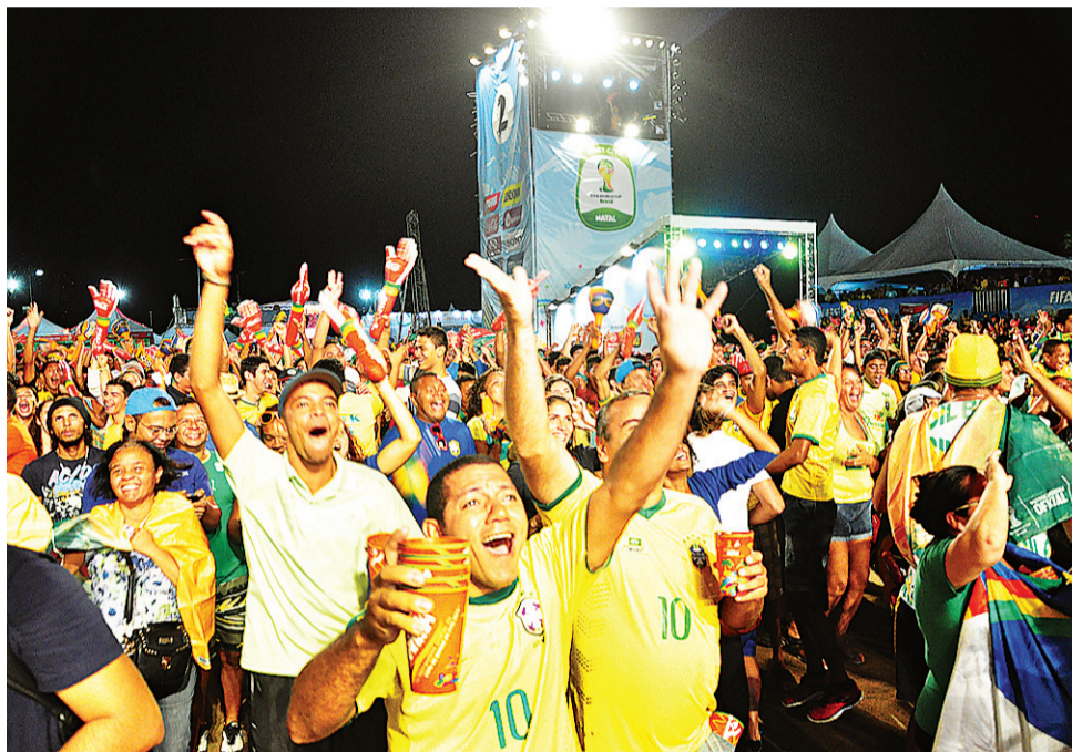
▶ Na Fan Fest, apesar do clima, ninguém perdeu o ânimo com o jogo