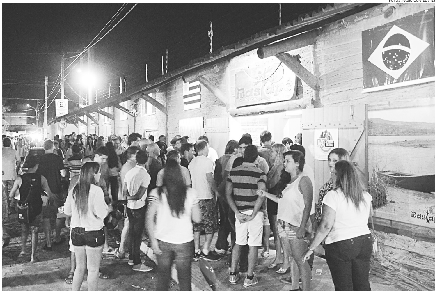
O maior público da noite de sábado ficou concentrado na casa de forró Rasta Pé, onde os pagantes eram em sua maioria natalenses