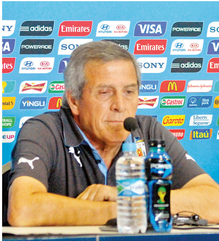
▶ Oscar Tabárez: jogadores têm 'encanto' pela Celeste