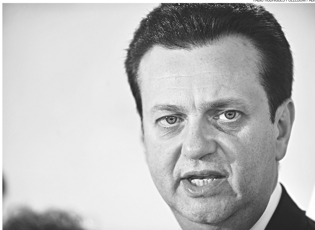
▶ Gilberto Kassab foi condenado por improbidade administrativa, mas ainda pode recorrer