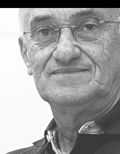
Albimar Furtado escreve nesta coluna às sextas-feiras