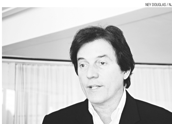
▶ Robinson Faria, presidente do PSD-RN, é pré-candidato ao governo

Atrás do PMDB e do Democratas, é a terceira força no que tange aos executivos municipais. Há dois anos, a legenda comandada por Robinson Faria angariou 21 prefeituras em 2012. Foram vitórias em locais como São Paulo do Potengi, Touros e Afonso Bezerra.