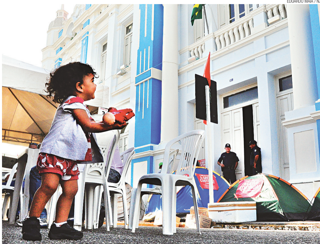
▶ Criança brinca na rua em frente à sede da prefeitura transformada em acampamento de grevistas da área da Saúde