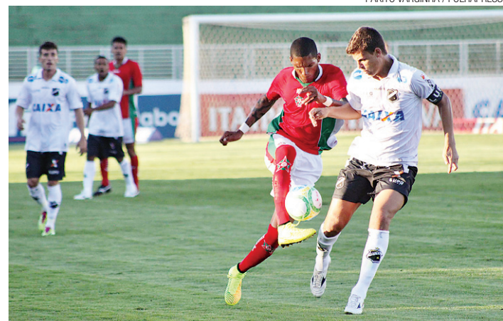
► Alvinegro viu diferença em relação ao G4 aumentar para 10 pontos