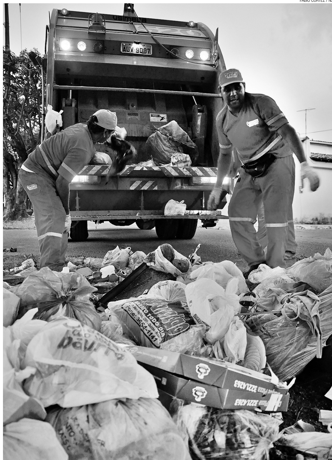
► Novo edital prevê que o pagamento das empresas não será mais feito por peso coletado, e sim pelo serviço prestado

O edital também prevê que o pagamento das empresas não será mais feito por peso coletado, mas sim pelo serviço prestado, exceto o de coleta domiciliar, que vai continuar com o pagamento vinculado ao peso do que for recolhido. Para melhorar o sistema de fiscalização, todos os veículos e equipamentos terão um GPS integrado. Os serviços de coleta seletiva e o fortalecimento da limpeza das praias estão contemplados no documento.