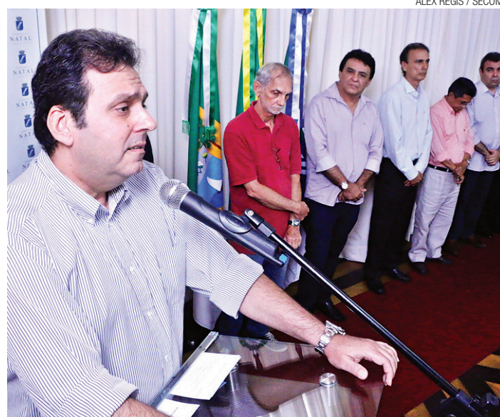
ALEX RÉGIS / SECOM