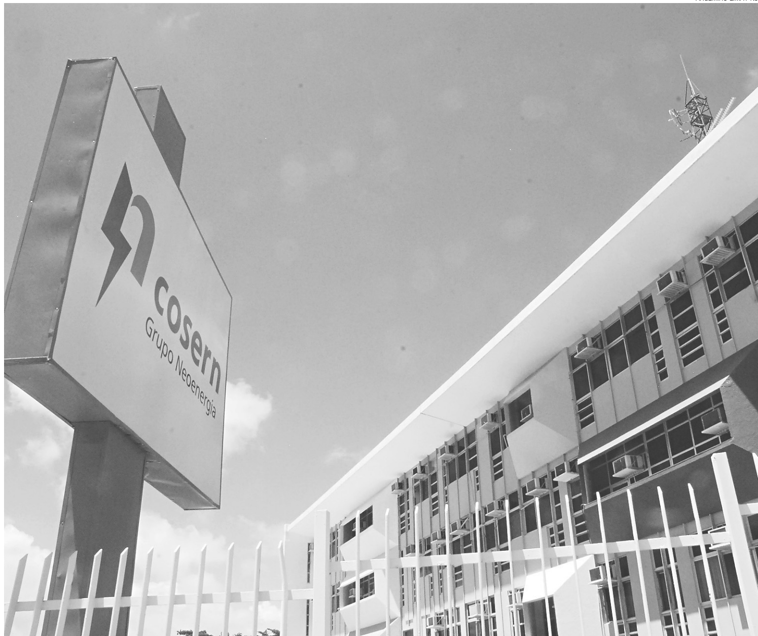
► Cosern alega que alíquotas do ICMS não foram debitadas corretamente porque usuários não informaram mudanças de classificação na unidade de consumo

Ainda segundo Medeiros, apesar dos R$ 14 milhões cobrados à Cosern pelo Estado, a empresa está cobrando dos consumidores um total de R$ 4,5 milhões. "A Cosern está aberta à negociação", garante.