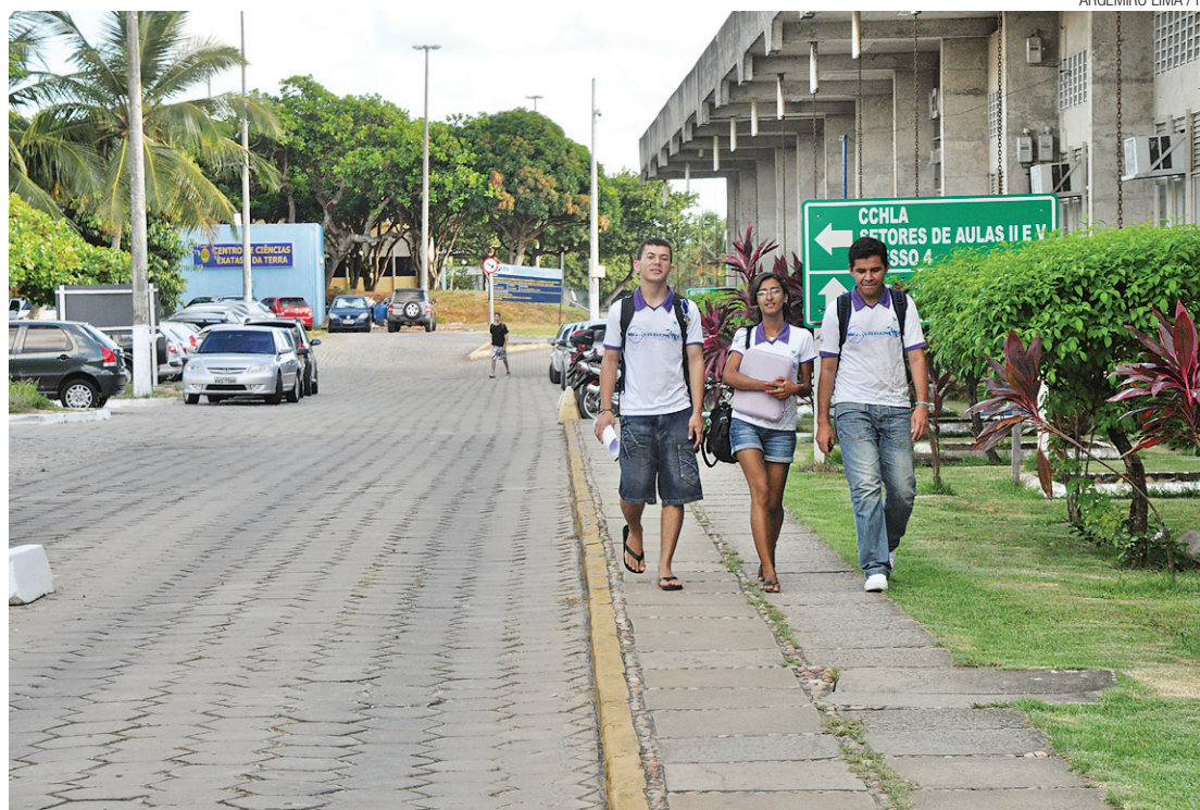
► Dados divulgados ontem mostram que alunos têm abandonado cursos de graduação

O ritmo de crescimento, no entanto, vem caindo nos últimos anos. Em 2013, foram registrados 7,3 milhões de matrículas - um aumento de 3,81%. No ano anterior, o percentual foi de 4,4%. Esse ritmo teve queda mais expressiva quando considerada apenas as matrículas