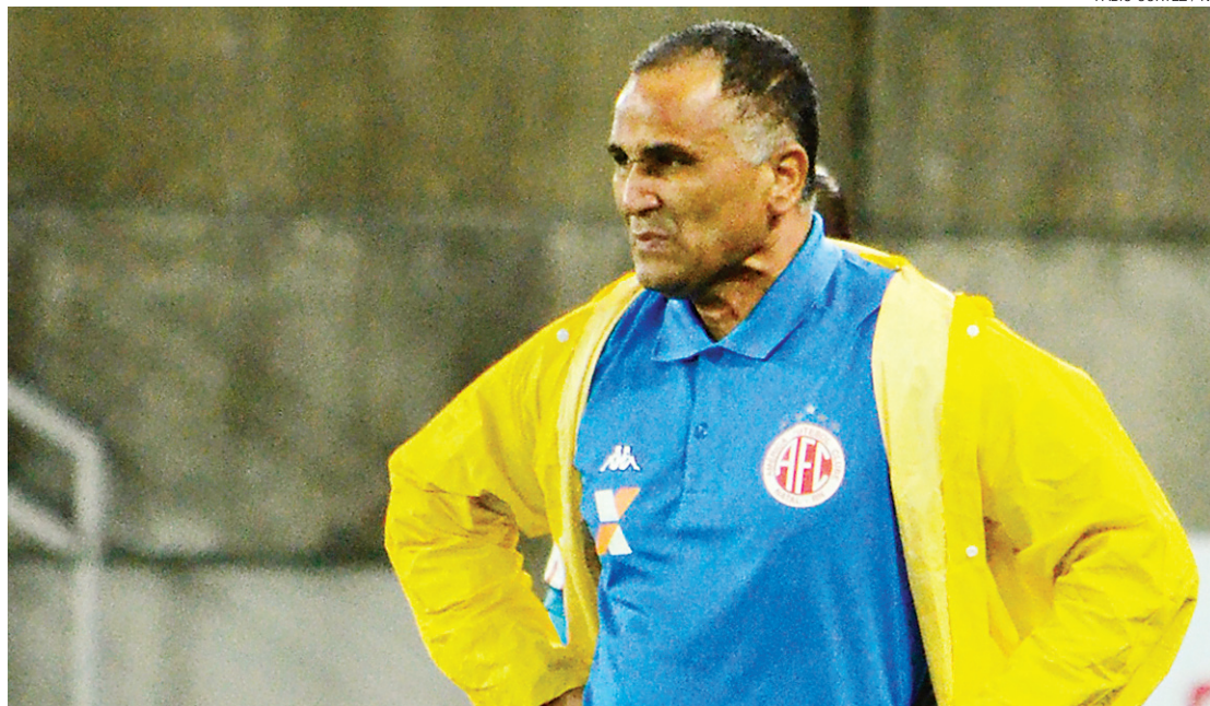
► Time de Oliveira Canindé não consegue mesmo desempenho da Copa do Brasil na Segundona

De lá para cá, perdeu para Santa Cruz-PE, Ponte Preta, Paraná e, ontem, Oeste-SP. Nesse período, somou ainda derrotas fora de casa para Boa Esporte e Náutico, além de um empate com o Avaí e uma vitória contra o Icasa, no Ceará.