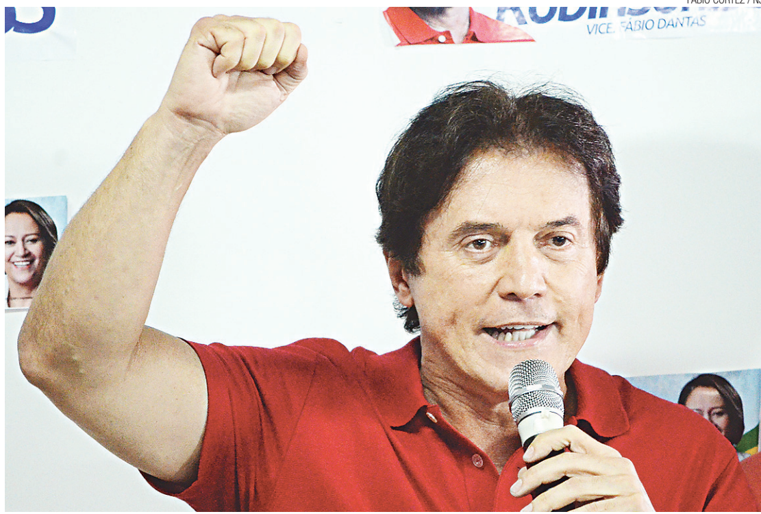
▶ Contas do vice-governador Robinson Faria (PSD) tem diferença de R$ 6,1 milhões entre arrecadação e despesas

A diferença entre a arrecadação de Faria e seus gastos é um pouco superior a R$ 6 milhões, ficando atrás apenas das campanhas conduzidas por Reinaldo Azambuja (PSDB-MS), com déficit de R$ 8 milhões, e Alexandre Padilha (PT-SP), que apresenta R$ 30,8 milhões gastos acima do que foi arrecadado até o início de setembro. O candidato do PSD arrecadou, segundo a sua prestação de contas, R$ 1,63 milhão. Deste montante ele próprio foi doador de R$ 275 mil. Apesar do déficit, Robinson gastou cerca de R$