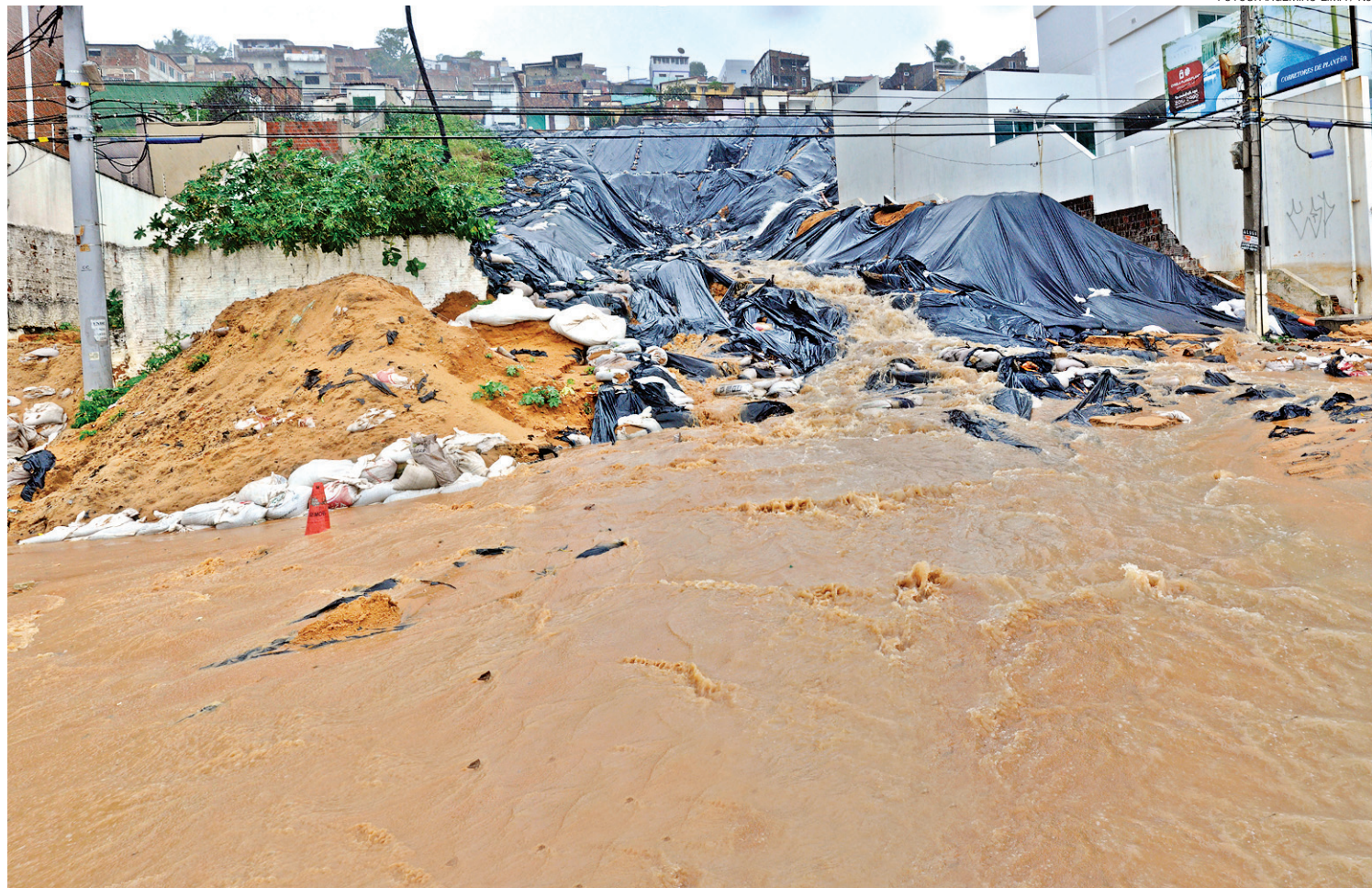
► A sujeira interrompeu mais uma vez o trânsito da avenida Silvio Pedroza, um dos principais corredores turísticos da cidade

Segundo Soares, a Companhia de Águas e Esgotos (Caern) foi acionada para religar a canalização pluvial. Os trabalhos foram re-