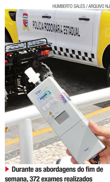
► Durante as abordagens do fim de semana, 372 exames realizados

Ao todo foram cumpridos quatro mandados de busca e apreensão em Natal e utilizados na ação, 16 policiais federais. O nome da operação é originário do latim e significa "empréstimo".