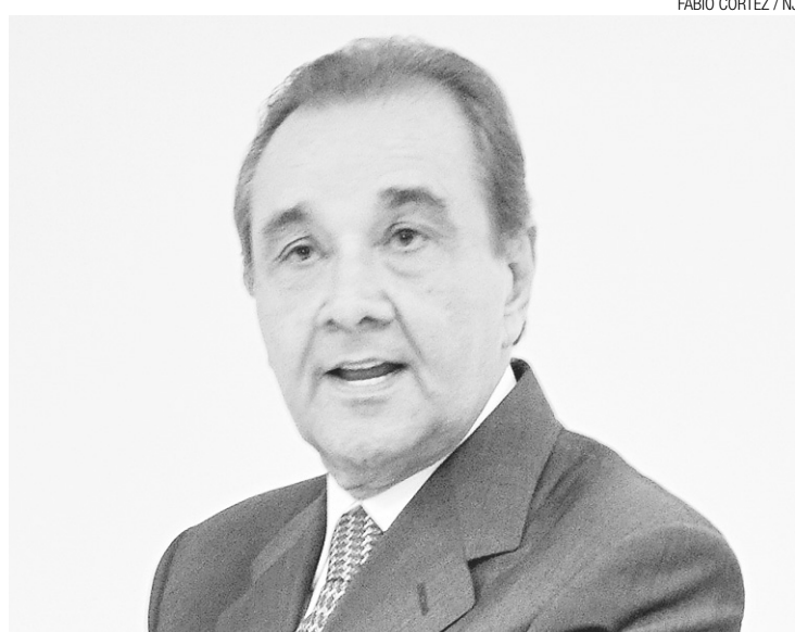
► Senador José Agripino, presidente nacional do DEM: ponto pacífico