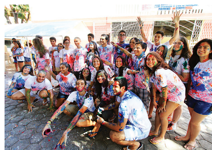
Alunos do Colégio das Neves comemoram aprovação

A paixão pelo Jornalismo veio do gosto pela escrita. "No 9º ano comecei a produzir textos para a escola e tomei gosto. As pessoas me disseram que poderia fazer Jornalismo e gostei da ideia e vai ser difícil me fazer mudar".