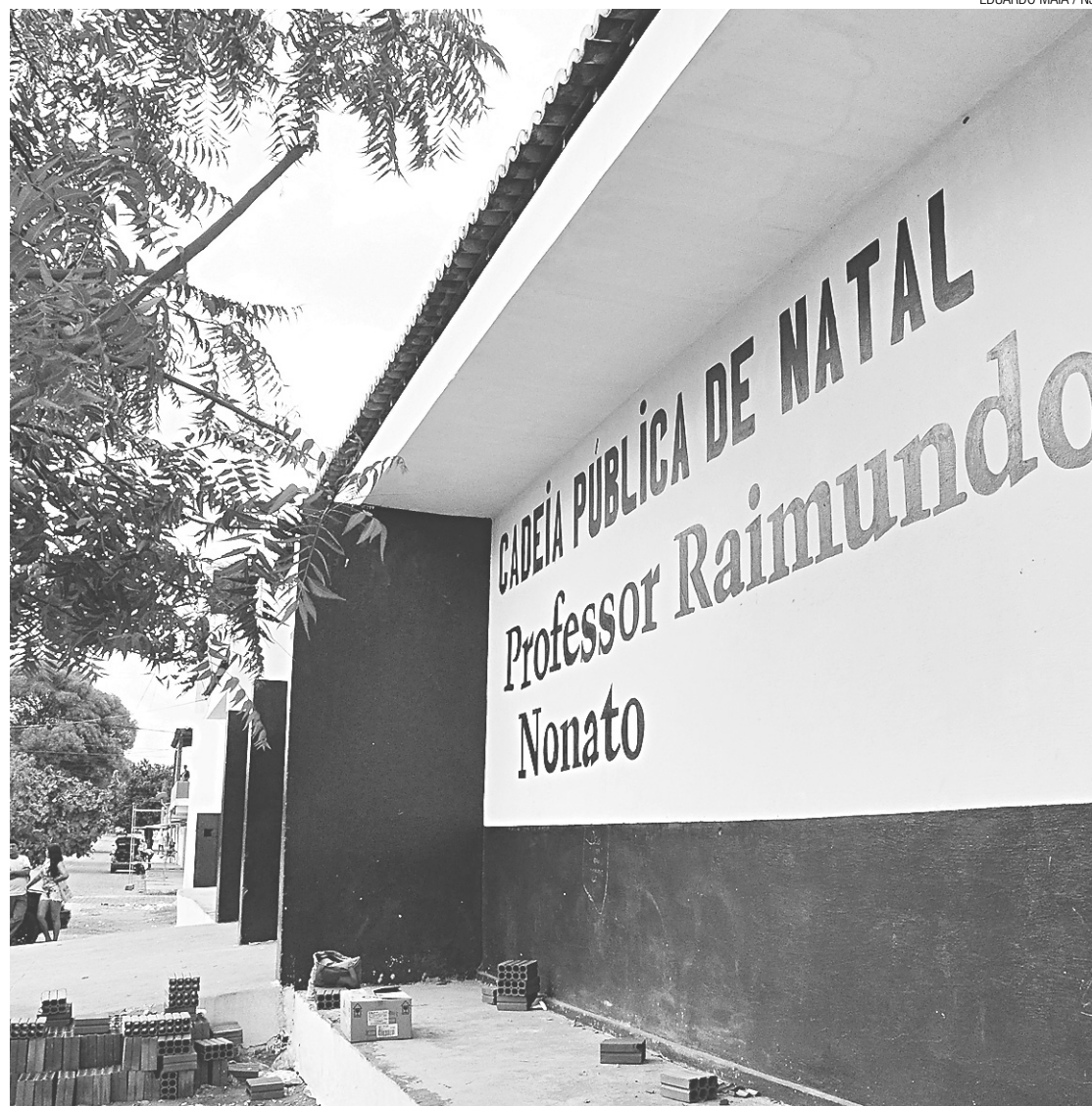
► Estrangeiros, presos com passaportes falsos, continuam custodiados no presídio Professor Raimundo Nonato

Em junho do ano passado, um caso muito semelhante