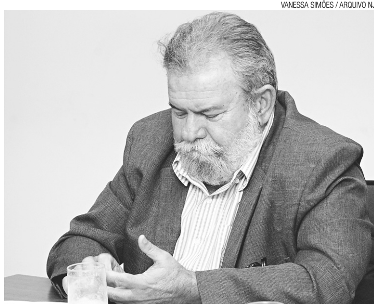
► Betinho Rosado, deputado federal e presidente do diretório estadual do PP