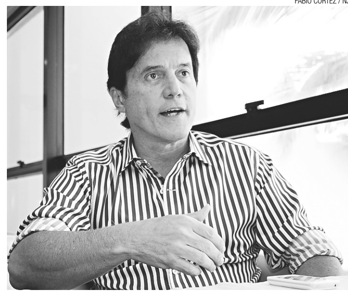
► Robinson Faria, governador do Rio Grande do Norte: medidas de contenção