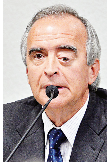
Nestor Cerveró, ex-diretor da Área Internacional da Petrobras

28 e 29, em San José, participa da Cúpula de Chefes de Estado e de Governo da Comunidade de Estados Latino-americanos e Caribenhos (Celac).