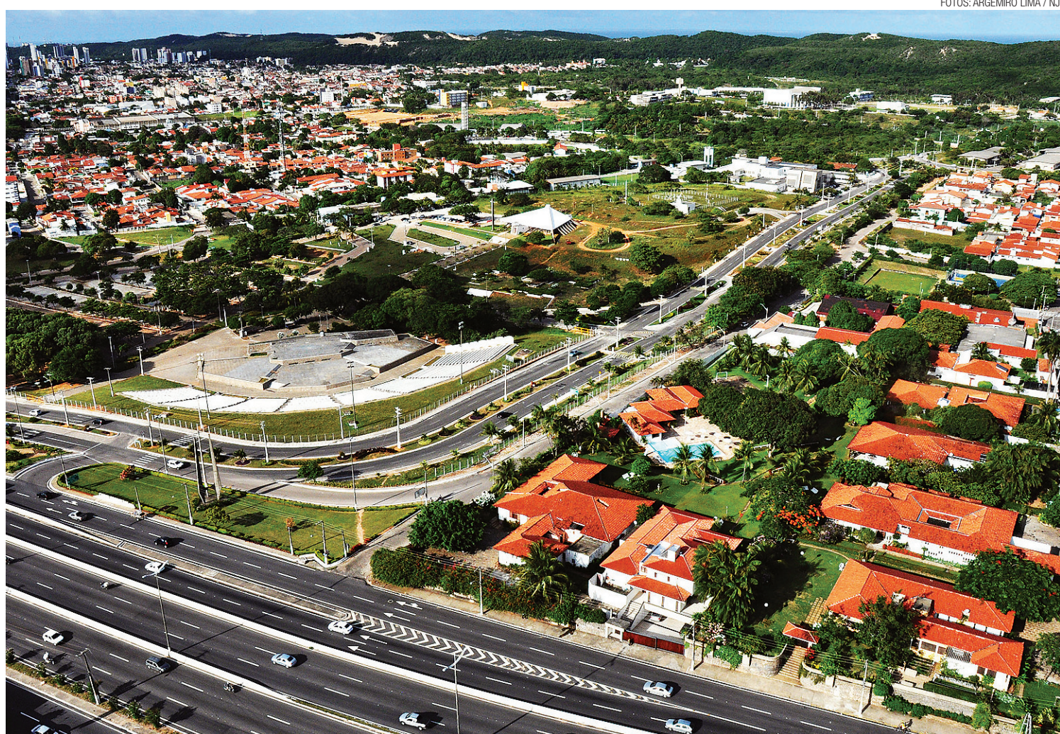
Os cursos com a maior concorrência na UFRN foram os de medicina, sendo um no Campus Central (foto) e o outro em Caicó

Na Universidade Federal do Rio Grande do Norte (UFRN), o cadastramento para os que vão entrar em um de seus cursos acontece entre 30 de janeiro 3 de fevereiro.