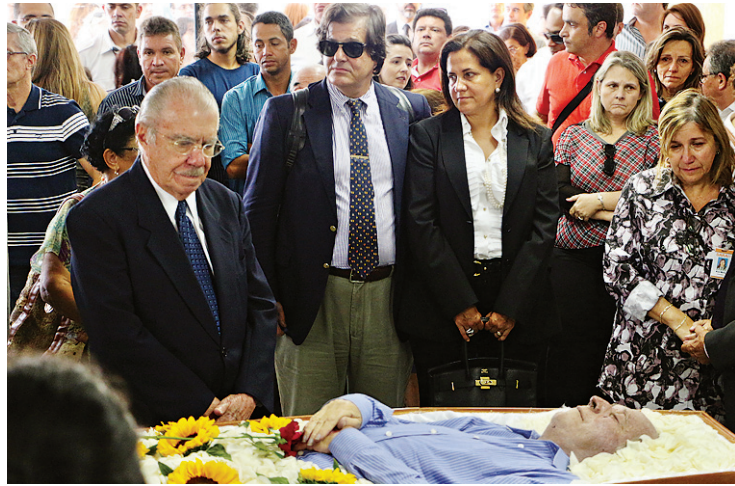
Ex-presidente e senador José Sarney participou do velório

Campos morreu domingo (25), por volta das 14h30, de insuficiência respiratória. De acordo com colegas que estavam presentes no momento da morte, ele estava tra-