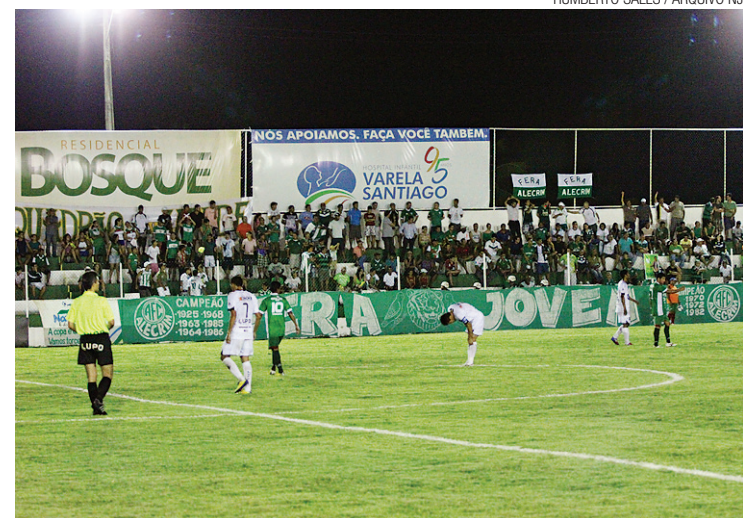
► Parecer do Ninho do Periquito sequer tem previsão de entrega

O Baraúnas deve jogar mesmo no Walter Bichão; o Corinthians de Caicó no Marizão; e Força e Luz e Globo dividirão o Barretão. Já o Palmeira de Goianinha segue no Nazarenão, o Potiguar de Mossoró no Nogueirão e o Santa Cruz no Ibezão.