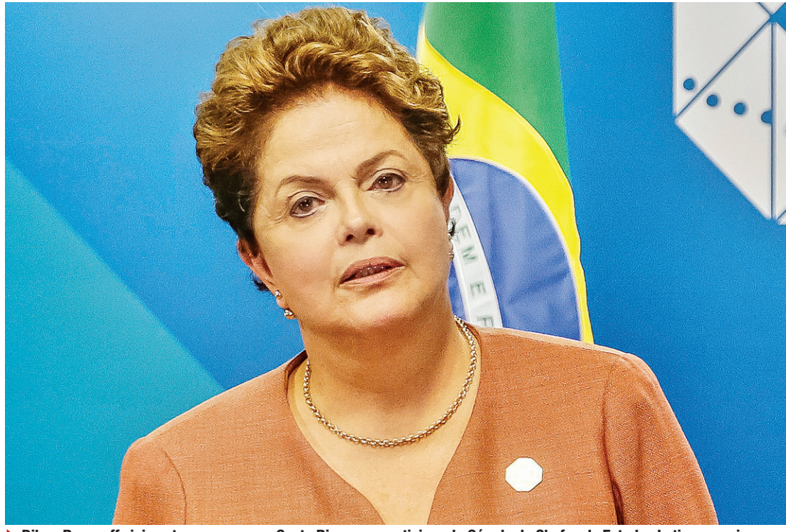
Dilma Rousseff viaja esta semana para Costa Rica para participar da Cúpula de Chefes de Estados Latino-americanos

As manifestações de Dilma neste ano foram por meio de notas distribuídas pela Secretaria de Im-