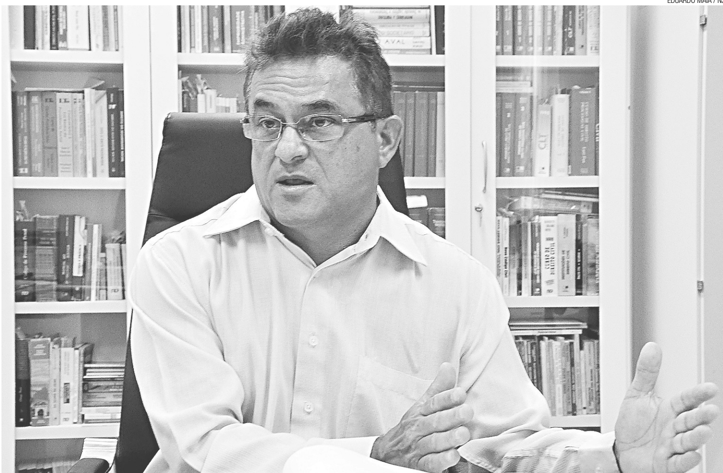
► O juiz Eduardo Guimarães ainda está analisando os pedidos de defesa e a decisão deve sair até a sexta-feira; ele admite a possibilidade de absolvição sumária

A argumentação da defesa é que, apesar de terem sido pegos