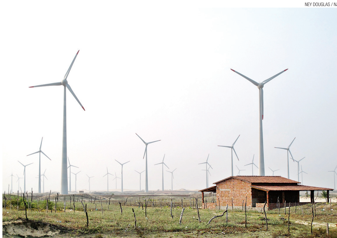
▶ Entre 2009 e 2014 aportaram no RN mais de R$ 10 bilhões em investimentos na energia eólica

"O que temos que entender é que as renováveis, tanto solar quanto eólica são complementares, mas muito importantes, por-