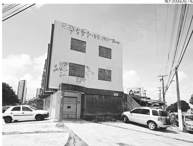
► Imóvel do MPE que será demolido