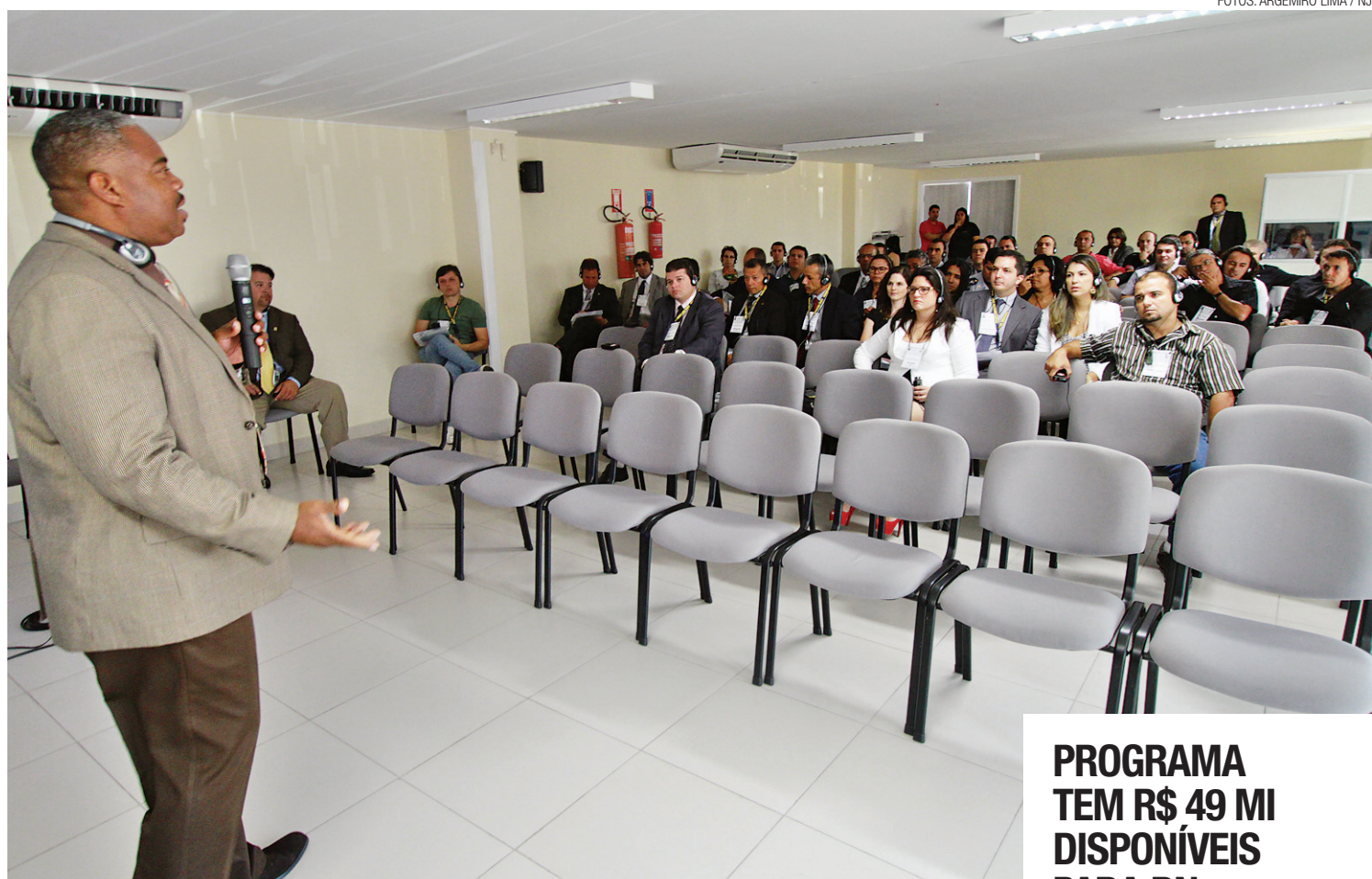
► Policiais e promotores potiguares participam de seminário no qual agentes norte-americanos relatam experiência

Ele afirma que a polícia de Miami não tem muito a ensinar para a polícia brasileira. "A polícia é um termo universal. O trabalho é sempre o mesmo. O crime é crime em qualquer lugar. A diferença é a estrutura ofertada e a quantidade de pessoas envolvidas", afirma.