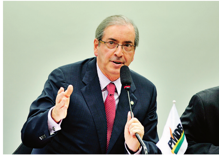
► Eduardo Cunha, presidente da Câmara dos Deputados

De acordo com ato assinado por Cunha, a CPI investigará irregularidades praticadas na companhia entre os anos de 2005 e 2015 e fatos "relacionados a superfatu-