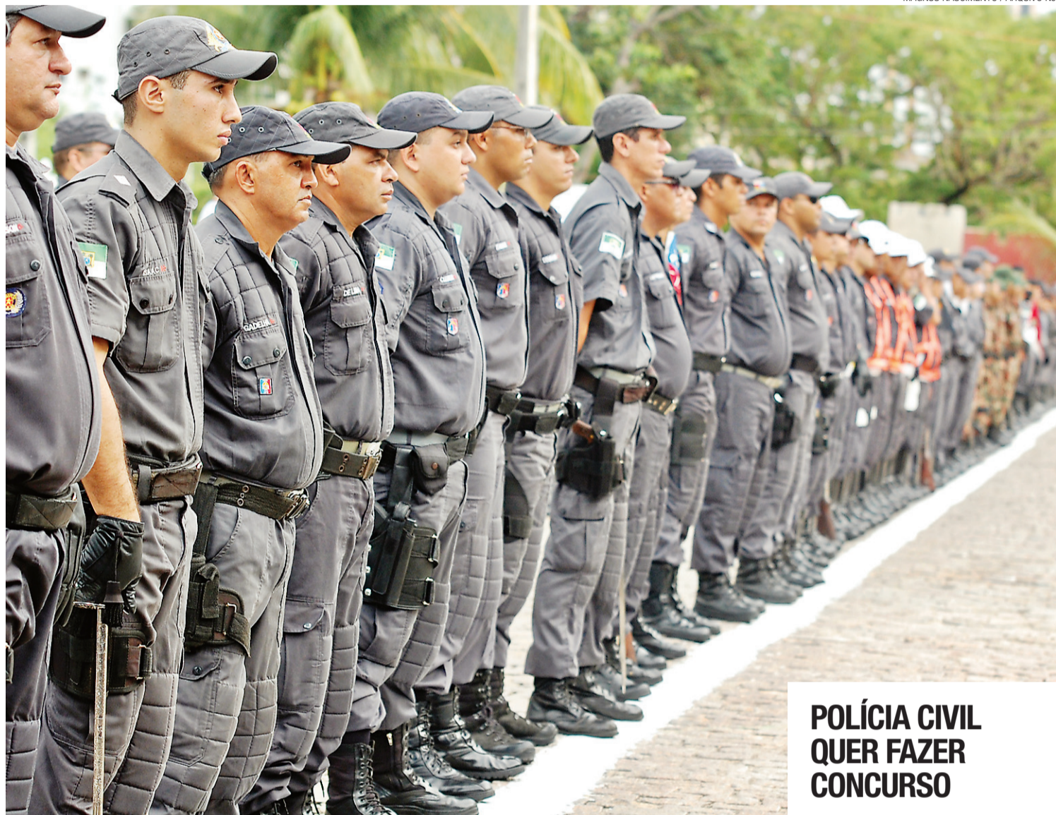
► Sesed solicitou que órgãos devolvam PMs cedidos para guarda patrimonial, o que não vem acontecendo com celeridade

Outra situação que a secretária pretende corrigir é a cessão de escrivães da Polícia Civil que tem deficiência neste tipo de profissional. Ela disse que não pode admitir que isso ocorra e vai sensibilizar os outros poderes para devolverem os escrivães. "Há escrivão na Assembleia Legislativa", exemplificou. "Eu faço um apelo aos poderes judiciário e legislativo, e às secretarias do executivo que façam uma avaliação, reflexão, porque a população precisa da polícia", ponderou.