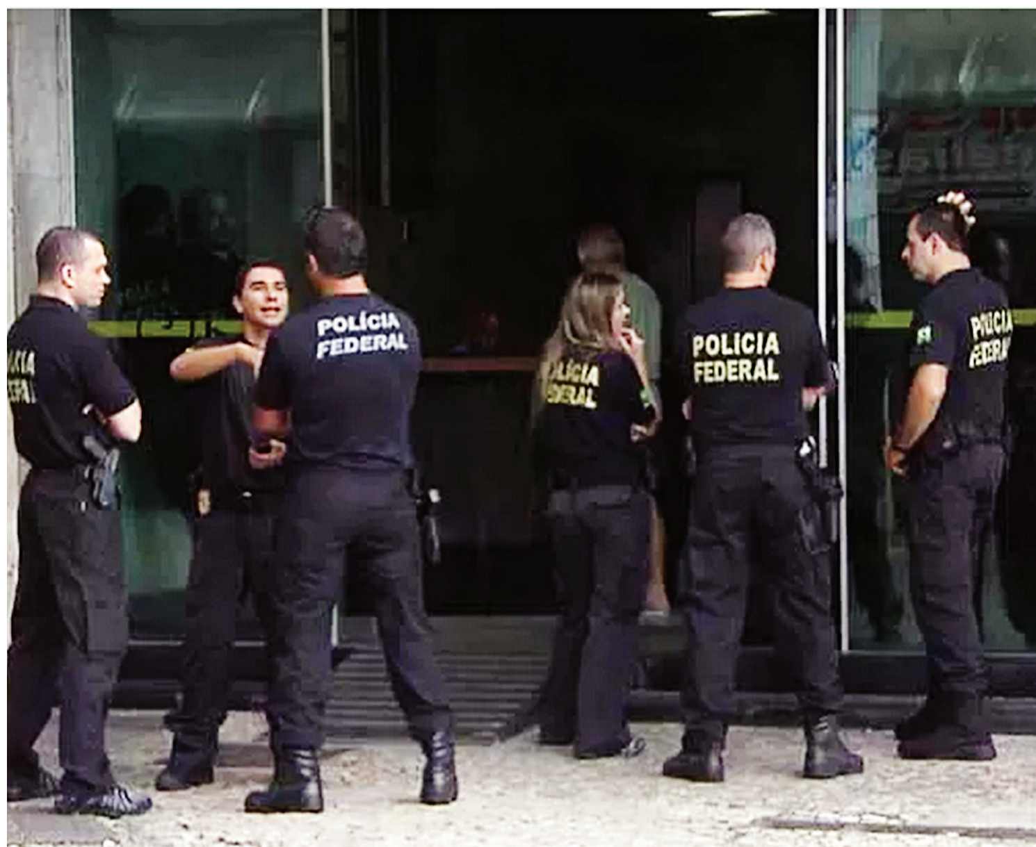
► Ao todo, foram expedidos 18 mandados de condução coercitiva, um de prisão preventiva, três de prisão temporária e 40 de busca e apreensão

A nona fase da Lava Jato foi batizada de "My Way", forma pela qual o ex-gerente da Petrobras Pedro Barusco se referia a Renato Duque, ex-diretor da Área de Serviços, explicou a PF.