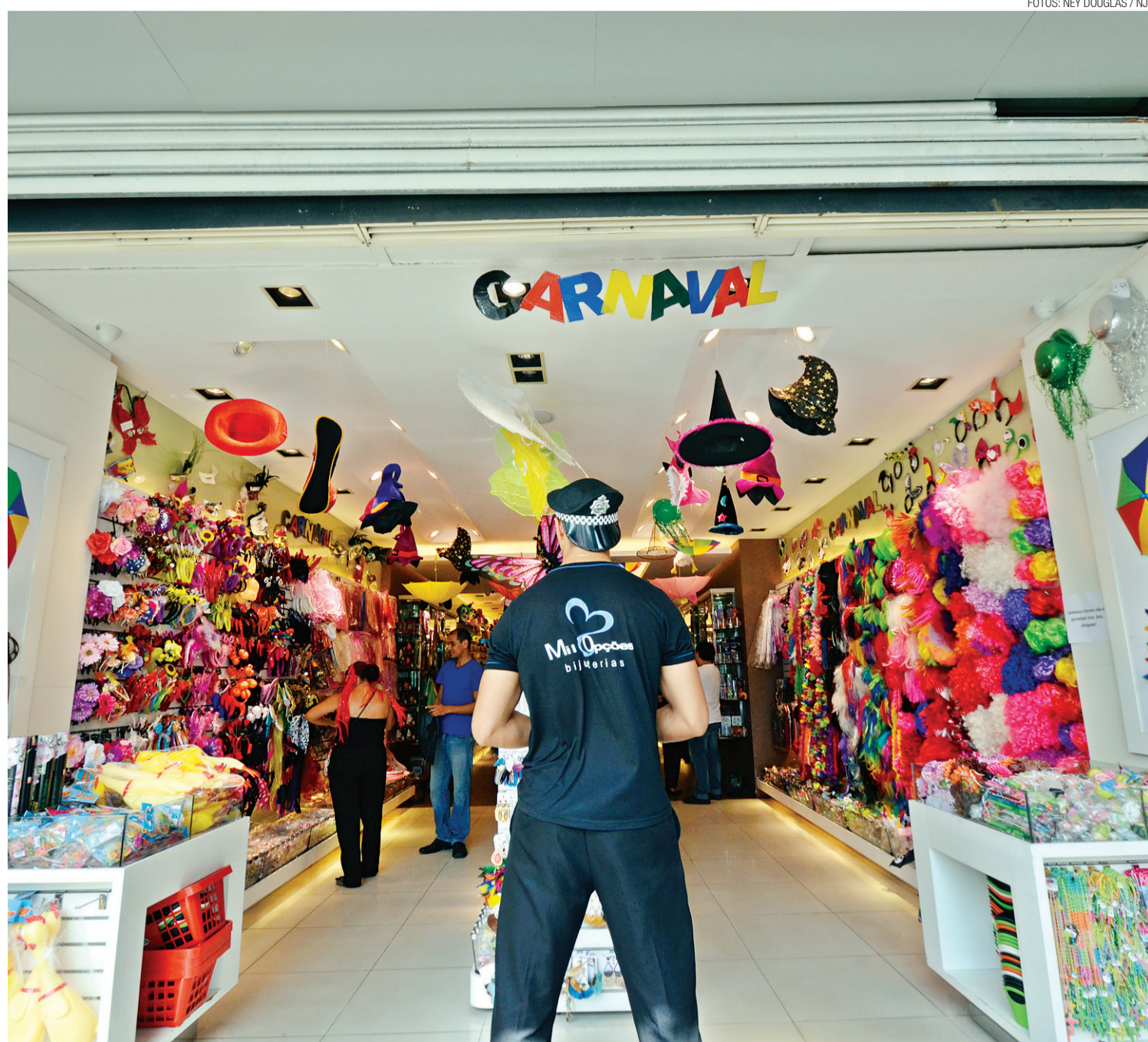
▶ Entidades representativas do setor dizem que período gera incremento nas atividades de setores específicos, mas não é data forte para o comércio em geral