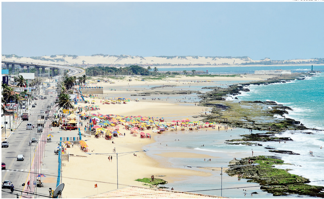
▶ Natal ocupa o 3º lugar entre as cidades mais procuradas, atrás de Porto Seguro e Fortaleza

A alíquota de ICMS sobre o óleo de querosene no Rio Grande do Norte é de 17% e as empre-