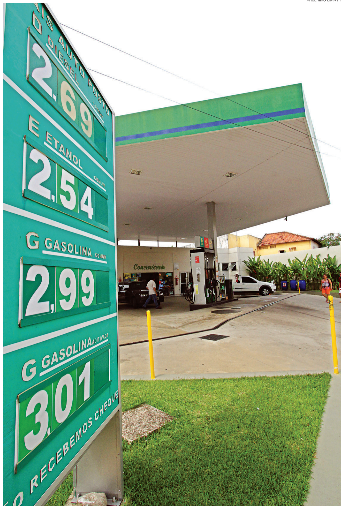
Etanol se torna vantajoso apenas se resultado da divisão do preço do álcool pelo da gasolina for menor que 0,7