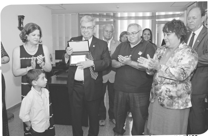
▶ O ministro Garibaldi Alves Filho sendo homenageado com uma placa de reconhecimento pelo apoio prestado aos docentes da UFRN