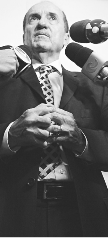
► Cláudio Santos, presidente do TJ-RN: "Não considero possibilidade de movimento grevista"

Com a determinação do CNJ para o reajuste automático, que criou um conflito entre as decisões, Cláudio Santos encaminhou ao Tribunal de Contas um pedido de reconsideração. Após análise do pedido, os conselheiros do TCE resolveram autorizar o reajuste, com a condição de que fosse incluído nos cálculos o plano de readequação de gastos do tribunal com a folha de pessoal. Logo, o TJ-RN poderia conceder o aumento aos juizes e desembargadores dentro do limite de compensação com medidas para diminuir os gastos.