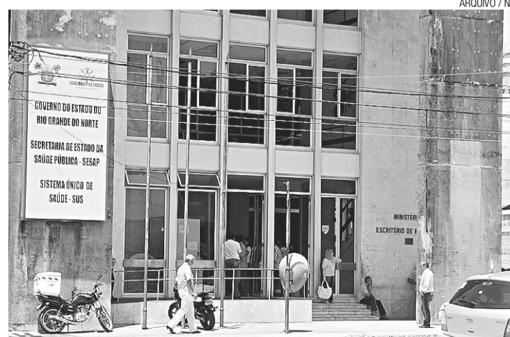
► Órgão descartou meningite bacteriana como causa da morte de guarda

No último fim de semana, a informação de que o guarda municipal e de que outro paciente – cuja identidade foi preser-