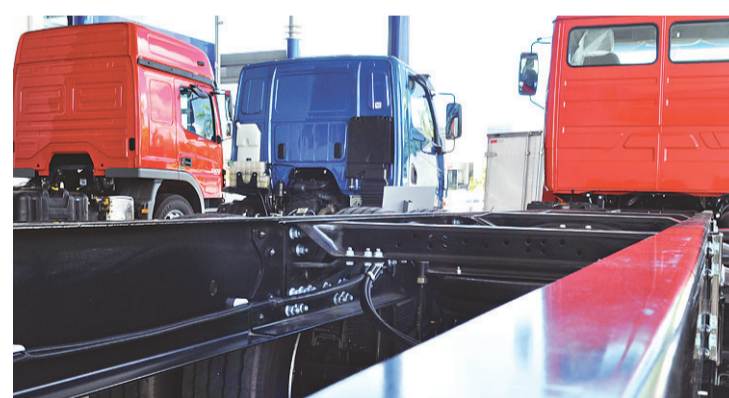
► Venda de caminhões sofreu maior queda: 50%

"Quando tem vaca magra a gente olha cada centavo. Então tem que reduzir custos com material de expediente, telefone, ar-condicionado, diminuir investimento em propaganda, participação em eventos, para poder sair com um pouco mais de fôlego dessa crise", orienta.