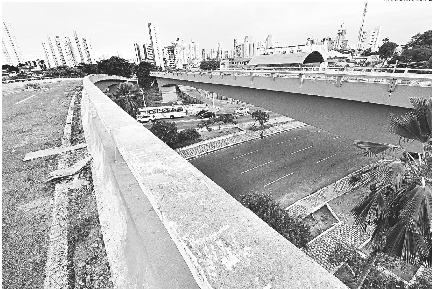
► Divergências de opiniões entre os profissionais envolvidos na reforma foram o fator principal para o não cumprimento de mais um prazo por parte da Prefeitura

https://pje.jfrn.jus.br/pje/Processo/ConsultaDocumento/listView.seam