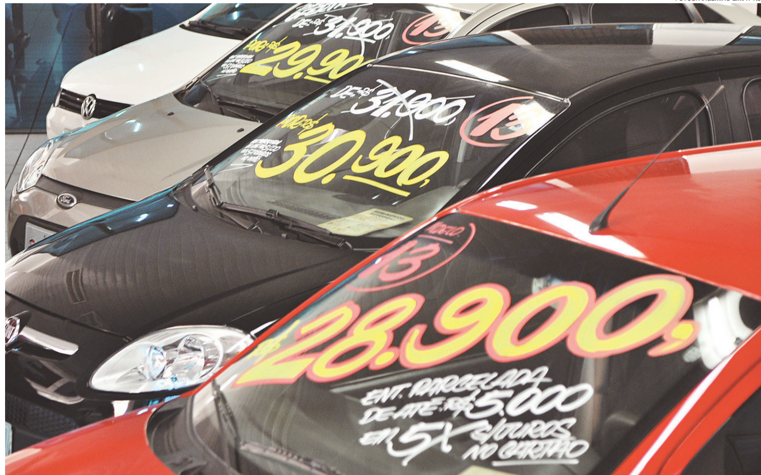
► Queda nas vendas no setor automotiva potiguar chega a 11%, mas revendedores rechaçam momento de crise