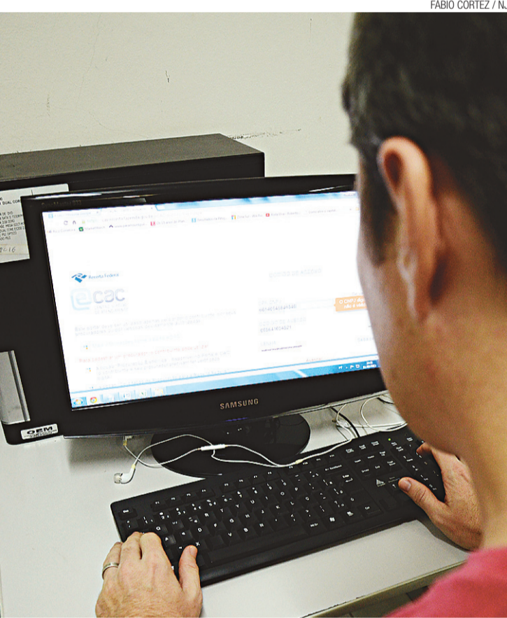
▶ Informações do IRPF estão no site e-CAC, da Receita Federal