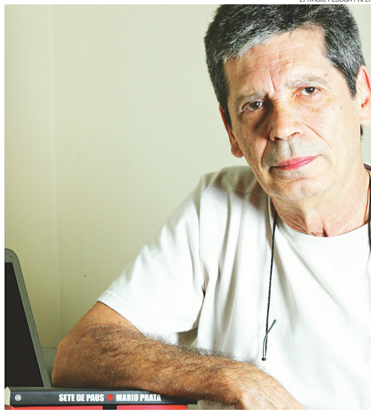
▶ Escritor Mário Prata falará com estudantes hoje no Parque da Cidade

LICENÇA AMBIENTAL NOME DO INTERESSADO: GMZ BRASIL EMPREENDIMENTOS IMOBILIÁRIOS LTDA. INSCRITA NO CNPJ: 12376164/0001-05 torna público. Conforme a resolução CONAMA Nº 237/97, que requereu à SEMURB em 29/04/2015, através do processo Administrativo Nº 000000.020428/2015-75, a Licença Ambiental de Instalação para o funcionamento de um Condomínio Residencial CRUZEIRO com área construída de 7.265,37 m², em um terreno de 9.185,67 m², situado na RUA FEANCISCO SIMPLICIO S/N, PONTA NEGRA, NATAL/RN.