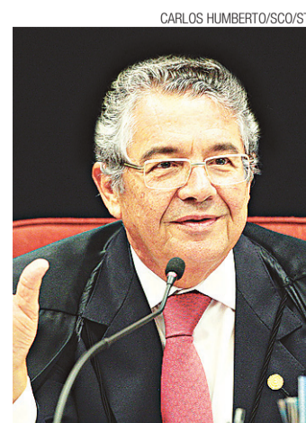
Marco Aurélio Mello já conduz investigação sobre deputado

conduz uma investigação contra o deputado Arthur Lira. O processo envolve a prisão de um servidor da Câmara dos Deputados, em 2012. Ele tentou embarcar de São Paulo para Brasília com uma mala de dinheiro, utilizando passagens compradas pelo deputado. O ministro Teori Zavascki continua como relator dos demais inquéritos da Operação Lava Jato no Supremo.