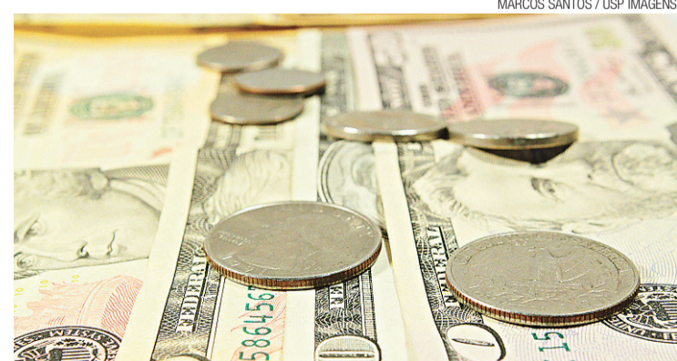
▶ Onda de aumentos em itens de consumo manterá inflação em níveis altos