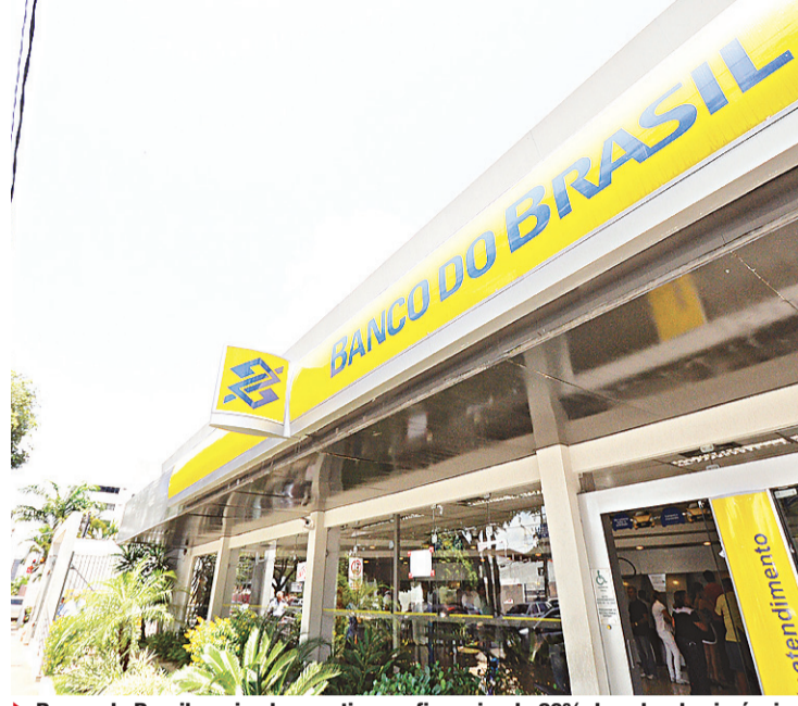
▶ Banco do Brasil e privados continuam financiando 80% do valor dos imóveis

Pelas novas regras, os financiamentos via Caixa dentro do Sistema Financeiro Habitacional (SFH) – que financia unidades até R$ 750 mil no Distrito Federal, em São Paulo, no Rio de Janeiro e em Minas Gerais e até R$ 650 mil no resto do país – passam a ser de até 50% do valor para imóveis usados, e não mais 80%. No Sistema Financeiro Imobiliário (SFI) que fi-