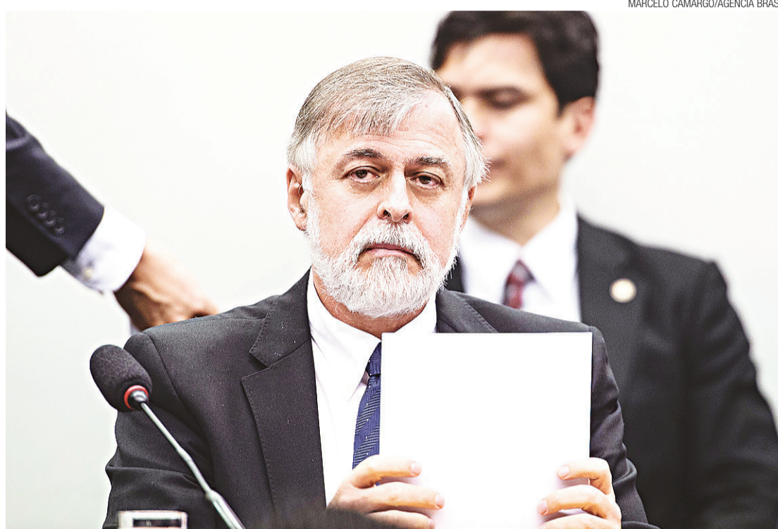
Alberto Youssef contou ter financiado campanhas a pedido do ex-diretor da Petrobras, Paulo Roberto Costa (foto)

Segundo o doleiro, o assunto nunca foi conversado com o Vaccari Neto. Ainda segundo Youssef, o PT recebeu cerca de R$ 800 mil de um total de R$ 1,4 milhão. O restante foi para o PP. Alberto Youssef também negou que, em 2010, o ex-ministro da Fazenda, Antonio Palocci, teria pedido R$ 2 milhões da conta do PP para a campanha de Dilma Rousseff, conforme informação anterior de Paulo Roberto da Costa. "Não conheço Palocci e nunca tive contato com nenhum assessor dele. Se alguém operacionalizou esse pagamento, não fui eu." O doleiro negou ter sido mentor das irregularidades investigadas pela Operação Lava Jato. À CPI, afirmou que foi apenas uma "engrenagem" no processo.