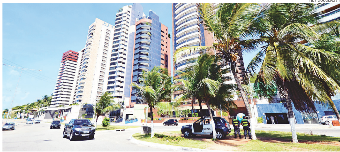
► Avenida Governador Silvío Pedrosa, em Areia Preta: policiamento na área não tem evitado ocorrência de novos assaltos

A reportagem do NOVO JORNAL esteve ontem na praia, por volta das 11h da manhã, e constatou que existe um efetivo policial destinado exclusivamente a garantir a segurança da área. No entanto, um dos policiais que integrava a guarnição da Polícia Militar naquele horário afirmou que