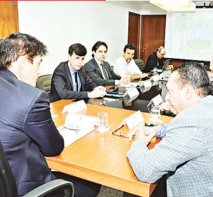
► Na reunião, quadro foi considerado delicado