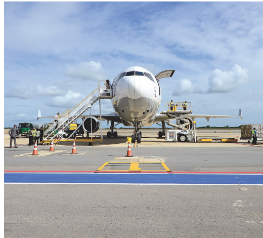
► Primeiro voo domingo levou 70 toneladas de mamão