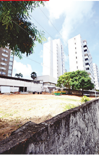
► Terreno fica próximo à sede do TCE