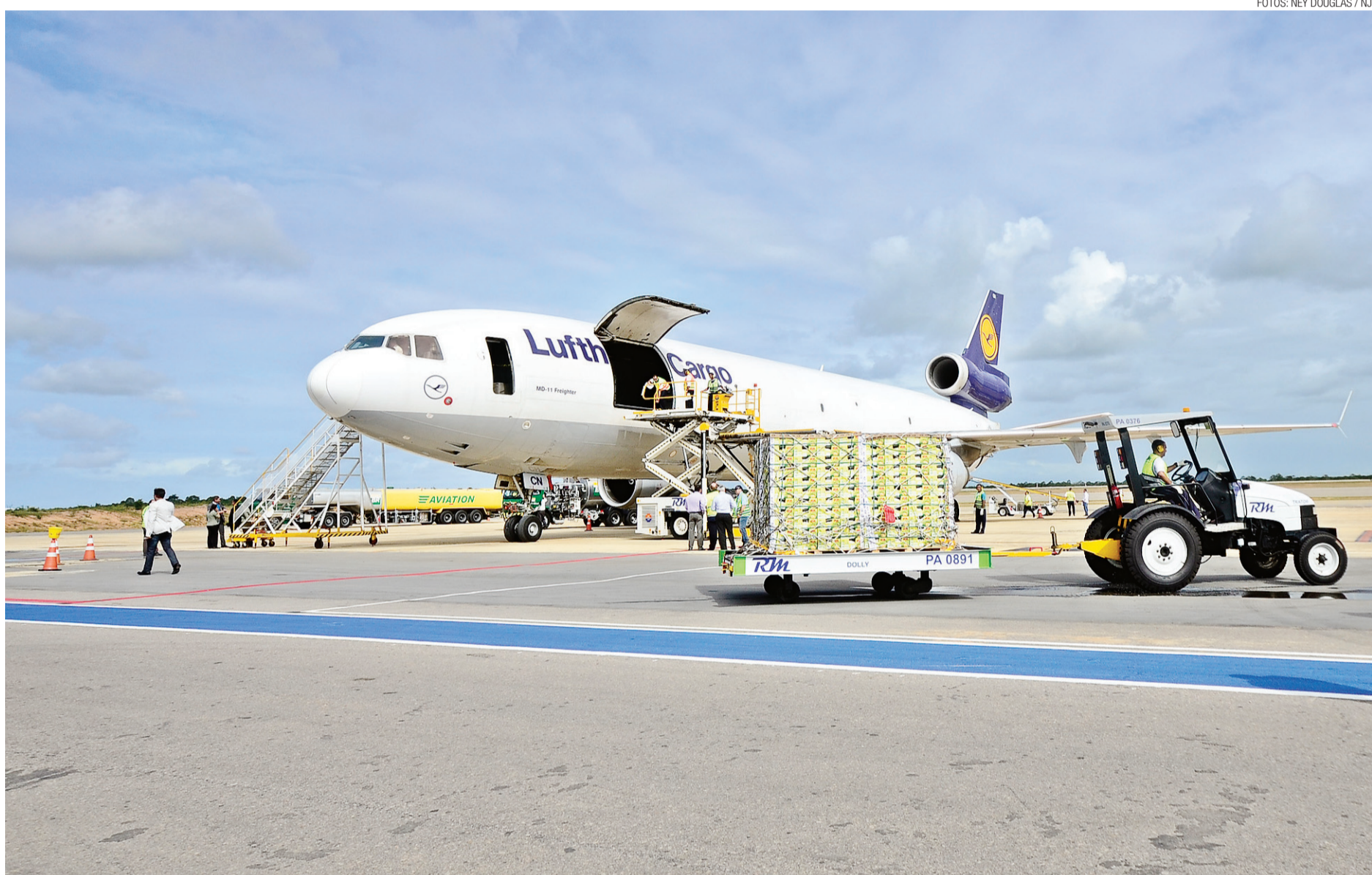
► Aeronave MD-11 Freighter, da Lufthansa Cargo, fez a primeira viagem com a carga de mamão papaya para a Alemanha e, em seguida, distribuída para Suíça e Holanda

"É incrível, mas a produção de exportação aqui do Estado desce toda para São Paulo. Porque a gente tem que descer tudo se a aeronave, no retorno, passa sobre o Nordeste? Então conseguimos com o aeroporto, a possibilidade,