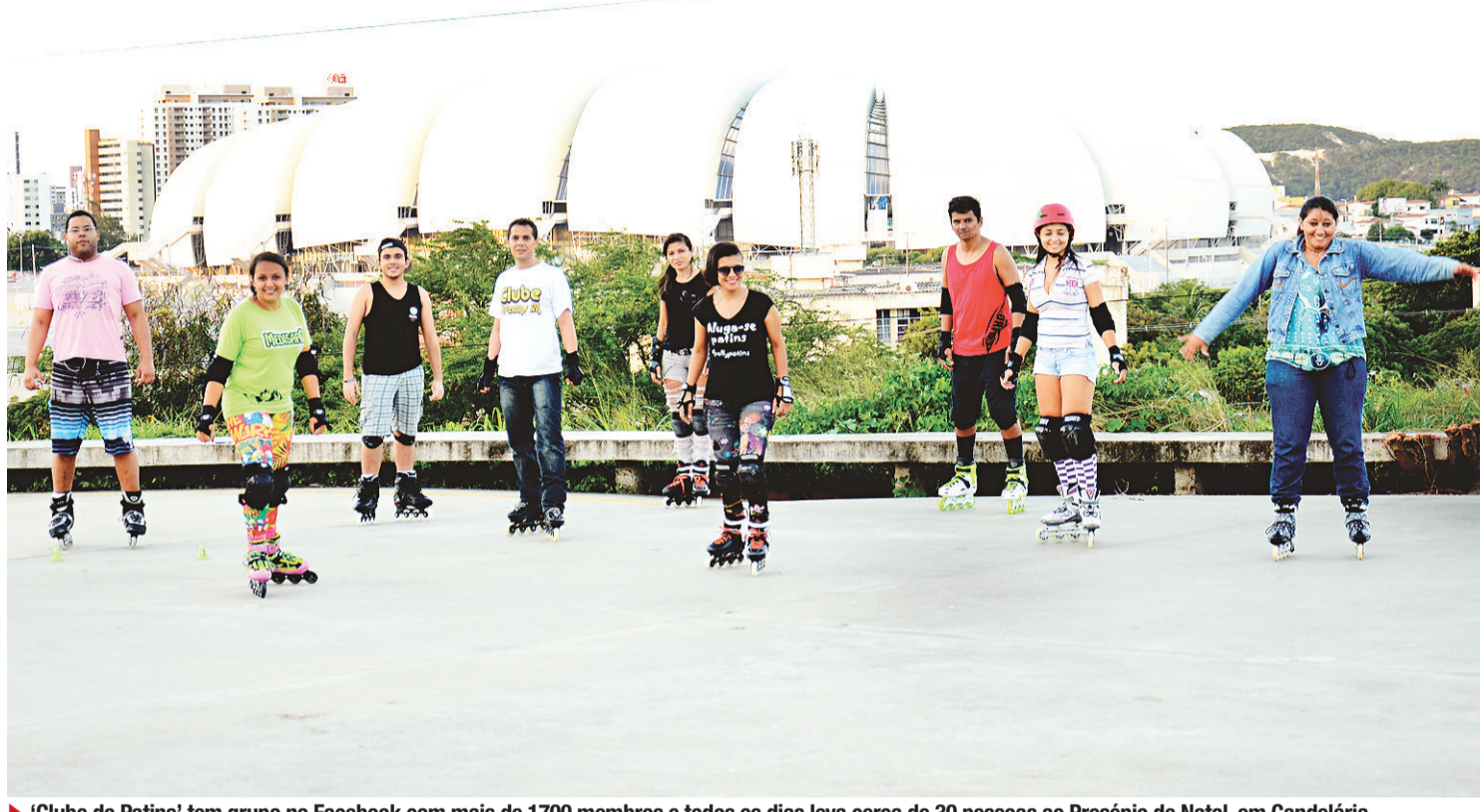
► ‘Clube do Patins’ tem grupo no Facebook com mais de 1700 membros e todos os dias leva cerca de 30 pessoas ao Presépio de Natal, em Candelária