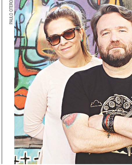
EXEMPLAR DE ASSINANTE