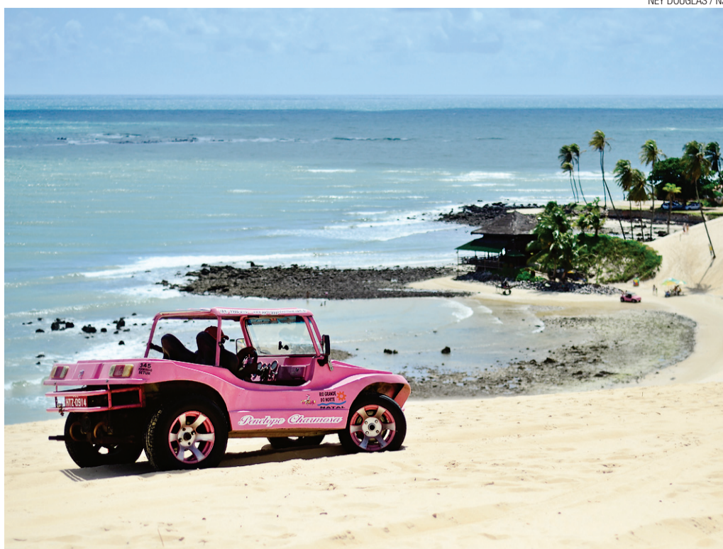
NEY DOUGLAS / NJ

O RN é o único estado com produção própria e autossuficiente do QAV – querosene de aviação usado nas aeronaves das companhias. Localizada há cerca de 170 quilômetros de Natal, a Refinaria