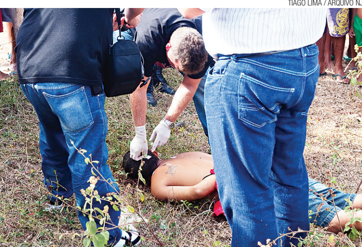
TIAGO LIMA / ARQUIVO NU