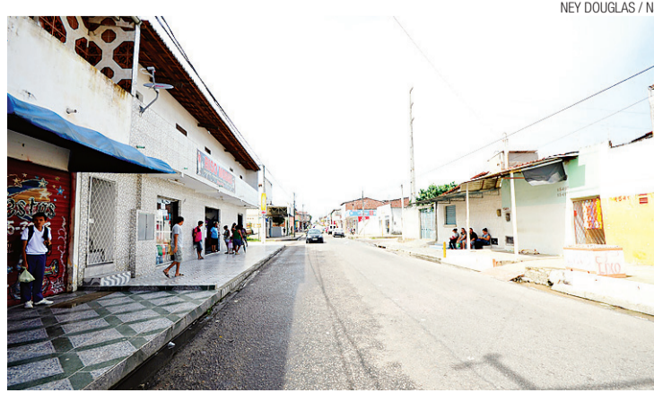
Rua Boa Sorte, em Jardim Progresso, na Zona Norte: casos de violência