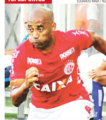
► Cascata é uma das apostas ofensivas