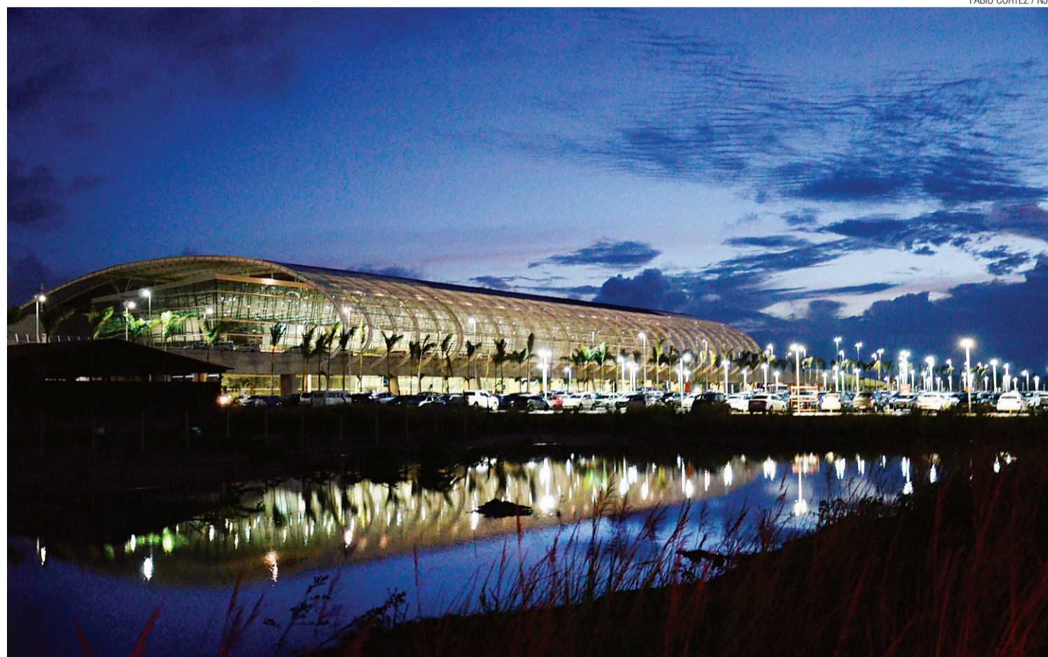
Governo do Estado elegeu a possível instalação do hub da Latam, no aeroporto Aluizio Alves, como prioridade na agenda econômica

As grandes empresas, acrescenta, são as principais responsáveis pelo crescimento econômico, sofisticação do mercado de