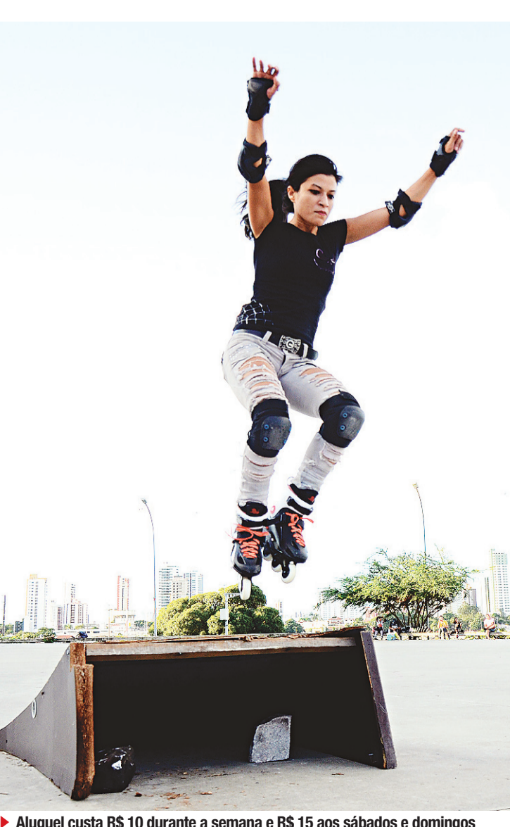
► Aluguel custa R$ 10 durante a semana e R$ 15 aos sábados e domingos