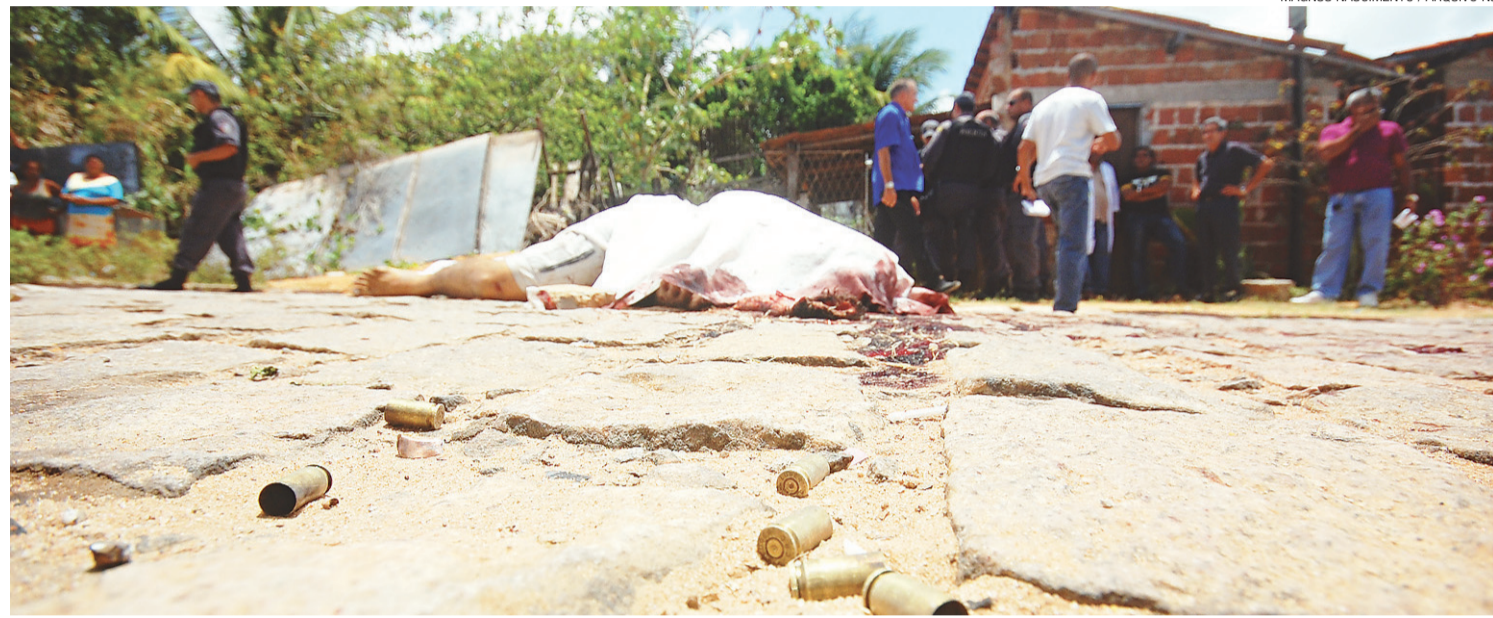
► Assassinato no bairro Bom Pastor, que figura entre os dez mais violentos de Natal; arma de fogo usada no crime também predomina nas ocorrências policiais