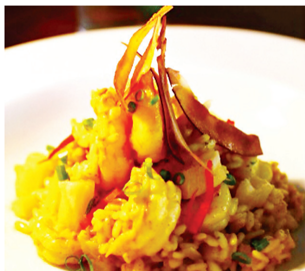
► O delicioso prato Risoto de Camarão com Chips de Banana da Terra