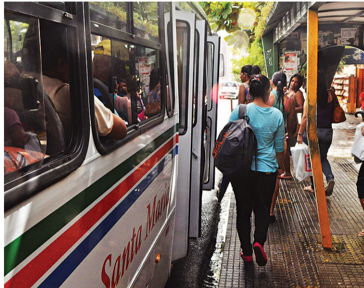
▶ Tarifa do transporte coletiva vai custar R$ 2,65 a partir de amanhã

As perspectivas dos usuários não são as melhores em relação às tarifas do transporte intermunicipal, tampouco do valor que pode chegar após a licitação dos transportes. "Creio que serei demitida devido o custo da minha passagem com esse aumento e também com o que deve ajustar no intermunicipal. Se realmente for instalado ônibus com todo o conforto prometido, vale a pena pagar esse valor ou até mais", argumenta a cozinheira, Railma Silva, 33, que trabalha no distrito de Pirangi, em Parnamirim.