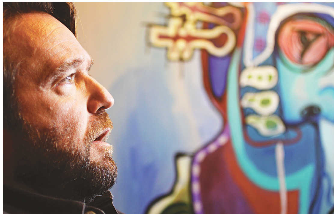
► Em seu estúdio, peças e cores com motivos nordestinos em meio a telas que devem integrar mostra no Solar Bela Vista