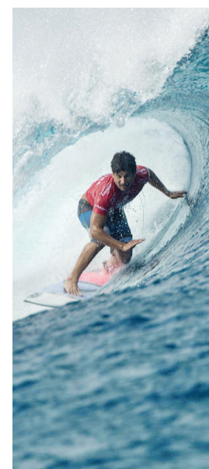
► Ítalo Ferreira no Taiti