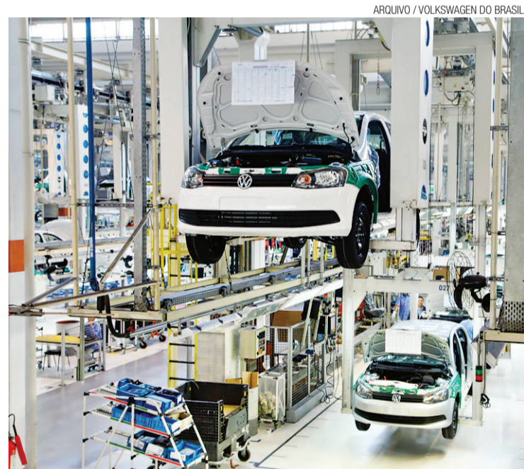
Empresário acredita que fim de isenções não atrapalham o segmento

*Parcela referente ao lote D6 com área de 323m 2 , valor do lote R$ 173.325,14, valor promocional de R$ 129.994,00 com 24 parcelas mensais de R$ 599,90, sendo a primeira no ato da assinatura do contrato, após, mais 24 parcelas mensais de R$ 799,90, sendo a primeira em Maio/2017 e o saldo em 72 parcelas mensais de R$ 991,65, a primeira em Agosto/2019, 10 balões anuais de R$ 2.500,00, o primeiro em 30/12/2015 ** As parcelas serão corrigidas mensalmente pelo IGPM + juros de 1% a.m. calculados pela tabela Price, Tabela referente ao mês de abril/14 - esta condição poderá ser alterada sem prévio aviso. Registro de Incorporação: R-4-9.755, 1º Ofício de Notas da Comarca de Ceará-Mirim, referente à matrícula N° 9.755 / Registro no livro n. 2 - Prenotado no Protocolo n. 1, sob n. 21046 - 3915-J CRECI-RN.