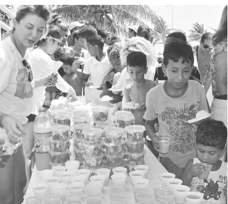
► Café da manhã marca o retorno da escolinha de surf de Areia Preta