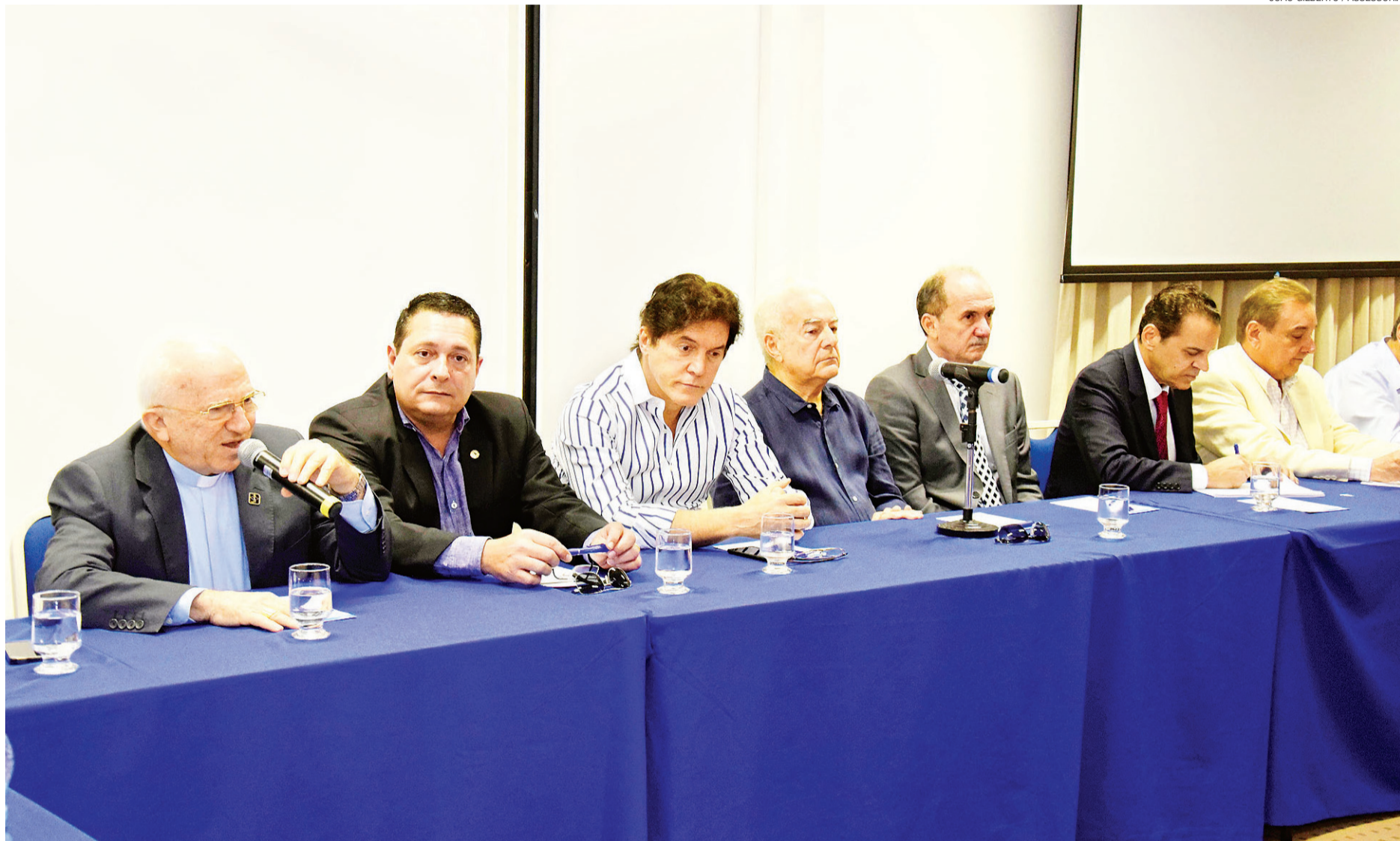
► Robinson Faria convocou toda a classe política e empresarial do estado para ir à Petrobras para tratar sobre condições que podem ser dadas ao RN para ela oferecer preços diferenciados do QAV

Robinson Faria convocou toda a classe política e empresarial do estado para ir à Petrobras. A conversa na estatal será sobre as condições que podem ser dadas ao RN para ele oferecer preços diferenciados do querosene de aviação como a Latam.