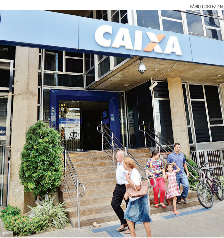
Caixa respondeu que tem investido em treinamento e revisa serviços