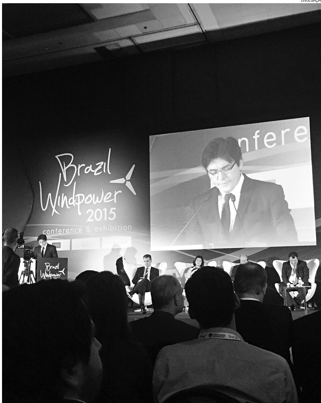
► Governador também se reuniu com a Petrobras para debater novo Prógás e o programa Gás Social

O governador explicou que no Rio Grande do Norte, os investimentos em eólica já chegam a R$ 4 bilhões; e que até 2017 o setor de energia eólica vai gerar mais de 30 mil empregos diretos ou indiretos no Estado. De acordo com