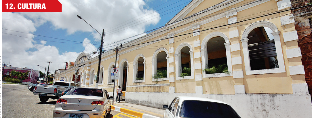
Protesto do setor audiovisual sairá da Fundação Capitania das Artes e vai até o Palácio Felipe Camarão