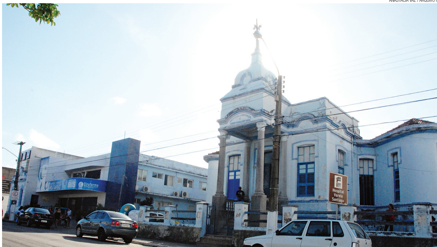
▶ Hospital Infantil Varela Santiago atende a uma média de 60 pacientes por ano: muitas crianças ainda estão sem ser diagnosticadas

"O diagnóstico precoce do câncer infanto-juvenil é hoje uma