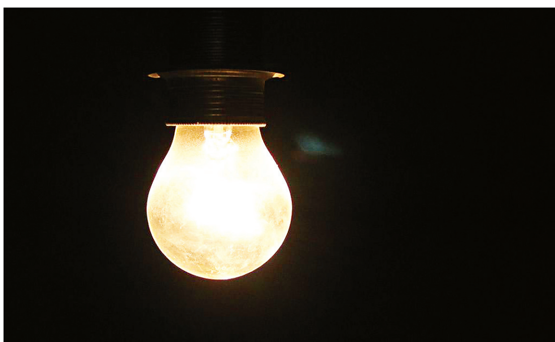
▶ A maior diminuição no mês foi observada no consumo residencial (-5%), a maior dos últimos dez anos

Na área industrial, o consumo de energia elétrica caiu 3,4% em julho, em relação ao mesmo mês