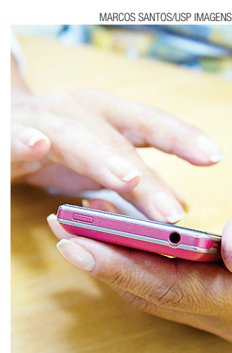
▶ Smartphones sem isenção

"[Esses produtos] tinham alíquota zero para dar acesso à população de baixa renda. Vimos que o programa foi bem sucedido. Com a concorrência