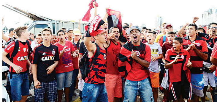
► Chegado do Flamengo causou alvoroço e torcedores foram barrados