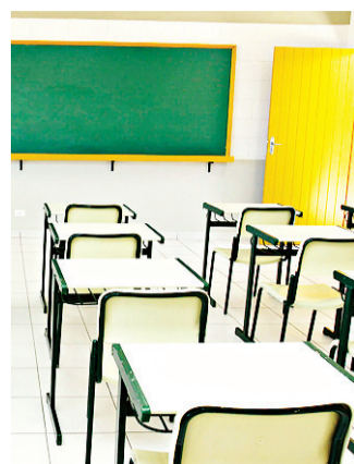
// Estado tem hoje 651.401 alunos matriculados