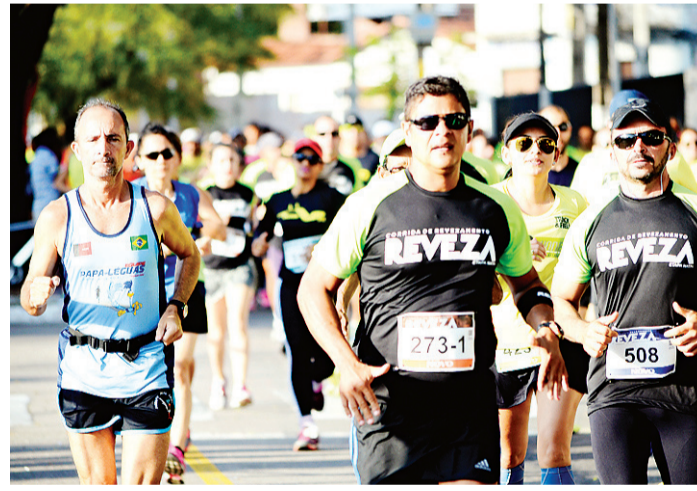
// Circuito foi o primeiro rústico de revezamento realizado em Natal