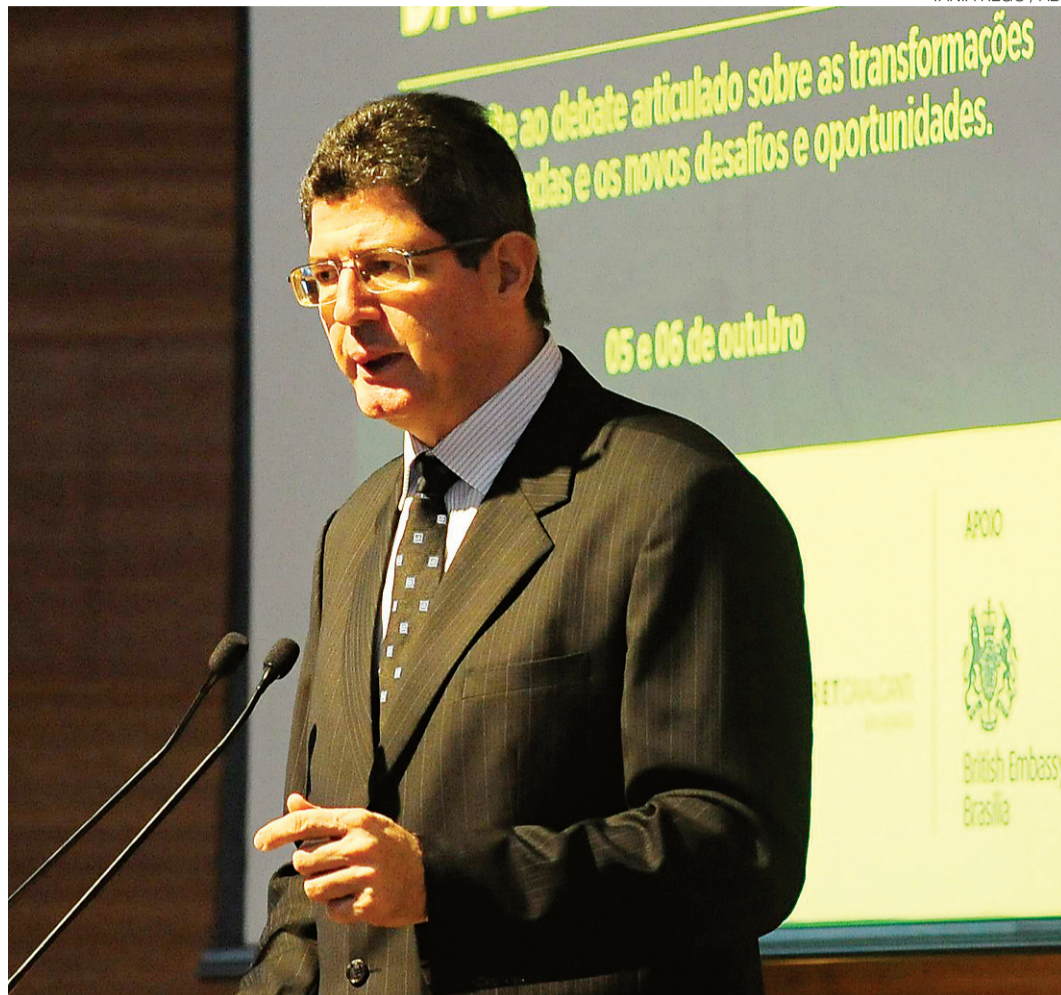
// Joaquim Levy disse que a despesa obrigatória é grande no Brasil e é preciso ter um orçamento confiável

“A CPMF é [na forma] a que o governo mandou e é temporária. Ela tem de ser provisória e é para criar uma fonte para se chegar com segurança onde queremos. Essa segurança é a que leva a um