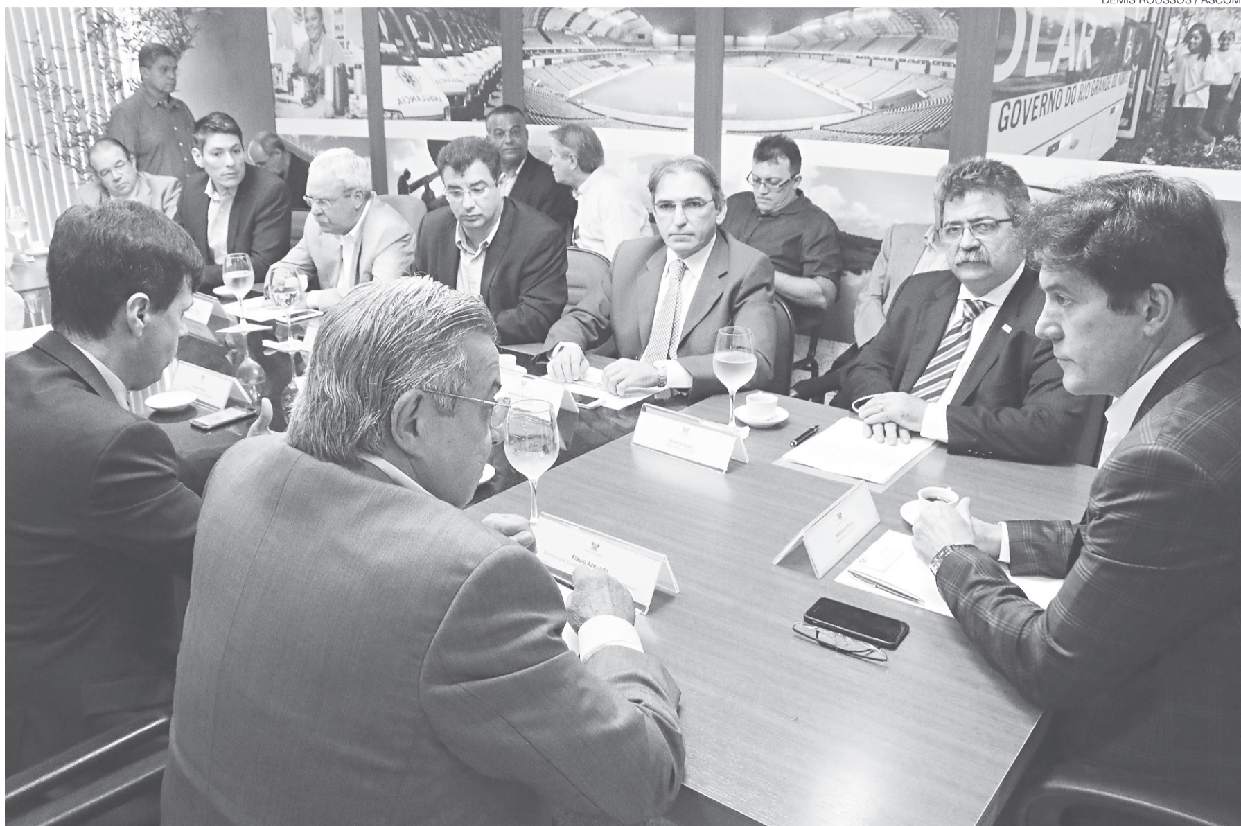
// Em reunião ontem com empresários, governador Robinson Faria fez um relato da situação fiscal do Estado se o projeto de reajuste tributário não for aprovado este ano

"Daqui para frente o governo estará aberto para ouvir propostas para fortalecer também o setor produtivo, com medidas para proteger a economia potiguar", ressaltou Robinson Faria. O governador também quer blindar as empresas potiguares do que ele chamou de "invasão da Paraíba" no comércio local. De acordo com ele, mui-