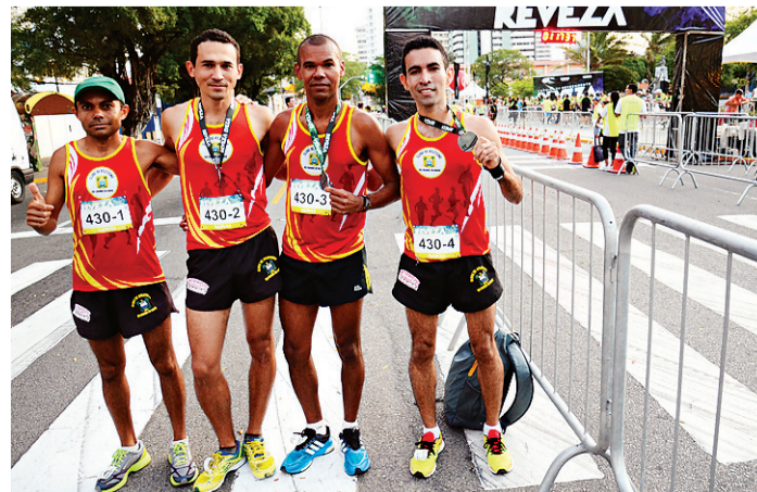
// Equipe CARN venceu a prova geral masculina (20km)