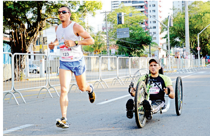
// Prova permite que amigos e familiares corram em conjunto