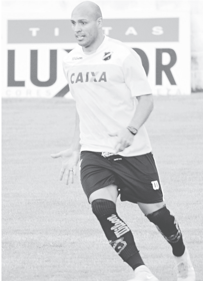
// Edno marcou gol que decretou a última vitória do ABC na Série B