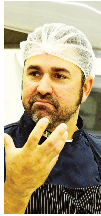
// Chef americano David Guas: defensor do modelo food truck

“Pra mim o mais estranho era estar fora da minha própria cozinha, sem falar que não gosto muito de seguir um roteiro, porque pra mim cozinha é um lugar de muita paixão e de conectar as pessoas, mas mesmo assim era interessante ver a energia entre os participantes”, garante