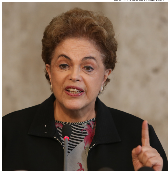
// Dilma Rousseff, presidente: interlocutora nas gravações

“Se os canalhas tivessem mandado um ofício teria ido prestar depoimento. Eu já fui três vezes a Brasília prestar depoimento. Eu acho que o Moro quis fazer um espe-