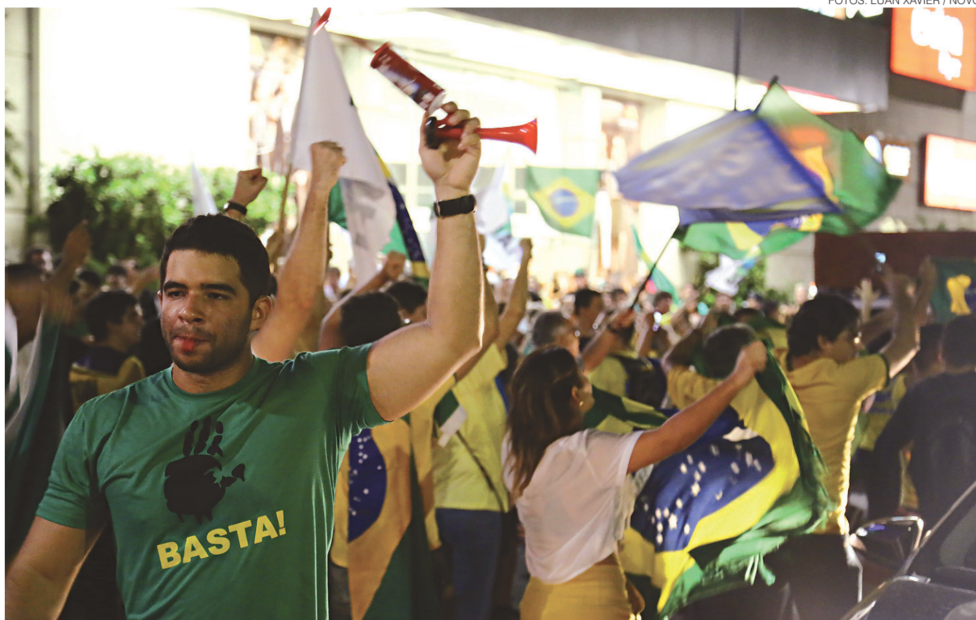
// Manifestantes se concentraram no cruzamento das avenidas Salgado Filho e Bernardo Vieira, na calçada do shopping Midway Mall