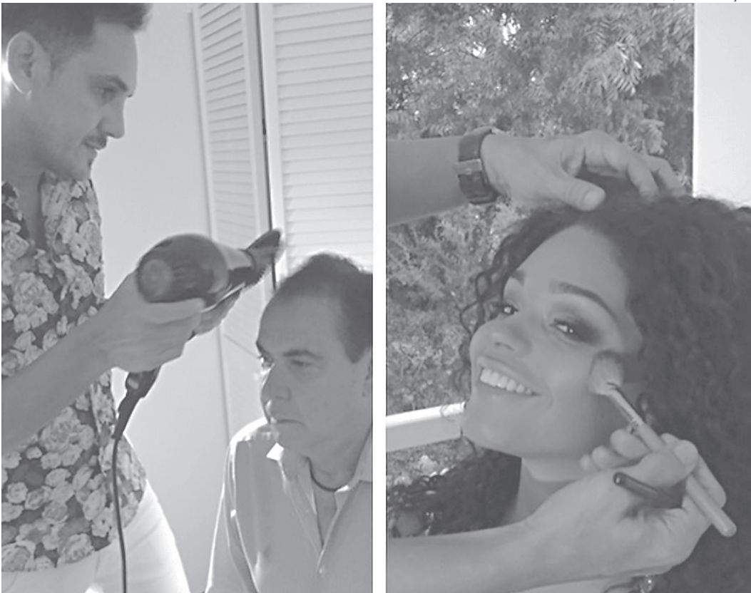
// O cabeleireiro top potiguar Sinval de Souza está em Curaçau cuidando da beleza de celebridades como Juliana Alves e Amaury Jr para o Curaçau Fashion Week