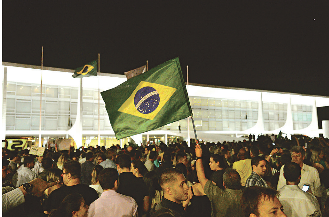
// Manifestações em Brasília, onde populares protestaram contra a nomeação de Lula para o ministério

Nas redes sociais, as manifestações ganharam destaque. A hashtag #OcupaBrasilia está em primeiro lugar no trending topics (os dez assuntos mais comentados na rede) no Brasil e em segundo no mundo. No