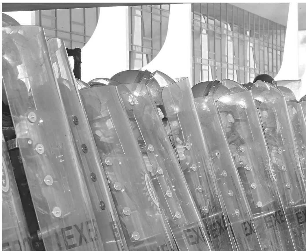
// Policiamento reforçado para garantir a segurança dos manifestantes e evitar conflitos