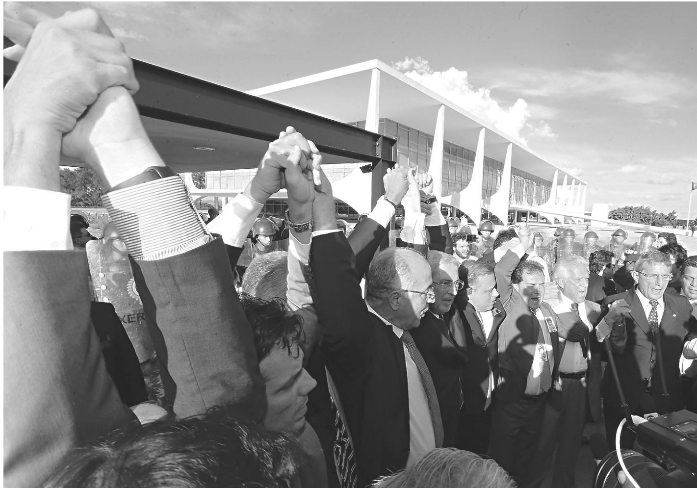
// Parlamentares da oposição se reúnem para marcar posição diante dos últimos acontecimentos em Brasília

Partidos de oposição apostam na pressão das ruas sobre os parlamentares para impedir que o ingresso do petista no Palácio do Planalto reverta a atual crise política e esfrie os ânimos favorá-