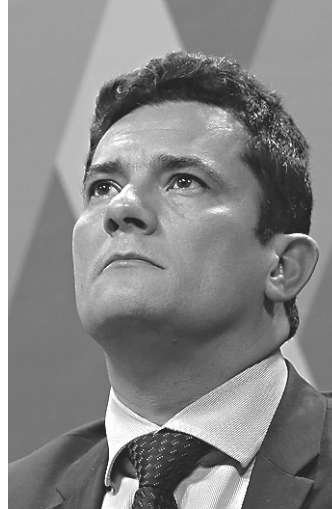
// Sérgio Moro, juiz: criticado pelo advogado de Lula

“Foi uma arbitrariedade muito grande. Um grampo envolvendo uma presidenta da República é um fato muito grave, nós enten-