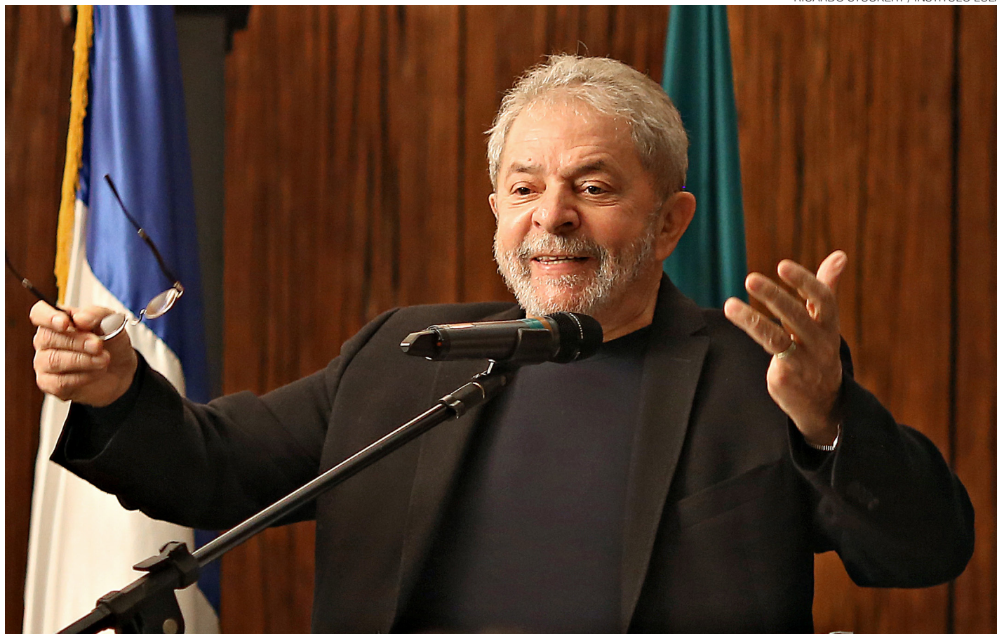
// Luiz Inácio Lula da Silva, ex-presidente nomeado para a chefia da Casa Civil: diálogos gravados comprometem conduta

O juiz da Lava Jato remeteu o conteúdo referente a Lula para o Supremo Tribunal Federal (STF), após ele ser nomeado ministro da Casa Civil, nesta quarta-feira. “A interceptação foi interrompida.” O juiz registra que “alguns diálogos sugerem que tinha conhecimento antecipado das buscas efetivadas em 4 de março de