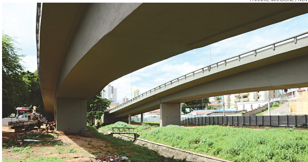
// Custo total da reforma deve girar em torno de R$ 2,4 milhões, segundo a Semov

Ainda de acordo com a Semov, restam os serviços de substituição do neoprene – um tipo de borracha que dá sustentação à estrutura – e a pintura. Além disso, também serão colocadas as lâmpadas nos postes do viaduto, trabalho que cabe à Secretaria de Serviços Urbanos (Semsur).