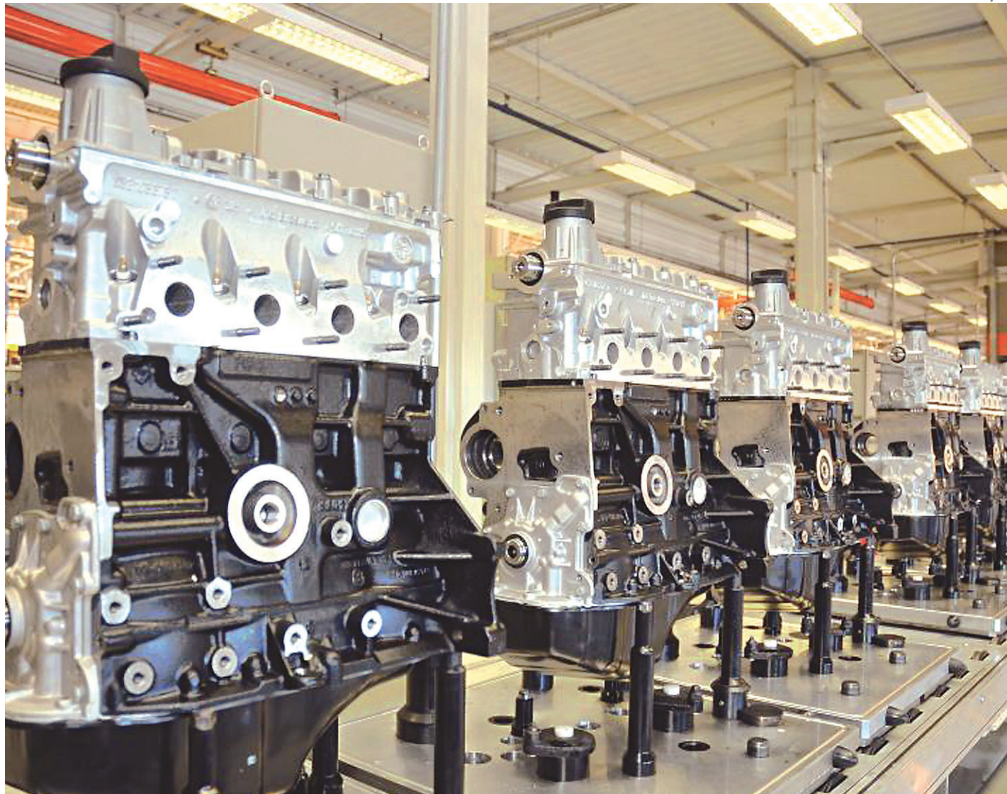
A recuperação industrial, segundo a CNI, é positiva mas ainda está muito baixo e redução do pessimismo não é disseminada em todo o setor

"A recuperação é positiva, mas o índice ainda está muito baixo. Por exemplo, mantido esse ritmo, o ICEI levaria 26 meses para superar os 50