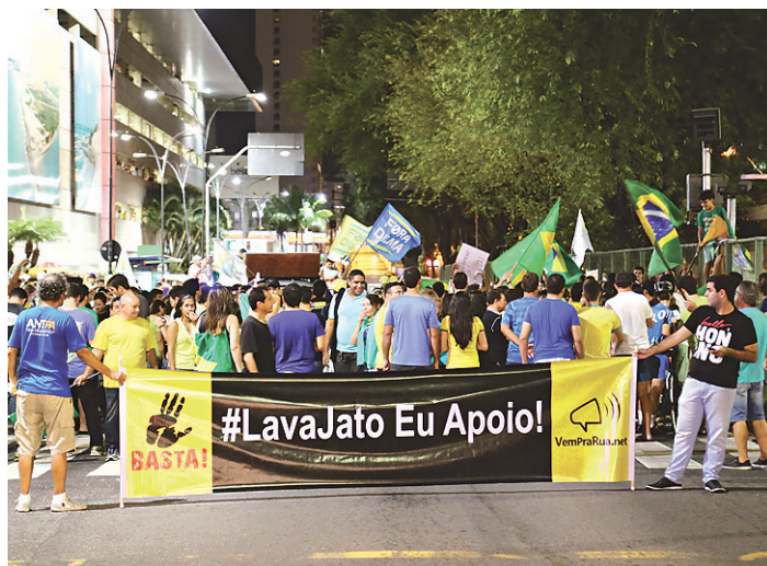
// Com faixas e cartazes, eles pediram a saída de Dilma da presidência e a anulação da posse de Lula no ministério

Durante o tempo de permanência da reportagem no protesto, cerca de uma hora, o ato permaneceu pacífico, reunindo, inclusive, crianças e idosos. Também não foram vistos representantes partidários ou bandeiras de partidos políticos.