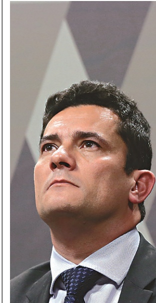
// Sérgio Moro, juiz da Lava Jato: conclusão prematura