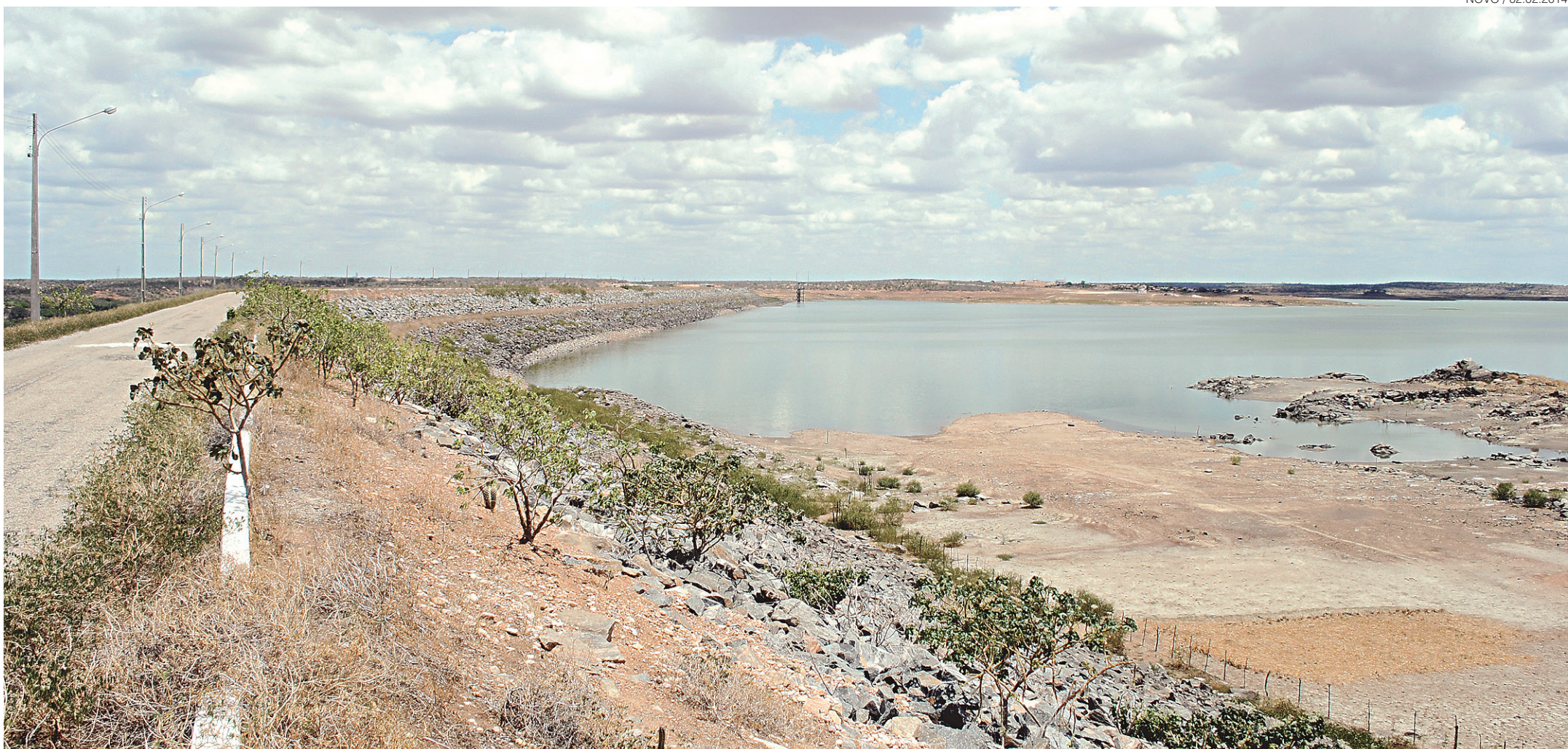
// Localizada na bacia Piranhas-Açu, o maior reservatório potiguar, a Barragem Armando Ribeiro Gonçalves, que comporta até 2,4 bilhões de m 3 de água, registra a pior medição da sua história e nunca esteve tão seco