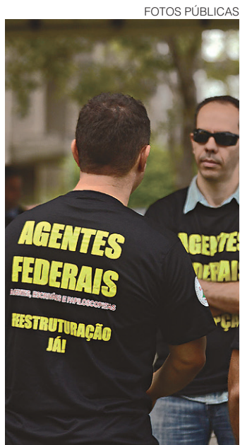
// Polícia Federal durante a Operação Acarajé

cumentos semelhantes já encontrados na Lava Jato e revelaram a atuação de cartel das empreiteiras em obras na Petrobras. Em meio aos avanços da Lava Jato, os executivos da empreiteira anunciaram nesta terça-feira, 22, que vão fazer uma “colaboração definitiva” com as investigações. Nos documentos, contudo, não há nenhum indicativo que os pagamentos sejam irregulares ou fruto de caixa 2 e tampouco a Polícia Federal teve tempo para analisar a vasta documentação.