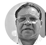
Bispo Francisco de Assis (ex-PSB)