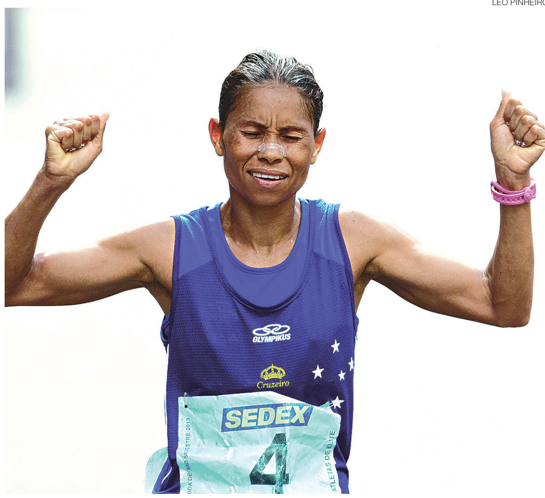
// Atleta do Cruzeiro foi julgada pelo Superior Tribunal de Justiça Desportiva (STJD)

Têm direito à bolsa os atletas que ficaram nas três primeiras colocações em competições de nível nacional (R$ 925), sul-americano, pan-americano ou mundial (R$ 1.850). O ministério e as respectivas confederações, entretanto, não levam isso à risca. No tênis, por exemplo, o evento de nível mundial masculino adulto é o Challenger de Santiago, no Chile, que teve Rogério Dutra Silva como campeão.