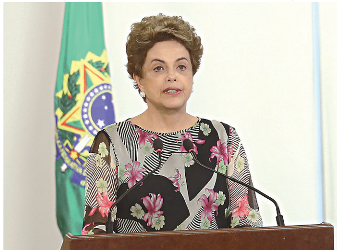
// Dilma Rousseff: lutando pelo mandato

As escutas telefônicas envolvendo Dilma e o ex-presidente Luiz Inácio Lula da Silva, que revelam suposta manobra da presidente para interferir no Judiciário, foram deixadas de lado pela OAB. A entidade reconheceu haver dúvidas sobre a legalidade da quebra de sigilo das conversas. Na terça-feira, 22, o ministro Teori Zavascki, relator da Lava Jato no Su-