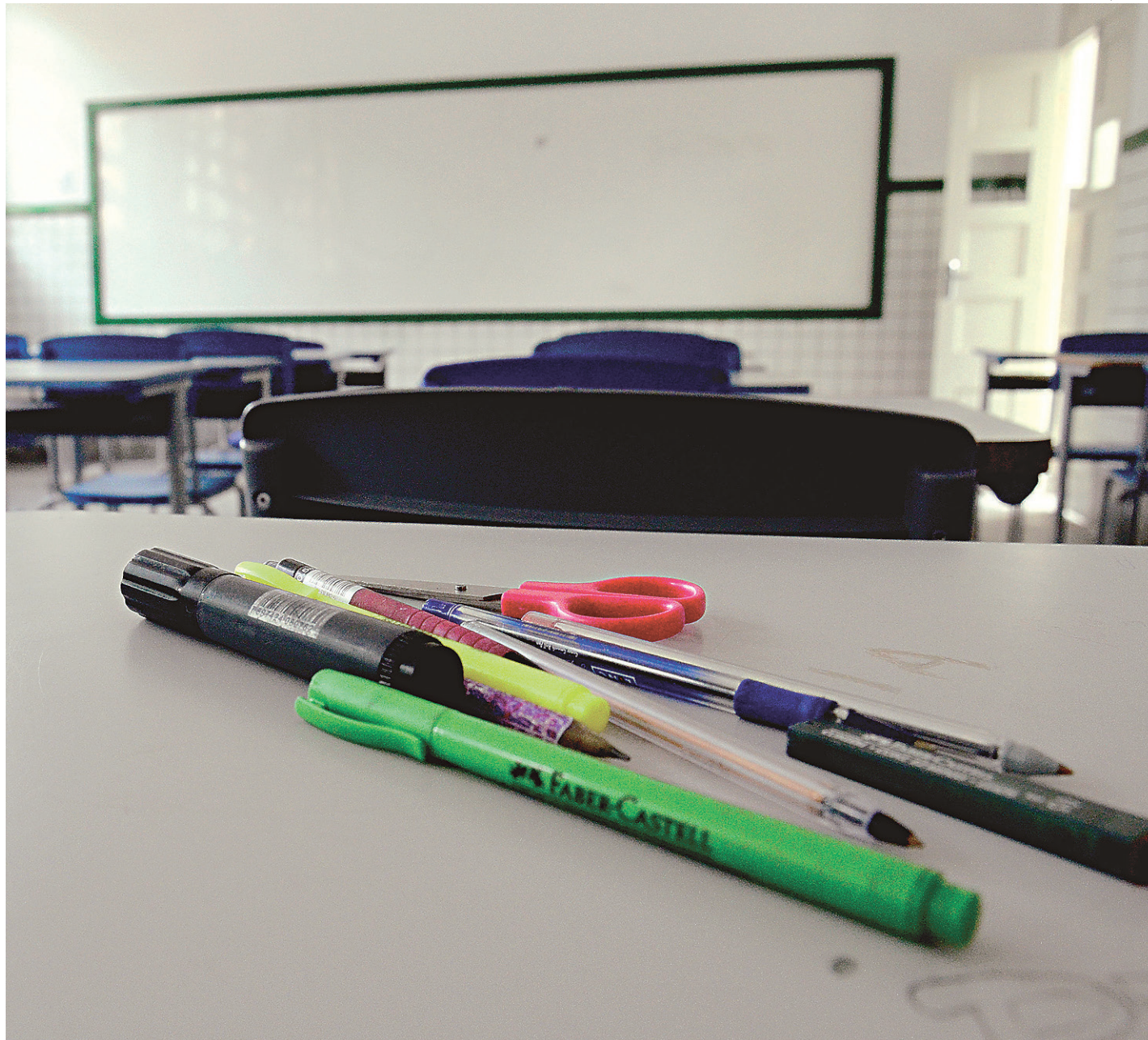
// Mesmo com aulas programadas para as férias de julho e na última semana do ano, pasta acredita ser necessário esticar calendário até janeiro

Para a titular da SME, esse o prazo máximo aceito pela pasta, uma vez que não prejudica o calendário de matrículas do próximo ano, nem o