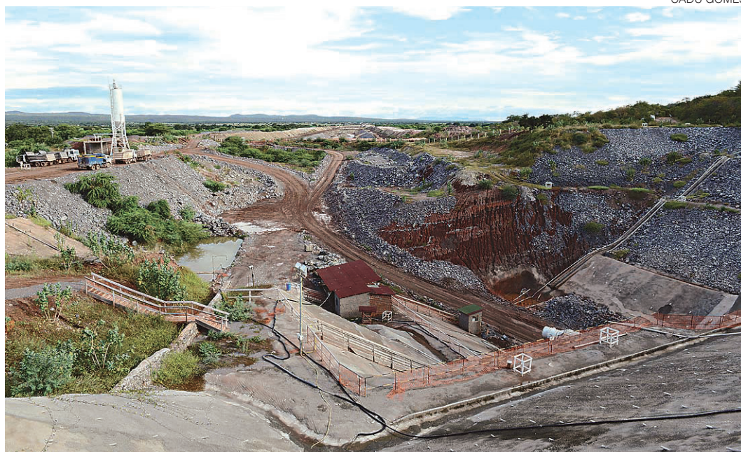
// Obra da transposição do rio São Francisco tem previsão de ser concluída em dezembro