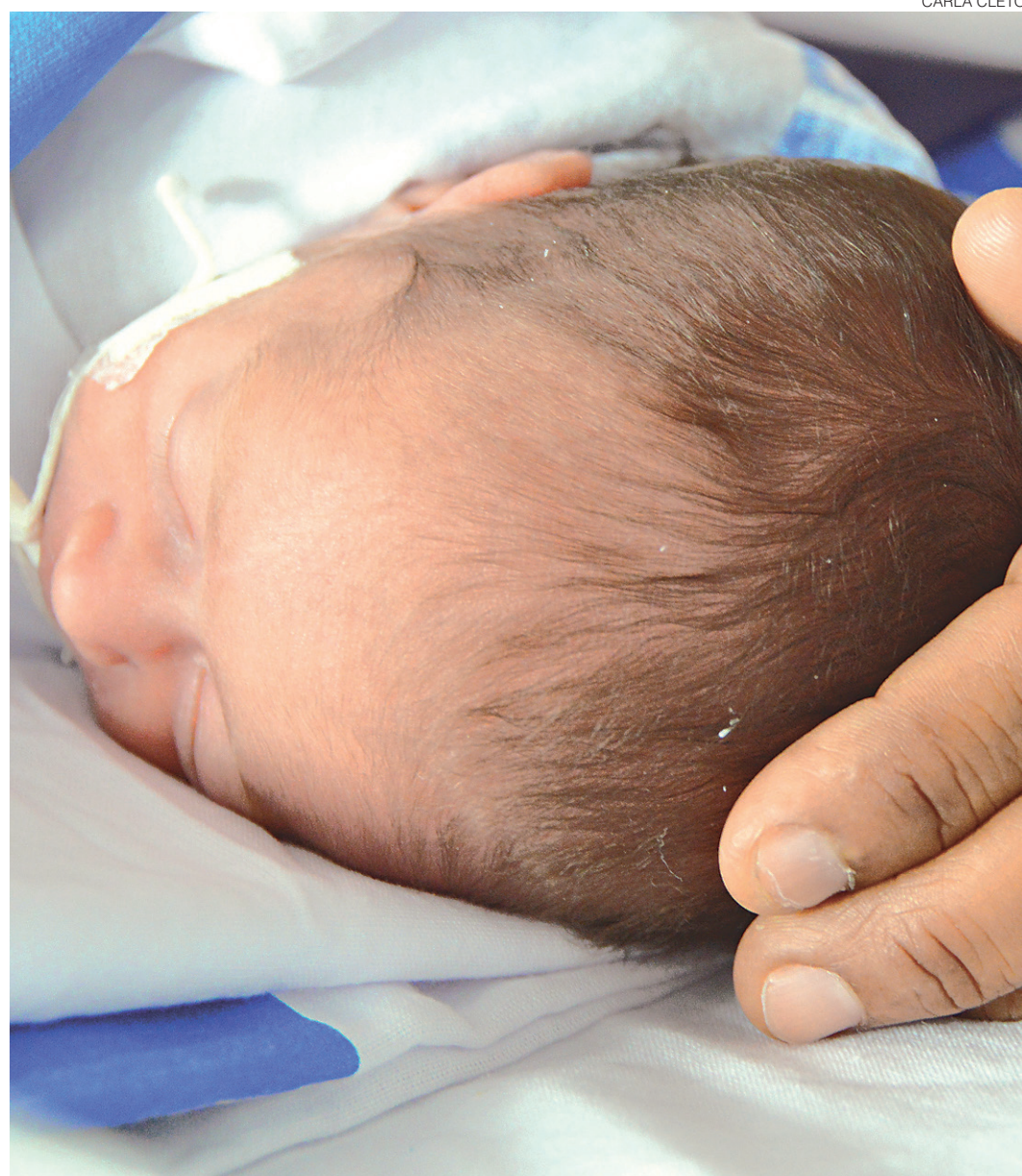
// Até ontem, pelo menos 290 casos estavam ainda sob investigação da Secretaria de Saúde

O Ministério da Saúde orienta as gestantes adotarem medidas que possam reduzir a presença do mosquito Aedes aegypti , com a eliminação de criadouros, e proteger-se da exposição de mosquitos, como manter portas e janelas fechadas ou teladas, usar calça e camisa de manga comprida e utilizar repelentes permitidos para gestantes.