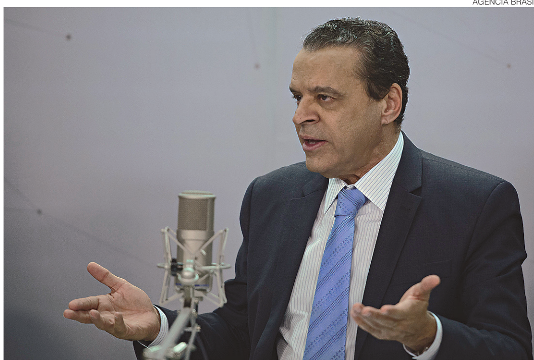
// Henrique Eduardo Alves, ministro do Turismo: constam na prestação de contas apresentadas à Justiça

“A Odebrecht doou para o PMDB em alguns momentos a meu pedido, para a campanha do Henrique (Alves), enfim, para o PMDB e o partido distribuiu, não diretamente para a minha campanha, se eu bem recorde”, completou.