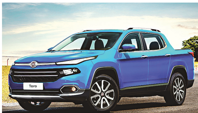
// Com a Toro, Fiat entra com força no mercado das picapes

Durante a curta avaliação, feita em trecho predominantemente urbano, a versão Freedom 1.8 da picape mostrou que fez a lição de casa, mas não empolga. Em subidas, é preciso pisar fundo no acelerador e subir o giro do motor para se obter alguma agilidade.