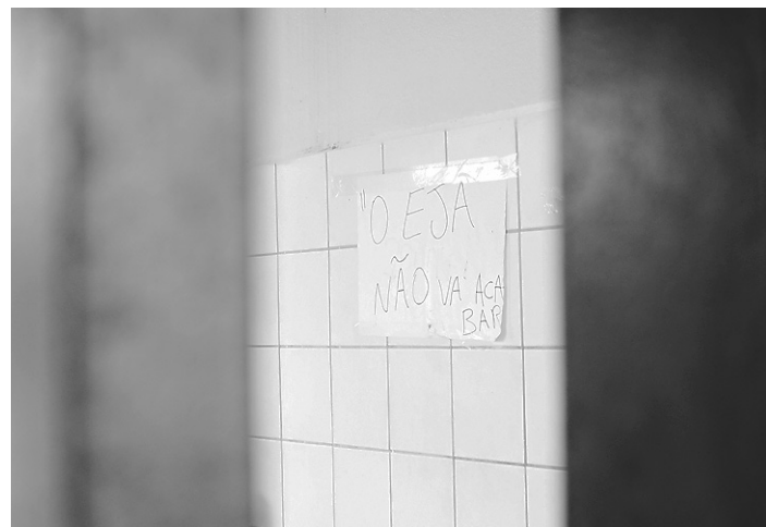
// Alunos chegaram a articular protesto, mas apenas afixaram cartazes cobrando mais atenção com o Ensino de Jovens e Adultos