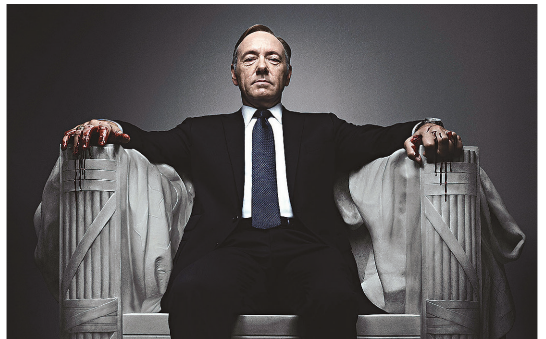
// Kevin Spacey (Underwood) volta a encarnar o político sem escrúpulos na quarta temporada da série

O novo e quarto ano é, de alguma maneira, o fim de um ciclo. Mesmo que a série tenha sido renovada e vá ganhar uma quinta temporada, ela não terá mais à frente Beau Willimon, seu criador. A saída deixa clara a ideia há algum tempo especulada de que House of Cards teria a duração de um mandato. Underwood galgando posições no cenário político, até enfrentar, finalmente, uma eleição e, talvez, perder - o posto, a sanidade, a vida? Ao anunciar um quinto ano, a Netflix enfraquece o próprio produto. Sabe-se que Underwood sobreviverá à eleição, de alguma forma. Perdendo ou