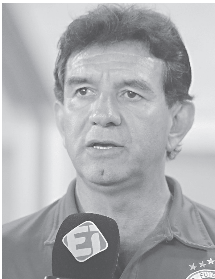
// Time de Macuglia vem de uma sequência de jogos importantes

Neste momento, a prioridade será a Copa do Nordeste. “A nossa ideia, juntamente com a direção é procurar focar mais na Copa do Nordeste, que é uma competição importante para uma grande equipe como é o América. A gente tem uma possibilidade de classificação, então no Campeonato Potiguar a gente talvez crie outra equipe em determinados momentos para que esses jogadores não sofram risco de lesões”,