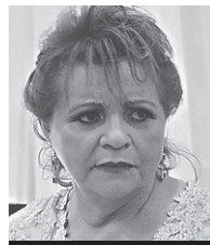
"O TRE Está trabalhando desde as últimas eleições pensando na próxima"

O 4º Encontro de Trombonistas do Rio Grande do Norte começa,