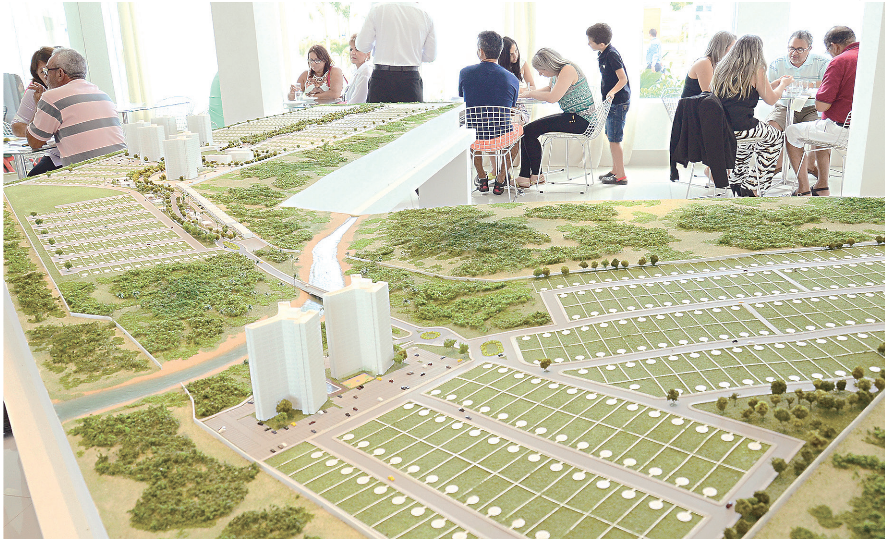
// Incorporadora Ritz-G5 aquece mercado imobiliário com o Majestic Village. Maquete dá a dimensão do projeto que terá 10 condomínios residenciais e um comercial

As empresas da área avaliam que este e outros lançamentos que possam vir a se concretizar são essenciais neste momento de crise econômica que o país vive. As unidades em estoque vêm sendo vendidas mês a mês, segundo as próprias empresas, inclusive, em volume maior do que nos anos anteriores. “É importante lançar nesse momento, mostrar que o mercado está reagindo e que há demanda e necessidade de compra”, destaca o