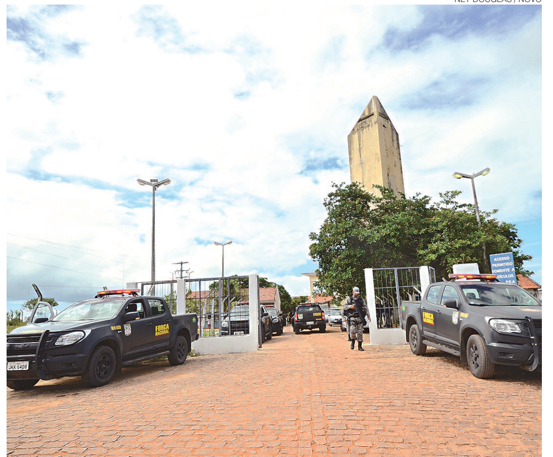
NEY DOUGLAS / NOVO

Ainda de acordo com o que informou Ivo Freire, após a divulgação da entrevista concedida por Pai Bola, os agentes da Penitenciária de Alcaçuz realizaram uma revista, porém só encontraram "pedaços" do aparelho. "Ele disse que havia se desfeito do celular", conta.