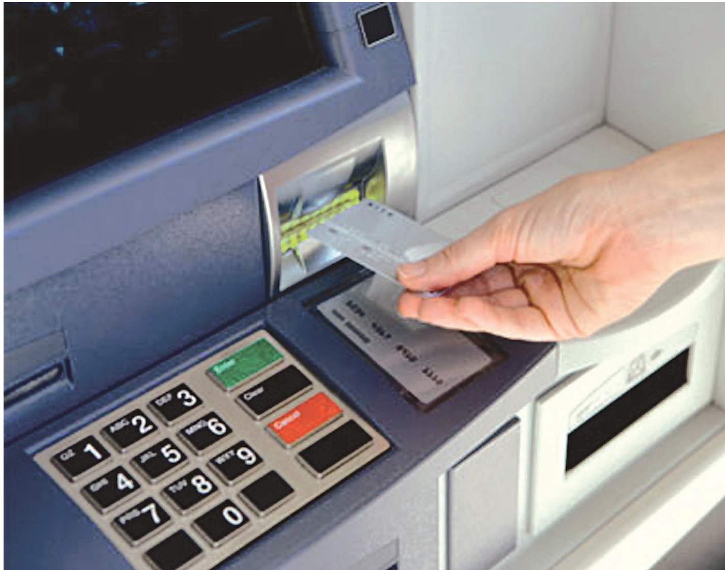
// A Polícia Civil orienta as pessoas a não repassarem informações confidenciais à estranhos, para evitar o golpe

O próximo passo é pedir que a vítima se dirija até um terminal eletrônico, onde vai liberar o suporte pagamento do prêmio fictício. "Eles dão várias voltas no sistema,