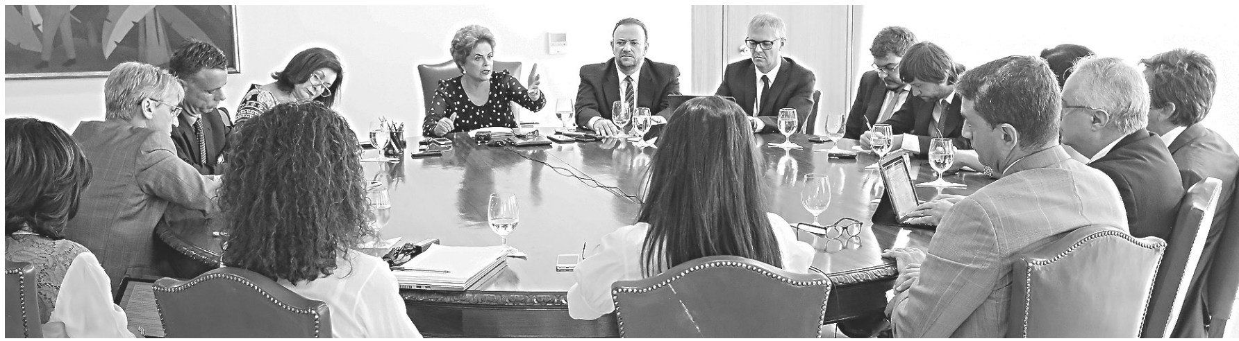
// Dilma recebeu representantes dos principais veículos de comunicação do País e defendeu que a crise política faz com que a econômica se torne mais aguda