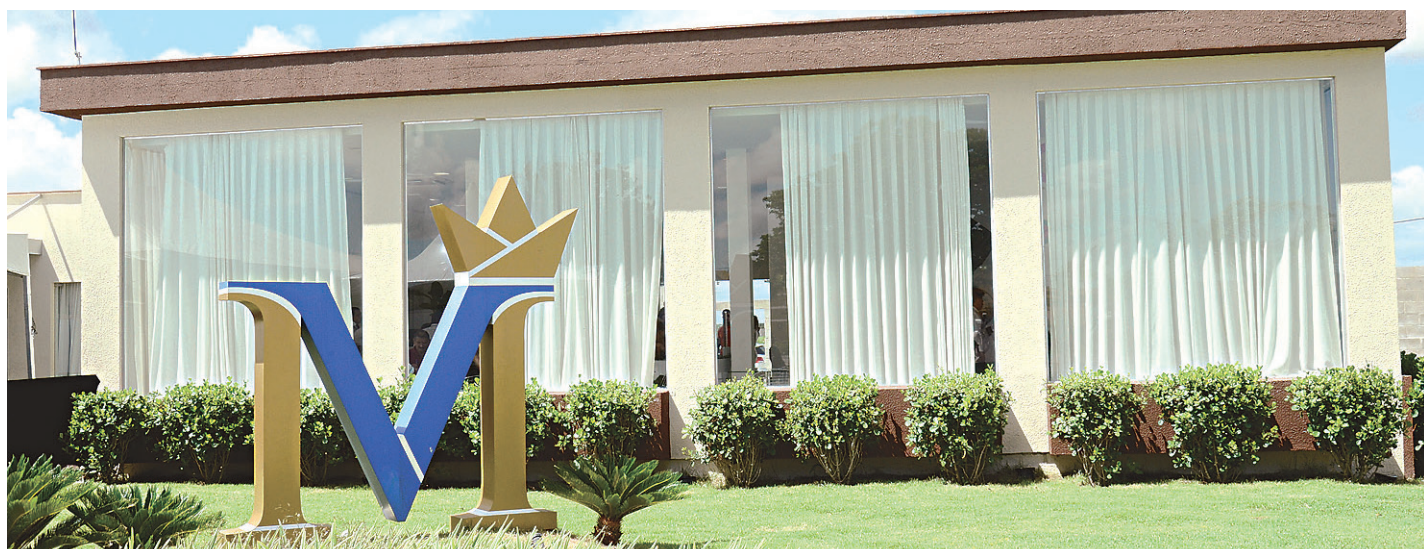
// Complexo de condomínios Majestic Village fica em Cajupiranga, em Parnamirim, na Região Metropolitana de Natal, em área privilegiada

Nossos estoques estão extremamente baixos”, diz. De 2013 até o início deste ano foram vendidas 3.400 unidades das 6.600 que estavam disponíveis. Até o final desse mês, a pesquisa trimestral do Sinduscon vai revelar quanto ainda resta à venda, quanto de empregos o setor mantém e o que se prevê em novas construções.