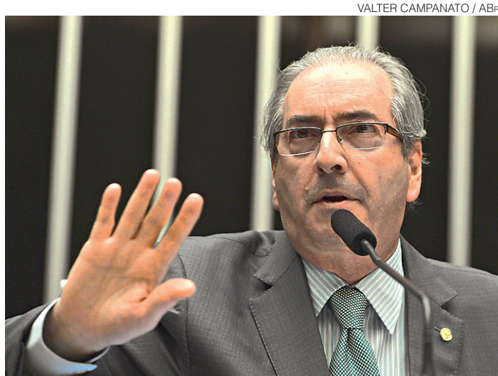
// Decisão de Eduardo Cunha gerou mais uma polêmica

A decisão de Cunha foi lida na sessão de ontem pelo primeiro-secretário da Casa, deputado Beto Mansur (PRB-SP). "Não há razão lógica e jurídica para aplicar, agora, o procedimento definido no caso [do ex-presidente Fernando] Collor [de Mello] para a chamada nominal por or-