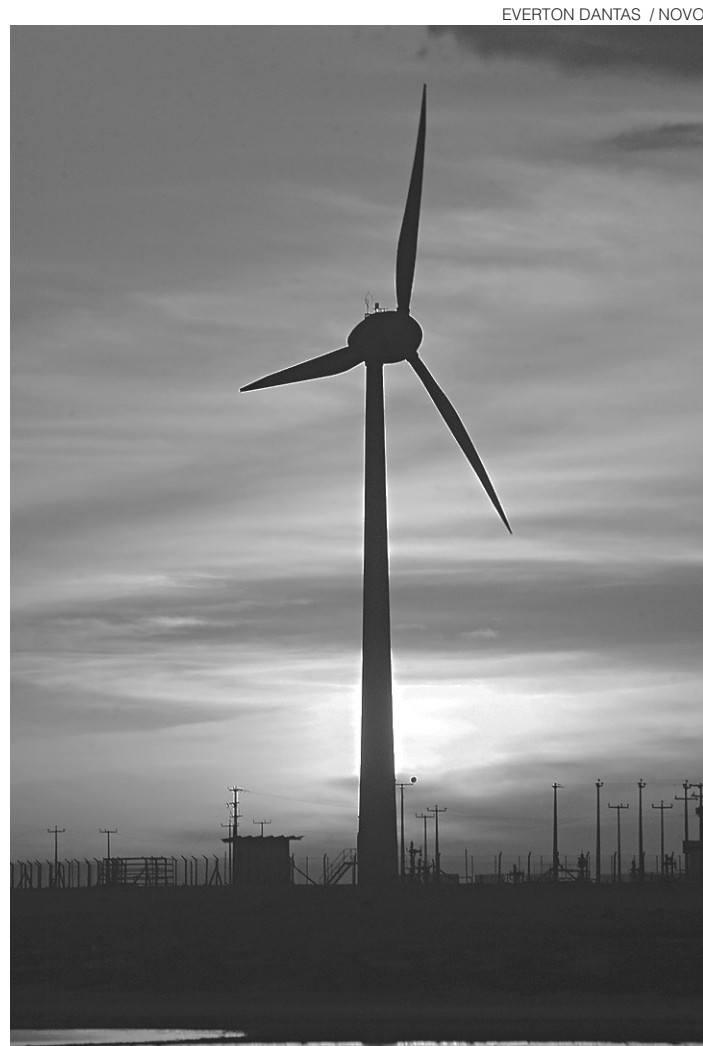
EVERTON DANTAS / NOVO

Encontro vai reunir executivos e empresários para um debate sobre os principais gargalos do setor no país, que hoje são, principalmente, os ambientais e estruturais