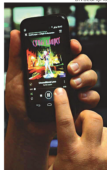
// Relatório confirma tendência de amadurecimento do mercado

“A mensagem é clara e vem de uma comunidade musical unida: o ‘value gap’ é a maior limitação para o crescimento das receitas dos artistas, gravadoras e detentores dos direitos sobre as músicas. Mudança é necessária - e é para os legisladores que