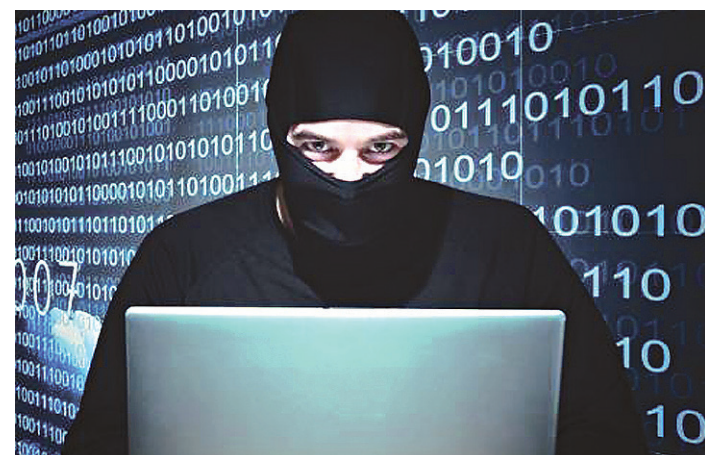
// Sites de compras são os principais alvos dos estelionatários

Os crimes de estelionato também se estendem às redes sociais e sites de compras na internet. Segundo Fábio Vila, o OLX, que tem se popularizado no Rio Grande do Norte, é alvo dos criminosos para aplicar os golpes sob o respaldo do endereço virtual.