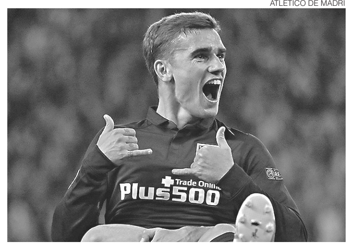
// Carrasco do Barça, Griezmann marcou os dois gols da partida

Real, Atlético de Madrid, Bayern de Munique e Manchester City estão classificados para as semis. O sorteio será amanhã.