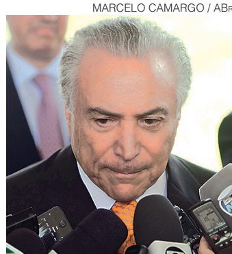
// Após discurso, Temer agora quer vazar para longe de Dilma

Após decisão tomada em março pelo presidente do Tribunal Superior, ministro Dias