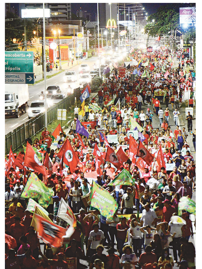
// Manifestantes seguiram de forma pacífica até a UFRN

A manifestação ocorreu de forma pacífica, sem registros de violência. Quando o ato ainda seguia pela Av. Salgado Filho, dois homens tentaram se pendurar nas grades do prédio da Fiern, mas foram impedidos por outros manifestantes.