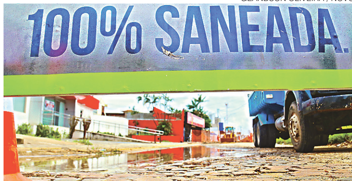
// Previsão do governo é deixar Natal 100% saneada em dois anos