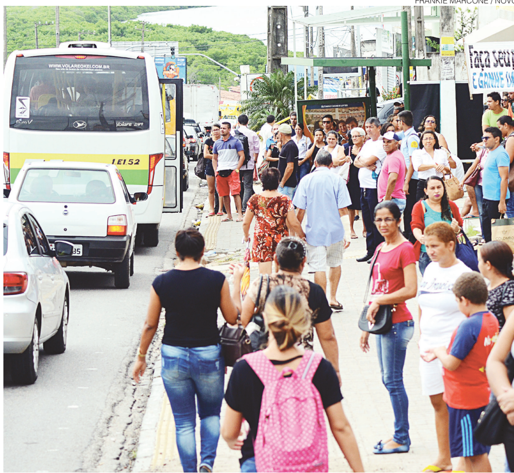
// Com garagens fechadas, única opção durante a manhã eram os alternativos intermunicipais

Era 6h45 quando chegamos no nosso destino. O ponto de ônibus na avenida, para o nosso azar, também estava lotado. Pelo menos 15 pessoas na mesma ingrata espera. Muita reclamação e pouquíssima paciência.