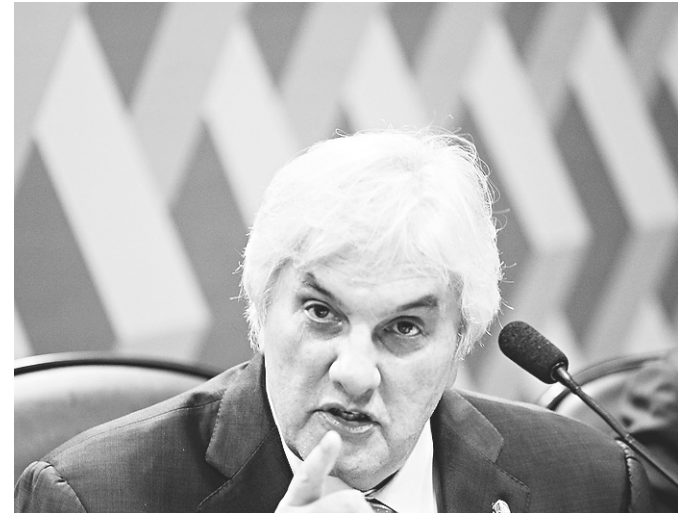
// Cassado, Delcídio do Amaral culpa Renan Calheiros

Por 74 votos a 0 e uma abstenção, o plenário do Senado decidiu pela perda do mandato do ex-líder do governo na Casa, Delcídio Amaral (sem partido - MS), responsável pela delação mais fulminante até agora na Lava Jato, que acusa a presidente Dilma Rousseff, o ex-presidente Luiz Inácio Lula da Silva, o presidente do PSDB Aécio Neves e a cúpula do PMDB no Senado, incluindo o presidente da Casa Renan Calheiros.