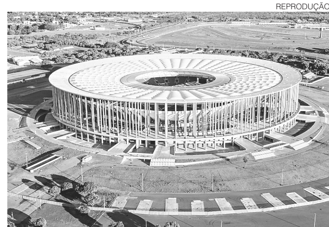
// Estádio foi o mais caro entre os que receberam jogos da Copa

"Nós temos que fazer uma equipe competitiva, para tentar errar o menos possível, porque a gente não vai dar a certeza de que teremos aquele atleta como pensamos, só no dia a dia e com os jogos é que vamos ter essa real confiança. O que nós temos aqui é formatar uma equipe que seja competitiva para a Série C e também para a Copa do Brasil", destaca.