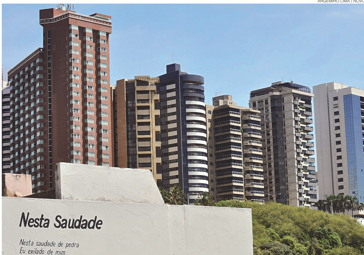
// Pesquisa do sindicato ainda mostra que o natalense prefere comprar imóveis em acabamento ou já prontos