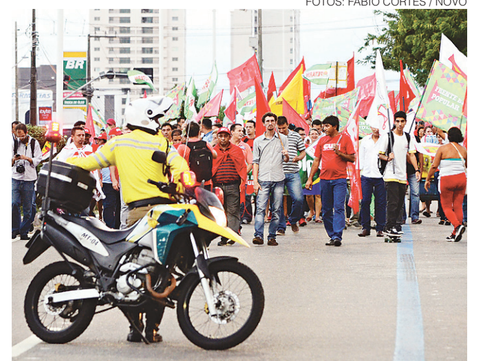
// Sindicatos, estudantes e movimentos de esquerda fizeram o ato