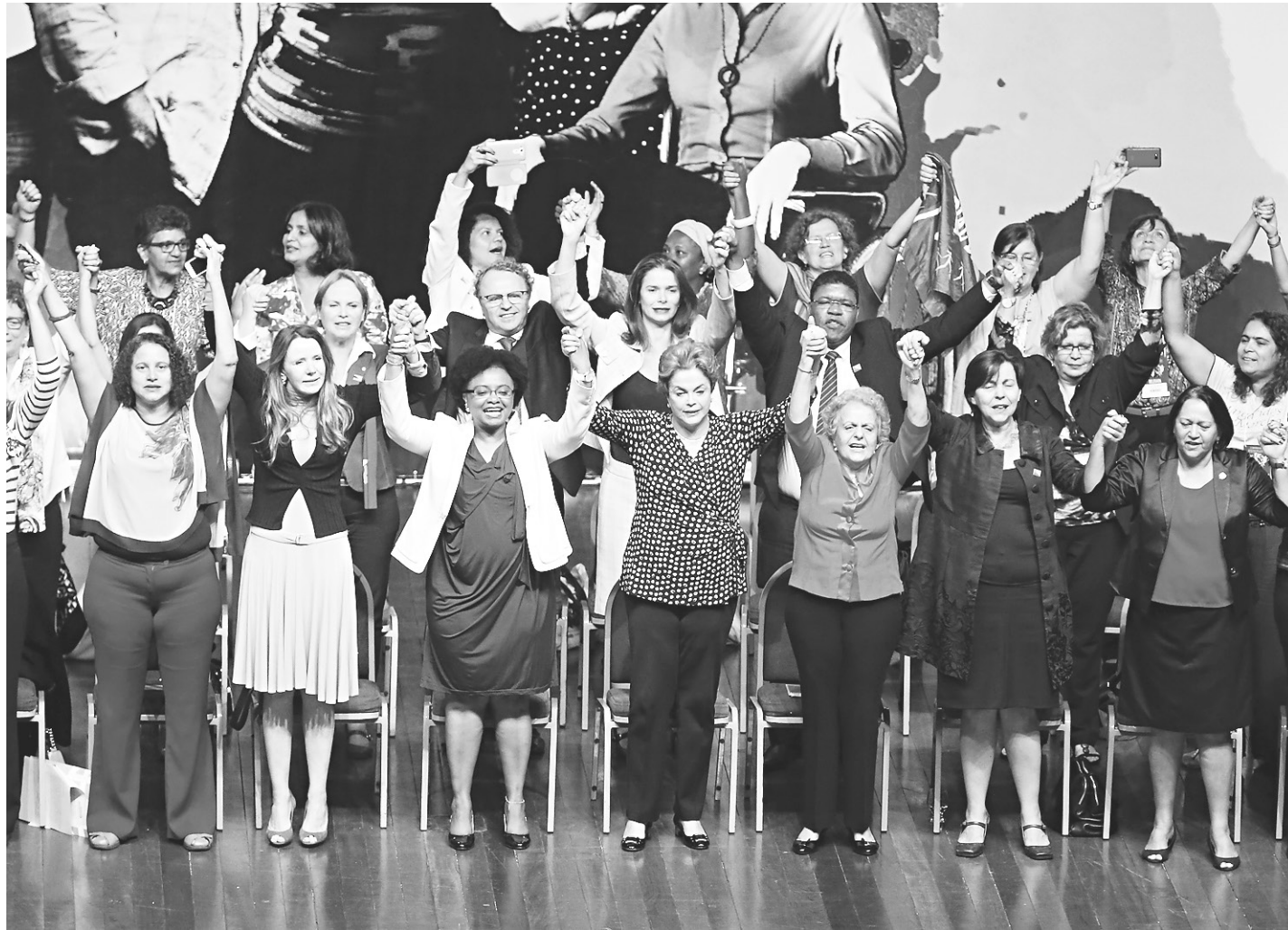
// Já dando o afastamento como certo, presidente pretende percorrer o País em uma espécie de "campanha" para tentar recuperar o cargo