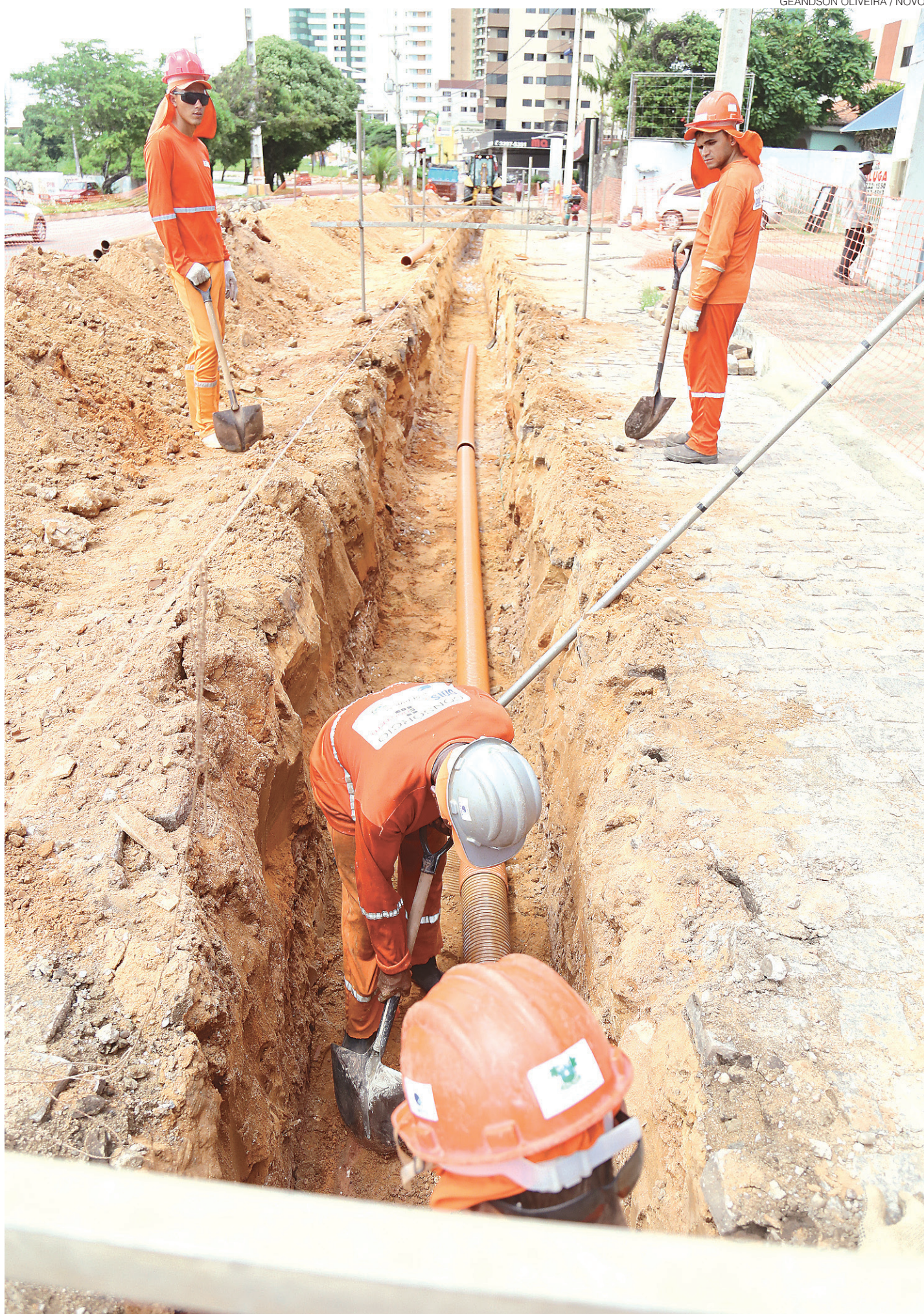
// Mais de 300 quilômetros de tubulações da rede coletora já foram implantados, atingindo o percentual de 35%

O investimento final das obras tocadas pelo Governo do Estado é de R$ 504 milhões. A intenção é deixar, até 2018, Natal 100% saneada. Atualmente, estima-se que apenas 40% da cidade conte com esse tipo de serviço, sendo a Zona Leste, e pequenas parcelas das demais regiões administrativas contempladas.