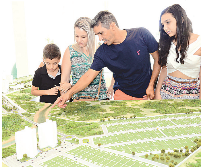
//Majestic Village, comandado pela incorporadora Ritz-G5: à venda