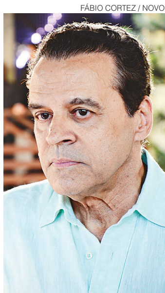
FÁBIO CORTEZ / NOVO