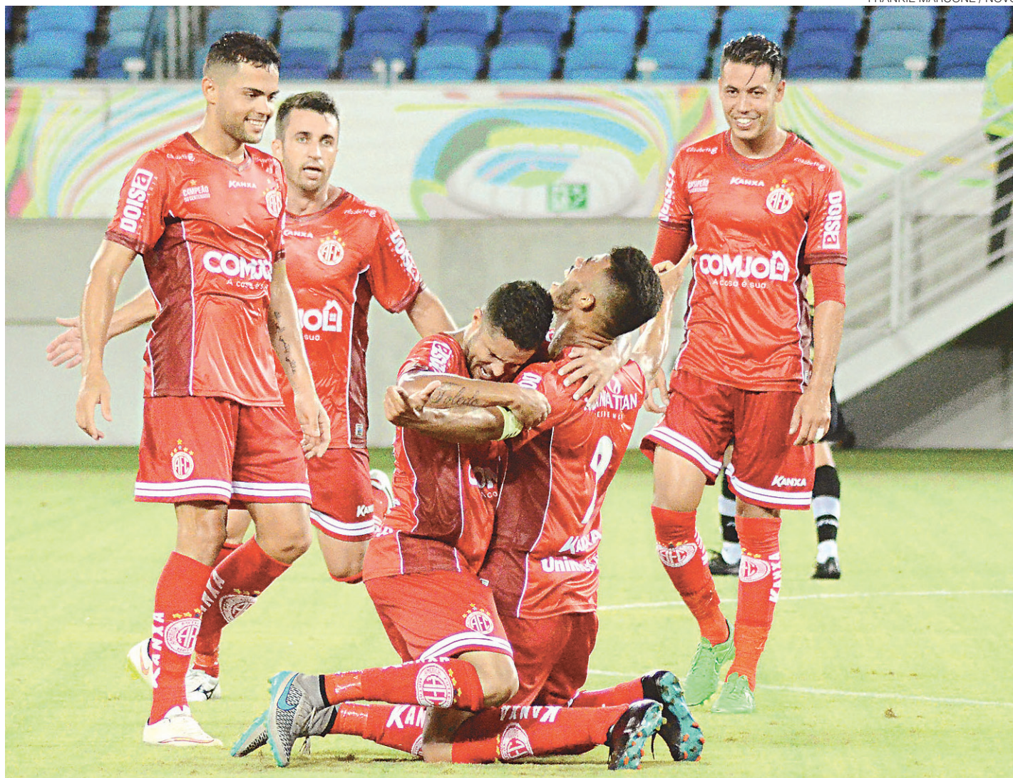
// Time rubro só depende de si para se manter entre os quatro primeiros colocados em seu grupo na disputa da Série C

O ASA tem baseado seu jogo no setor defensivo e tem se saído bem. Assim, o treinador já espera que o time alagoano venha para Natal de ma-