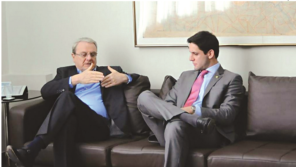
// Deputado Raafel Motta discutindo modelo de gestão com o prefeito de Belo Horizonte, Márcio Lacerda, que também é do PSB