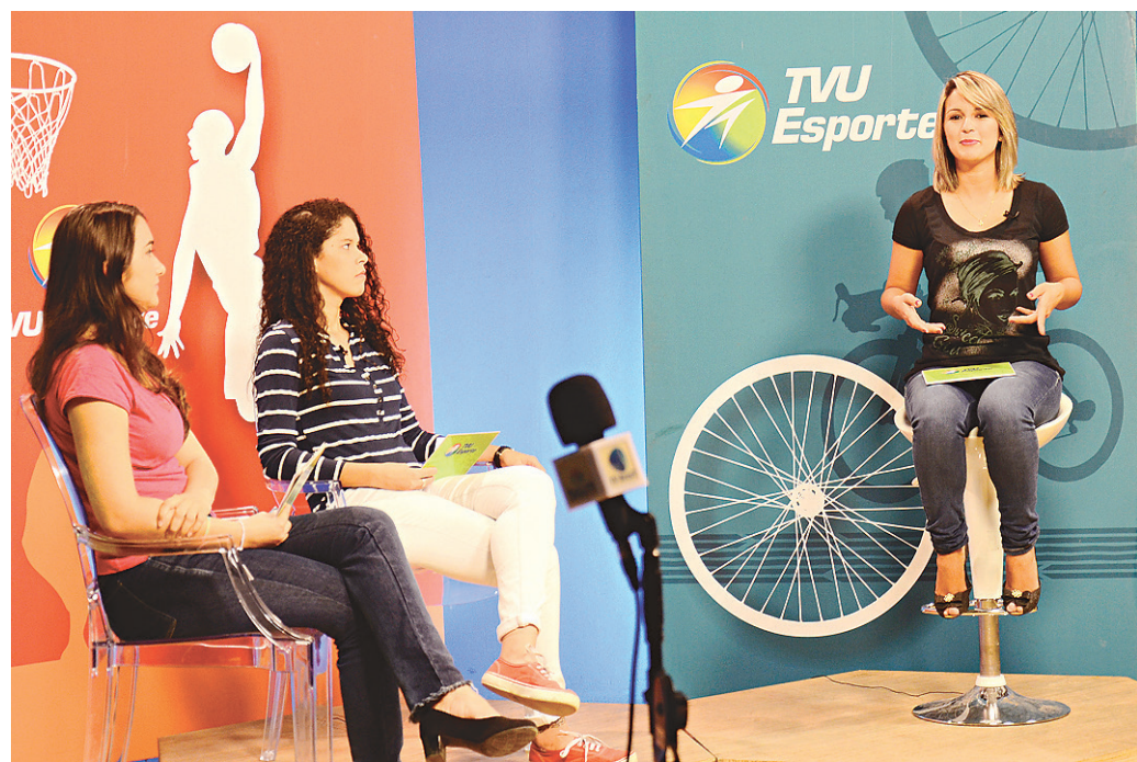
// Programa vai ao ar às segundas-feiras, à noite, na TV Universitária