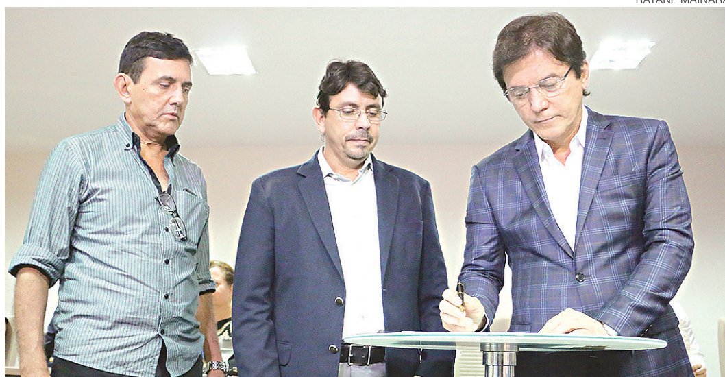
// Governador Robinson Faria, à direita na foto, assina ordem de serviço para obras de abastecimento

O Água Para Todos foi criado em 2011, dentro do Brasil Sem Miséria. Entre os problemas constatados na gestão estadual, por exemplo, o secretário explicou que as licitações de empresas para