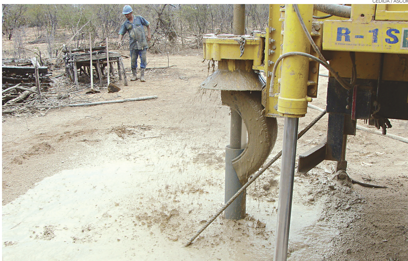
// Serão construídos poços, chafarizes e redes de distribuição, além de 57 barreiros para armazenamento de água para 17 mil potiguares

O recurso é do Programa Água Para Todos, oriundo de convênio assinado entre o governo do Rio Grande do Nor-