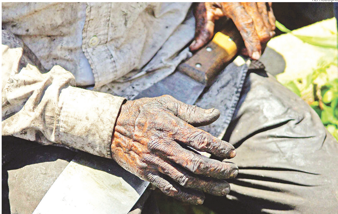
// Nos últimos quatro anos, o Ministério Público do Trabalho do RN recebeu 32 denúncias de casos que se enquadram como trabalho escravo

Dos trabalhadores resgatados em todo o país, 3,5% (35 pessoas) saíram do Rio Grande do Norte, no ano passado. As informações são do MTE, que indica ainda que esse índice é bem maior do que o