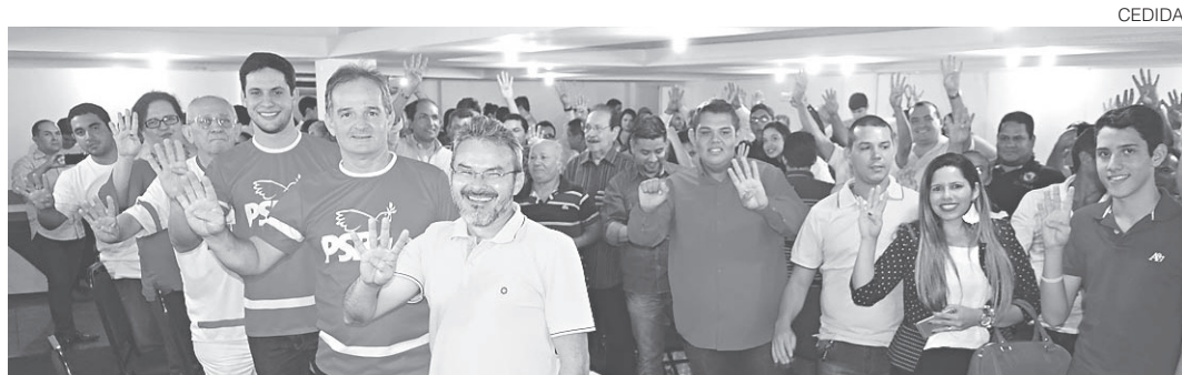
// Pré-candidato a prefeito de Natal, o deputado federal Rafael Motta reuniu a militância do partido que comanda, o PSB, para discutir plano de campanha

Tudo confirmado para o RV Encontro, que acontece no próximo dia 28 de julho, das 14h às 22h, no Versailles Recepções Cidade Jardim. O evento reúne mais de 40 fornecedores para mostras de produtos relacionados aos futuros matrimônios, onde os noivos poderão verificar todos os detalhes para a melhor festa e com diferencial de preços e novidades. O RV Encontro é promovido pela revista, no segmento Casamentos & Festas do RN e, este ano, completa uma década no mercado, com publicação semestral e tiragem de sete mil exemplares. Tudo sob o comando de Larissa Borges.