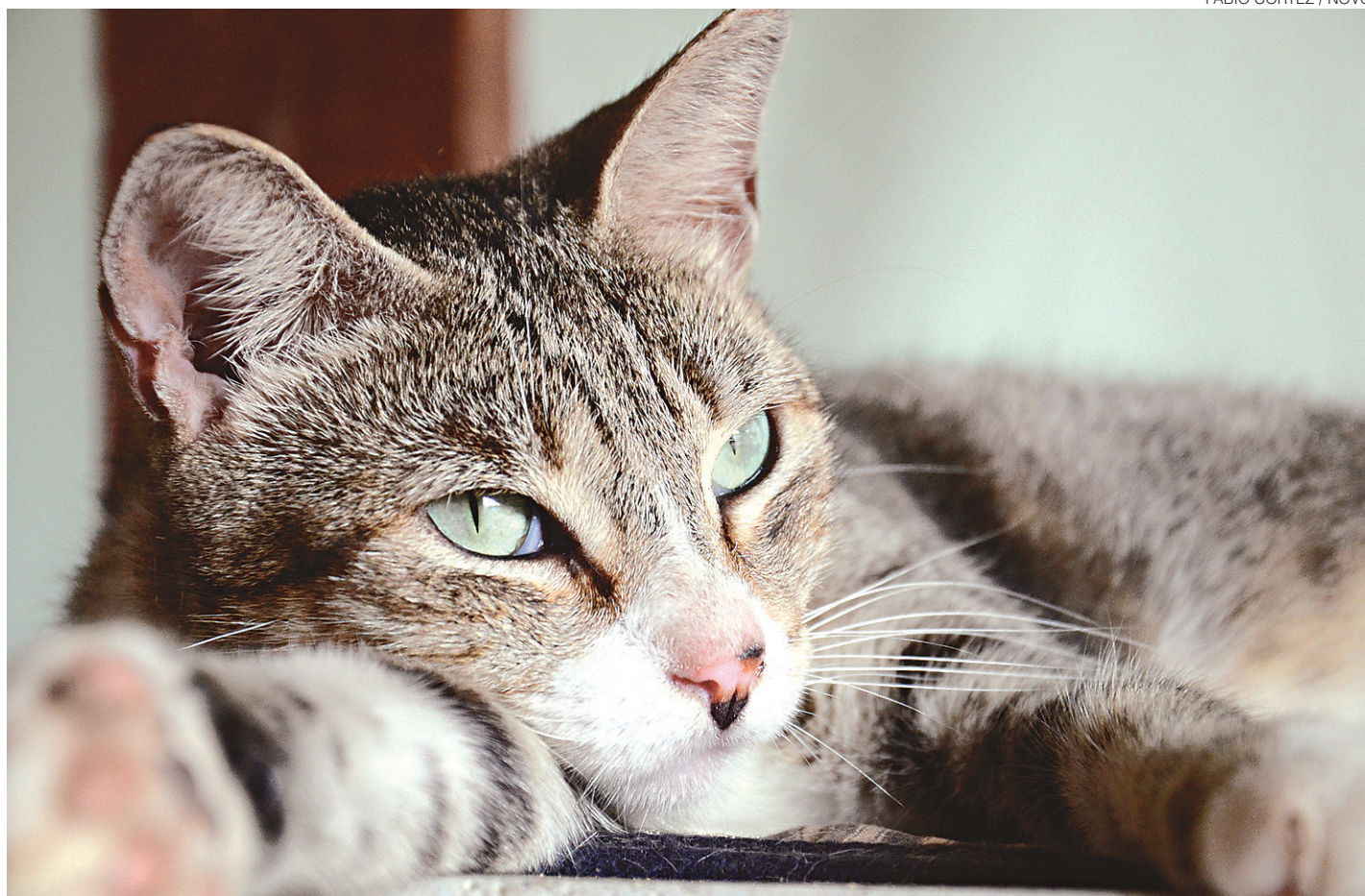
FÁBIO CORTEZ / NOVO

Na avaliação de Rodrigo, a parceria seria importante uma vez que ela ofereceria espaço para que os alunos do curso