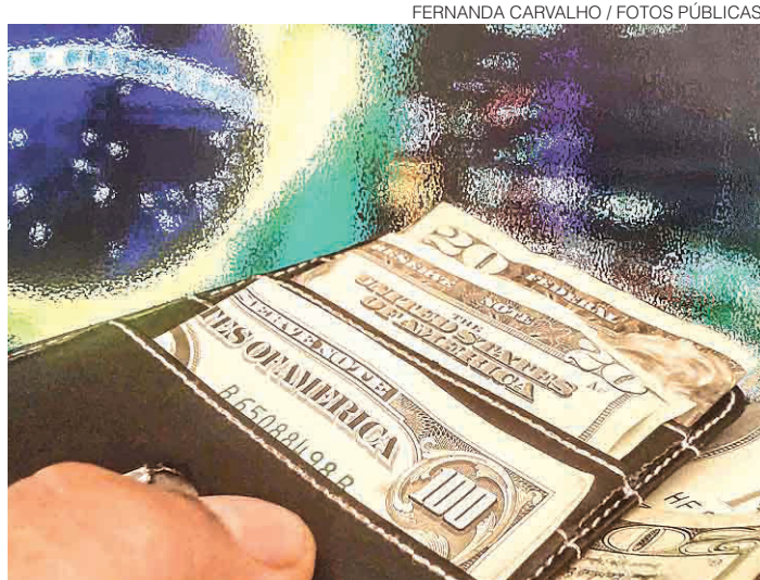
// Banco Central estima superávit de US$ 50 bilhões para este ano

Para 2017, a mediana recuou de R$ 3,55 para R$ 3,50 de uma divulgação para a outra - quatro semanas atrás estava em R$ 3,80. Já o câmbio médio do ano que vem caiu de