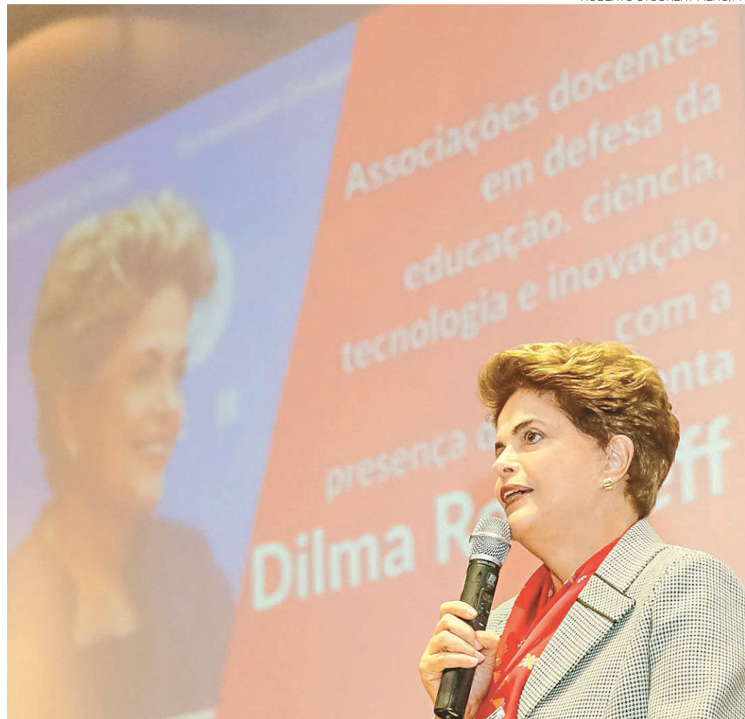
// Dilma Rousseff, presidente afastada, em discurso na Universidade Federal de São Bernardo do Campo

Para Dilma, no Brasil o "golpe" visa a assegurar "uma