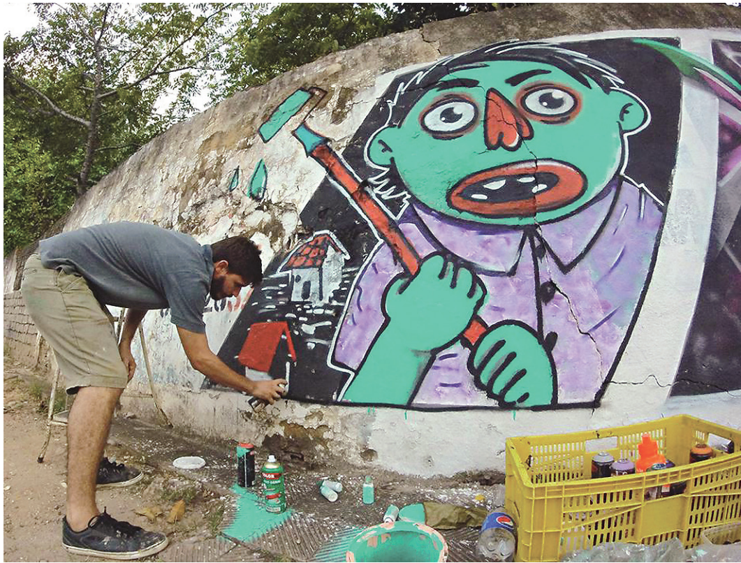
// Arbus passou a ocupar espaços públicos ao observar paredes abandonadas da zona Sul de Natal