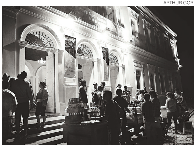
// Pinacoteca do Estado será palco da exposição “INarteurbana”

Os grafiteiros “Kefren Pok” e “Arbus”, selecionados para exposições individuais, buscam financiamento para bancar os custos da viagem para a Europa