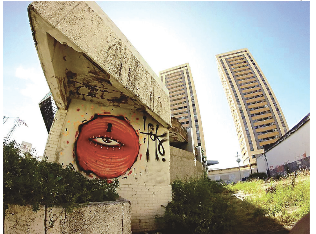
// Kefren Pk há seis anos cria intervenções artísticas para paredes, postes e caixas de energia