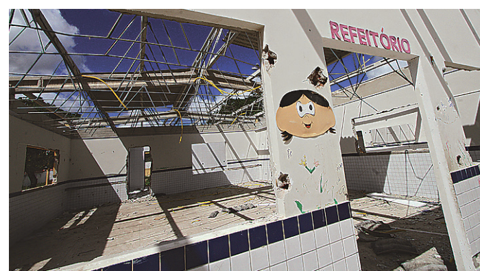
// Reportagem ainda flagrou moradores retirando materiais do local