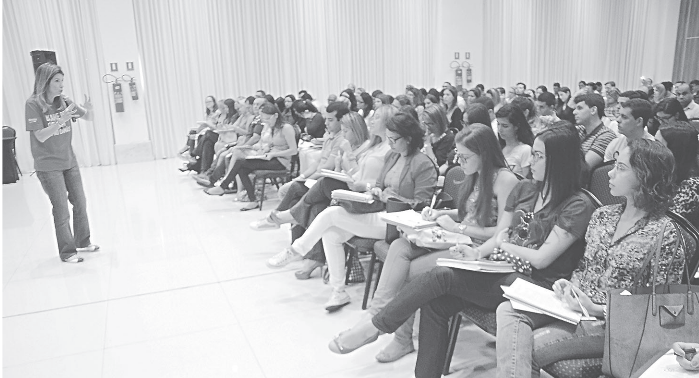
// Alunos assistem aula preparatória para o exame unificado da Ordem que será realizado no próximo domingo (24) no Rio Grande do Norte