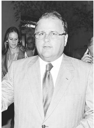
// Geddel Vieira, ministro da Secretaria de Governo