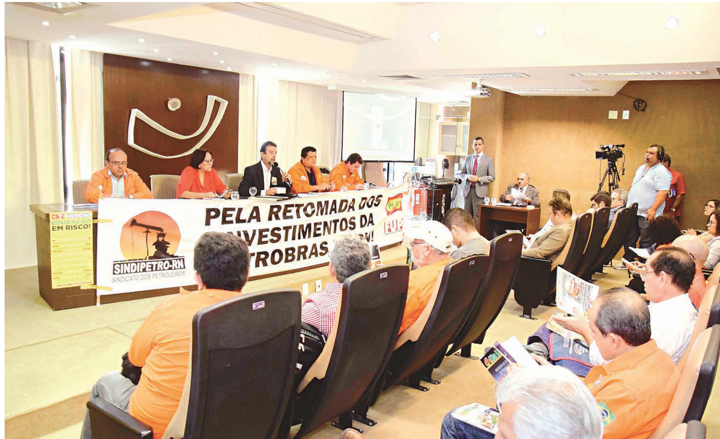
// Audiência pública, ontem, na Assembleia Legislativa do Rio Grande do Norte, discutiu o desmonte da estrutura da Petrobras no estado

O RN concentra o maior número de concessões colocadas à venda pelo projeto Topázio, como ficou denominado o plano de vendas anunciado em março. Um total de 38, distribuídas entre as áreas Riacho da Forquilha (34) e Macau (4). Ao todo, a empresa colocou à venda 104 concessões de poços maduros onshore