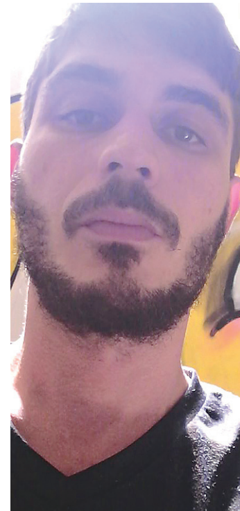
// Augusto Furtado, “Arbus”, cria seres coloridos e expressivos