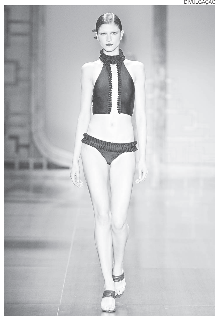
// Desfile Adriana Degreas Verão 2017