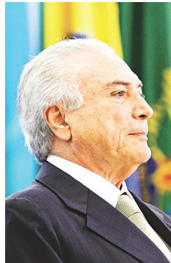
// Temer, de vice decorativo a presidente discreto

Se Renan decidir seguir o modelo adotado pelo então presidente do Senado em 1992, senador Mauro Benevides, Temer deve ser recepcionado pelo peemedebista em seu gabinete e aguardar líderes para alguns cumprimentos. Itamar foi acompanhado dos líderes que o "buscaram" na sala de Benevides até o Plenário da Câmara, onde são realizadas as Sessões Solenes. Na cerimônia, o presiden-