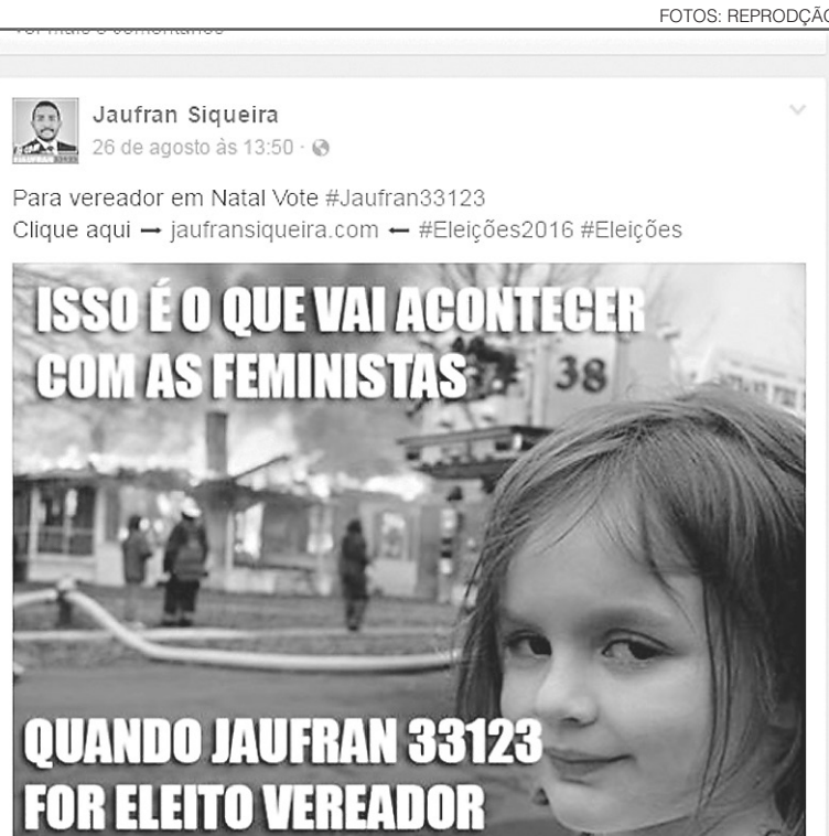
// Acima, a postagem que para muitos não teve graça alguma; abaixo, a nota comunicando a expulsão

lher, mas sim transformá-la em um mero objeto de ação social cujo a finalidade não é a ascensão da mulher na sociedade, mas só e somente só a destruição de uma cultura que foi construída ao longo dos últimos 2000 anos no mundo ocidental", argumenta. O candidato justifica o posicionamento alegando - por meio de citações do livro "A Dialética do Sexo", de Shulamith Firestone, que sua posição contrária às feministas decorre do fato de que o movimento é "a favor da pedofilia e a favor da destruição da família". "Minha oposição ao