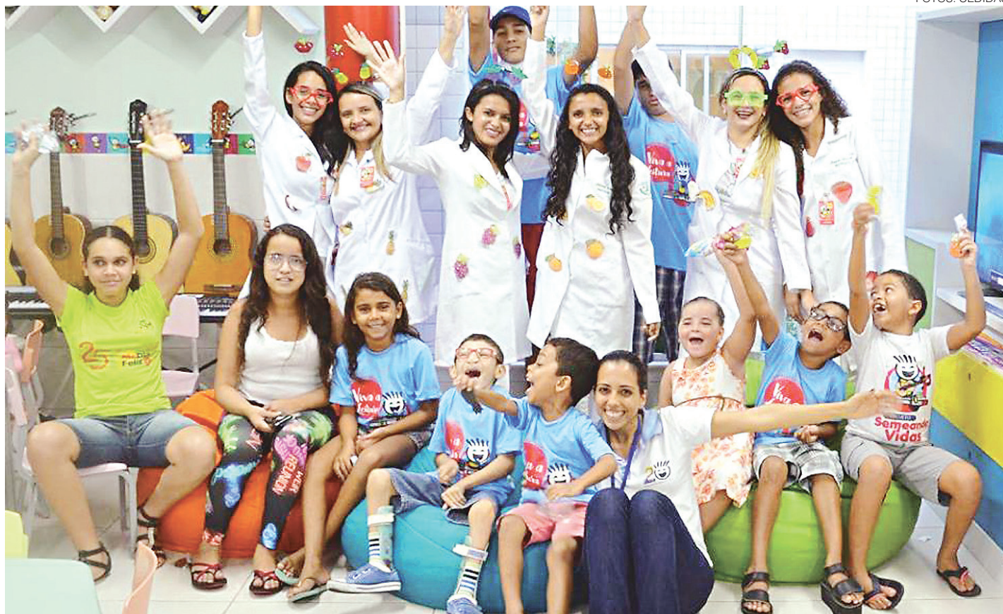
// Casal Durval Paiva participa da campanha Setembro Dourado: mudar a cultura do país para com a identificação e tratamento da doença

Isso sem falar, afirma o presidente da Coniacc, da escassez de médicos pediatras e pediatras especialistas em onco-