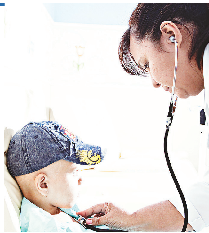
// Câncer: primeira causa de morte entre crianças e adolescentes

25/09 Passeio ciclístico com saída da Casa Durval Paiva, GACC, Policlínica/LIGA e Hospital Infantil Varela Santiago e concentração no Parque da Cidade Dom Nivaldo Monte.