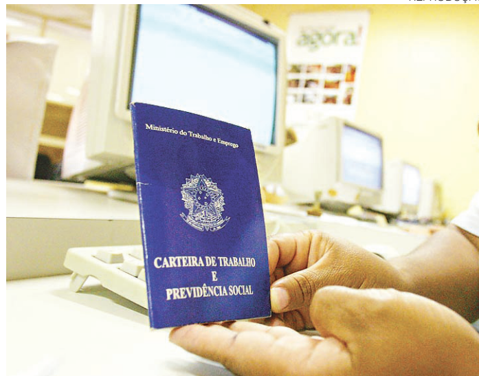
// País tem queda de 3,9% no número de carteiras assinadas em julho

Os dados indicam que a população empregada no trimestre encerrado em julho