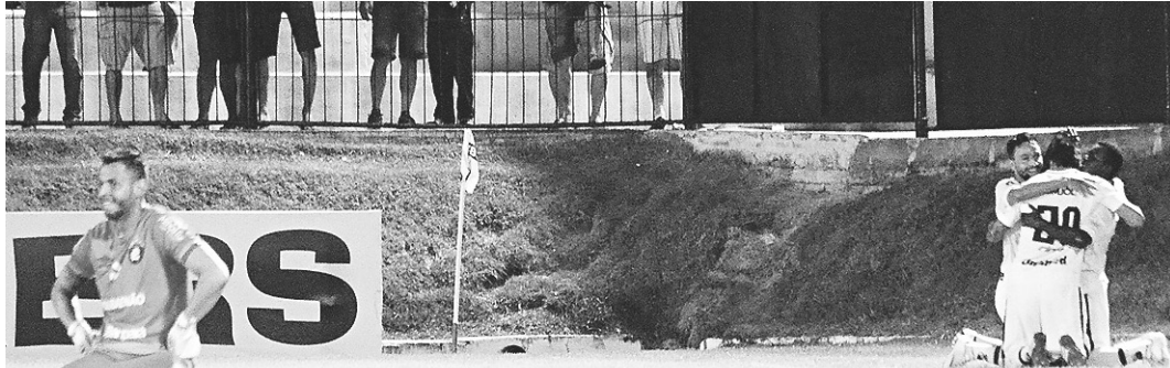
// Alvinegro venceu o Remo no início da semana, no Frasqueirão, e assumiu a ponta da tabela

Para o América, será a possibilidade de dar alegrias também atuando em Natal, onde tem deixado a desejar nesta temporada. E os jogos também acontecerão contra dois adversários que brigam diretamente com os rubros na luta contra o rebaixamento: Cuibá-MT e Confiança-SE.