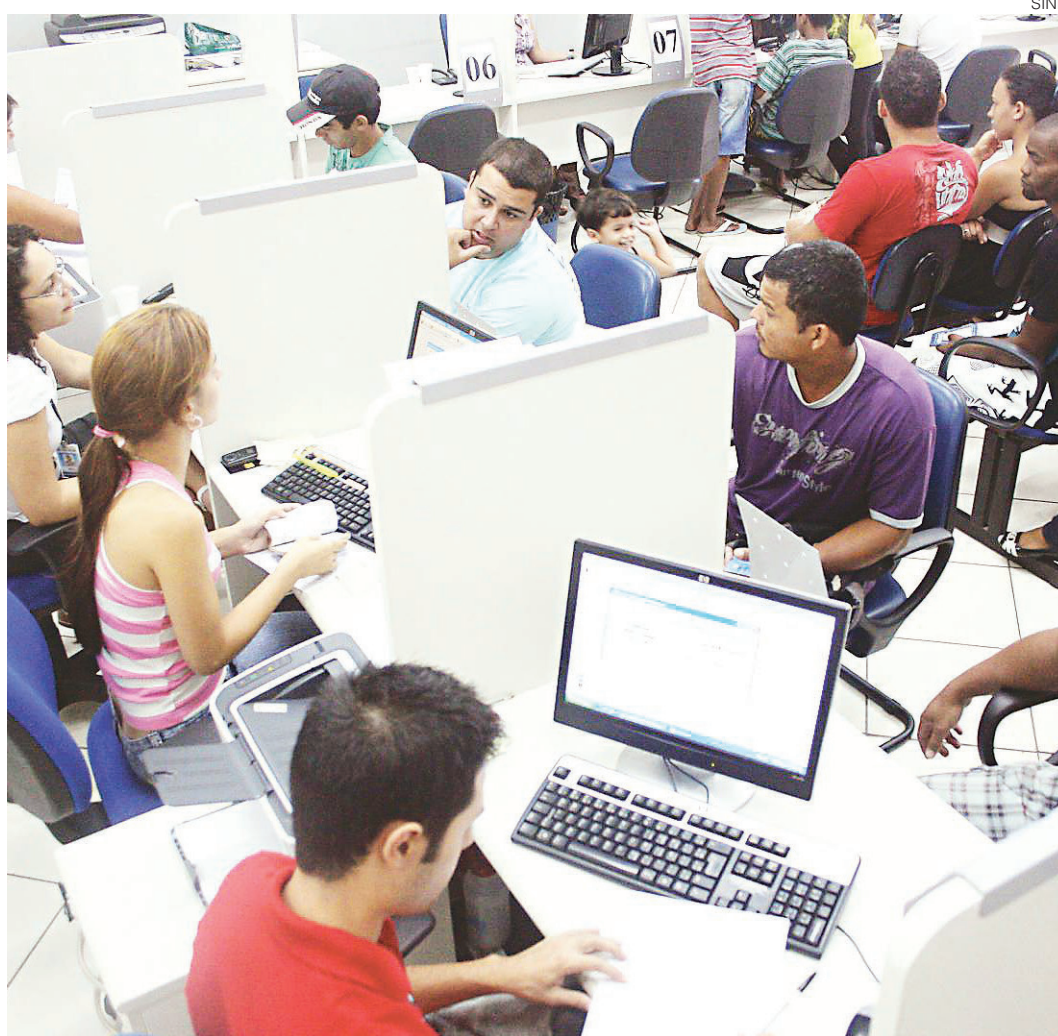
// Número de jovens sem emprego coincide com queda acentuada nas matrículas do ensino médio

No ano passado, o número de jovens matriculados no Ensino Médio teve uma queda de 2,7% em relação a 2014, quase três vezes mais do que a taxa registrada em anos anteriores. Desde 2007 essa variação não chegava a 1%. O resultado da evasão registrada na passagem de 2014 para 2015 equivale a 224 mil ado-