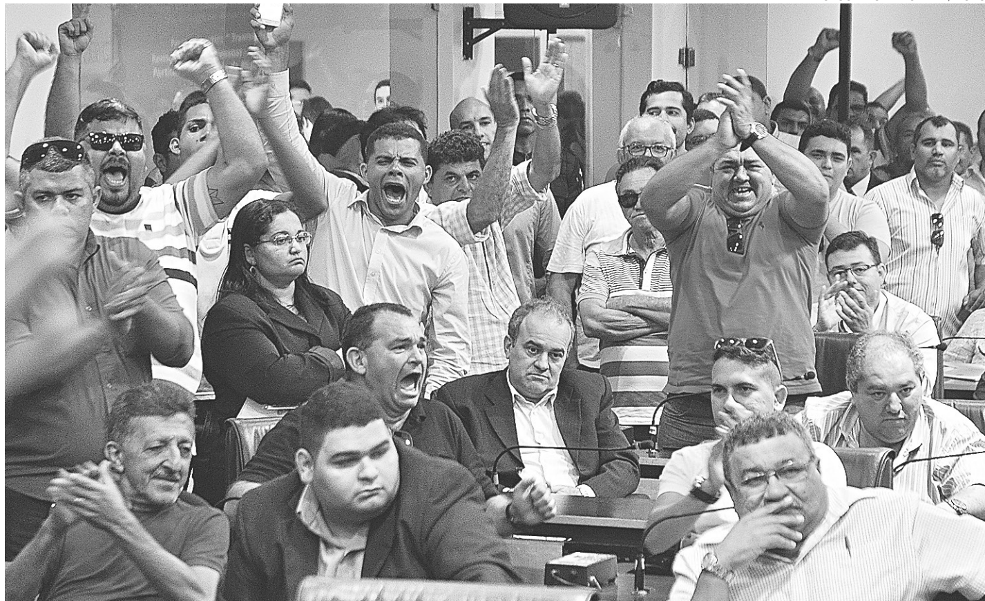
// Taxistas lotam dependências da Câmara de Natal durante audiência pública que debateu o serviço da Uber na cidade

Cartaxo também chamou a atenção para o fato de o serviço prestado pelo Uber ser algo ainda novo no país, mas que a promotoria se baseia no que já