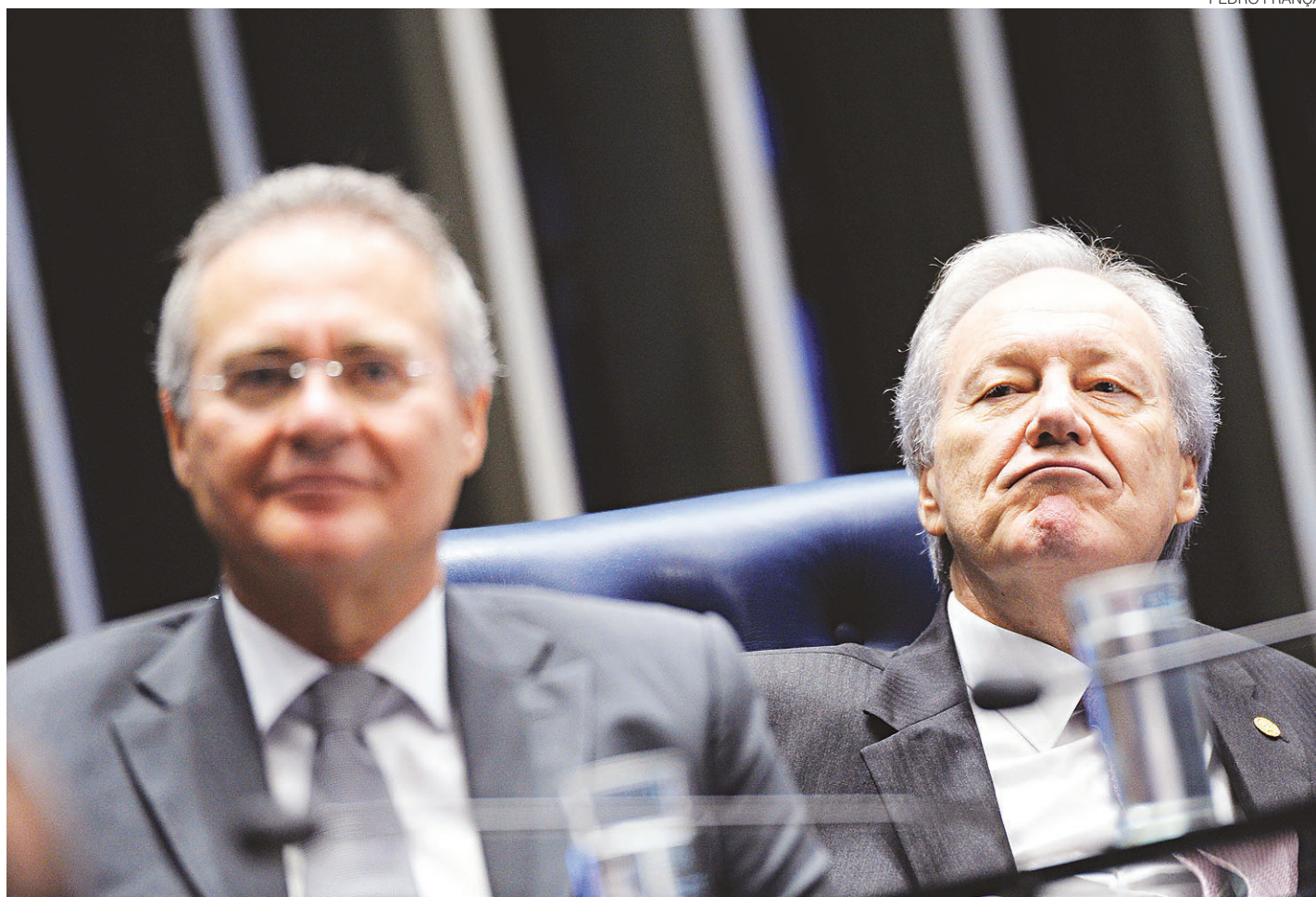
// Ministro Ricardo Lewandowski comanda último dia do julgamento e caberá a ele confirmar a sentença

Logo depois de anunciar que o desfecho do processo será na quarta-feira, com a manifestação do voto de cada senador, o ministro concedeu a palavra para a advogada da acusação, Janaina Paschoal. Com ela teve início o período de debates orais entre a defesa