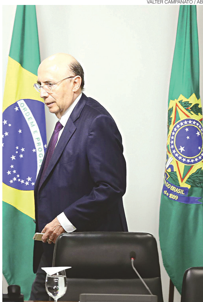
VALTER CAMPANATO / ABR

O ministro da Fazenda falou, também, que espera fechar o texto da Proposta de Emenda à Constituição (PEC) 241 – que limita os gastos públicos – na próxima terça-feira e a ideia é a de que o texto seja o melhor possível e seja aprovado ainda neste ano. "Não existe fórmula perfeita e nada que não caiba em uma discussão e aperfeiçoamento tendo em vista diversos aspectos. O mais