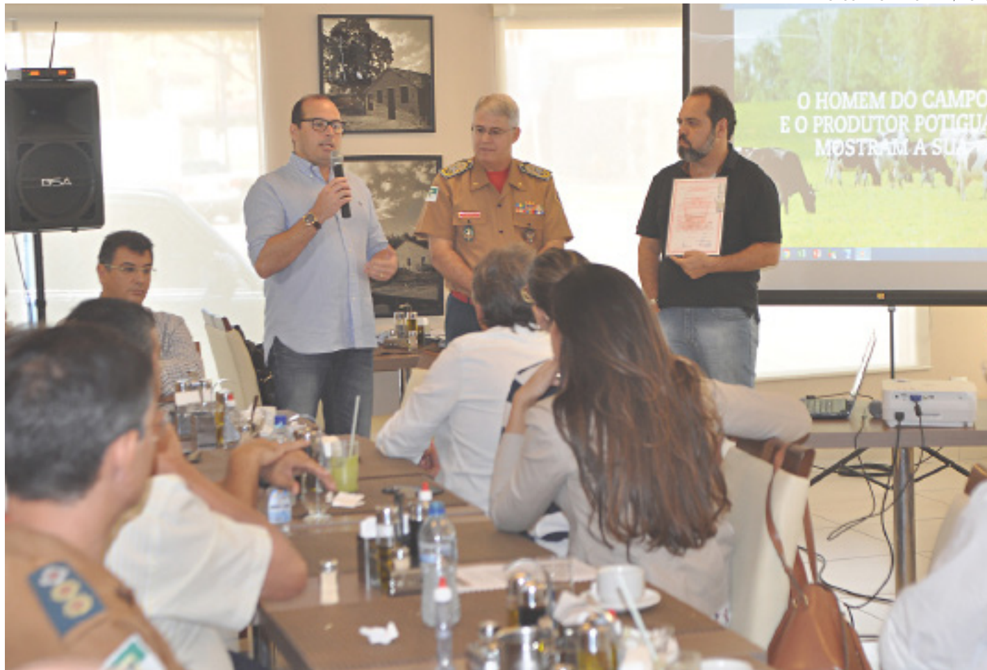
// Organizadores anunciaram ontem, em entrevista coletiva, que esperam um público de 500 mil pessoas para a Festa do Boi 2016