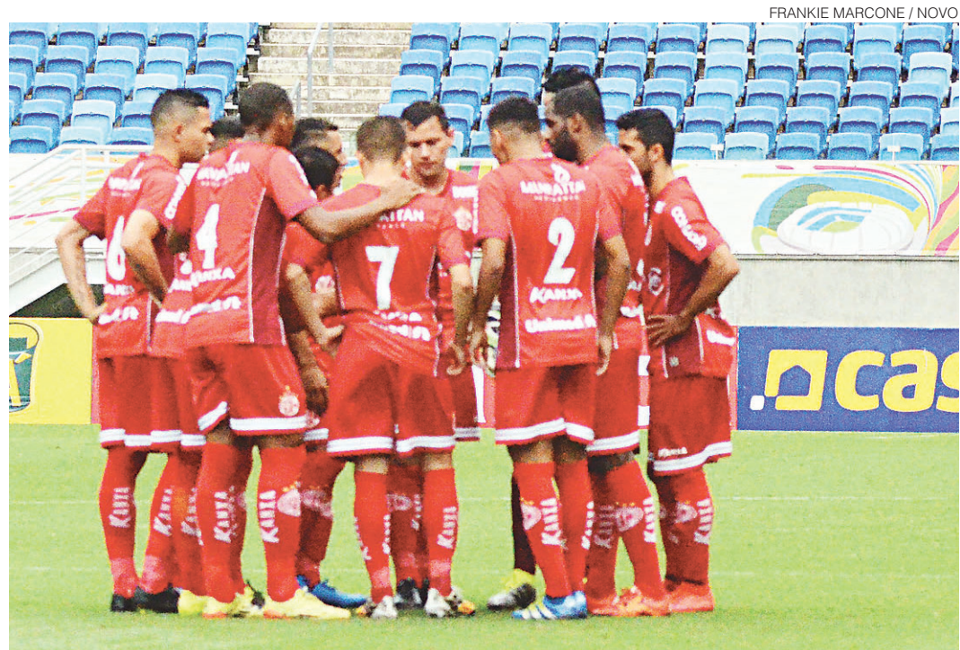
// Possibilidade de punição ao Botafogo-PB mantém esperança do América viva

Pra você, do seu jeito novojornal.jor.br