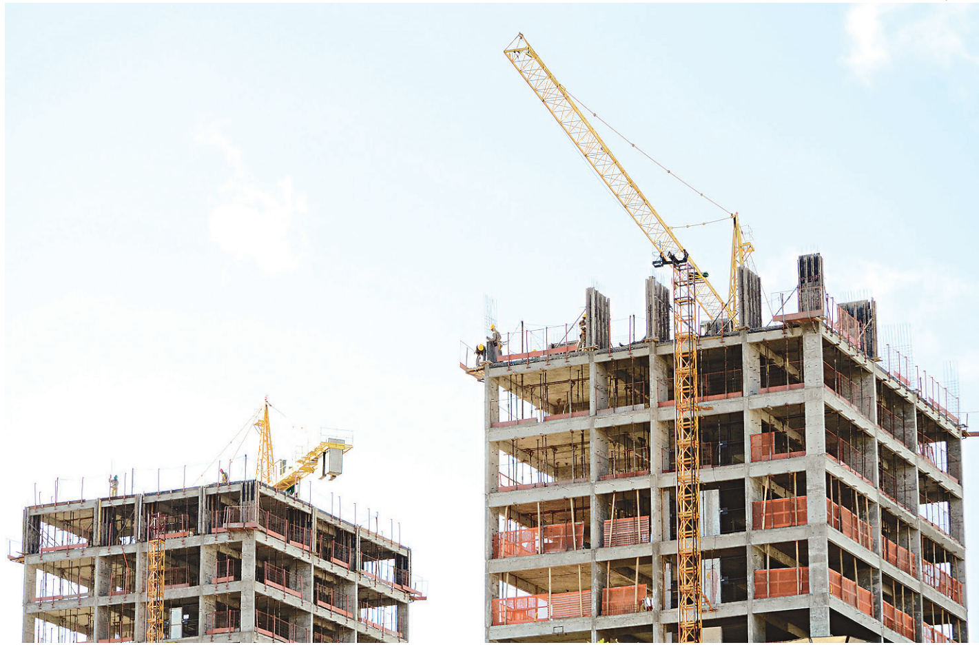
// CMN autorizou os bancos a destinar 6,5% dos recursos da poupança para financiar imóveis novos de alto padrão

O SFH financia imóveis de até R$ 750 mil em Minas Gerais, no Rio de Janeiro, em São Paulo e no Distrito Federal e R$ 650 mil nos demais estados com recursos do Fundo de Garantia do Tempo de Serviço (FGTS). Com a mudança, a parcela da poupança destinada ao SFH cairá de 52% para 45,5% (de 80% para 70%), com a criação da faixa de 6,5% a ser aplicada na faixa de crédito