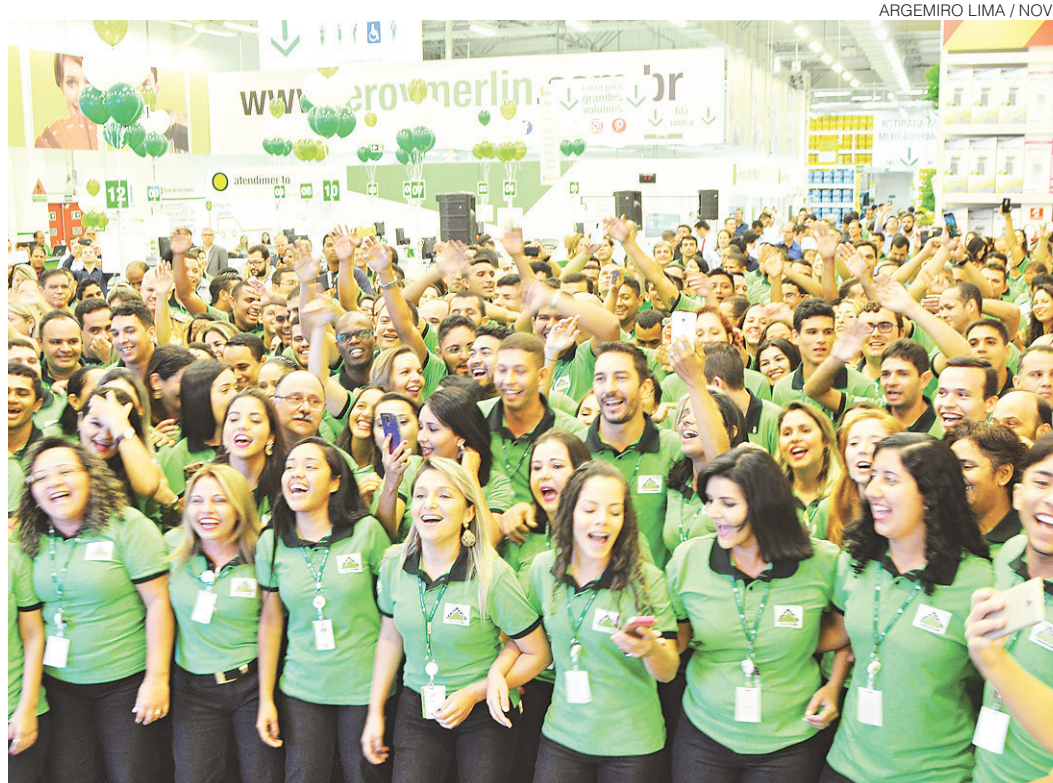
// Na abertura para autoridades, os funcionários foram homenageados pela dedicação