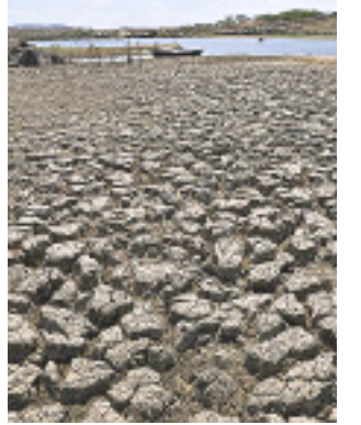
// Lei dá desconto a prejudicados pela seca