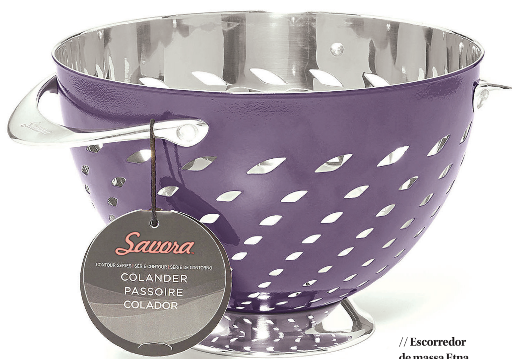
// Escorredor de massa Etna