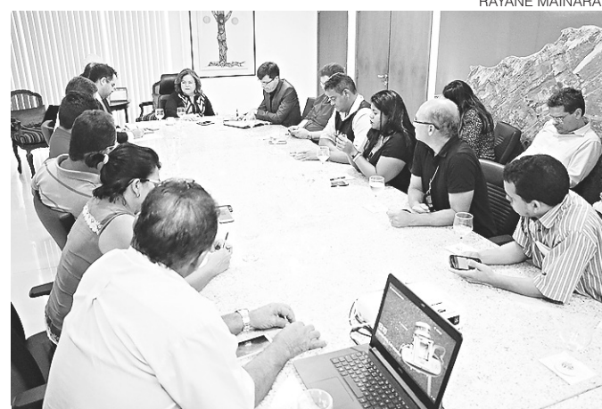
// Estado quer trabalhar em conjunto com sindicatos

De acordo com o governo, o déficit da Previdência em 2015 foi R$ 86 bilhões. Em 2016, foi R$ 146 bilhões, e, em 2017, a estimativa é que fique entre R$ 180 bilhões e R$ 200 bilhões. As novas regras passarão a vigorar apenas após a aprovação no Congresso Nacional e posterior publicação no Diário Oficial da União. As mudanças não valerão para quem já estiver aposentado ou tiver alcançado os requisitos para tal, de acordo com as regras vigentes atualmente, na data da aprovação da nova norma.