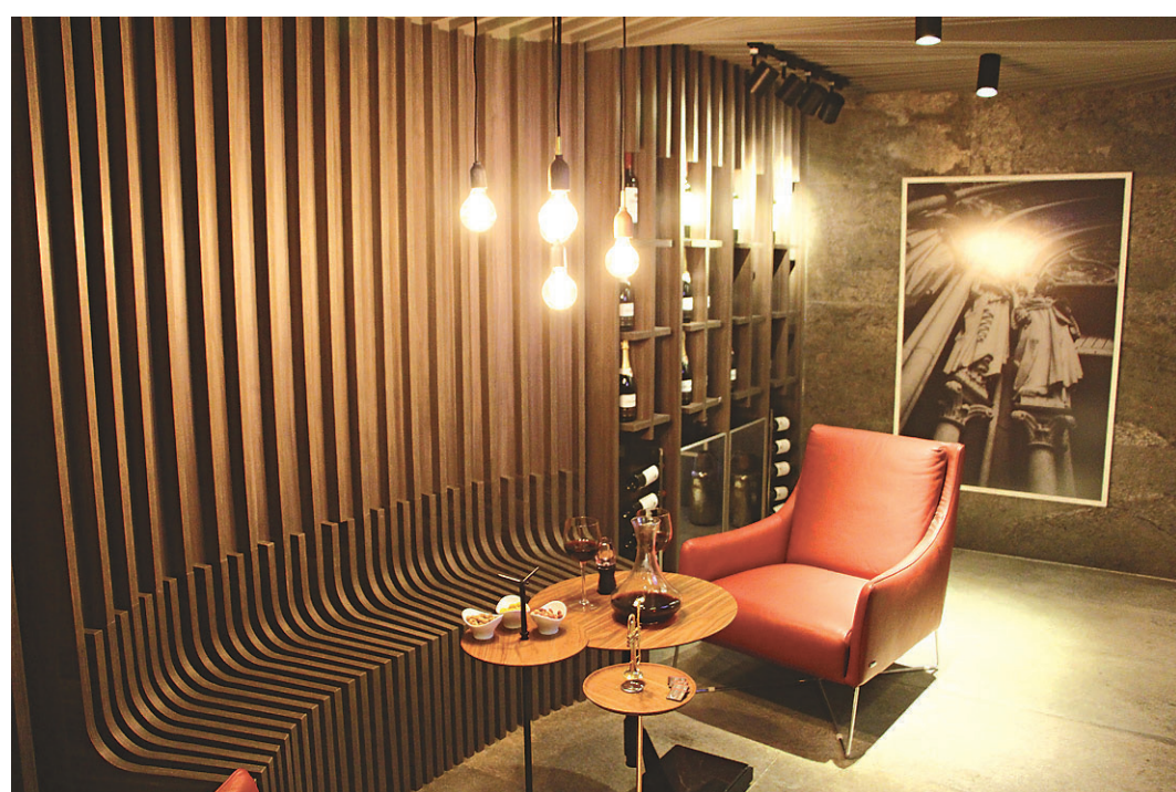
// Iluminação pontual na Adega por Katiane Guimarães

potiguar, Renato Teles teve a tarefa honrosa de assinar o living que leva o nome do criador da casa: Borsoi. A ambientação respeita as linhas modernista da residência e resgata alguns itens da ambientação na primeira e segunda metade do século 20. O ousado da cortina do ambiente faz um volver aos anos dourados. Por falar em dourado, os adornos metalizados aparecem como tendência entre os arquitetos paraibanos.