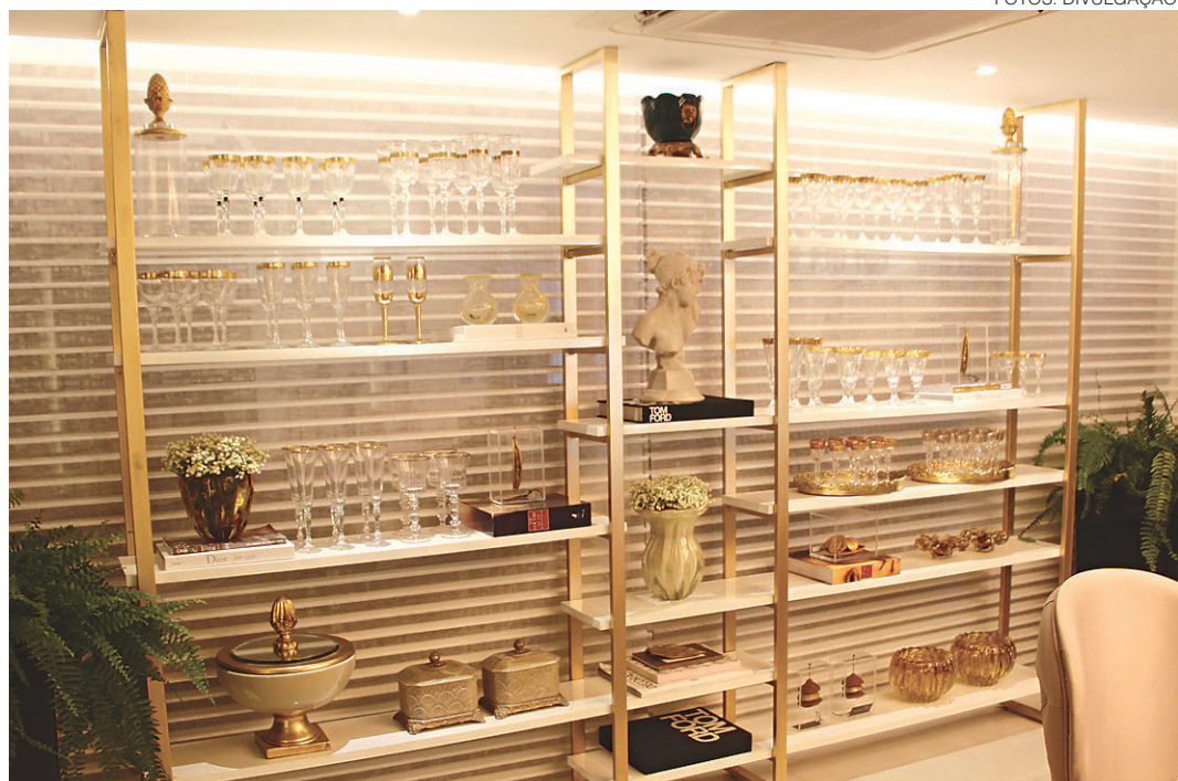
// Dourado nos adornos da sala de jantar por Anelise Lacerda