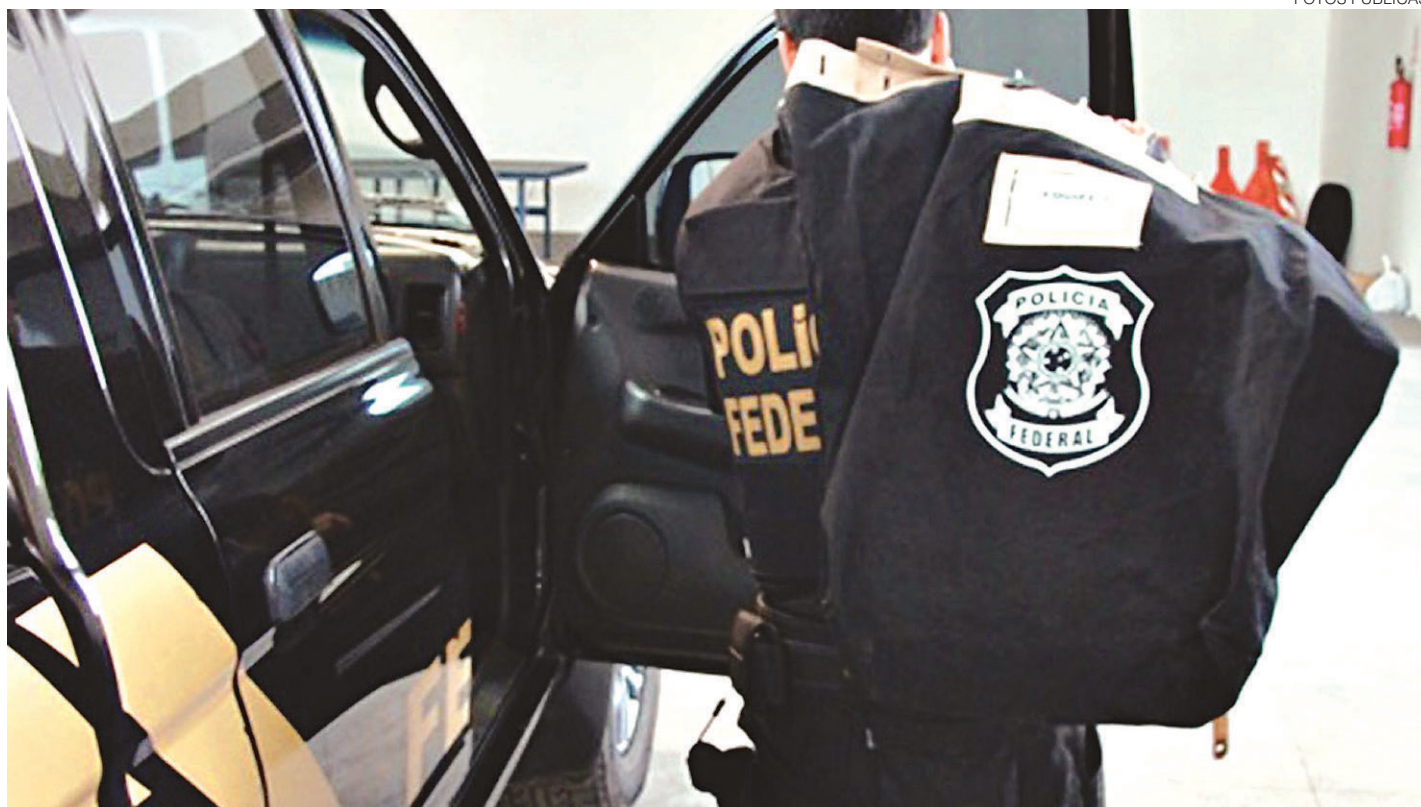
// PF cumpriu vários mandados judiciais: sete de prisão temporária, 106 de busca e apreensão e 34 de condução coercitiva em oito estados e DF

O ex-presidente do Postalís Alexej Predtechensky foi conduzido de forma coercitiva - quando o investigado é levado a depor e liberado. Predtechensky foi denunciado, em julho deste ano, pela Pro-