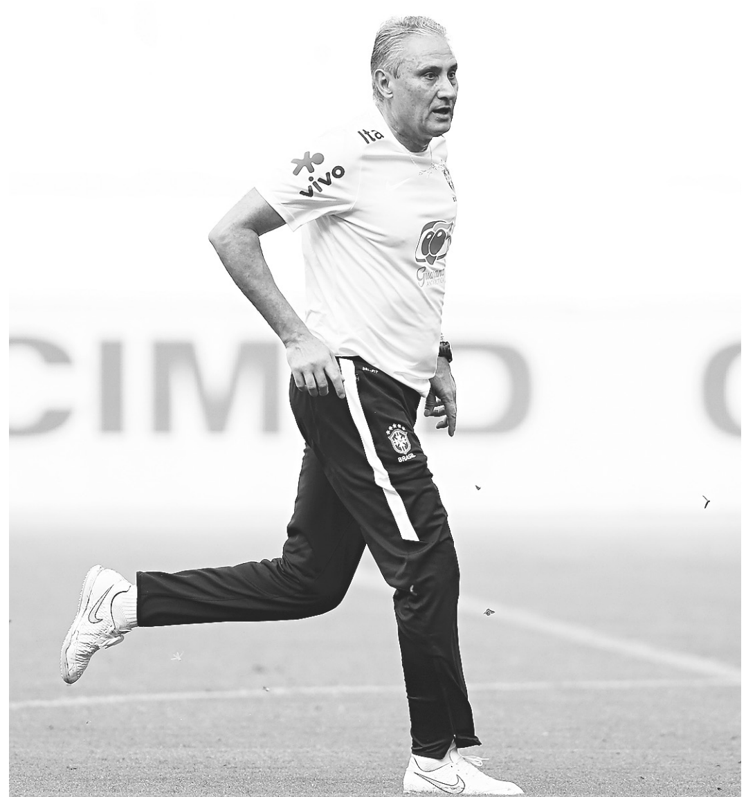
// Jogo será o primeiro de Tite pelo time canarinho em solo brasileiro

A intervenção do Ministério Público do Amazonas (MP-AM) para reduzir o valor dos ingressos deixou a situação ainda pior. Especulou-se