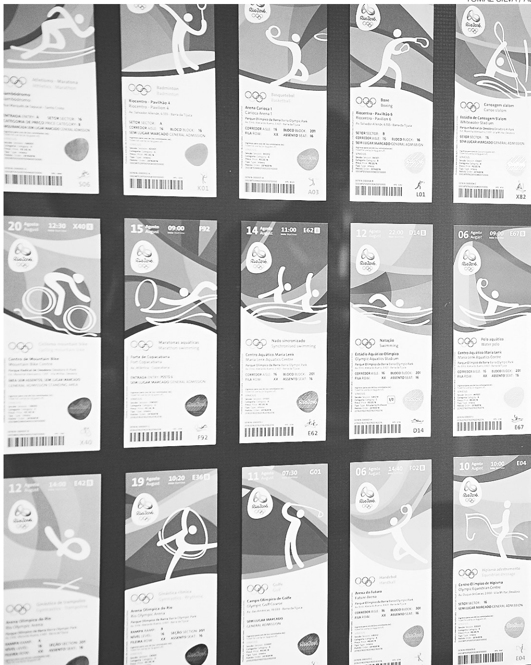
// Expectativa da Rio-2016 é de que todos os ingressos serão vendidos

A meta brasileira é ficar entre os cinco primeiros países no quadro de medalhas. Em 2012, o País ficou em sétimo, com 43 medalhas (21 de ouro, 14 de prata e 8 de bronze). Ainda há ingressos para a primeira chance de ouro para o Brasil nesta Paralimpíada: a final dos 5 mil metros na ca-