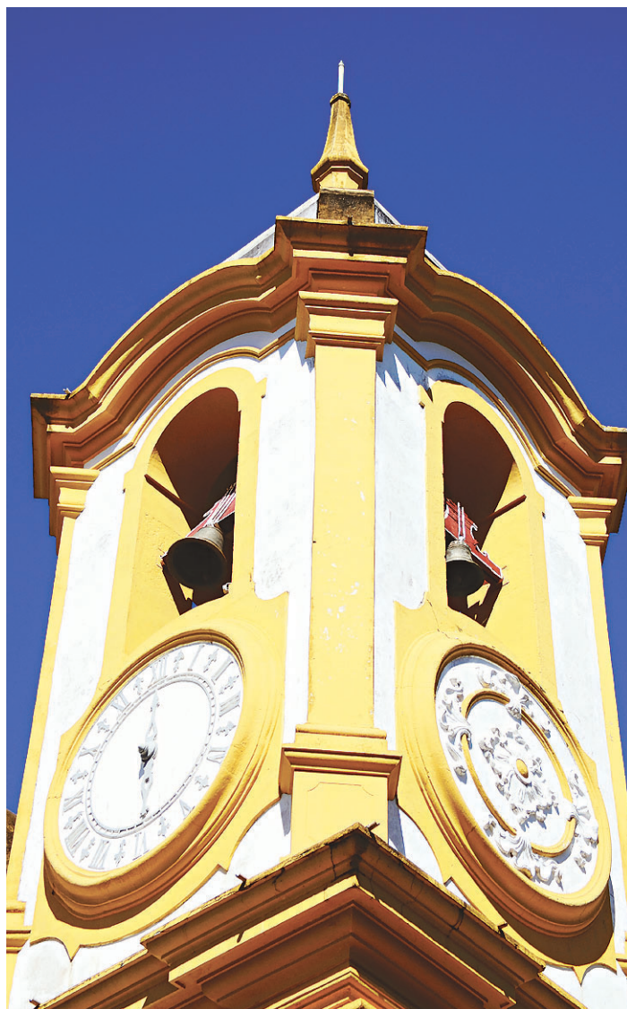
//Entre as 20 imagens selecionadas, algumas foram registradas na própria cidade de Mariana, afetada pelo rompimento da barragem

Guilherme Queiroz Engenheiro e fotógrafo