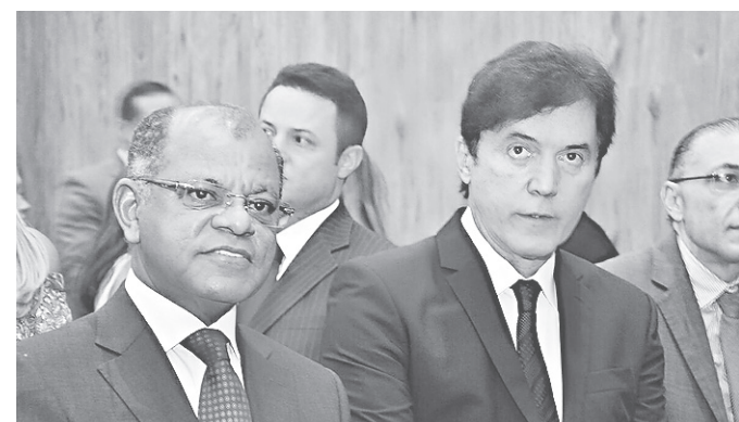
Em dia de posse como presidente do TRE-RN, o desembargador Dilermando Mota com o governador Robinson Faria