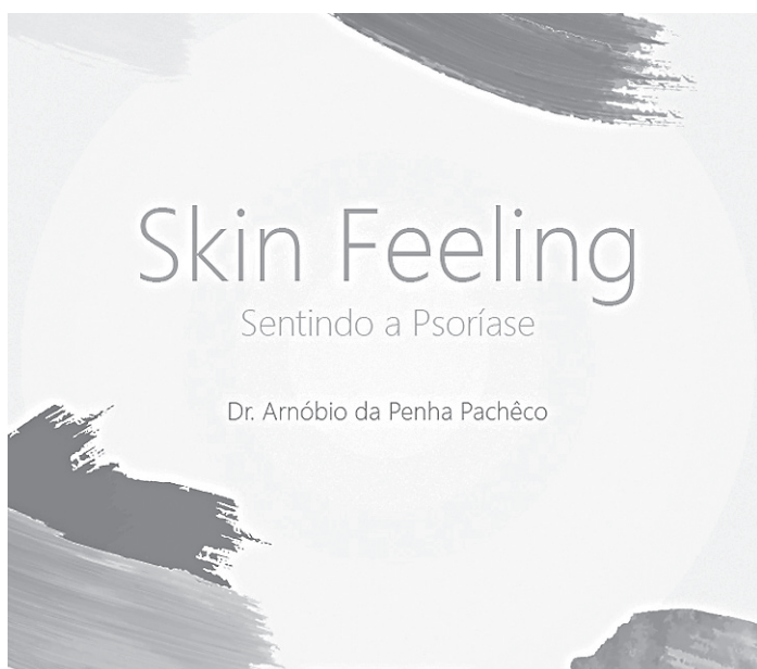
// Livro será lançado Congresso da Sociedade Brasileira de Dermatologia