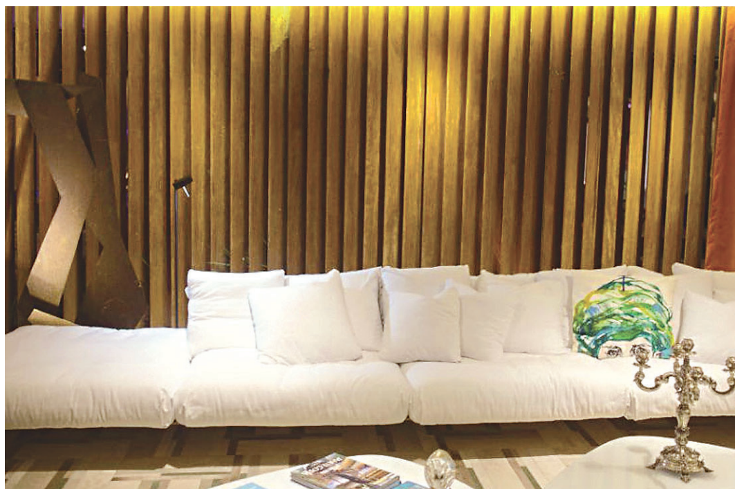
// Living Borsoi por Renato Teles na Casa Cor Paraíba