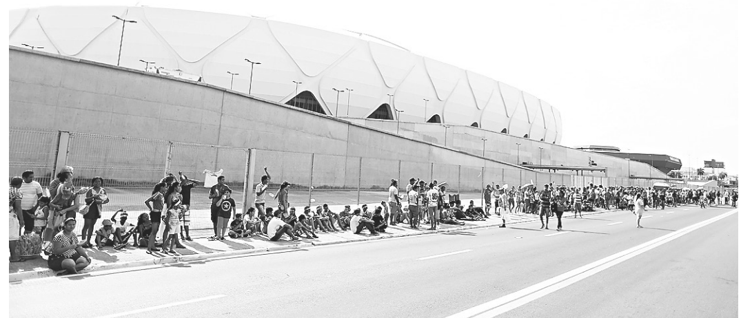
// Até o fim da tarde de ontem, 36 mil ingressos já haviam sido vendidos

O jogo é válido pela oitava rodada da Eliminatórias Sul-Americanas para a Copa do Mundo de 2018 e será realizado hoje, a partir das 21h45, na Arena Amazonas, em Manaus. A seleção brasileira está em quinto lugar com doze pontos já a equipe da Colômbia está empatada com Equador e Uruguai em segundo com treze pontos. A Argentina lidera com 14 pontos.