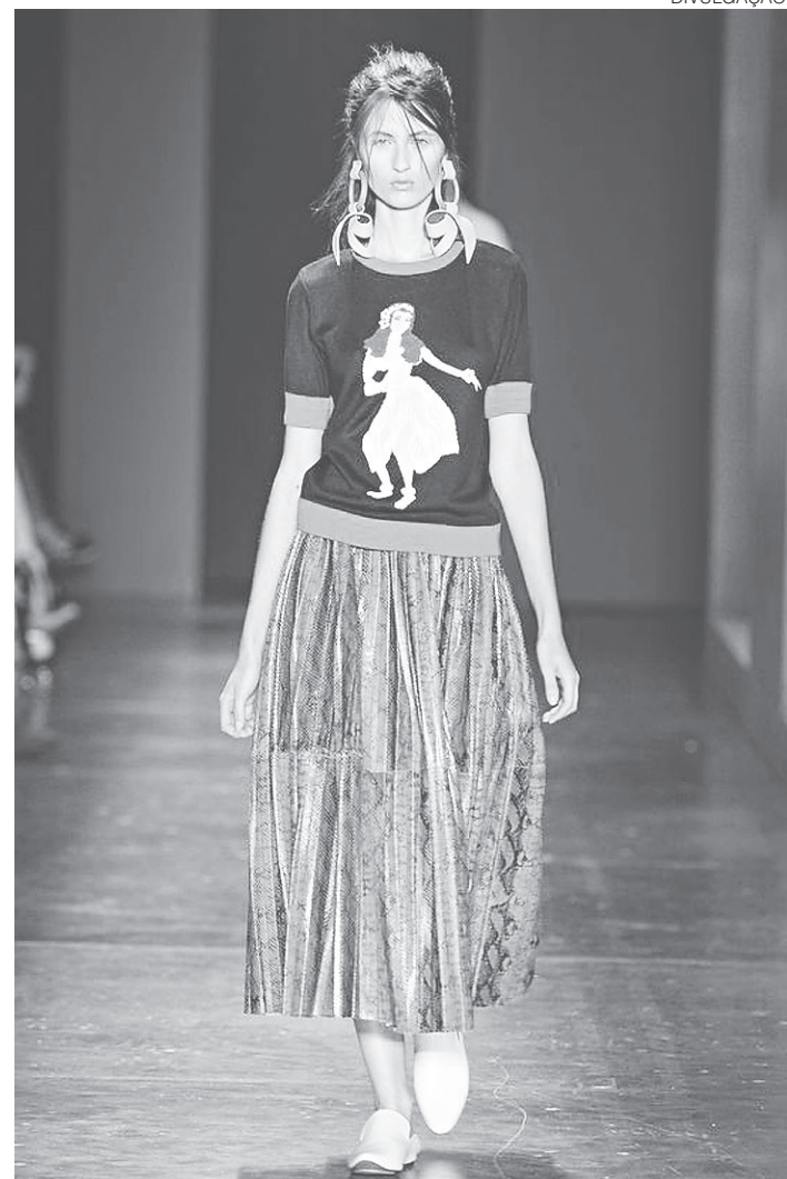
// Desfile A. Brand Coleção Verão 2017, no SPFW