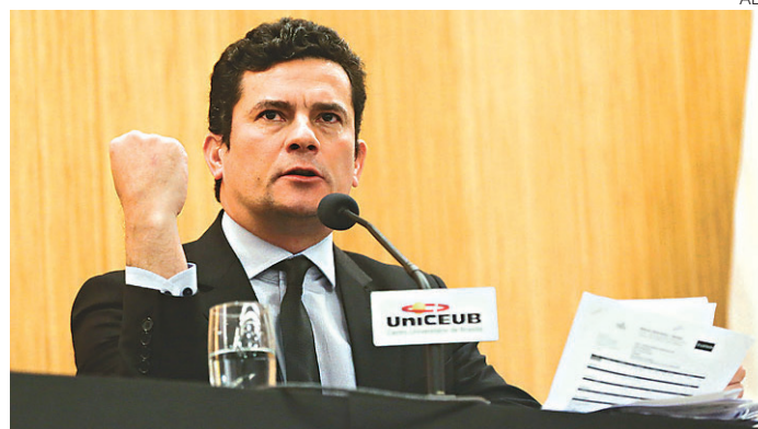
// Juiz federal Sérgio Moro: responsável pela Lava Jato

O vazamento da informação deixou Janot muito inco-