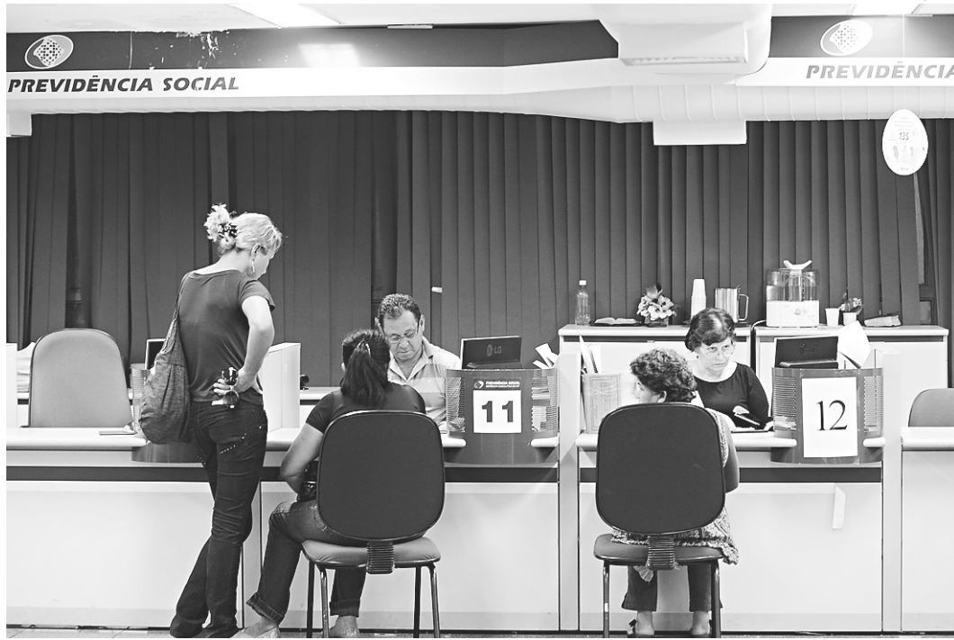
// Déficit da Previdência em 2015 foi de R$ 86 bilhões e este ano está projetado em R$ 146 bilhões

Segundo Caetano, o texto da reforma da Previdência ainda está em discussão dentro do próprio governo. "Propor uma reforma da Previdência é algo bastante trabalhoso, algo que tem um grau de complexidade bastante elevada e exige uma discussão intensa dentro do próprio governo, do próprio Executivo. Não é uma pessoa só, mesmo dentro do Executivo, que faz a reforma, é um trabalho coordenado entre as áreas da Previdência, Fazenda, Planejamento, Casa Civil para se formar uma posição interna dentro do governo".