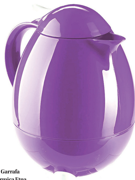
// Garrafa térmica Etna

Possível de combinar com tons quentes ou sobrios, os utensílios em tons de violeta são utratrend.