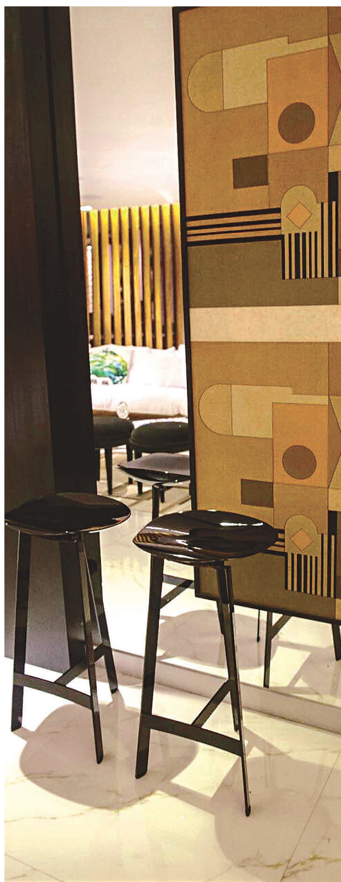
// Detalhe do living por Renato Teles