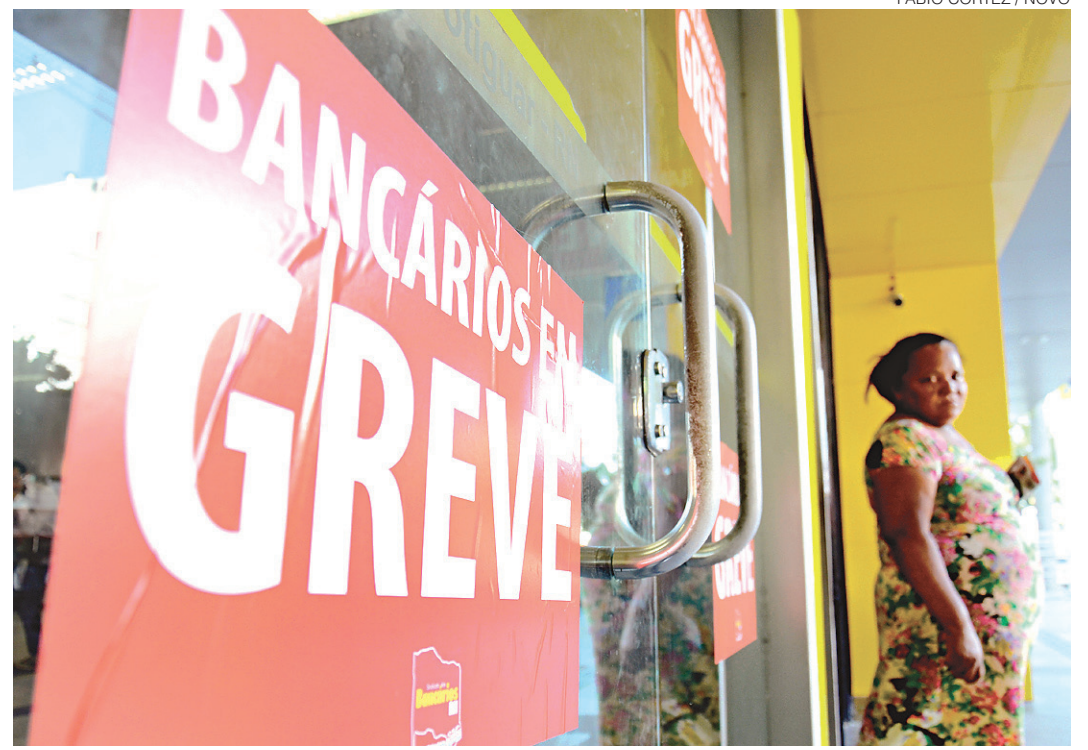
// No RN, cerca de 3.500 trabalhadores de bancos públicos e privados cruzarão os braços

Ele afirma que a categoria cumpre com os 30% de funcionamento exigidos pela Lei de Greves. Segundo explica, é uma exigência para os serviços essenciais, mas cada setor define qual parte do serviço é essencial. "No caso dos bancos, o que é essencial funciona. A compensação bancária vai funcionar normalmente, sem falar que os bancos terão seus planos de contingência para atender situações específicas e pontuais", diz o diretor.