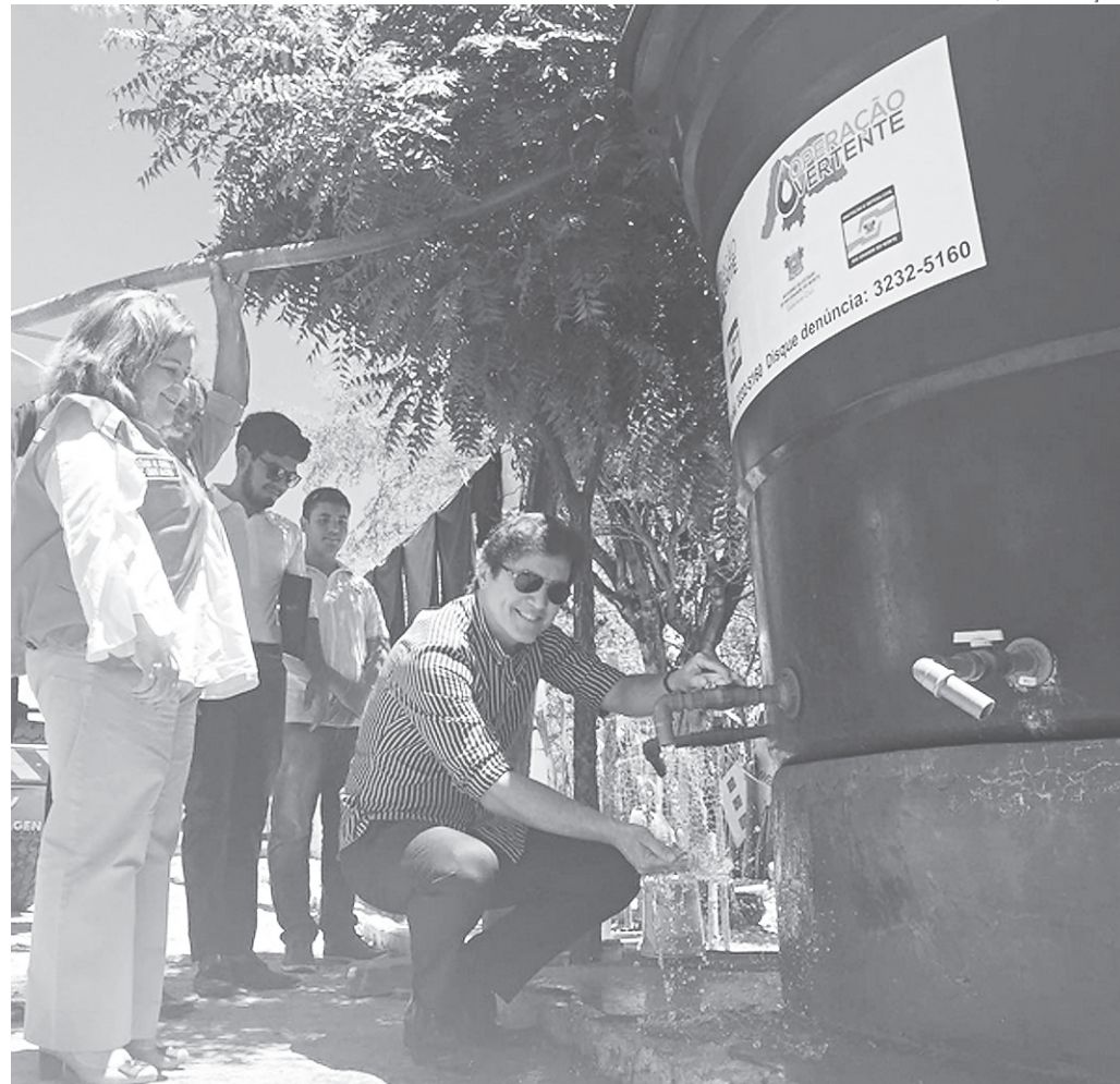
// Governador Robinson Faria no município de Alexandria dando início à Operação Vertente, que vai abastecer com caminhões pipa a área urbana de 13 cidades do Seridó e Alto Oeste. Serão beneficiadas 110 mil potiguares que sofrem com os efeitos da seca, que já dura mais de cinco anos