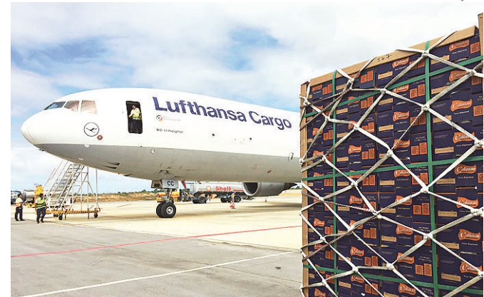
// Exportação no aeroporto chega a 5.800 toneladas em um ano