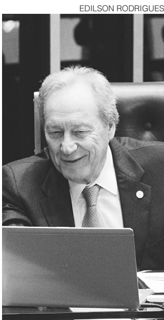
// Lewandowski, que presidiu o impeachment

“Em qualquer processo litigioso, toda decisão agrada a alguns e desagradada a outros atores envolvidos, sem que o inconformismo com o resultado macule a independência e a imparcialidade do julgador. No caso objeto da denúncia, a solução adotada não se afasta de outras deliberações de Sua Excelência [Lewandowski] na presidência do processo no Senado Federal”, acrescentou.