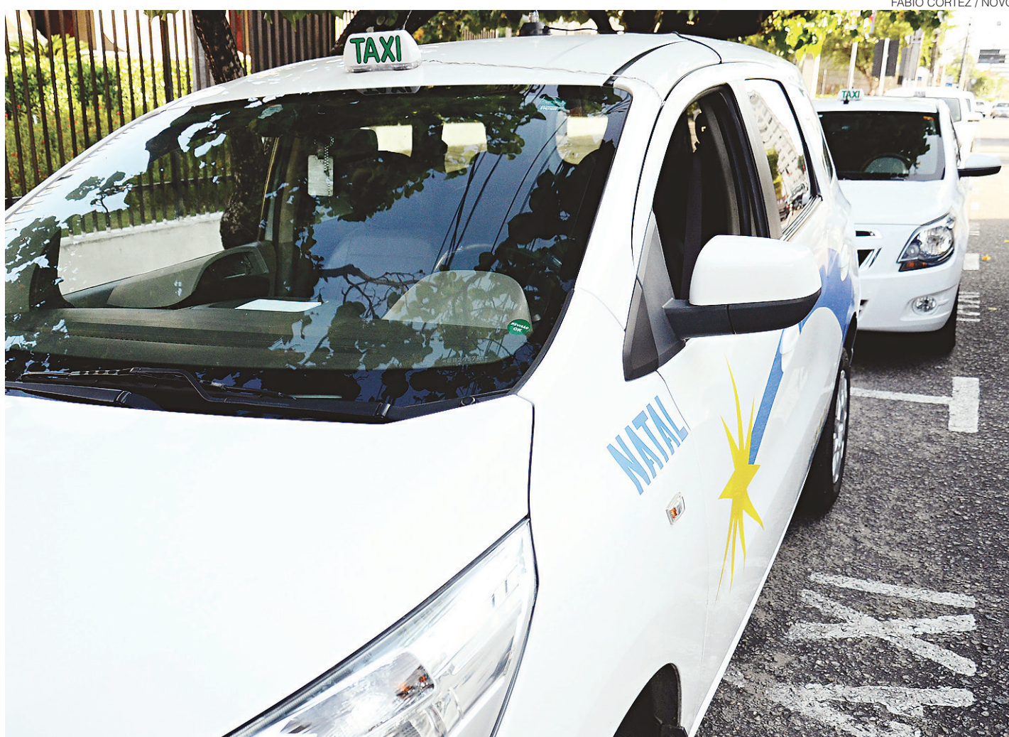
// Taxistas reclamam ter de arcar com os tributos relativos ao transporte de passageiros em comparação à ausência de cobrança ao Uber

A empresa Uber se ampara na Lei de Política Nacional de Mobilidade Urbana para