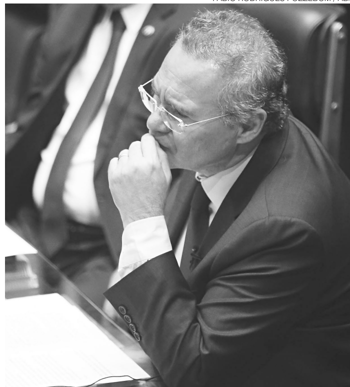
// Votação foi conduzida por Renan Calheiros, que rejeitou protestos

Senadores dilmistas se queixaram que a MP extinguiu diversos ministérios criados nos governos petistas, especialmente os ligados às áreas sociais como as secretarias especiais dos Direitos Humanos, de Políticas para as Mulheres e da Igualdade Racial. Segundo eles, isso é uma demonstração de que as políticas tocadas por