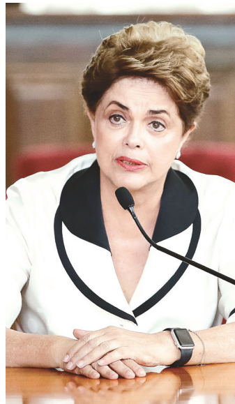
// Dilma, separada de Temer só no Governo