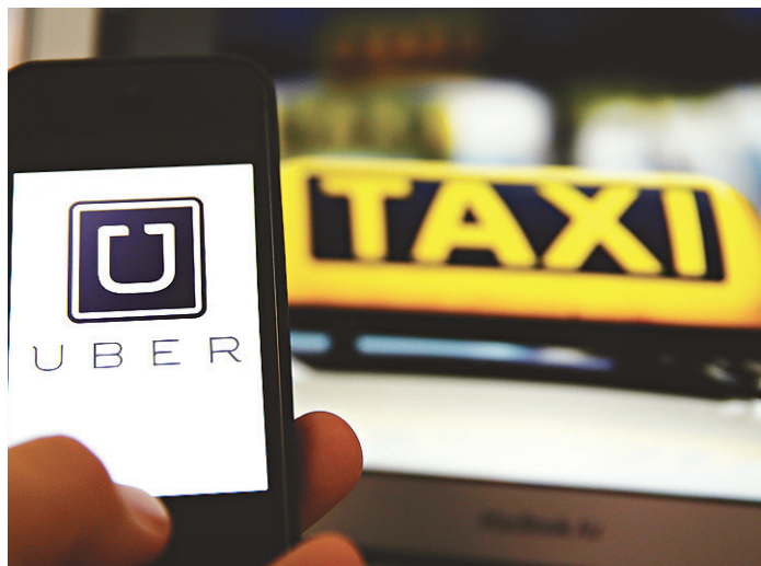
// Aplicativo Uber funciona em Natal há duas semanas

de São Gonçalo do Amarante, que à época deveria ter aproximadamente 50 veículos táxi, doou 770 concessões. Os taxistas da cidade, ainda de acordo com Genário Tor-