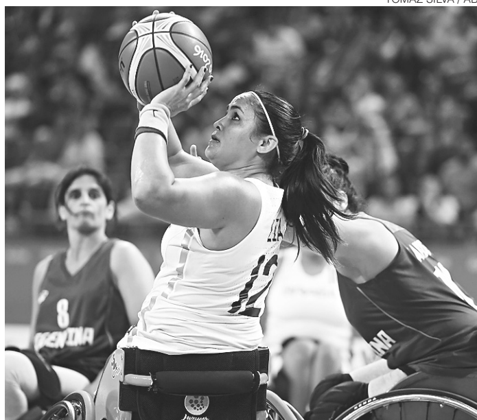
// Jogo termina com vitória arrasadora para o Brasil: 85 a 19

Os países com maior número de medalhas na categoria feminina são Estados Unidos, Alemanha e Israel. Os Estados Unidos também lideraram na categoria masculina, seguidos da Inglaterra e Israel. O Brasil ainda não conquistou medalhas na modalidade nas Paralimpíadas.