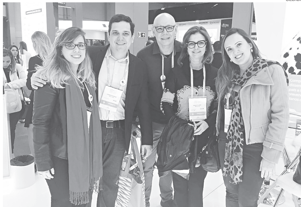
// Dermatologistas do RN participam de congresso nacional da SBD