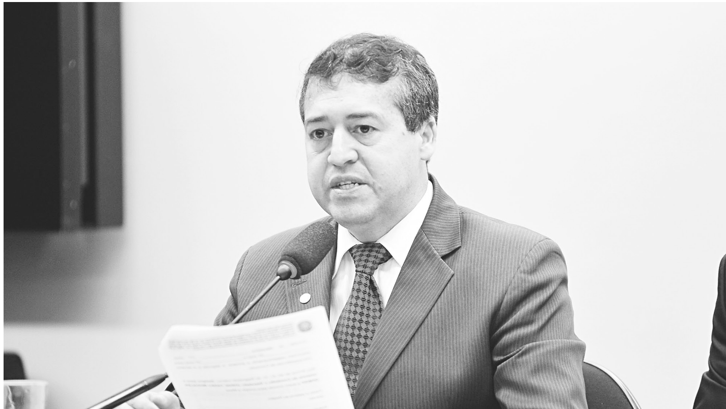
// Ronaldo Nogueira, do Trabalho, explicou que nos contratos por hora trabalhada os trabalhadores receberão FGTS proporcional

“O contrato de trabalho terá numeração com código, a fiscalização já vai ficar sabendo e fará checagens permanentes para essa relação, tanto com trabalhador por produtividade, por hora trabalhada ou por jornada de trabalho”, frisou Nogueira. Segundo ele, será uma medida importante para criar novas oportunidades de ocupação com renda para os brasileiros. Hoje, o desemprego atinge mais de 11 milhões, destacou o ministro.