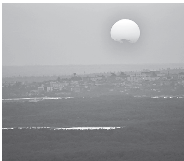
Pôr do sol em Natal.