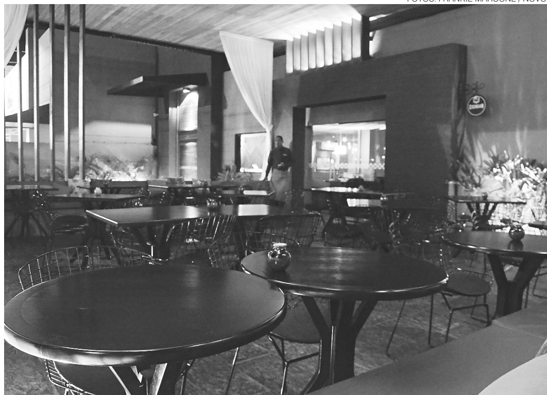
// Restaurante Hamachi, localizado na Avenida Praia de Ponta Negra, tem capacidade de receber até 115 pessoas; nome significa “filhote de atum”, ponto inicial para criação da identidade visual do ambiente gastronômico