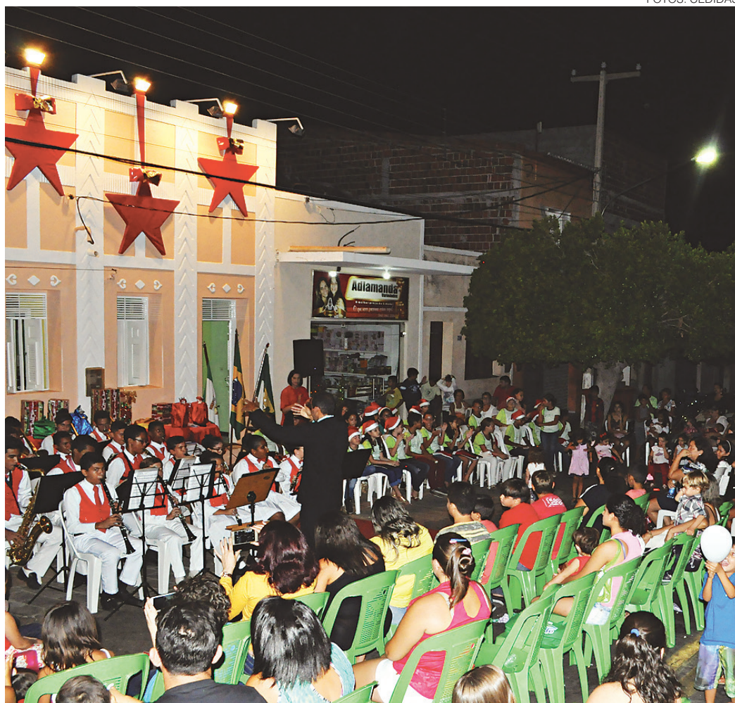
// Associação cultural atende mais de 80 crianças, através de cursos de música, balé, informática e inglês

O resgate cultural não se resume à música, que é tradição na cidade. Hoje, a Associação Espaço Cultural Cleto Souza também tem instalados em suas dependências um Museu com objetos e móveis que retratam a história da cidade e do país, além da música brasileira; um auditório moderno com capacidade para 100 pessoas; pinacoteca com obras doadas por artistas, boa parte artistas da cidade; escola de informática; biblioteca; oficinas de artes, inclusive para as mães das crianças atendidas; videoteca e cinemateca com centenas de títulos. Além disso, o espaço cultural realiza palestras, seminários e outros eventos. O trabalho é colaborativo e recebe doações de pessoas que se disponibilizam a ajudar com qualquer material que possam ser utilizados como alvo das atividades da casa.