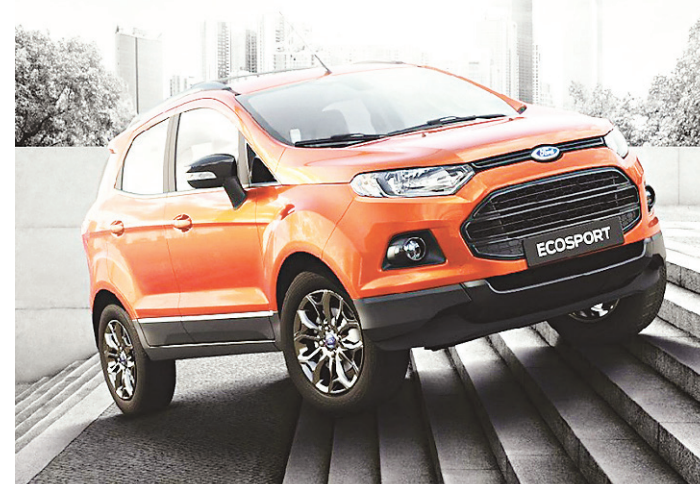
// A nova versão do jipe trará um novo motor 1.5 no lugar do atual 1.6