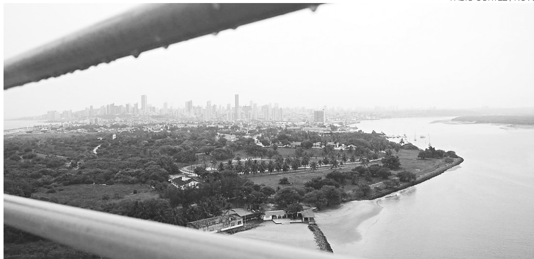
//Chuvas podem atingir até 60 milímetros nos próximos dias, índice considerado normal para dezembro

"Há a formação de um vórtice ciclônico sobre o