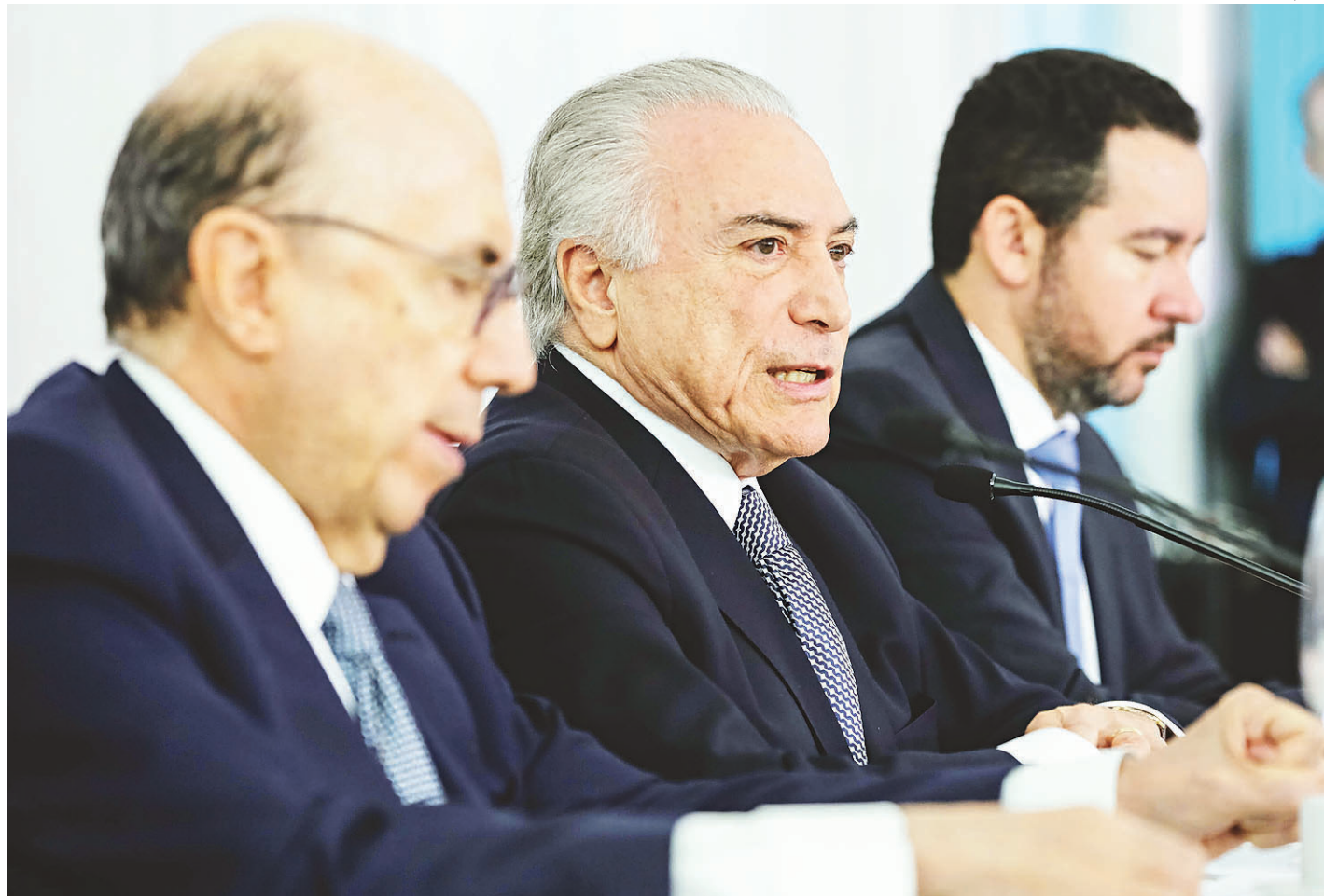
// Presidente Michel Temer anunciou ontem projeto de lei que altera a CLT e estabelece acordo entre trabalhadores e empregadores

Além da MP, foi apresentado projeto de lei para alteração da Consolidação das