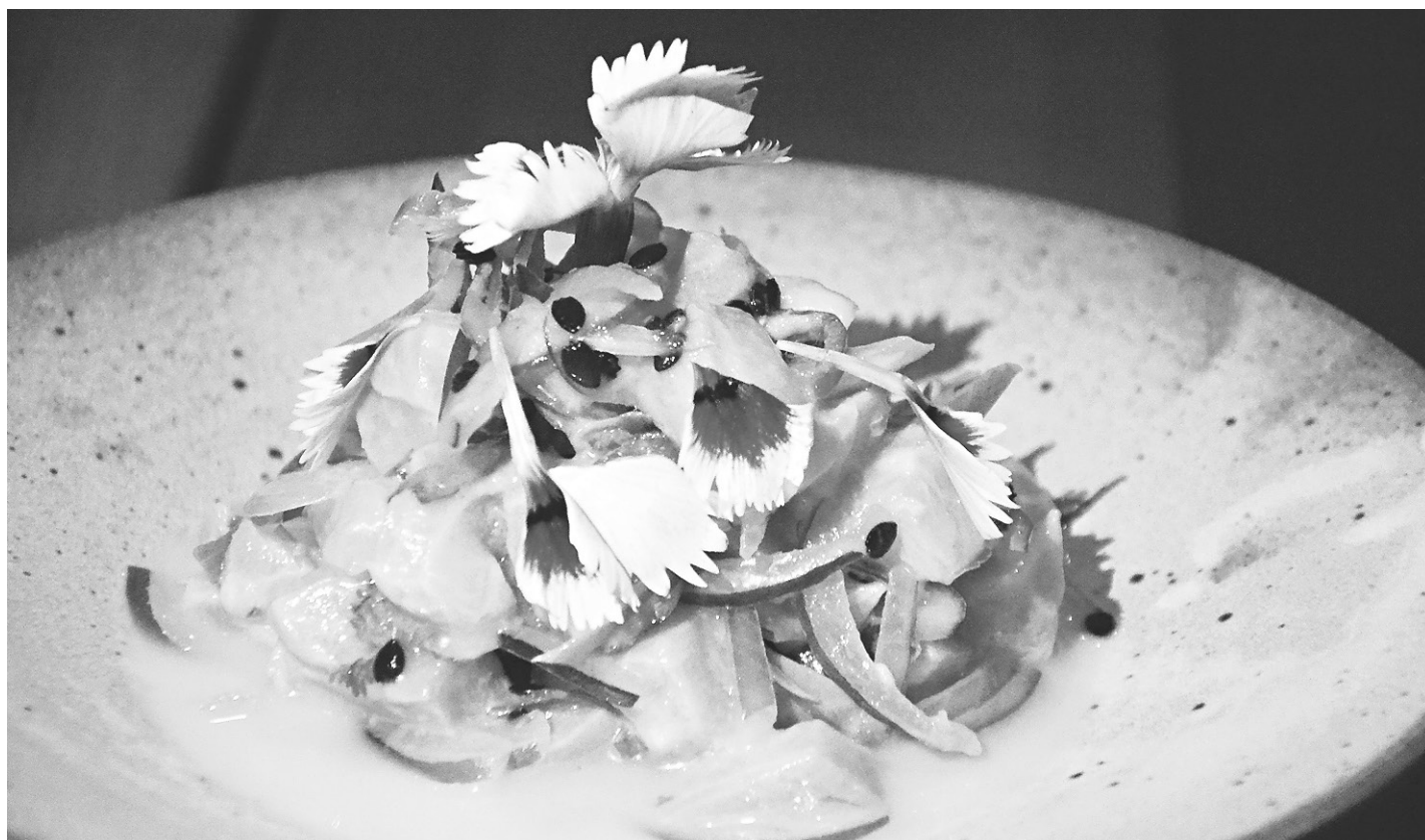
// Fusão entre a leve gastronomia japonesa e a apimentada culinária peruana é uma das tendências do circuito gastronômico europeu