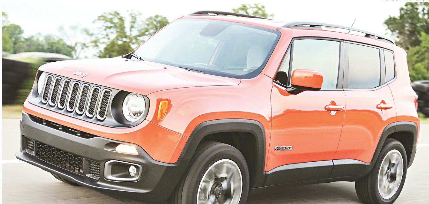
// Jeep Renegade já teve mais de 85 mil veículos emplacados em 2016. Modelo tem motor 139 cv, 5.750 rpm e pode ser abastecido com etanol

Neste ano, pela primeira vez o segmento de utilitários-esportivos será o segundo com maior volume de vendas do mercado brasileiro de automóveis. Os emplacamentos de jipes ultrapassaram os de sedãs pequenos na preferência do consumidor e ficaram atrás apenas dos hatches compactos.