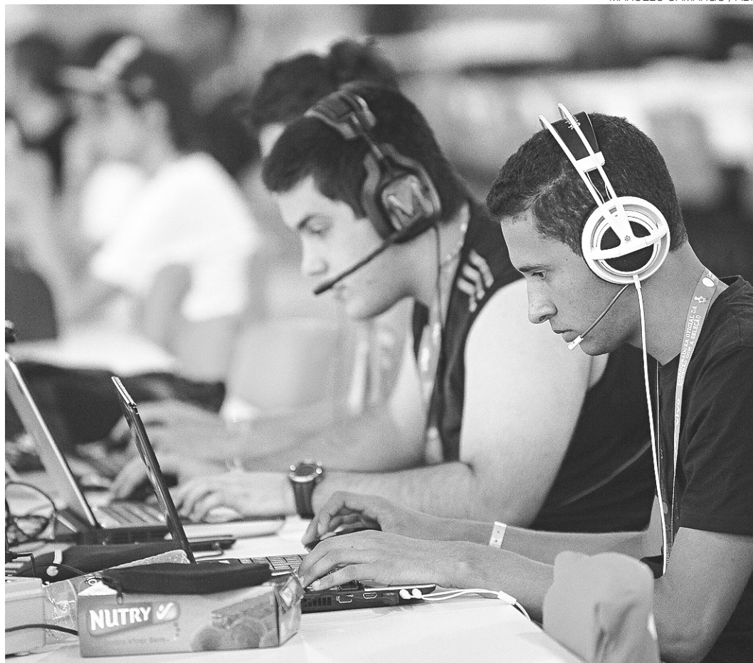
// Pesquisa mostra que 98% das casas potiguares com acesso à internet navegam através de banda larga

O número de domicílios brasileiros que contam com acesso à internet chegou a 57,8% em 2015, segundo o