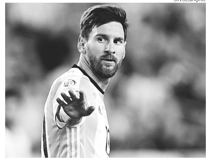
// Time de Messi tem 90 pontos de vantagem sobre o Brasil

O clube recebe uma premiação na medida em que avança de fase. Para quem chega às quartas de final, o valor pago é de R$ 450 mil. Nas semifinais, a premiação é ampliada para R$ 550 mil. Os dois finalistas recebem, cada um deles, mais R$ 550 mil por terem alcançado a decisão.