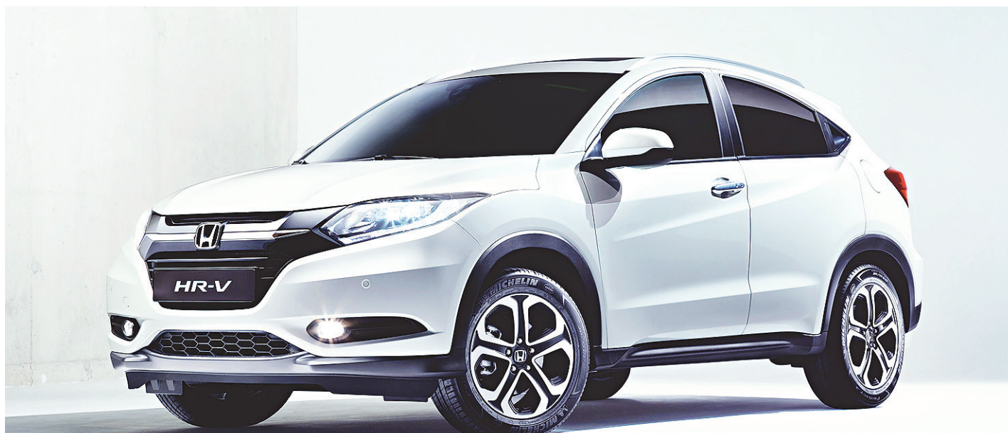
// Honda HR-V vem com motor de 140 cv (gasolina) ou 139 cv (etanol) e tem câmbio automático do tipo CVT de sete marchas