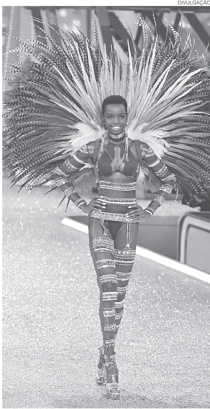
// Desfile do Verão 2017 Victoria's Secret em Nova Iorque