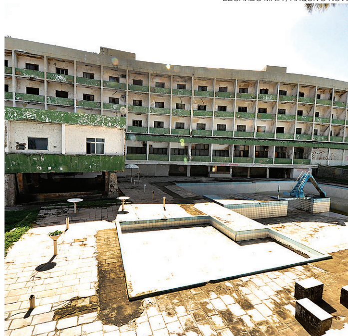
// Hotel Reis Magos, na Praia do Meio: demolição autorizada

O MPF entende, inclusive, que a demolição do prédio pode abrir espaço para algum empreendimento que sirva, sobretudo, à atração de turistas para a orla da Praia do Meio, com a consequente geração de empregos e receitas para a cidade. Nas palavras do procurador, a medida ainda ajudaria a concretizar os princípios constitucionais da livre iniciativa e do desenvolvimen-