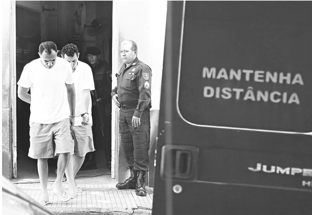
// Homens foram levados para presídio federal localizado na capital rondoniense

Os presos foram ouvidos por delegados de uma comissão formada pela Divisão de Homicídios e Proteção à Pessoa (DHPP), que decidiu indiciar cinco deles pela morte dos 26 internos de Alcaçuz, conforme informou a Polícia Civil. Na segunda-feira (30), a Secretaria de Segurança já havia anunciado que 109 presos, todos do Pavilhão 5, se-