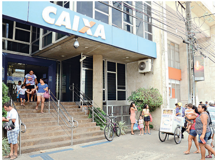
// Contas inativas do FGTS devem injetar R$ 41,4 bilhões na economia