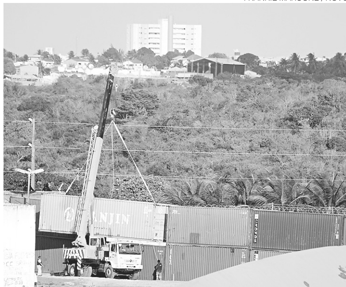
// Equipamentos foram colocados para separar facções rivais

O Governo do Estado divulgou no seu Diário Oficial (DOE) de ontem a planilha de custos da instalação da barreira provisória de contêineres e do muro de concreto pré-moldado para separação dos pavilhões na Penitenciária de Alcaçuz. A intervenção na unidade será no valor total de R$ 794.028,00, referentes ao aluguel, transporte, instalação e desinstalação dos contêineres, locação de escavadeira, retro-escavadeira e caçamba para transporte de entulhos e a construção da base e do muro de concreto.