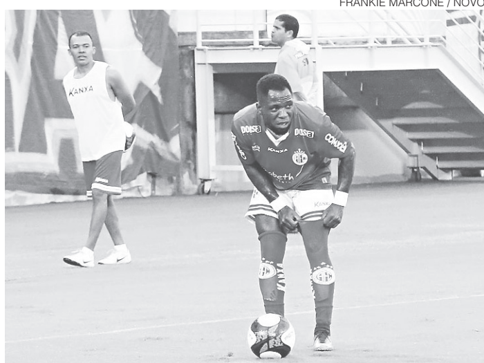
FRANKIE MARCONE / NOVO

O técnico do América, Felipe Surian, inclusive, disse que não cabem mais derrotas no plano do América para este turno. Assim, ele entende os