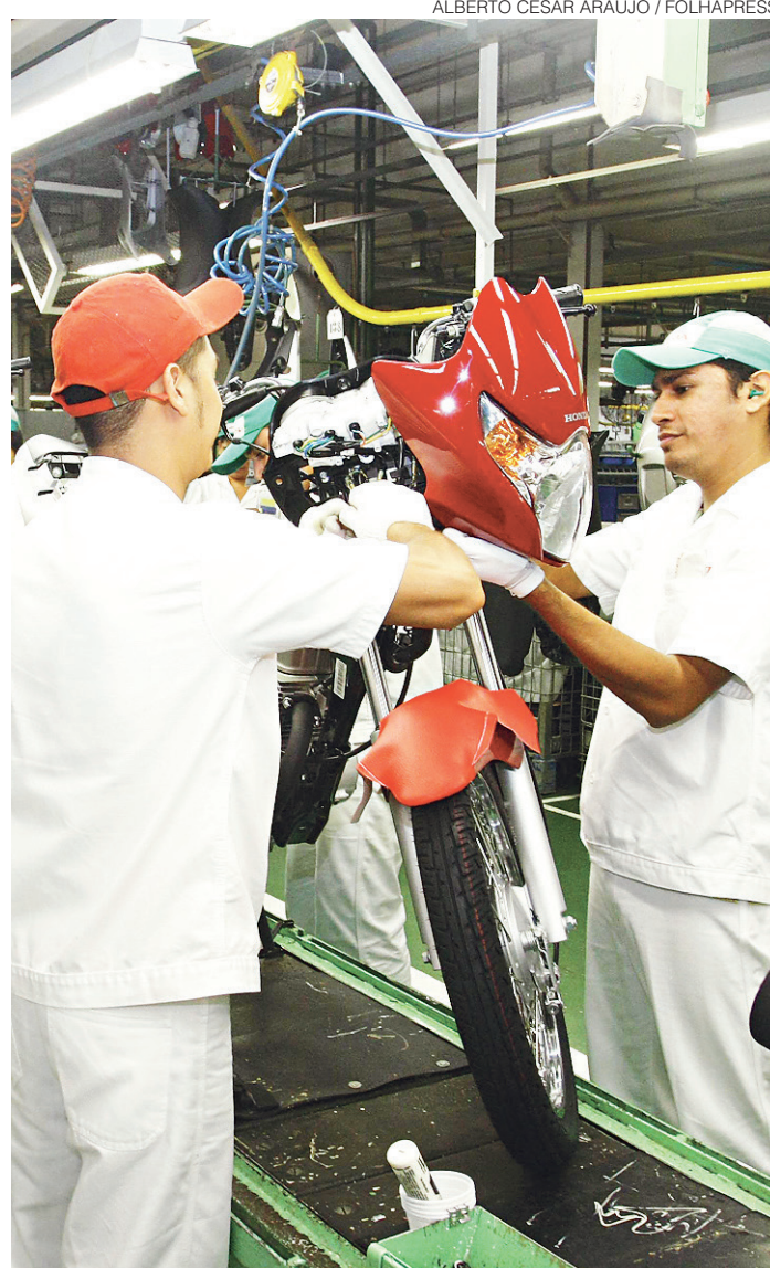
// Indústria tem alta de confiança em 15, de 19 segmentos