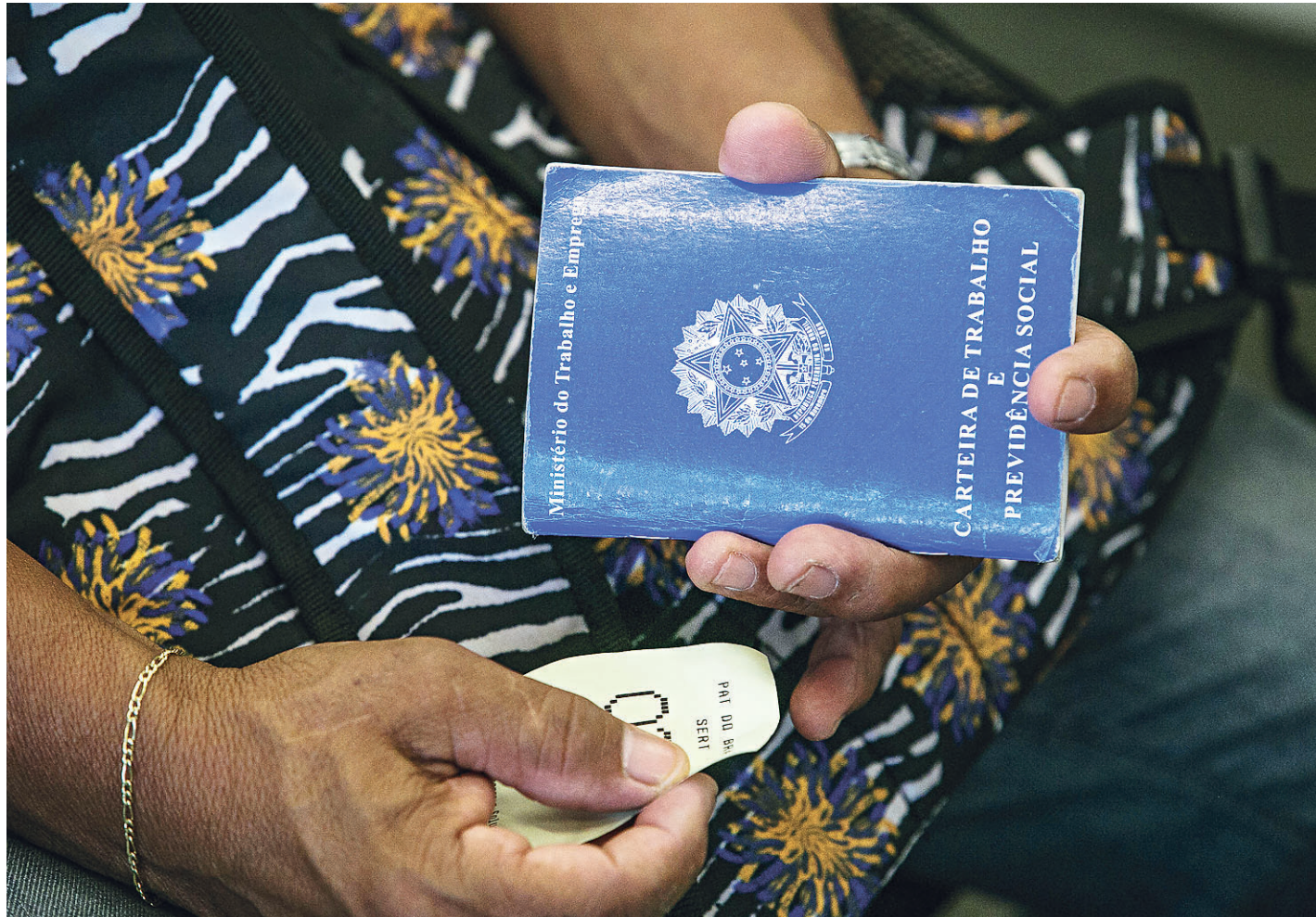
// Taxa de desocupação encerrou quarto trimestre de 2016 em 12%. No mesmo período de 2015, o índice chegou a 11,8%, segundo o IBGE

A Pesquisa do IBGE aponta que cerca de 34 milhões de pessoas ocupadas no setor privado tinham cartei-