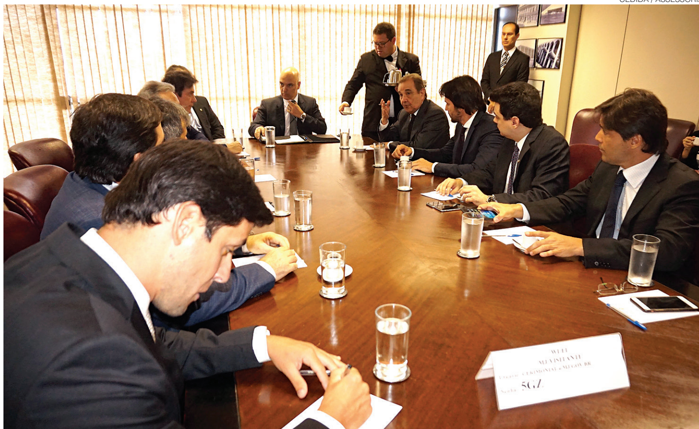
// Governador Robinson Faria, bancada federal e representantes do Poder Judiciário e Legislativo do RN se reuniram com o ministro da Justiça

As novas penitenciárias serão construídas de forma modular, sendo mais rápida a conclusão e mais segura, segundo o governador. Além das duas que já estão sendo construídas, a intenção é iniciar mais uma: a terceira.