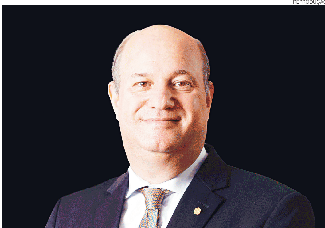
// Presidente do Banco Central, Ilan Goldfajn, disse que, por enquanto, a meta de inflação é de 4,5% ao ano

O presidente do Banco Central afirmou que a ancoragem das expectativas permitiu a intensificação da flexibilização monetária, o que de fato foi feito, com o corte de 0,75 ponto porcentual em janeiro. "A ancoragem das expectati-