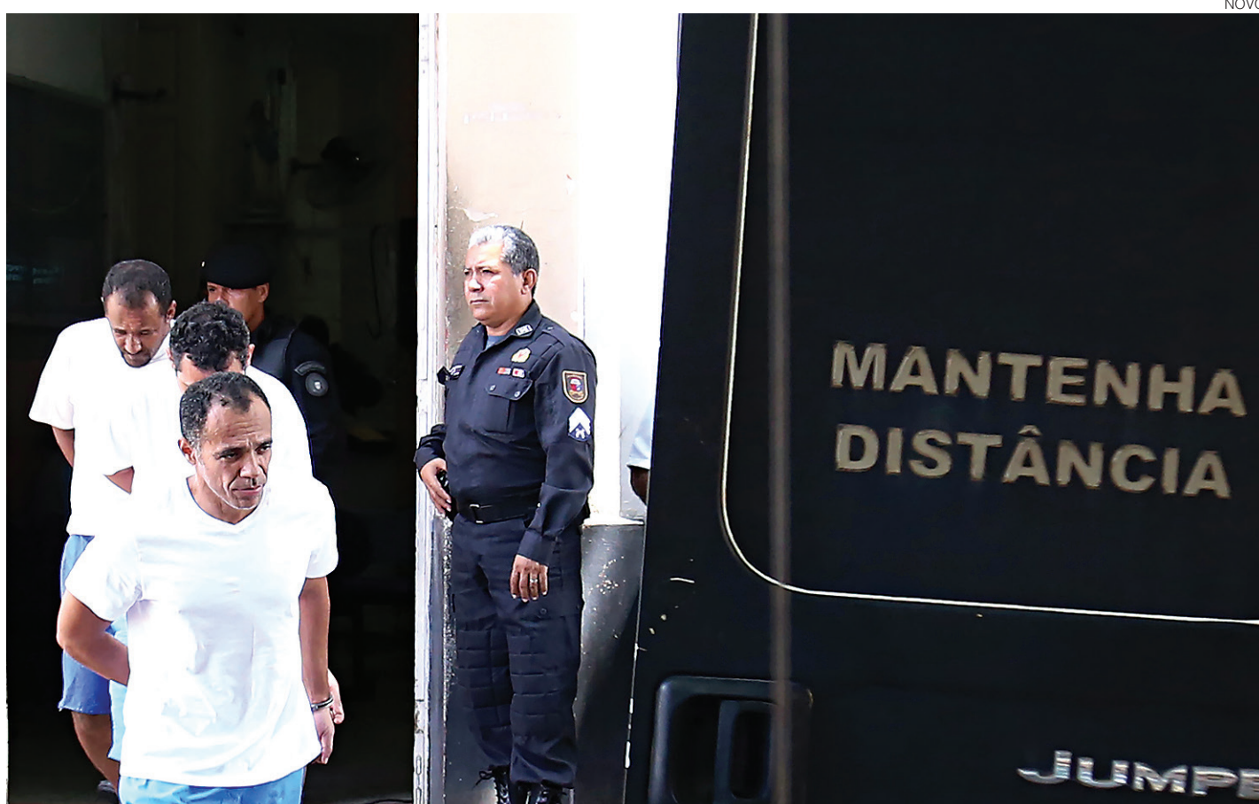
// Presos foram levados ao Itep para passar por exame de corpo de delito e depois seguiram para o aeroporto em São Gonçalo

Se as atrações nacionais estão definidas, os artistas locais que participarão do Carnaval 2017 em Natal ainda contam com seis chamadas públicas para contratação pela prefeitura. Devem ser selecionados 24 nomes entre intérpretes, bandas e grupos. Uma das novidades é a "Virada Carnavalesca" em Ponta Negra. Cultura #16