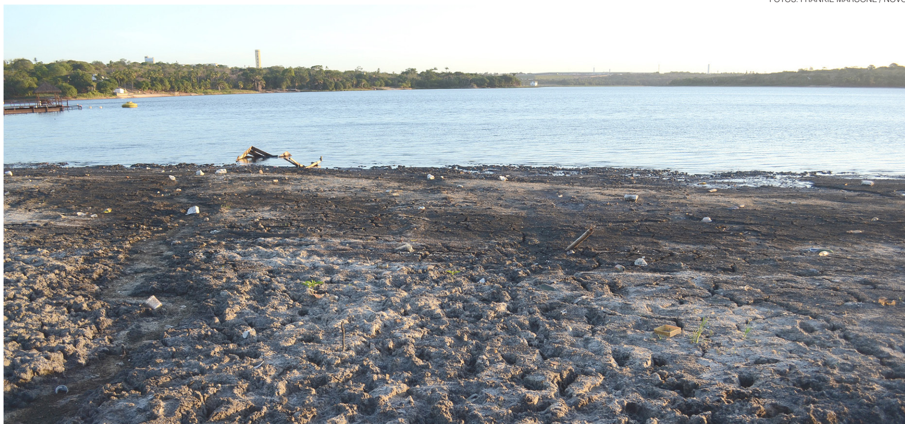
// Motivo para rodízio no abastecimento é o estado da Lagoa de Extremoz, que abastece 70% da região e está com menos de 40% de sua capacidade

O ciclo do rodízio é a cada três dias. Em um dia determi-