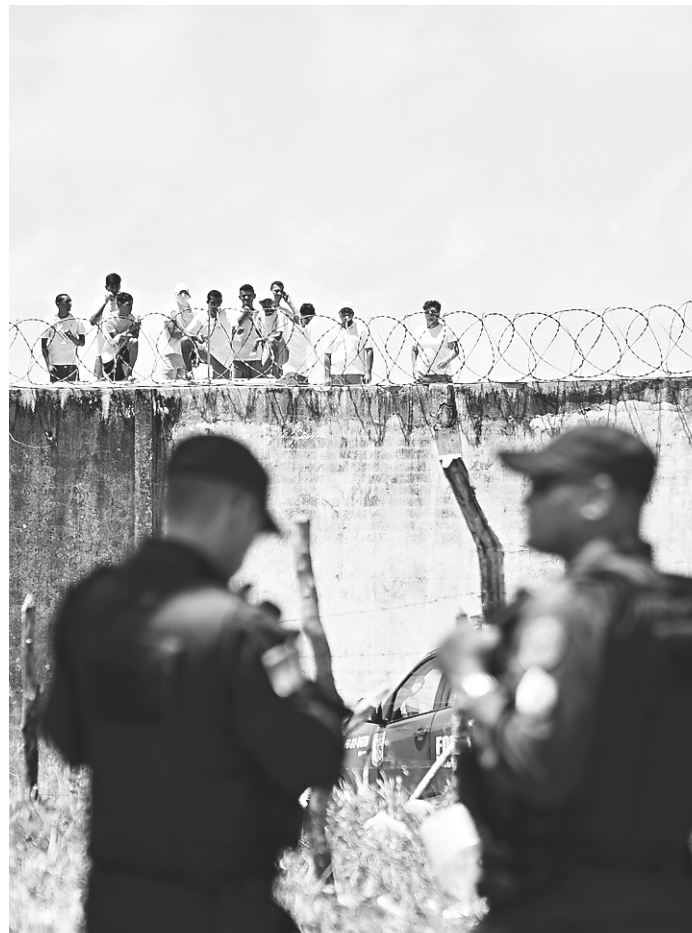
// Segundo delegado, boa parte das vítimas é ligada a alguma facção