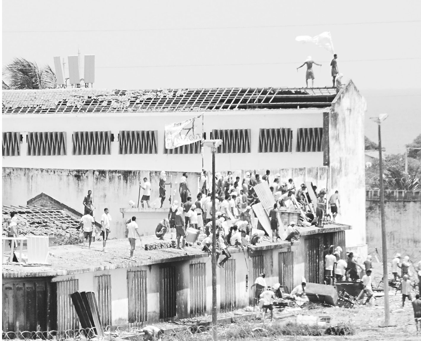
// Aumento no número de mortes foi alavancado pelos motins na Penitenciária Estadual de Alcaçuz

O mês de janeiro de 2017 foi o mais violento dos últimos três anos. Comparado com o mesmo período de 2016, que registrou 157