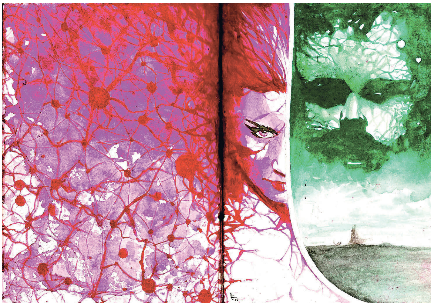
// A obra traz fortes traços de ficção científica e se inspira em clássicos da literatura, como "O Mágico de Oz" e "Alice no País das Maravilhas"

Editor: Jalmir Oliveira E-mail: jalmiroliveira@novojornal.jor.br