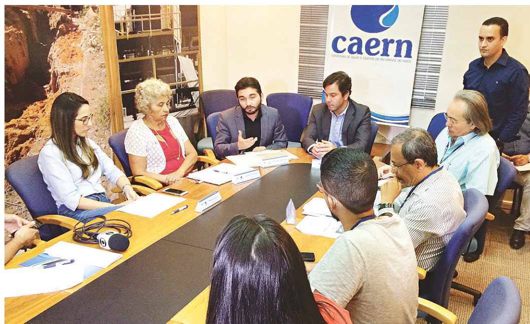
// Segundo a Caern, que reuniu a imprensa ontem para falar do assunto, zona Sul não tem risco de rodízio

nados bairros recebem água e passarão dois sem receber.