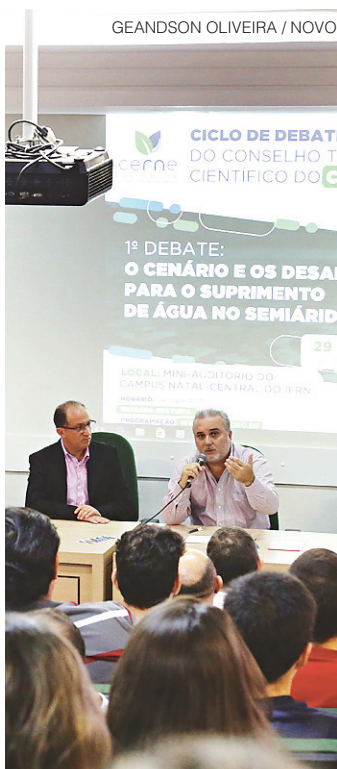
// Ciclo de debates discutiu alternativas para semiárido