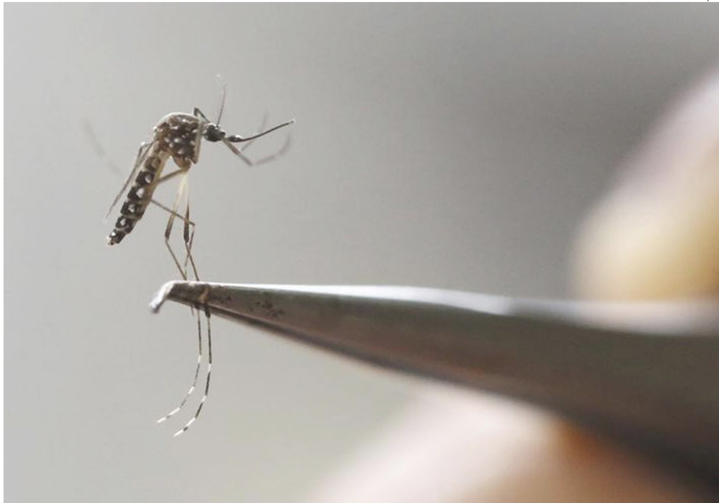
// Mosquito Aedes aegypti (foto) é um dos transmissores do vírus da febre amarela; inseto também é vetor da dengue, zika e chikungunya

As informações repassadas à reportagem são de que mesmo como suspeita, a morte do paciente potiguar já era tratada como não tendo relação com febre amarela. A vítima tinha problemas imunológicos e pelas características da morte os investigadores não acreditavam na hipótese. Entretanto, como havia sido feita a notificação para febre ama-