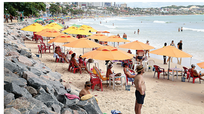
// Quantidade de mesas e cadeiras na praia agora é limitada