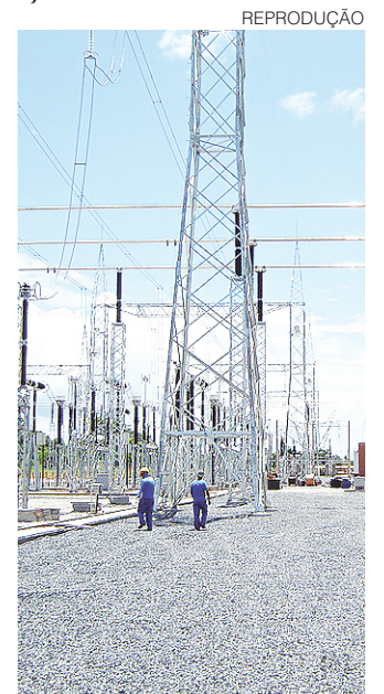
// Desconto é válido apenas para o consumo do mês abril

Na conta do mês subsequente, o consumidor perceberá uma redução proporcional no valor referente aos demais 10 dias de abril com tarifa ajustada.