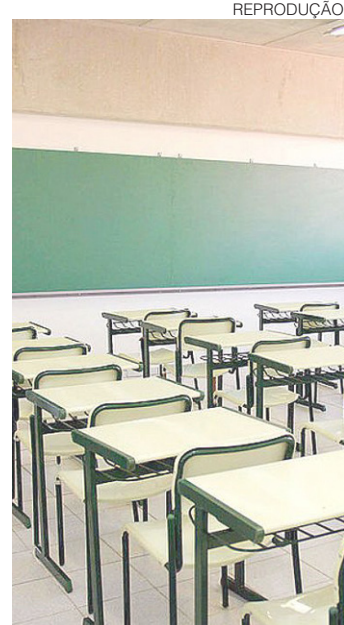
// 134 mil crianças potiguares estão longe da escola, diz Ibge

de 2015 da Pnad mostram que a taxa de frequência de crianças de 4 a 5 anos na pré-escola está em 84,3%. No caso das crianças com menos de 4 anos, apenas 25,6% estavam em creches.