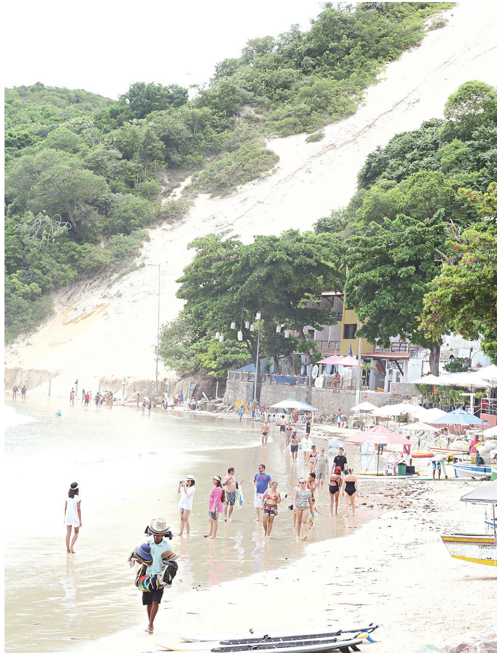
// Praia de Ponta Negra passa por intervenção com objetivo de regularizar ocupações de espaço