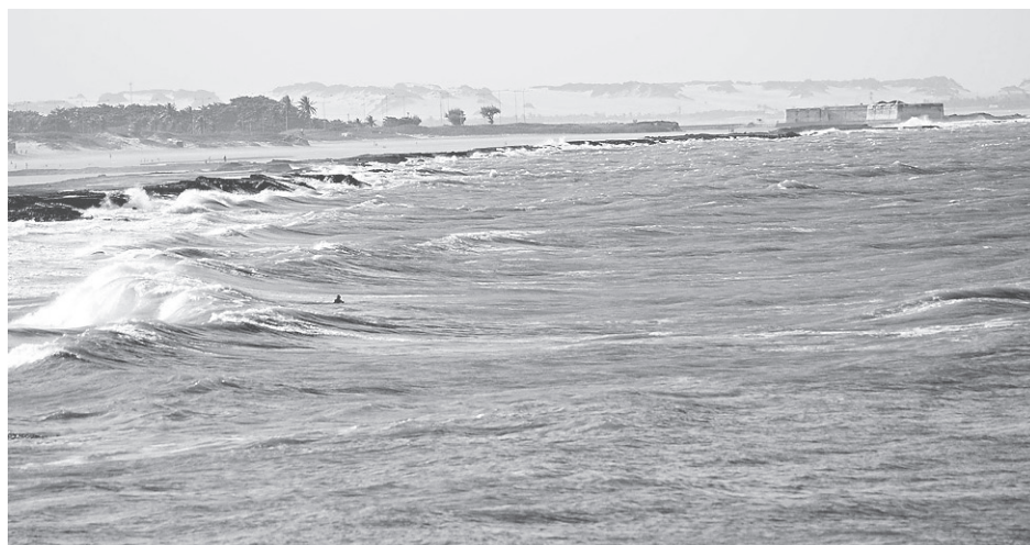
Uma das nossas mais belas praias, Praia do Meio.

Todo dia a gente luta para manter você bem informado através dos nossos canais digitais e impresso. Mas, hoje a gente quer fazer diferente: queremos que você diga como a gente pode melhorar. Estamos fazendo isso porque aqui não tem essa de impor nada a ninguém. Pelo contrário: a gente sempre abre espaço para quem realmente importa, o leitor, dizer o que pensa e o que quer ou não ver por aqui. É aquela história: Pra você, do seu jeito. São só algumas perguntas de marcar (não gasta dois minutos, sério!), mas suas respostas serão valiosas e utilizadas para melhorar o NOVO! Ajuda a gente, por favor? Basta acessar esse link ( http://bit.ly/pesquisaNOVO ) e responder