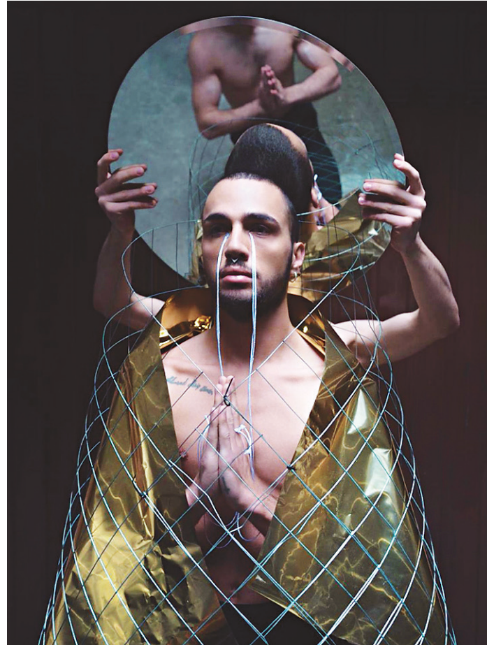
// Ideia é produzir mil exemplares do produto impresso