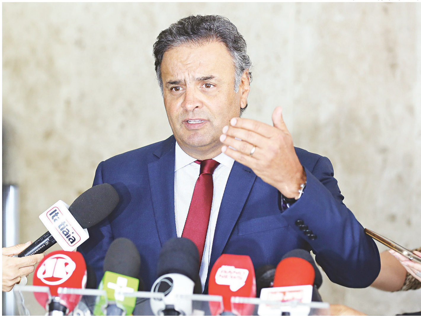
// Afastamento de Aécio foi decidido em caráter liminar pelo ministro do Supremo Tribunal Federal (STF) Edson Fachin em 18 de maio