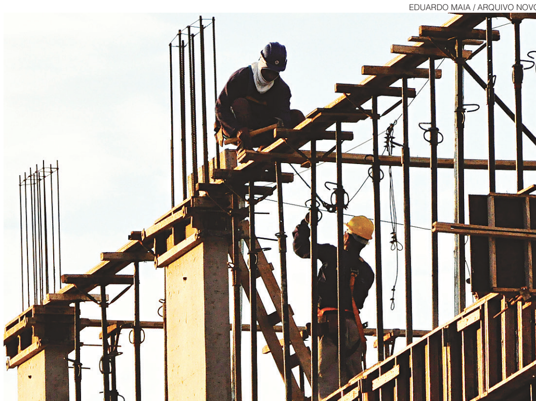
// Legenda Us, quia sam rae lat. Ellabora dolum voluptas vit ariam as sum unt aut et haria volupti od es ene

No primeiro trimestre de 2017, dentre os trabalhadores que deixaram a inatividade, passaram a procurar emprego e não obtiveram uma colocação no mercado de trabalho cerca de 50% têm idade entre 14 e 24 anos e, aproximadamente, 35% possuem o ensino médio. Na outra ponta, dentre aqueles que saíram da condição de inativos e conseguiram uma ocupação, 35% têm entre 25 e 49 anos e