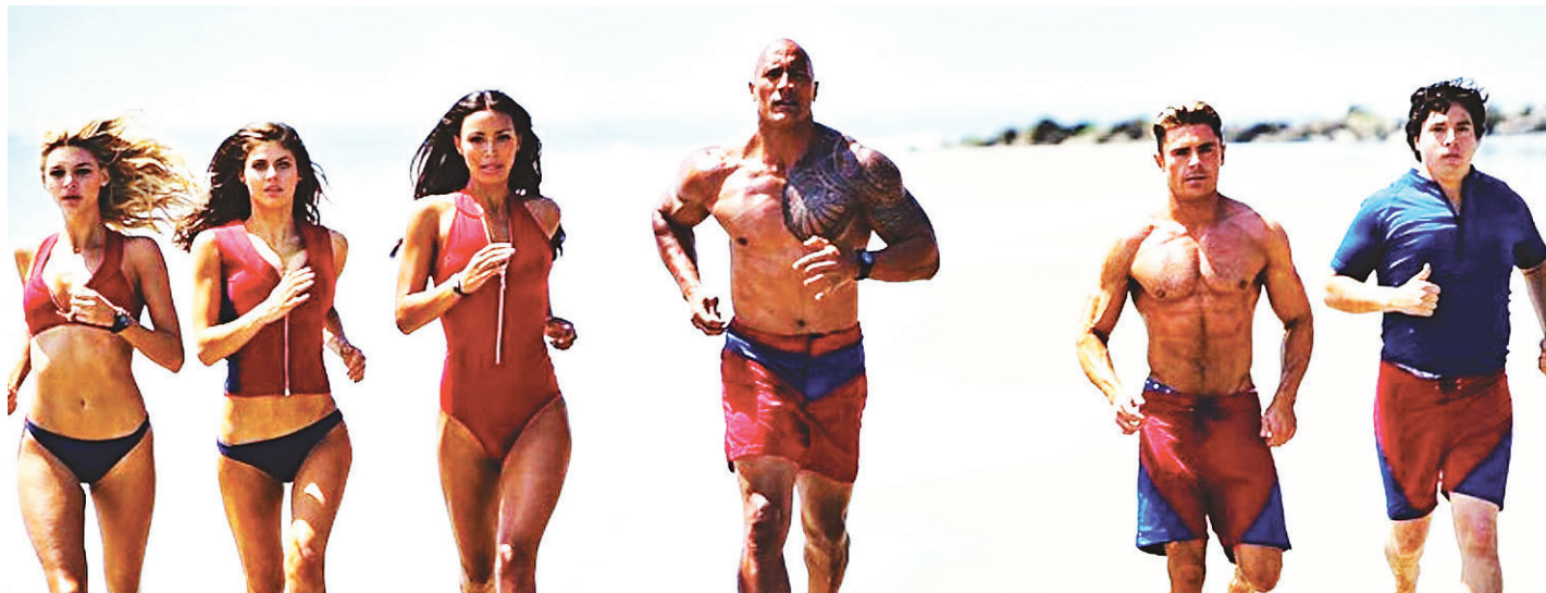
// S.O.S. Malibu, que fez sucesso nos anos 90, volta reencarnada na pele de comédia pastelão, sem abrir mão das câmeras lentas na beira da praia

Mas, se a série tinha histórias dramáticas, romance, ação e um leve toque de humor, o longa já começa com uma comédia pastelão. Na trama, o chefe Mitch precisa de novos recrutas e faz longos testes para escolher os novos