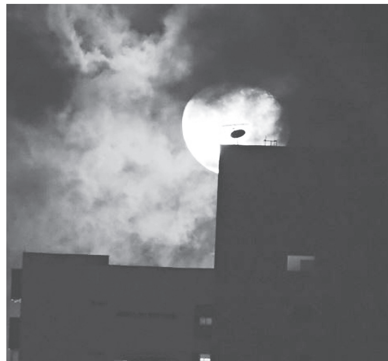
Um lindo registro de boa noite para alegrar a semana!