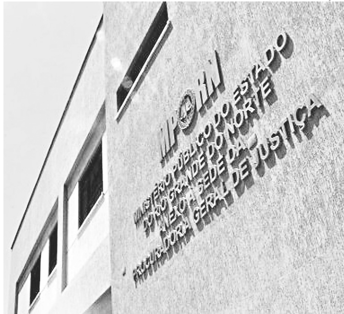
// Crime aconteceu no dia 24 de março na sede da PGI