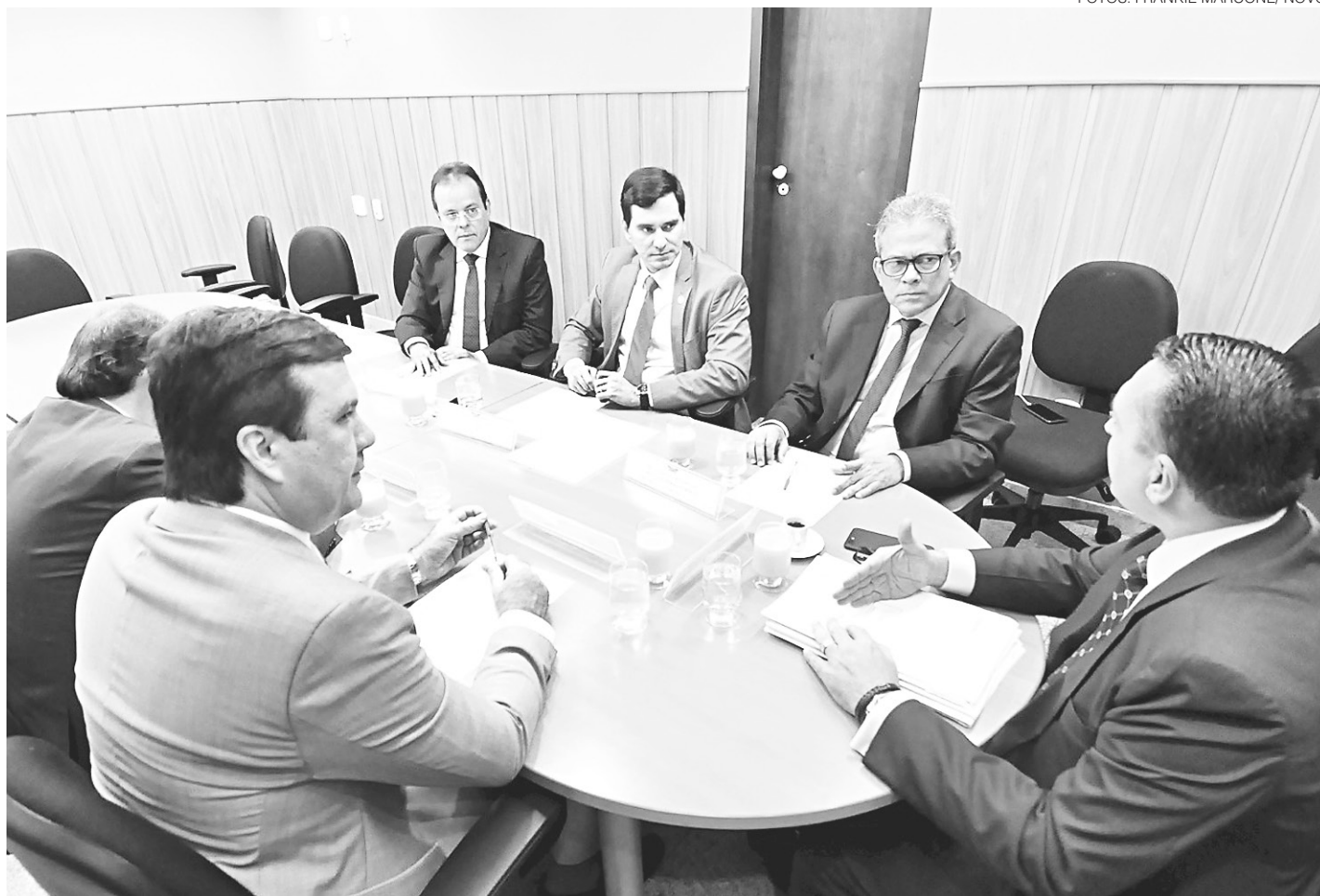
// Mesa Diretora da Assembleia Legislativa se reúne para debater situação do deputado Ricardo Motta

A Presidência da Casa fez uma convocação especial aos membros da Mesa Diretora para dar ciência sobre o afastamento judicial do deputado Ricardo Motta. Mera formalidade, conforme indicou o próprio procurador Sérgio Freire. “Foi dada ciência à Mesa sobre o afastamento judicial direcionado ao deputado Ricardo Motta. Esse é um ato formal e regimental”, explicou. “A decisão [judicial] determinou a suspensão da atividade política, mas permite a manutenção da estrutura de serviços. O gabinete permanece aberto”, de-