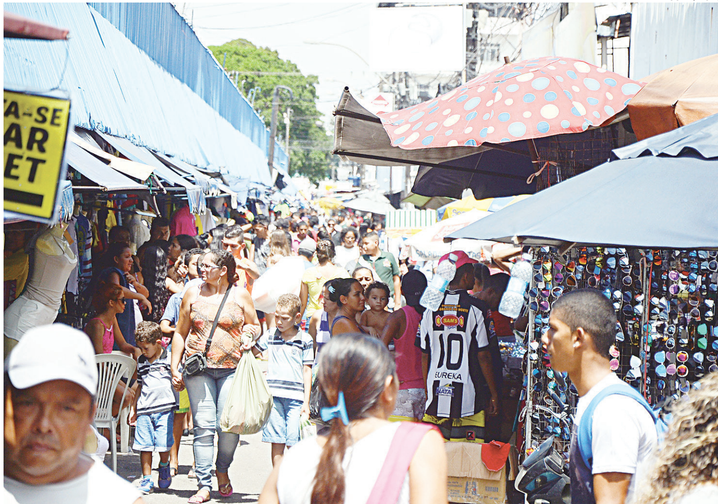
// Segundo a CDL Natal, o comércio de rua, bancos, repartições públicas e unidades de ensino retornam amanhã, 16, a funcionar normalmente

O feriado de Corpus Christi também irá influenciar no funcionamento do sistema público de transporte. Já os