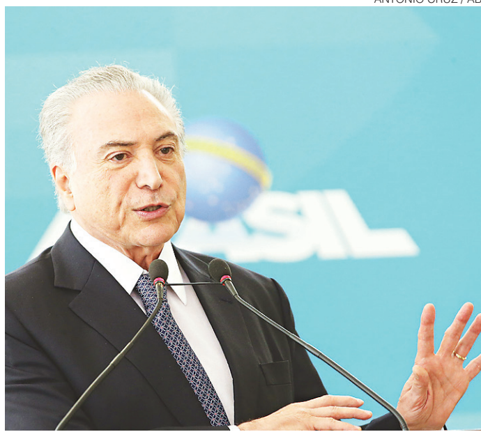
// Michel Temer, presidente: "Temos de encontrar um caminho"

A renegociação da dívida do BNDES com os Estados foi pactuada no ano passado, mas somente neste ano foi cumprida parte das exigências legais para a operação. A demora para autorizar o refinanciamento desagradou