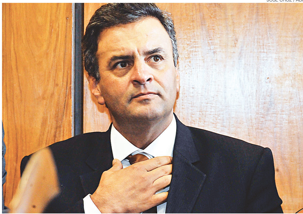
// Aécio Neves, senador afastado por decisão judicial

Após encontro com o presidente do Senado, Eunício Oliveira (PMDB-CE), o ministro Marco Aurélio Mello,