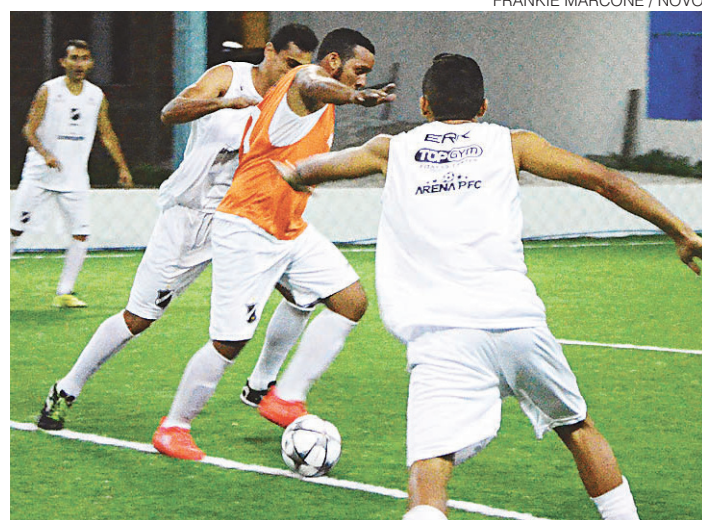
FRANKIE MARCONE / NOVO

Mais conhecido como futebol society, o Fut7 ganhou liga e organização no RN. Lá, ABC e América participam, mas dividem espaço com os times de bairros. #6