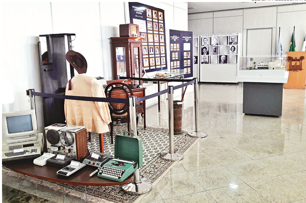
// Exposição do Memorial Legislativo Potiguar será aberta ao público a partir de hoje

O Ato Adicional 16 de 1834, pelo qual Dom Pedro I extingue os Conselhos Gerais das províncias e cria, em seu lugar, as assembleias legislativas provinciais é o marco inicial da história da Assembléia. Para tornar conteúdo mais acessível, a exposição conta com a presença de historiadores e servido-