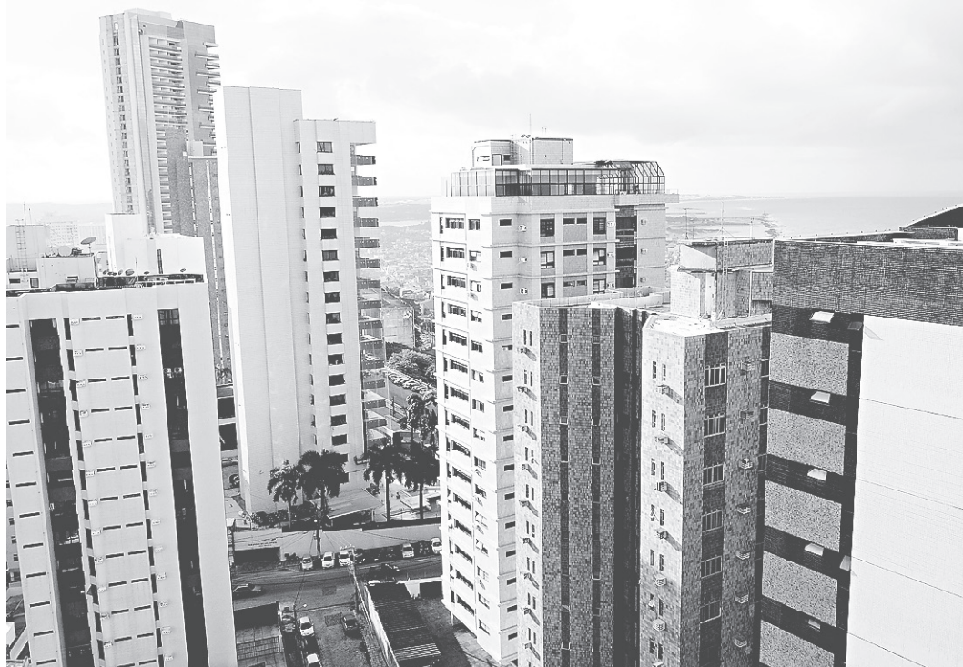
FÁBIO CORTEZ / ARQUIVO NOVO

// Feirão Band Imóveis começa nesta sexta-feira e espera, em dez dias, alcançar 100 mil interessados