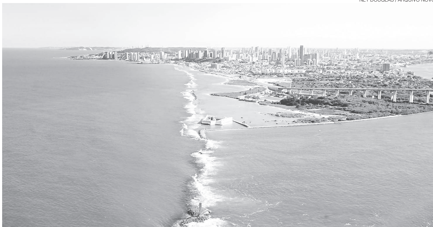
// Com os Estados de Bahia, Alagoas, Ceará e Rio Grande do Norte, o Nordeste está liderando as preferências, segundo a CVC