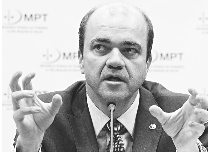
// Ronaldo Curado Fleury, procurador-geral do Trabalho

O procurador-geral do Trabalho foi categórico ao dizer que teme pelo resultado que a polêmica “Guararapes vs MPT” pode chegar.