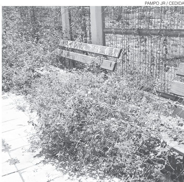
// Mato esconde bancos que deveriam ser usados pelos moradores

A moradora reivindica que os problemas de sua rua sejam sanados. "Faz seis anos que eu moro nesta rua. Pago um IPTU anual caríssimo de R$ 2.233,00 e, todos os meses, a taxa de iluminação pública vem na minha conta de