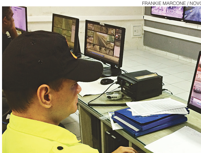
// Sistema de videomonitoramento operado pela STTU

O Conselho Nacional de Trânsito (CONTRAN) especifica o destino do dinheiro arrecadado enquanto receita pública orçamentária e prevê os gastos dispostos pela STTU no Portal da Transparência da Prefeitura de Natal. De acordo com a ferramenta, este ano a Secretaria de Trânsito, responsável pela mobilidade urbana, já pagou em 2017 R$ 6.394.183 em investimentos e outras despesas correntes com recursos arrecadados das multas, não necessa-