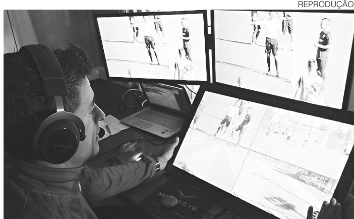
// Recurso não deve começar a ser utilizado já na próxima rodada

A CBF corre, inclusive já tendo iniciado testes com um maior número de árbitros, para que se tenha o recurso o