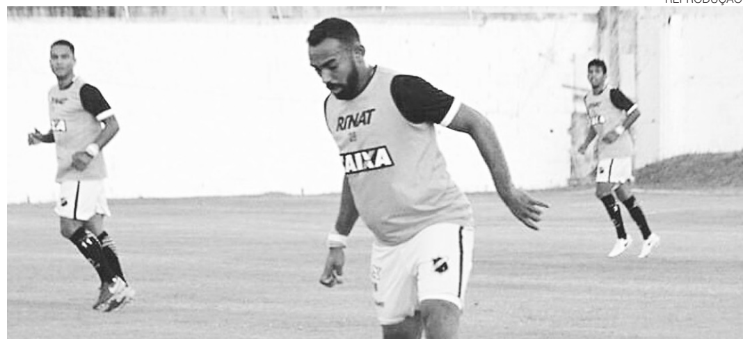
// Recentemente o jogador foi às redes sociais reclamar da falta de salários e dificuldades para alimentação

Mesmo de volta a equipe, o jogador não estava entre os relacionados para a partida no último sábado, contra o Paysandu, na qual o clube potiguar perdeu por 2 a 0.