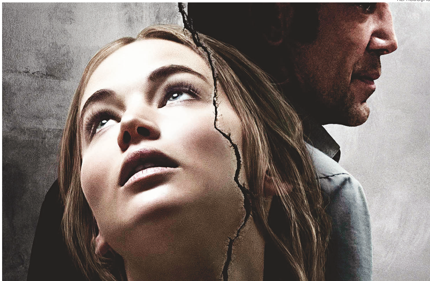
// Jennifer Lawrence e Javier Bardem estrelam produção que apresenta uma trama complexa e polêmica e que tem dividido opiniões