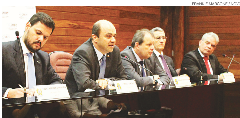
FRANKIE MARCONE / NOVO

Ministério Público do Trabalho cria grupo com procuradores de fora do RN para cuidar do caso envolvendo a empresa, anuncia ações e medidas de segurança para o protesto que ocorre hoje, às 15h30. #3