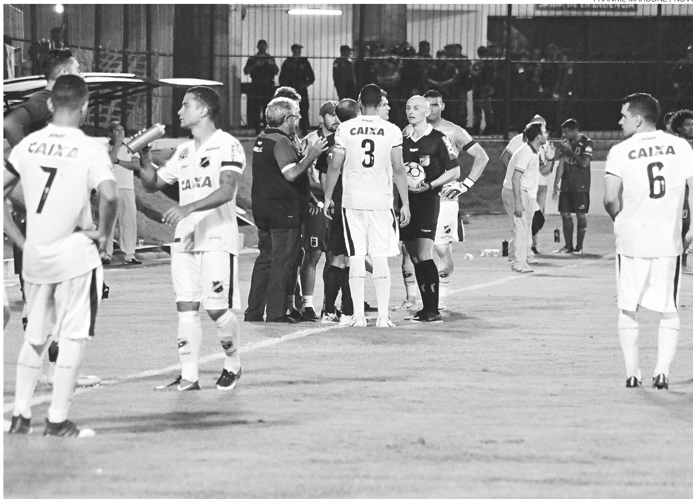
// Alvinegro é o lanterna na tabela de classificação da Segundona com apenas 17 pontos somados em 24 rodadas disputadas

Quatro vitórias, cinco empates e quatorze derrotas. Esta é a campanha abecedista em 24 rodadas. É o clube com mais derrotas e menos vitórias, além de ter a pior campanha jogando em seus domínios.