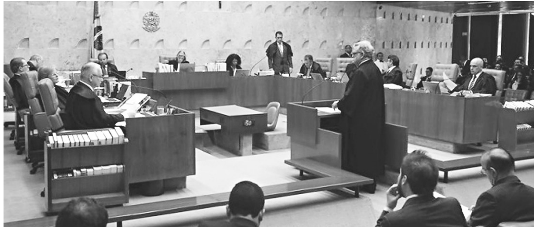
// Supremo Tribunal Federal vota contra a suspensão da denúncia apresentada pela PGR contra Temer

O ministro Luís Roberto Barroso concordou. “A denúncia se submete a prévio juízo político por parte da Câmara dos Deputados e não há, por-