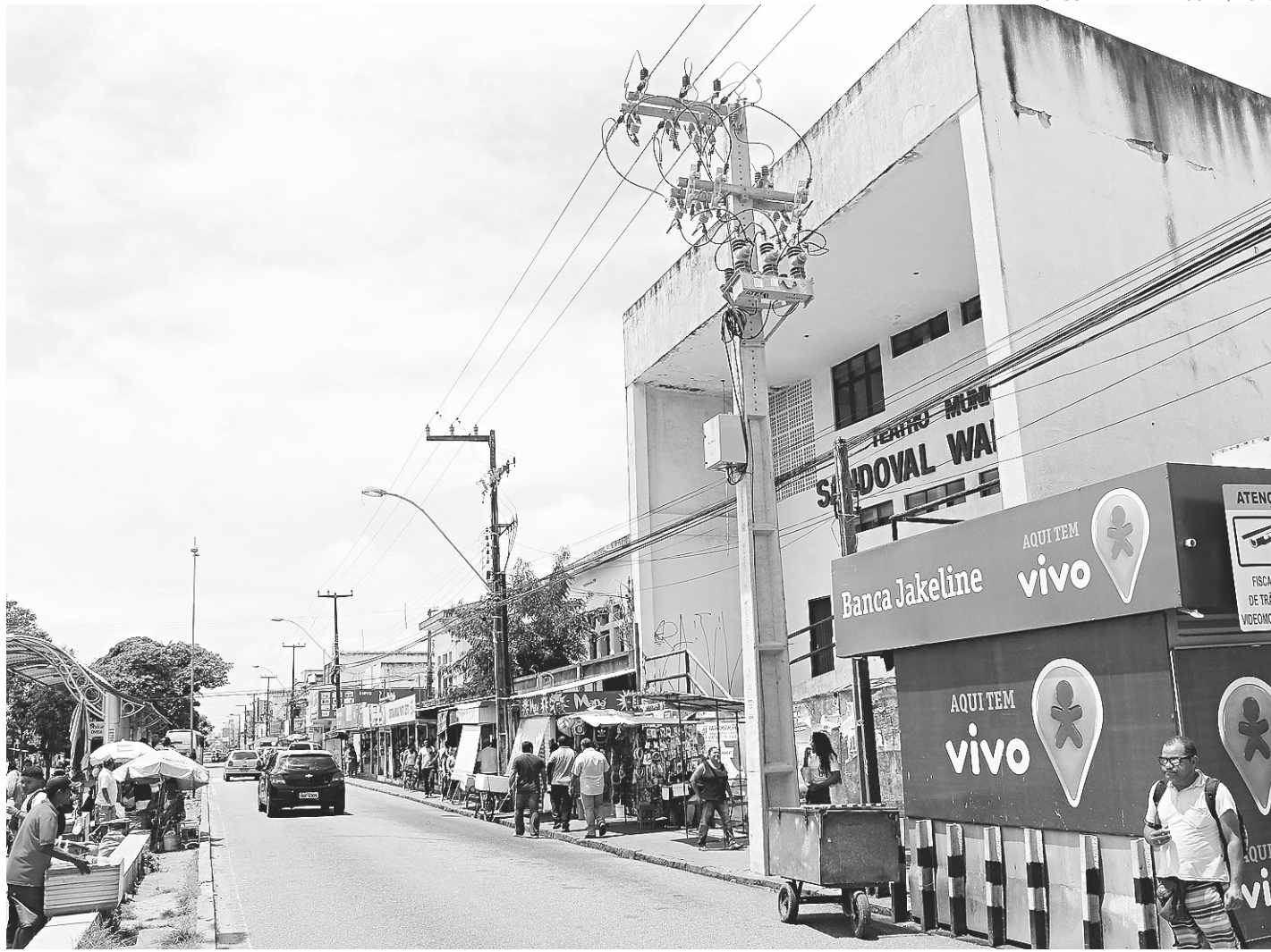
// Camelôs da avenida Presidente Bandeira devem ser removidos das calçadas; grupo mostra intenção de transformar teatro em micro-shopping

Desde que foi anunciado, os ambulantes que hoje ocupam as calçadas do Alecrim oferecem resistência. Na se-