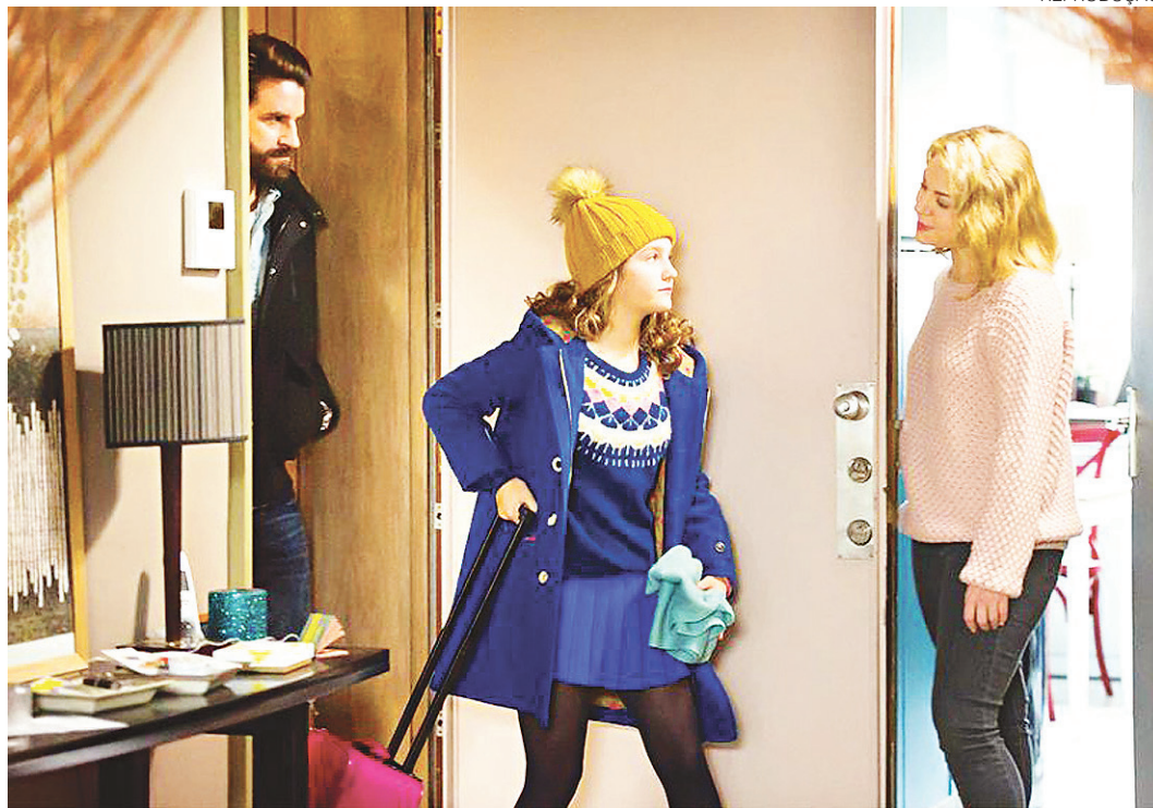
// Em A Garota do Armários, as mulheres são competitivas e repetem a trajetória de erros dos homens