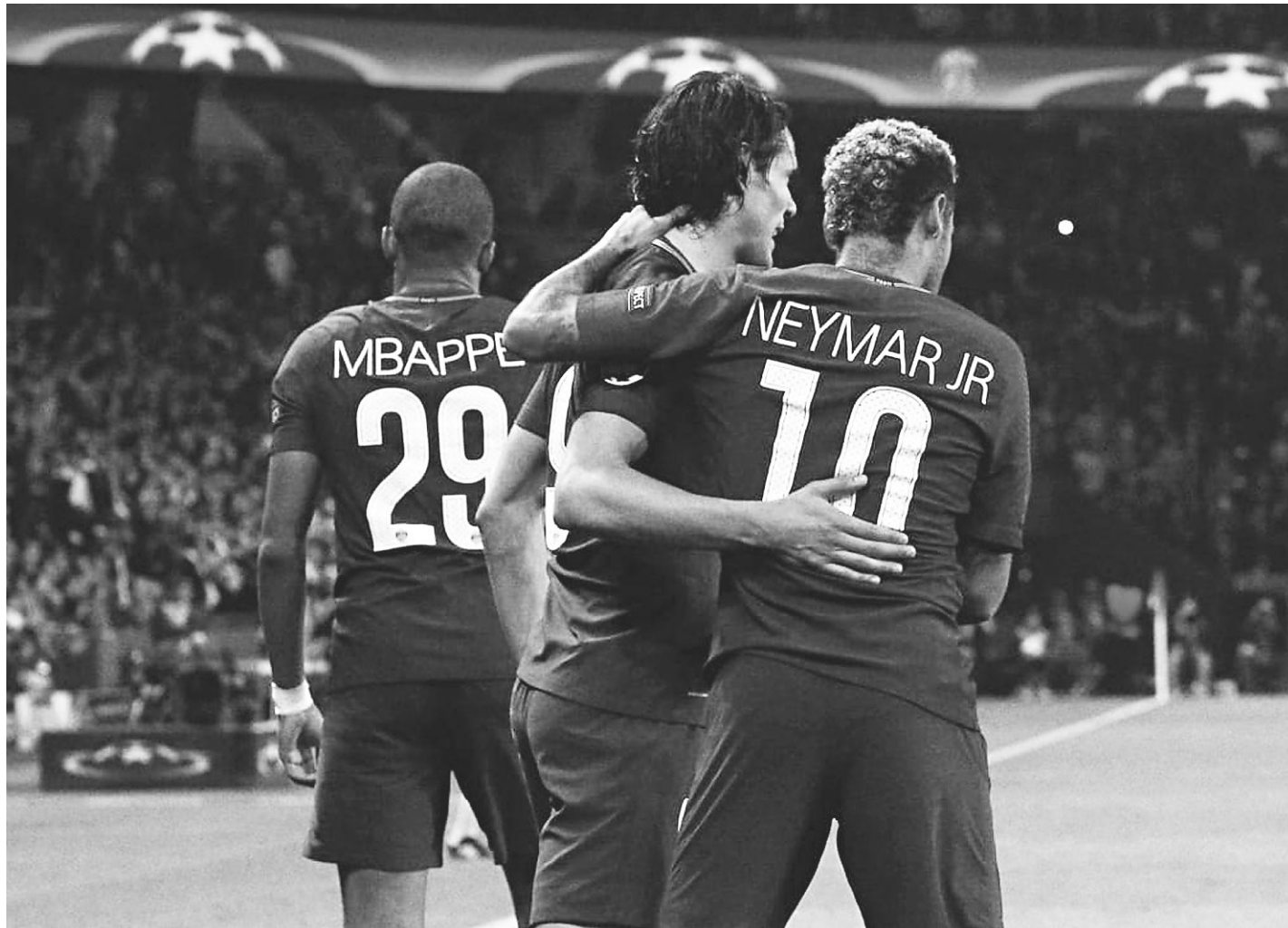
// Trio MCN (Mbappé, Cavani e Neymar) fez atuação impecável diante dos alemães e mostrou entrosamento do time francês

O resultado deixou o PSG em situação confortável na tabela, com seis pontos após duas partidas, na liderança do Grupo B, enquanto o Bayern permaneceu com três, em segundo. Também com três pontos está o Celtic, que viajou à Bélgica e conseguiu uma boa vitória por 3 a 0 sobre o Anderlecht, lanterna da chave sem nenhum ponto.