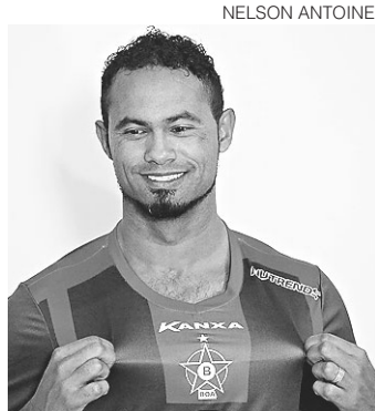
// Goleiro foi condenado pela morte de Eliza Samúdio