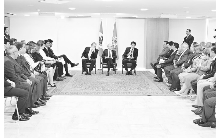
// Governador, políticos e salineiros na audiência com Temer

"A edição desse decreto é fundamental para dar segurança jurídica à atividade salineira, que não conta com legislação específica, deixando a atividade submissa a