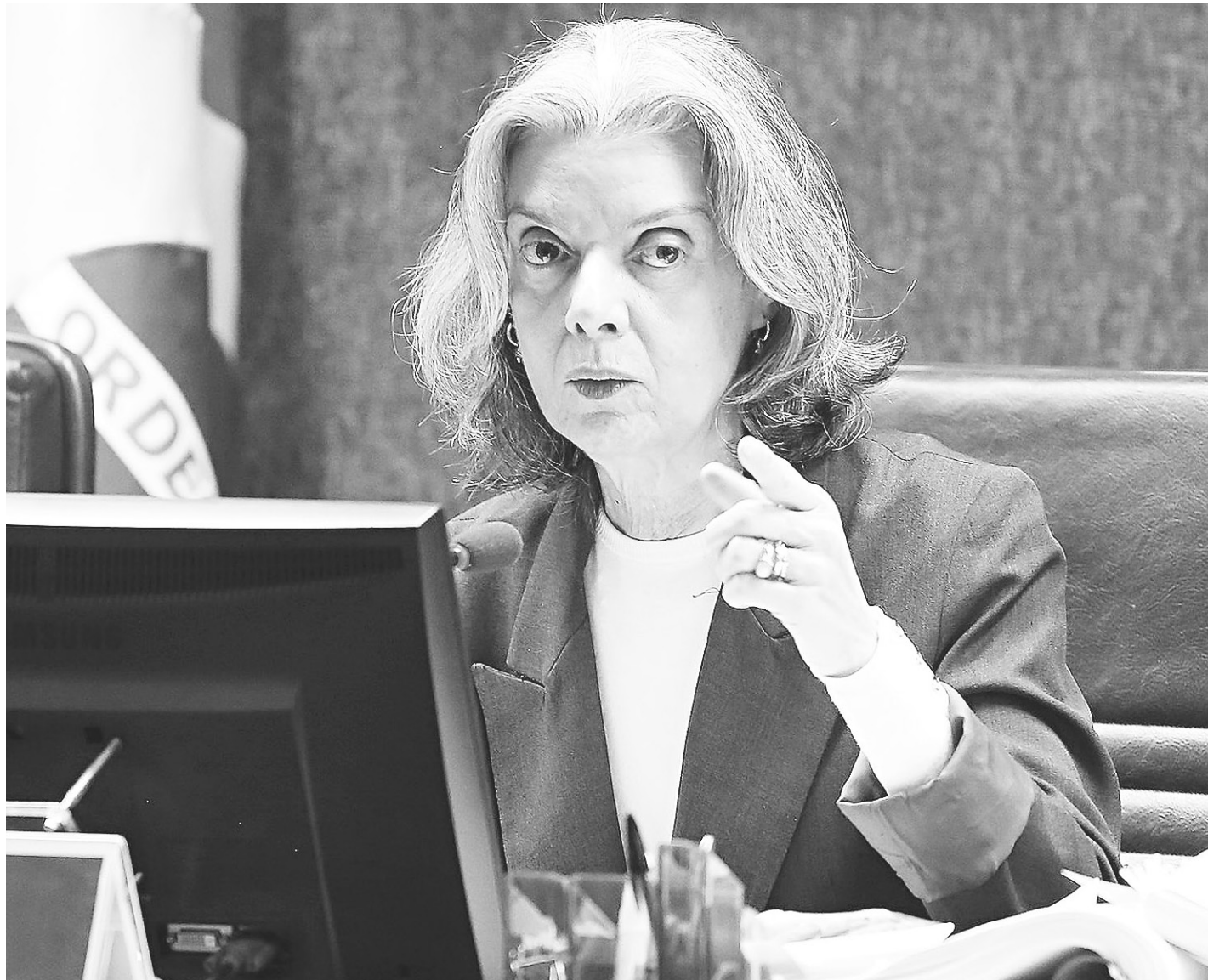
// Ministra Cármen Lúcia, presidente do Supremo Tribunal Federal: "Pode-se ter conteúdo confessional em matérias não obrigatórias nas escolas"

"Não vejo como se opor à laicidade a opção do legislador e não vejo contrariedade aqui que pudesse me levar a considerar inconstitucionais as normas questionadas", disse a presidente do STF, ministra Cármen Lúcia, que desempatou o julgamento e definiu o resultado. "Não vejo submissão do Estado à submissão de religião na norma. A pluralidade de crenças, a tolerância - que é princípio da Constituição Federal - combina-se com os dispositivos aqui atacados. Pode-se ter conteúdo confessional em ma-