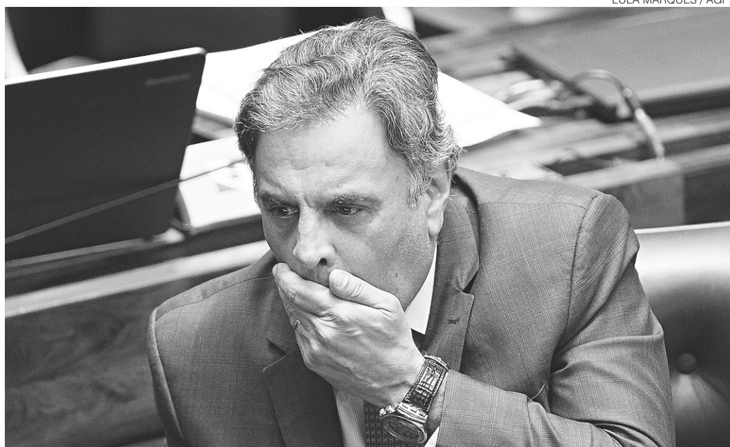
// Senador Aécio Neves reclama que afastamento é uma condenação sem processo judicial

A defesa contra a interferência do Judiciário no Legislativo estava sendo preparada em nota pelo PT. A legenda critica a "hipertrofia" da Justiça e diz que o Congresso precisa defender sua autonomia, sob pena de fragilizar as instituições forjadas no voto popular, informa Julia Chaib. O texto traz duras críticas a Aécio, chamando-o de "hipócrita" e falso moralista. Também na nota, o partido de Lula diz que