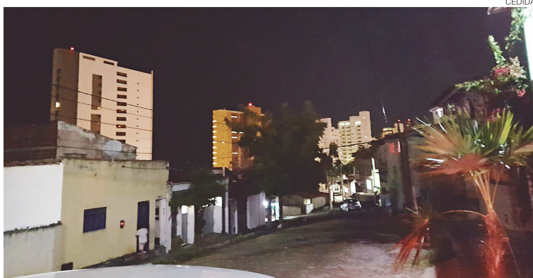
// Pessoas estão direcionando lâmpadas caseiras para a rua a fim de diminuir escuridão no local

O leitor também reclama que o número disponibilizado pela prefeitura não funciona como deveria. "Quando o telefone não está ocupado, ninguém atende e quando tenho a sorte de alguém atender, de nada adianta, pois o problema não é senado. Esse serviço deveria ser responsabilidade da Cosern," disse.