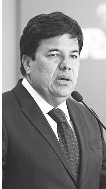
// Mendonça Filho, ministro da Educação: mais segurança

"A gente sabe que, infelizmente, um dos métodos mais utilizados em concursos públicos e na aplicação do Enem é o de pontos eletrônicos. Se a gente tem hoje um equipamento que pode detectar o uso desse tipo de equipamento, a gente vai inibir e, evidentemente, combater esse tipo de fraude", disse o ministro durante o Encontro Nacional para Alinhamento Operacional do Enem realizado no 4º Batalhão de Infantaria Leve do Exército Brasileiro, em Osasco (Grande São Paulo). O sistema encontra o aparelho de transmissão pelo sinal de rede móvel de banda larga, por radiofre-