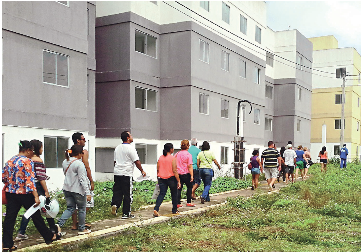
// Dados da Associação Nacional de Crédito Imobiliário mostram que em 2016 os financiamentos imobiliários chegaram a R$ 46,6 bilhões

Os depósitos nas cadernetas em dezembro de 2016 superaram os saques em R$ 9 bilhões com relação ao mesmo mês de 2015, quando o balanço entre depósitos e retirada havia sido positivo em R$