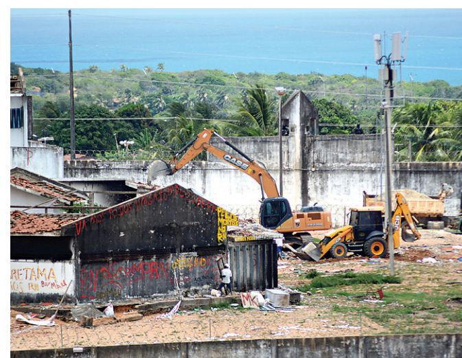
// Operação também serviu para retirar entulhos da unidade

O governo está, desde então, autorizado a fazer a contratação, mediante processo seletivo simplificado, que poderá exigir exame físico, psicológico e investigação social, como determina o Parágrafo 1º do Artigo 1º da matéria. Segundo o Artigo 3, os candidatos selecionados seriam submetidos a treinamento profissional antes de assumirem as funções nas unidades.