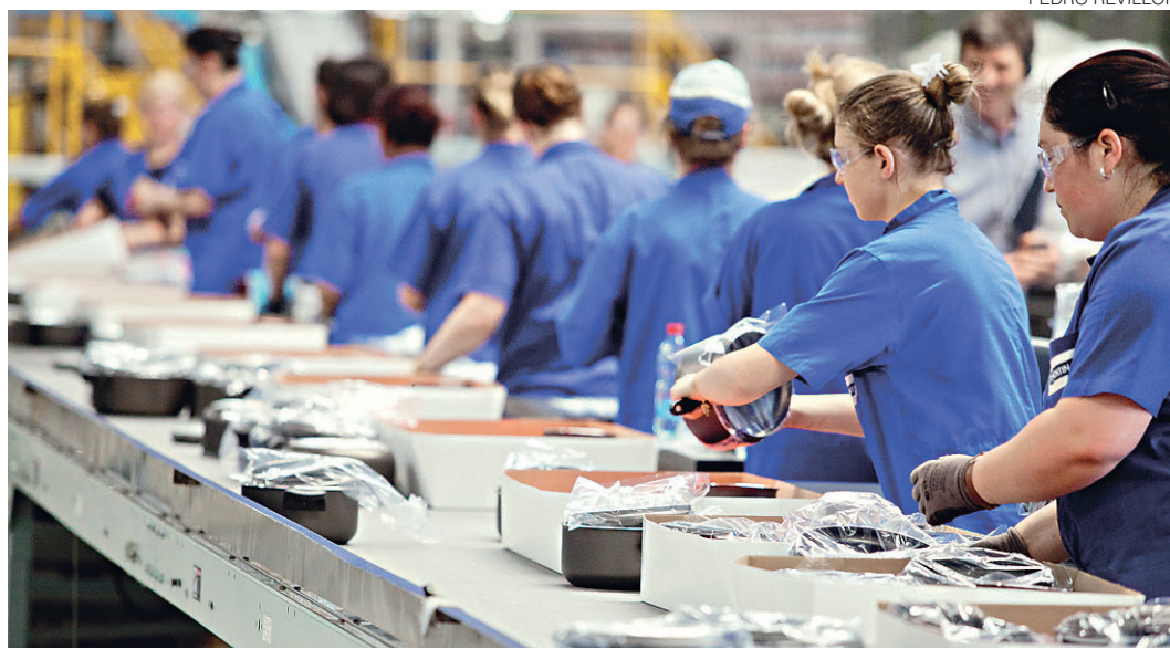
// Sondagem da Confederação Nacional da Indústria mostra aumento da confiança do setor na economia

A Pesquisa de Endividamento e Inadimplência do Consumidor de 2016 constatou uma piora na percepção das famílias em relação ao seu nível de endividamento, embora a parcela média da renda mensal comprometida com o pagamento de dí-