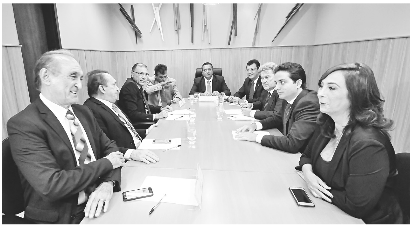
// Líderes da bancada da Assembleia Legislativa se encontraram na sala de reuniões no Palácio José Augusto

O estado tem um concurso realizado em 2015, que está suspenso, por decisão do Tribunal de Contas do Estado. Concurso suspenso. O governo aguarda um parecer do relator, conselheiro Paulo Roberto Alves, ainda nesta semana, após ter prestado vários esclarecimentos a respeito das convocações.