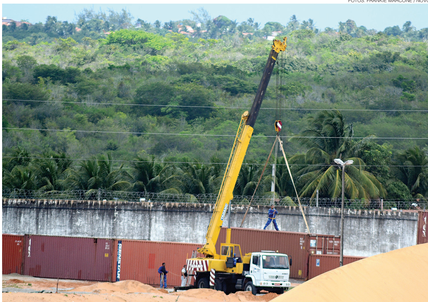
// Forças de segurança concluíram ontem a colocação de contêineres para isolar o Pavilhão 5, que abriga detentos filiados ao PCC

Ontem à tarde, segundo informações da assessoria do