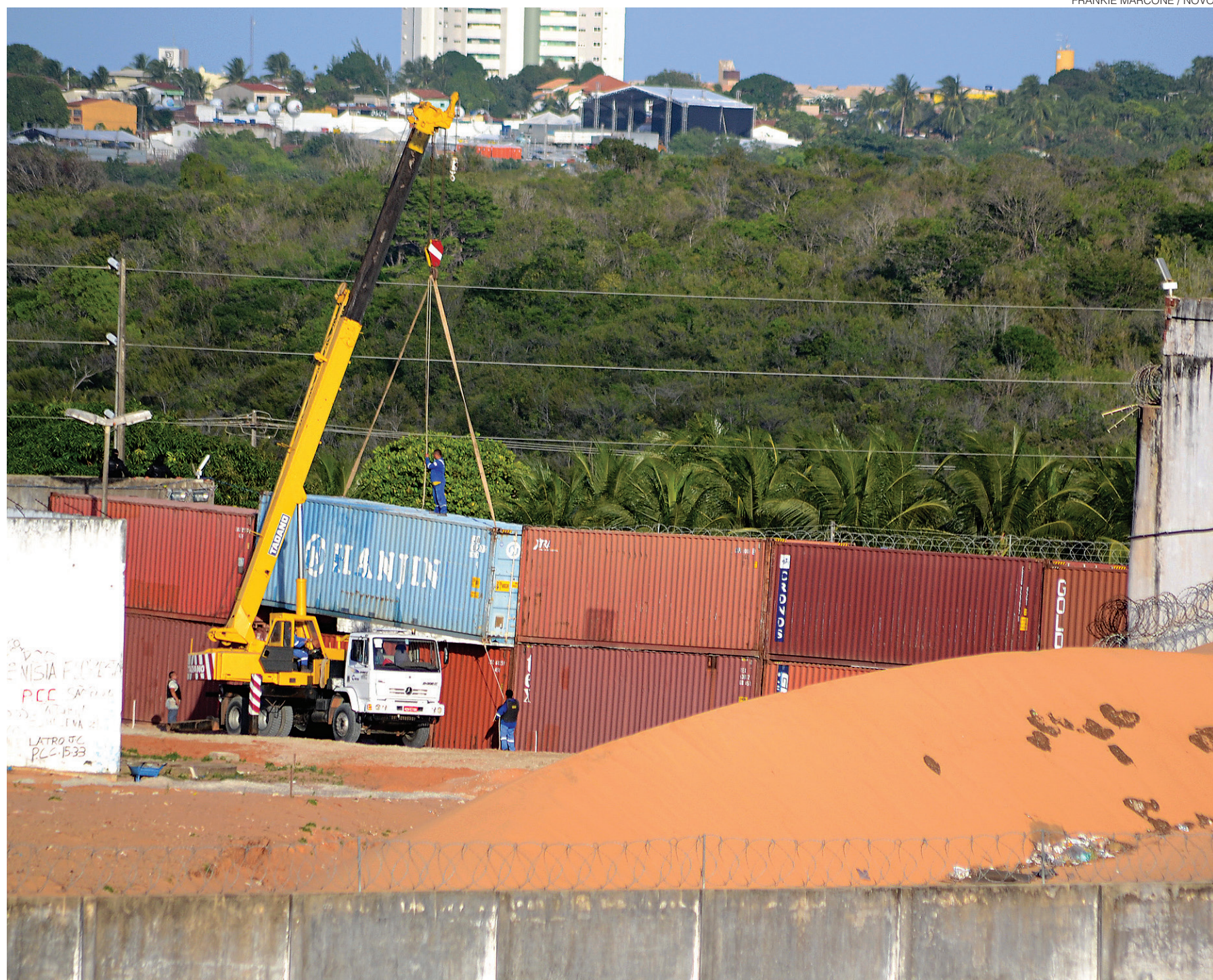
// Pela parte da tarde, a muralha de contêineres foi concluída e agora isola os pavilhões 4 e 5 do restante do presídio; construção do muro de concreto deve levar 15 dias