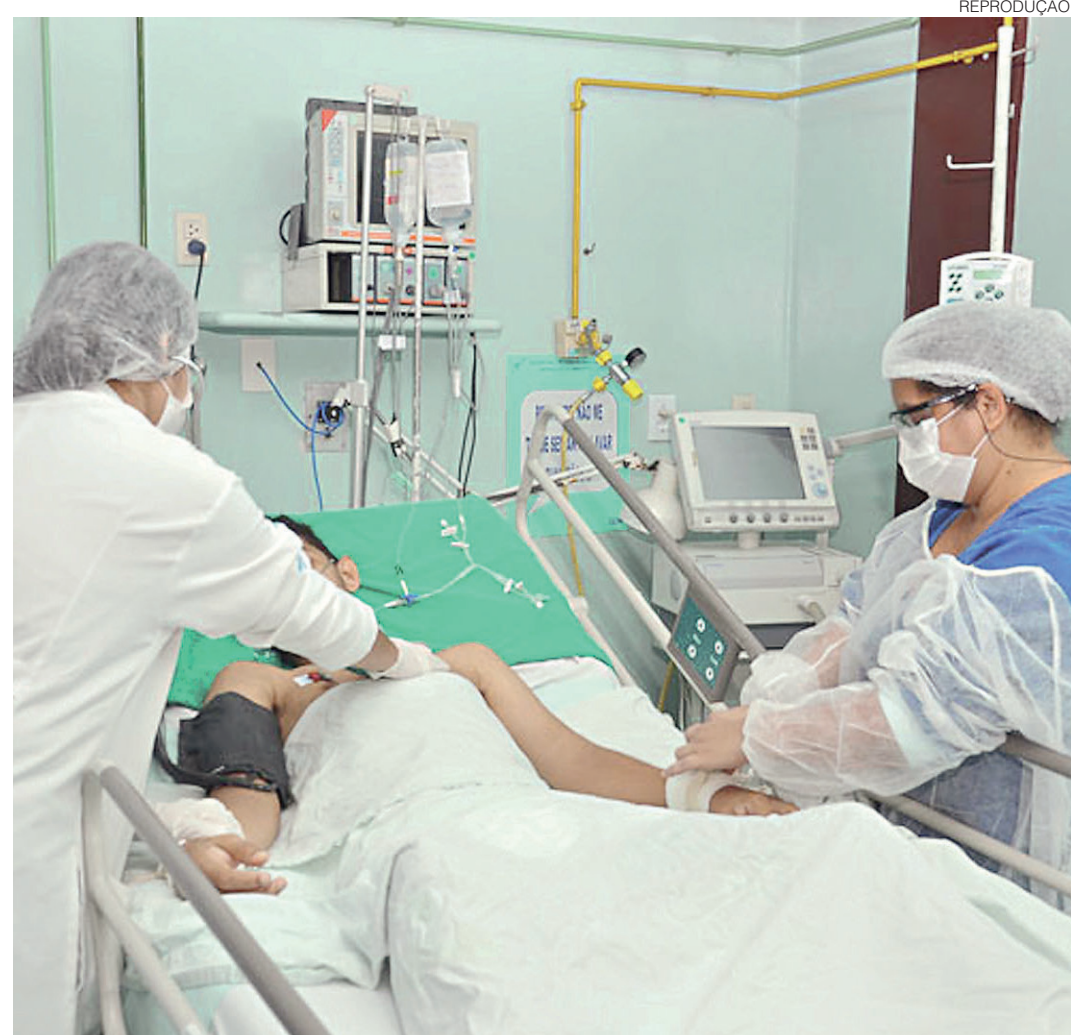
// No Rio Grande do Norte, 24.943 beneficiários saíram dos planos de saúde médico-hospitalar em 2016

A região Sul do País encerrou 2016 com 95,85 mil beneficiários de planos médico-hospitalares a menos do que começou o ano. No Centro-Oeste, 42,6 mil beneficiários deixaram seus planos, sendo 16 mil em Mato Grosso e 13,5 mil em Brasília. No Nordeste, foram 103,9 mil vínculos rompidos, 39,6 mil apenas na Bahia.