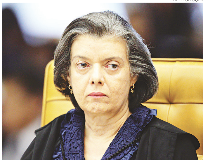
// Cármem Lúcia, presidente do Supremo Tribunal Federal

Há uma grande expectativa da sociedade e, principalmente, da classe política em relação às delações de executivos da Odebrecht, pois segundo informações vazadas anteriormente, dezenas de políticos em exercício são citados como envolvidos no