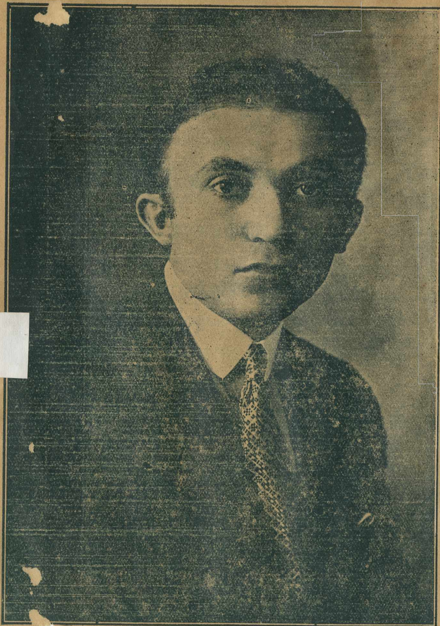
Studio Bertin — PARIS