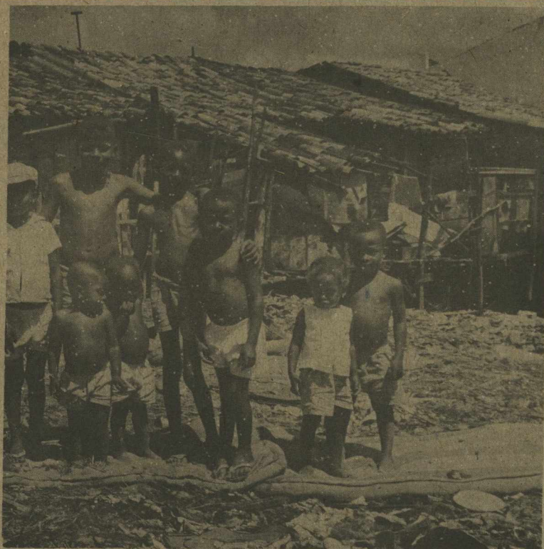
FOTO: Ocupação de alagados no Recife