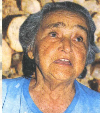
Mãe de Lourdes Dantas