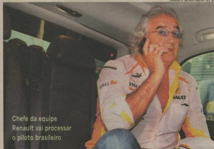
Chefe da equipe Renault vai processar o piloto brasileiro