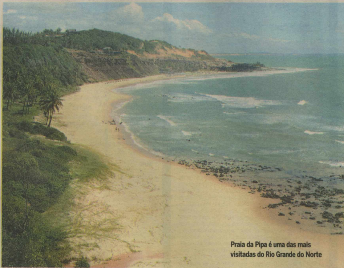
Praia da Pipa é uma das mais visitadas do Rio Grande do Norte

Tanto Meira Lins quanto Costa Filho afirmam que pouco mais da metade do fluxo de turistas de Pernambuco é do próprio Nordeste, especialmente dos es-