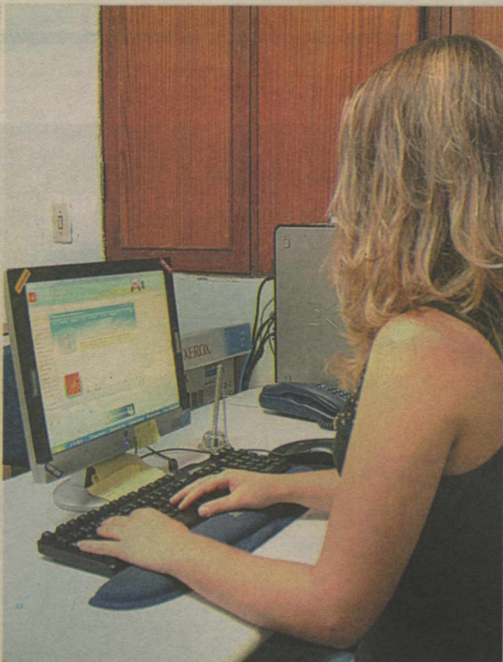
Sofia traumatizou-se após ser iludida por namorado que conheceu pela internet