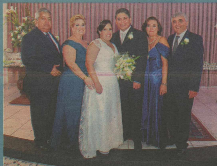
Os noivos e os familiares