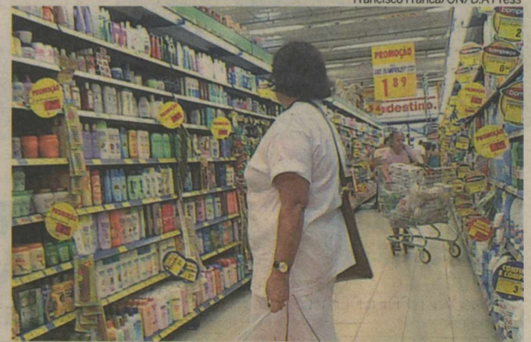
Pesquisa: diferença entre o valor mais alto e o mais baixo chega a R$ 93

(14,6%), água sanitária (13,6%), café moído (9,8%) e creme dental de 50g (9,3%). Já os legumes, frutas e verduras caíram, em média, 3,25%. Também ficaram mais baratos o repolho branco (caiu 22,6%), banana pacovã (-11,4%), tomate (-9,4%) e jerimum leite (-9,3%). De acordo com o Procon, a cesta básica mais barata, era a do supermercado Servebem – Cidade da Esperança (R$ 287,10), seguido pelas três lojas do Nordeste (Salgado Filho, Cidade Jardim e Zona Norte). A diferença entre o maior e o menor custo da cesta bá-