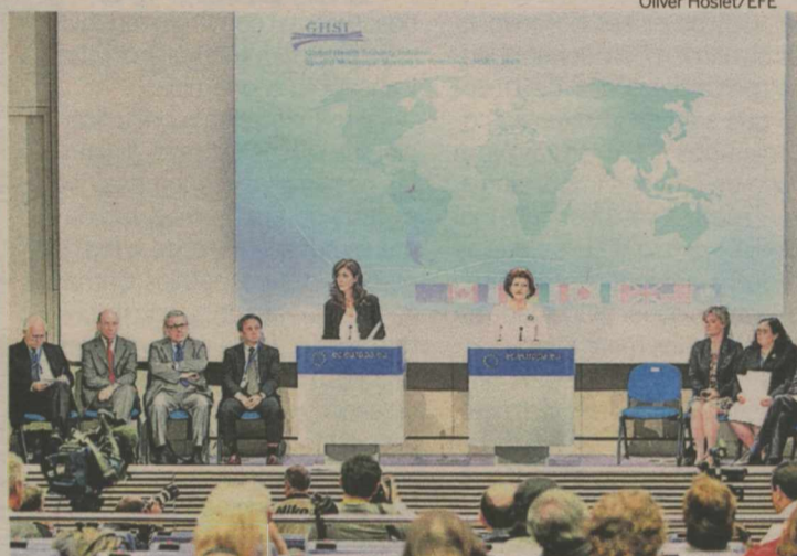
Reunião em Bruxelas traçou um panorama atual da pandemia de gripe A

(CE) não tenha fixado uma data para autorizar a nova vacina, o andamento deve ser completado até o final de outubro e o início de novembro. Paralelo ao desenvolvimento da imunização, deve ser mantida a vacinação contra a gripe comum e as medidas para tornarem a doença cada vez mais branda, como hábitos de higiene pessoal ou a adaptação dos sistemas sanitários a um eventual aumento da demanda por terapia intensiva.